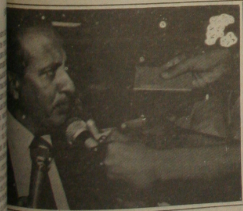
Valadares garante pagar salários este ano.

Valadares lembrou que Sergipe é um dos poucos Estados onde os salários estão sendo pagos em dia. (Página - 3)