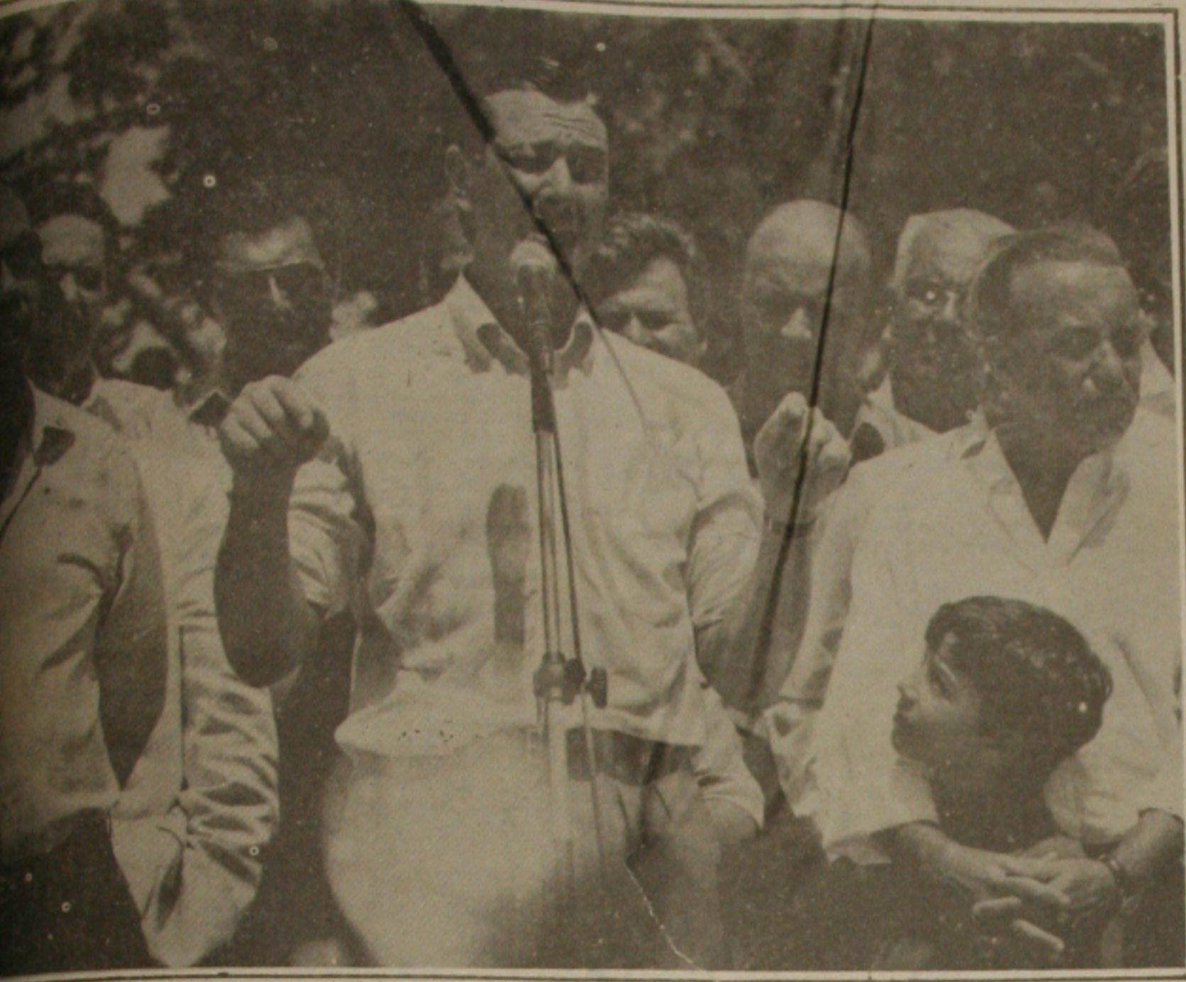
Governadores João Alves e Valadares, Collor reafirmou o seu propósito de trabalhar pelo progresso de Sergipe.