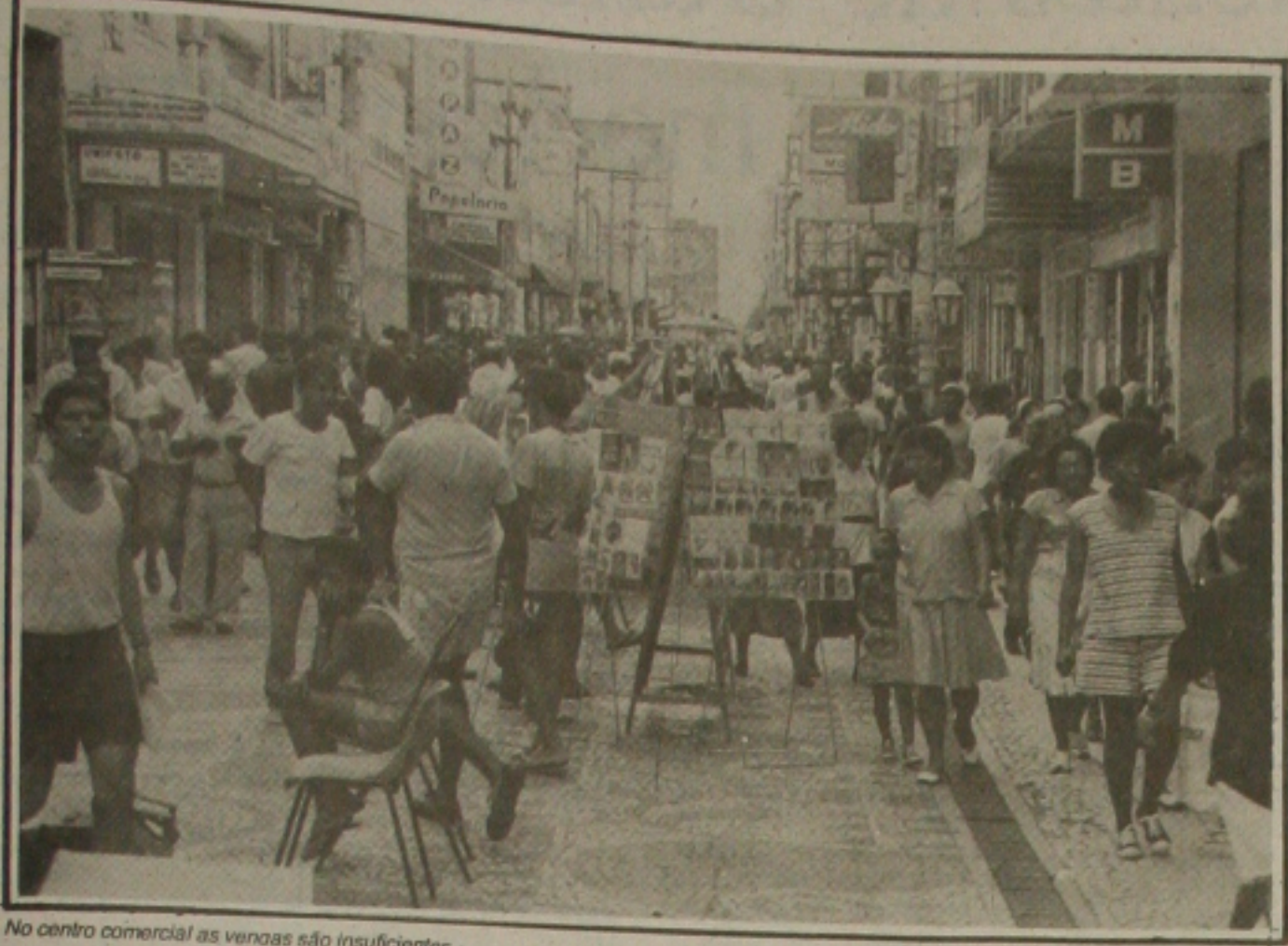
No centro comercial as vendas são insuficientes

tem, que dezenas dias estão em ex- serem leiloados, Penhor da Caixa Federal, situado na Rua João Pessoa, 100, São lotes colares, pulseiras, anéis, alianças, pin- os em ouro, além preciosas dos mais os de valores e te- nize mínimo Cr$ 2 mil e Cr$ 140 mil. O leilão no próximo sábado, com início às 10:30 h, no andar, no endereço 100, uma pessoa capaz de pagar do ato, bastan- Cédula de Identi- de arremate de O pagamento em espécie ou cheque. econômica informa os de pagamento através de cheque traques os objetos até 24 horas data da emissão, ement, previsto que os valores em jam devidamente s. empenhados são do quando há inar- parte do deve- tempo hábil, não para sair o seu razo previsto em ludo com a CEF é cujo descumprimento à instituição os objetos dados a fim de que seja vida. De acordo sentença da este interesse al- da empresa que a sejam levados a