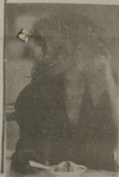
O sonho da gatinha é ser a Madonna do ano 2 000