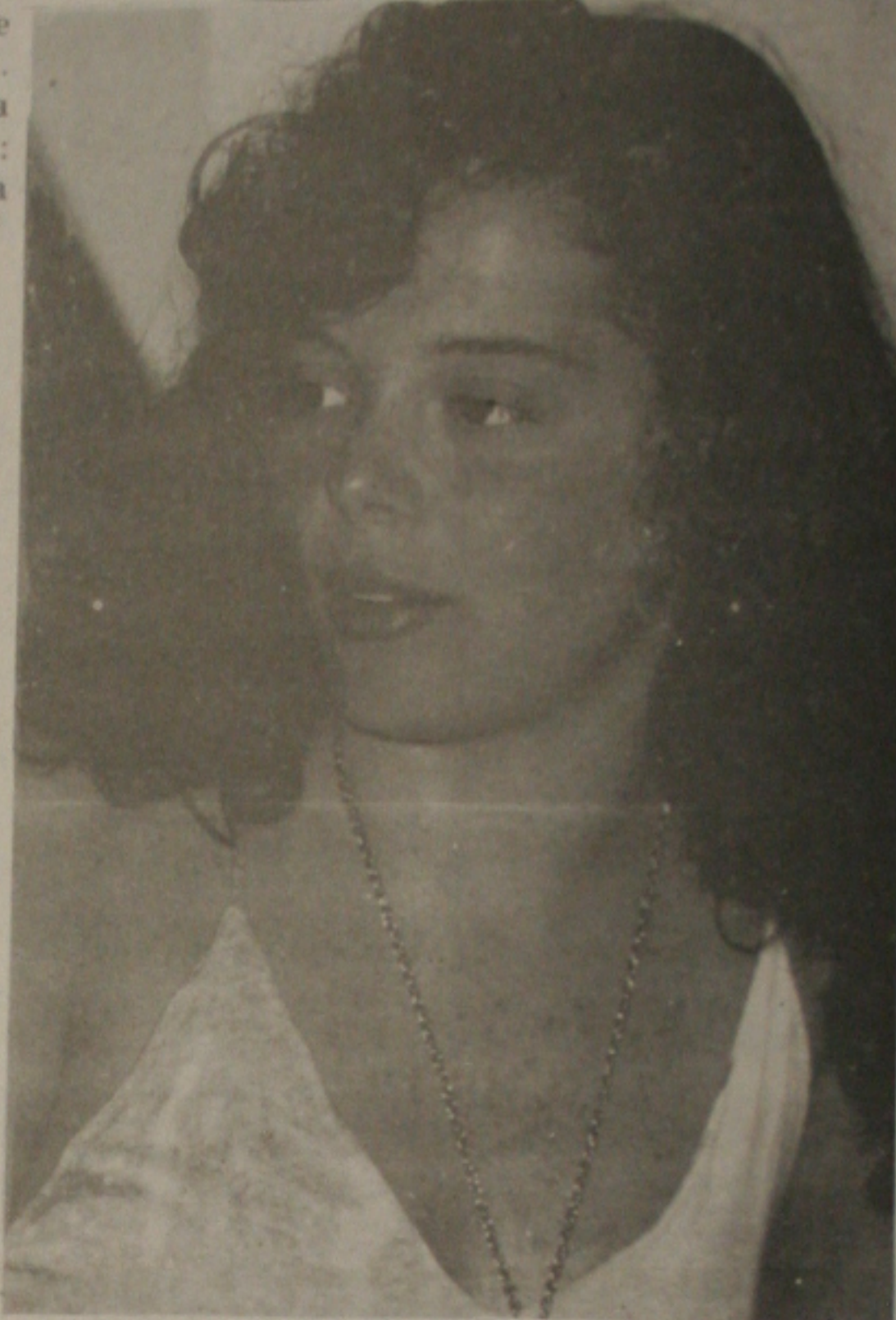
A atriz não quer seu rosto incluído entre tantos outros que vêm e que passam