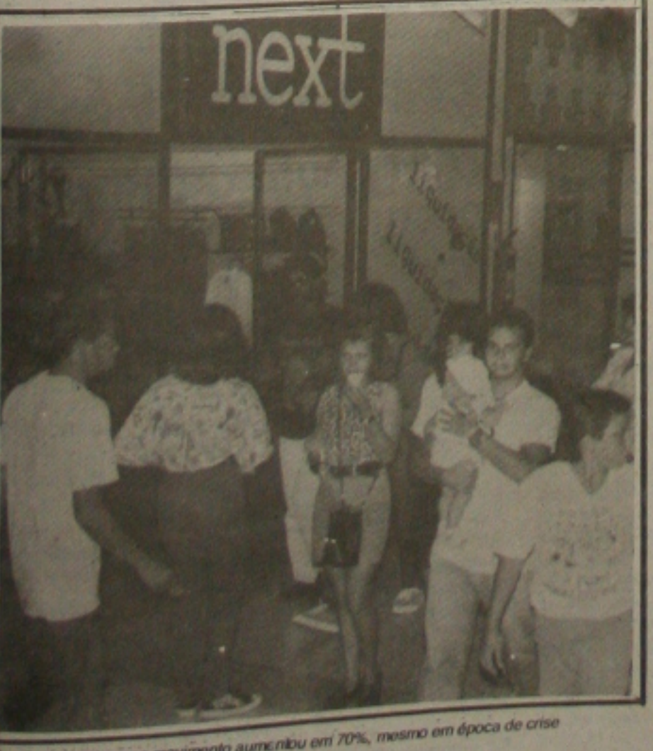
No shopping Riomar o movimento aumentou em 70%, mesmo em época de crise

mil cruzeiros, por um cupom e aguarde o sorteio pela Loteria Federal do próximo dia 5 de janeiro. Fez questão de ressaltar que consta nos prêmios um televisor, colarido, vídeo cassete, geladeira, fogão, máquina de lavar, ventilador, bicicleta; roupas, calçados, brinquedos, corte de cabelo por um ano, lanches a ser feito uma vez por semana durante um ano em uma das lanchonetes do Shopping entre outros. Finalizando, o gerente geral informou que com a promoção que o Shopping vem realizando e ainda com o clima de Natal que tomará conta dos aracajuanos nos próximos dias quando todos irão querer presentear parentes e amigos e ainda comprar suas roupas de final de ano e previsão é que a vendagem tenha um crescimento real de aproximadamente 80 por cento se comparado com dezembro do ano passado.