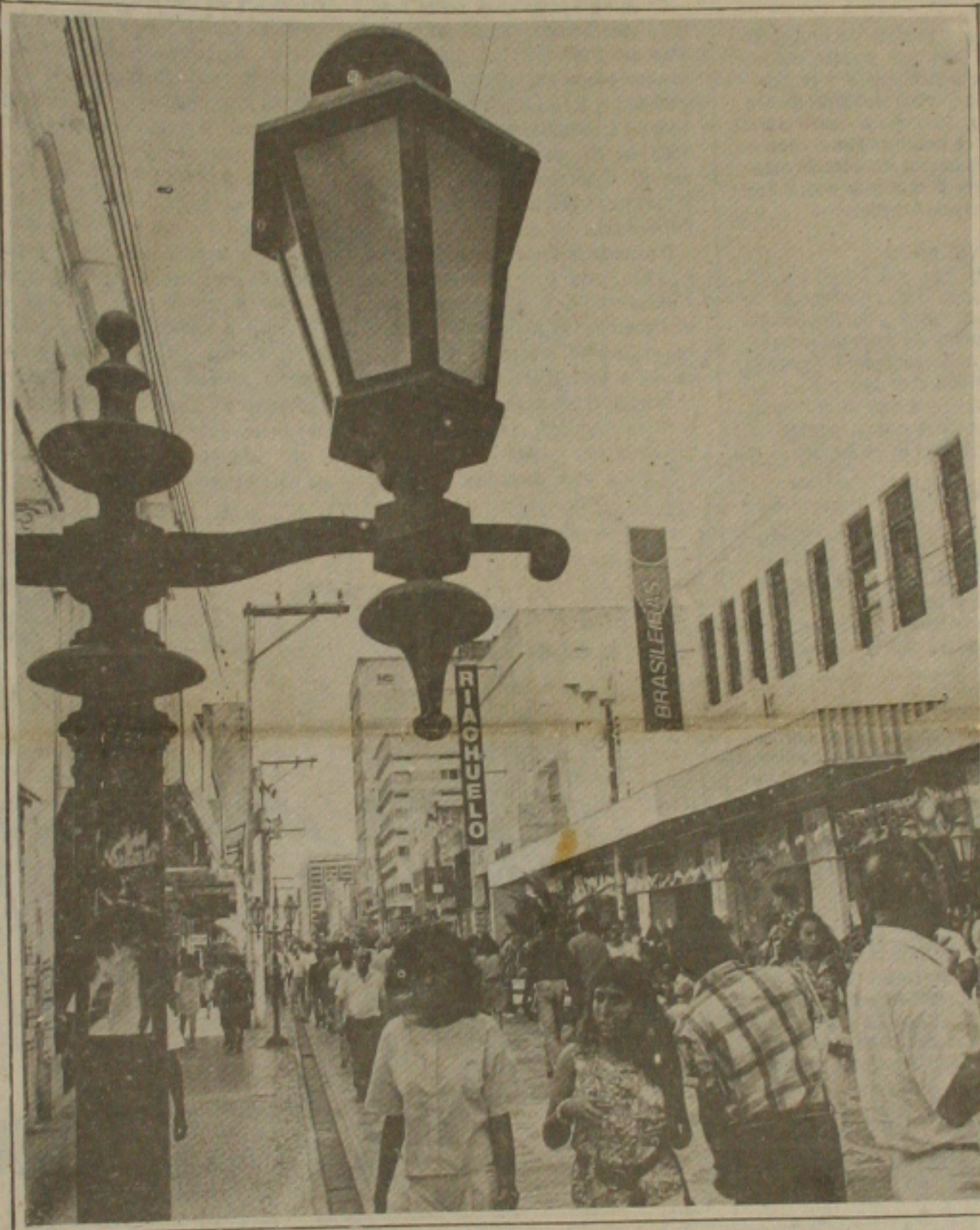
O movimento dos consumidores no centro comercial já evidencia a retomada das vendas com a proximidade do Natal.

Durante esse período, pelo menos, três vezes um soldado desmaiou por não resistir aos fortes exercícios, chegando a comunicar ao capitão Assis que ignorou o seu relato, justificando que isso fazia parte dos treinamentos da corporação da Polícia Militar.