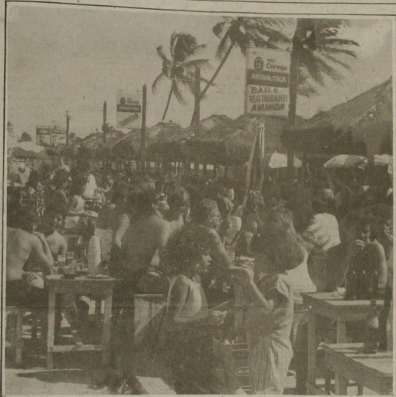
Consumidores podem solicitar a fiscalização da Secretaria da Saúde.

Com o convênio, a Prefeitura de Pirambu doará o espaço para a construção de uma central cabendo a Telserge acompanhar a realização de toda obra. Será a Prefeitura de Telergipe a dar a palavra final sobre a condição de construção da central em operação para atender a população através de telefones que se encontra pelo 101.