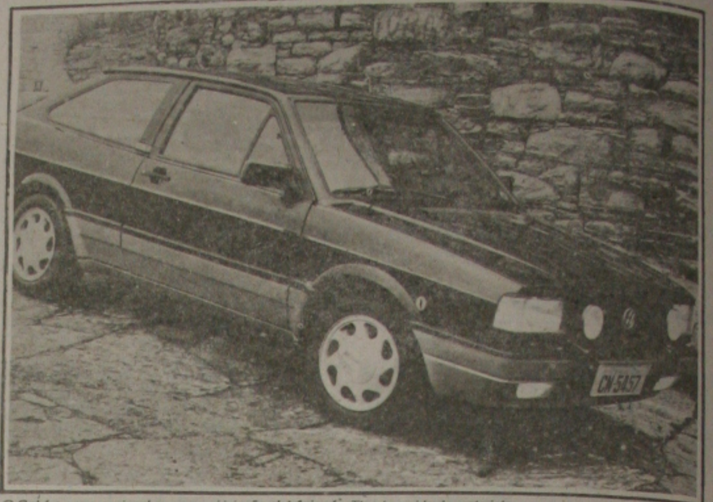
O Gol é o carro nacional que possui injeção eletrônica facilitando a vida do motorista.