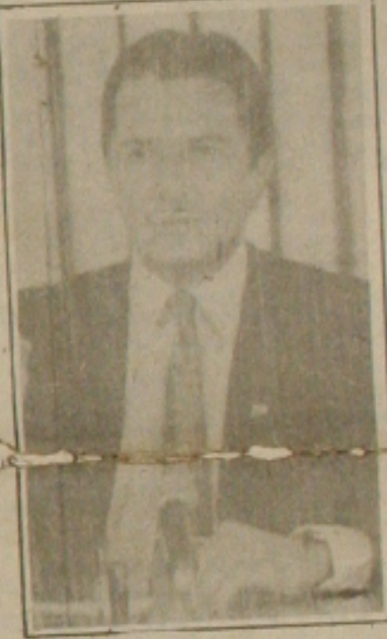
Collor: nova proposta de abono.