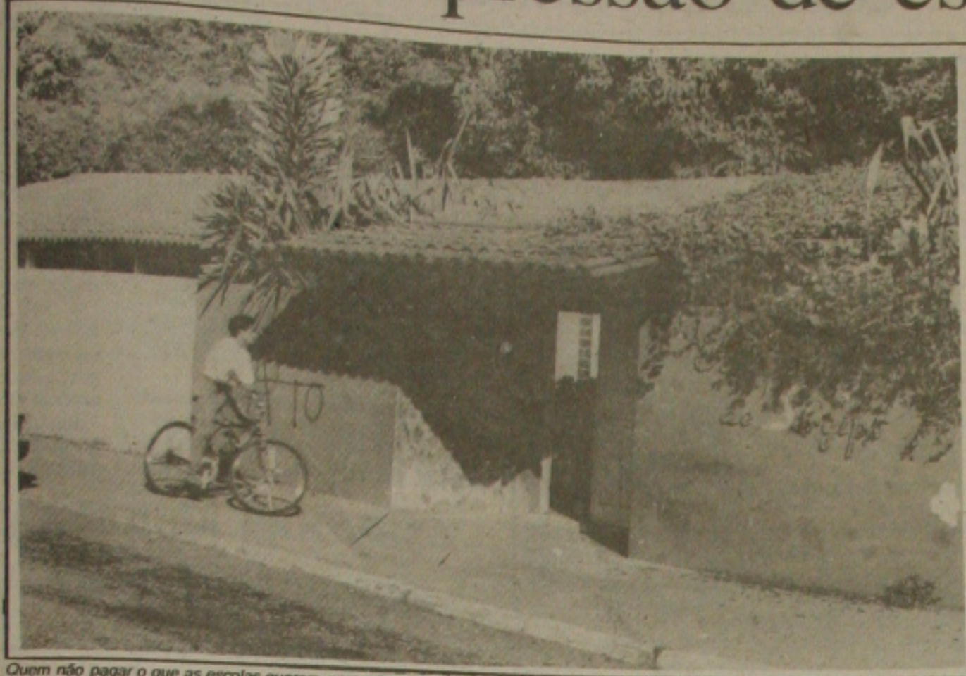
Quem não pagar o que as escolas querem, segundo os pais, vai ter que procurar outra opção para educar seus filhos.

Artistas já procura- as inscrições, no ressora Carmem oma que as inscri- continuarão abertas xima sexta-feira, de Cultart.