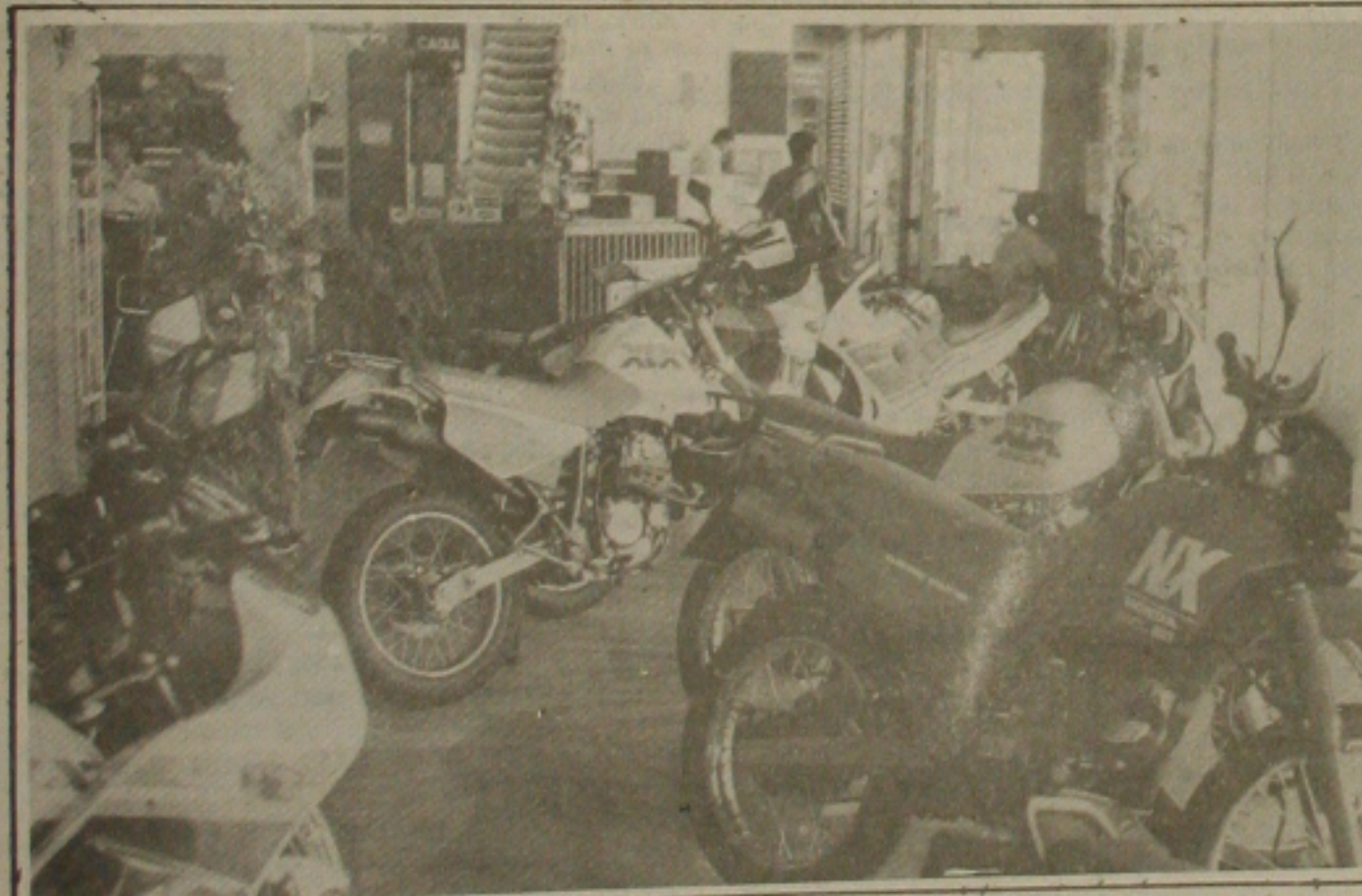
Moto tem, mas falta compradores, reclamam os comerciantes.

Os entrevistados revelaram que até o presente momento não há perspectiva de que a vendagem de motocicleta seja reaquecida. Para eles, somente haverá mudança no atual quadro quando for mudada a política financeira do Governo Collor de Mello.