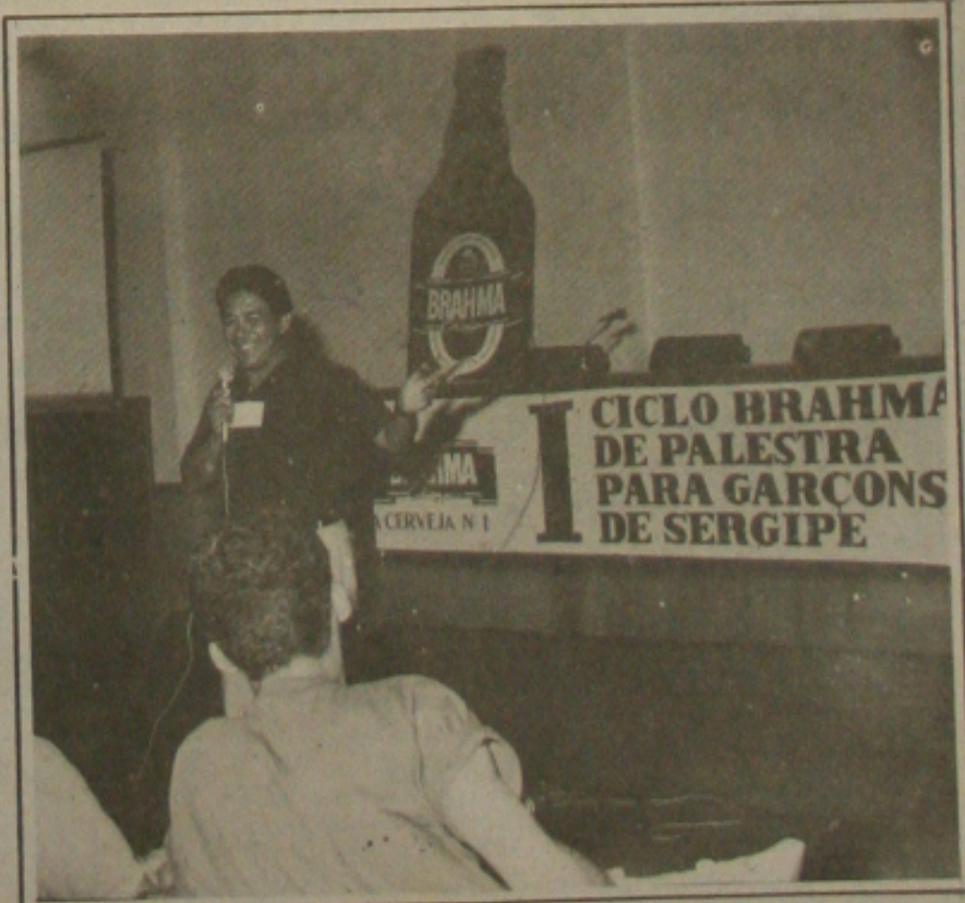
Garçons aprenderam mais sobre o exercício da profissão.

Em virtude do sucesso absoluto que está sendo o I Cipeg, a Brahma promete realizar no próximo ano outro evento com esse porte, por que acredita que pode dar sua contribuição decisiva na qualificação profissional dos garçons, afim de melhorar ainda mais o nível de atendimento em Aracaju.