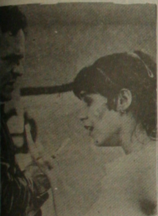
Lucélia Santos é Bonitinha Mais Ordinária, atração do programa Nacional desta quarta. Milton Moraes também participa.