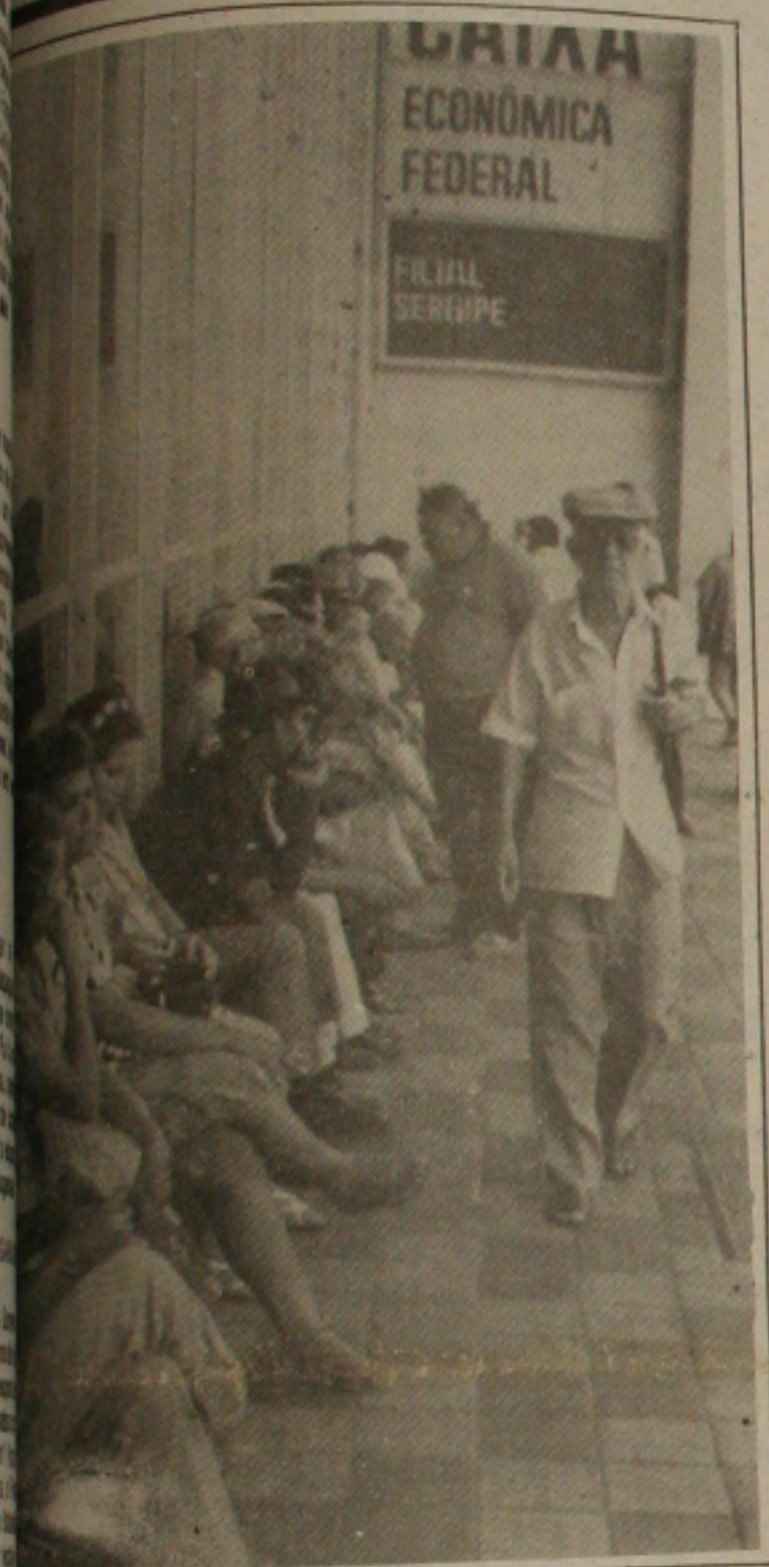
Em meio à liberação dos cruzados, os idosos amanheceram na porta da Caixa