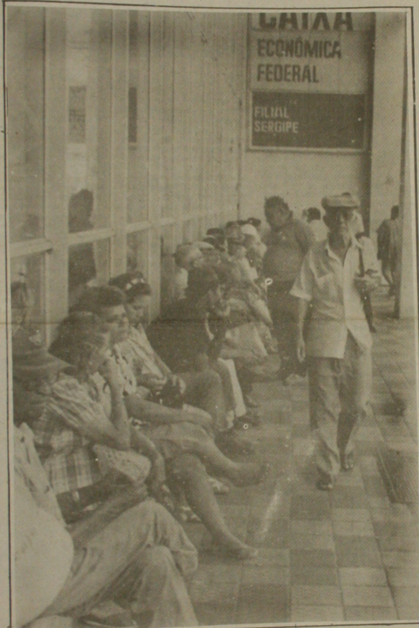
Aposentados com idade acima dos 65 anos formam extensa fila para retirar dinheiro na CEF.

A Prefeitura Municipal de Aracaju disponibiliza o acervo de fitas do Setor de Cinema e Vídeo da Secretaria Municipal de Cultura. A comunidade pode apreciar a sétima arte adquirida entre as dezenas de fitas de vídeo que documentam os trabalhos promovidos pela Prefeitura, desde a fundação da Secretaria de Cultura até a vida de artistas brasileiros.