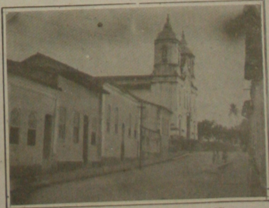
Laranjeiras tem programação alusiva às festas natalinas.