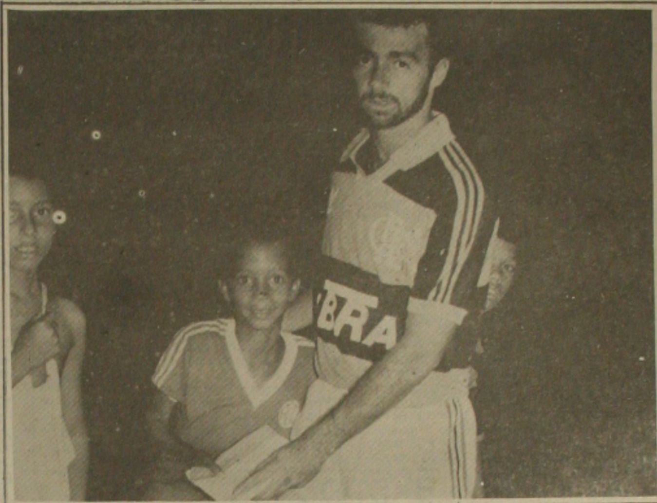
.... o atacante Bobô recebem o carinho dos torcedores