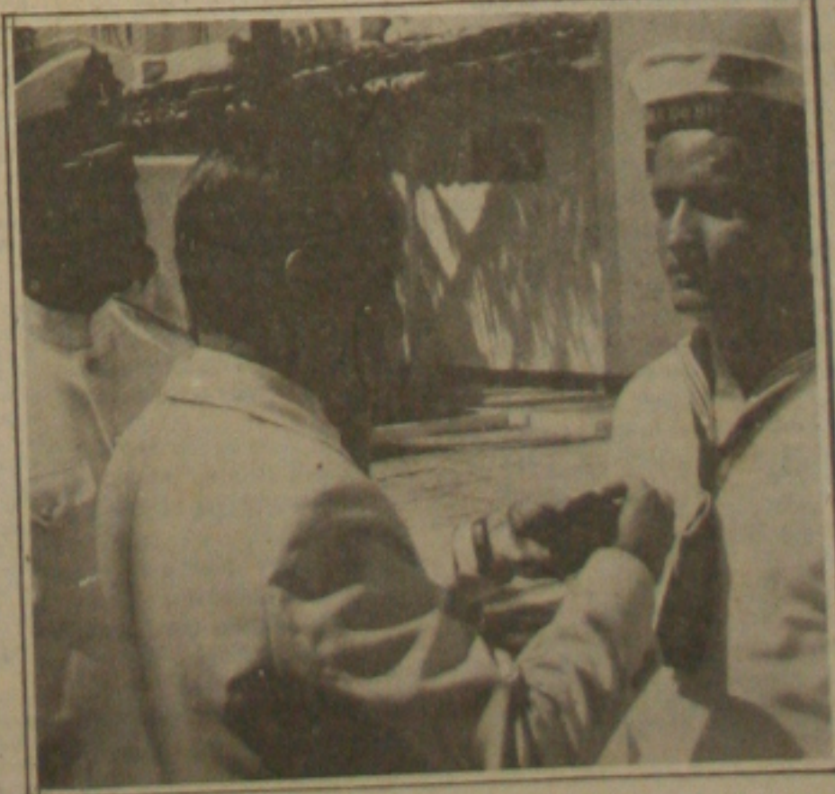
O governador Valadares presta homenagem aos marinheiros na Capitania dos Portos.

O conflito entre os pais das escolas e as escolas, por causa da queda dos valores das mensalidades escolares para o ano de 1991, é um assunto que preocupa toda a sociedade sergipana, e particularmente sergipanos, e os diretores das escolas particulares de ensino chega a nível, que a reestruturação da