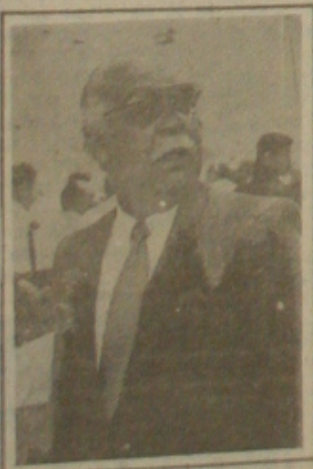
O prefeito quer que todos se juntem

Para nós da Marinha é um orgulho grande e estamos em festa em Sergipe, a Capitania dos Aracaju como órgão único no Estado, comemorando essa data. Fizemos uma semana de competições esportivas com futebol de salão, vôlei, basquete de praia (regata a vela) e uma regata com uma exposição de pintura no auditório.