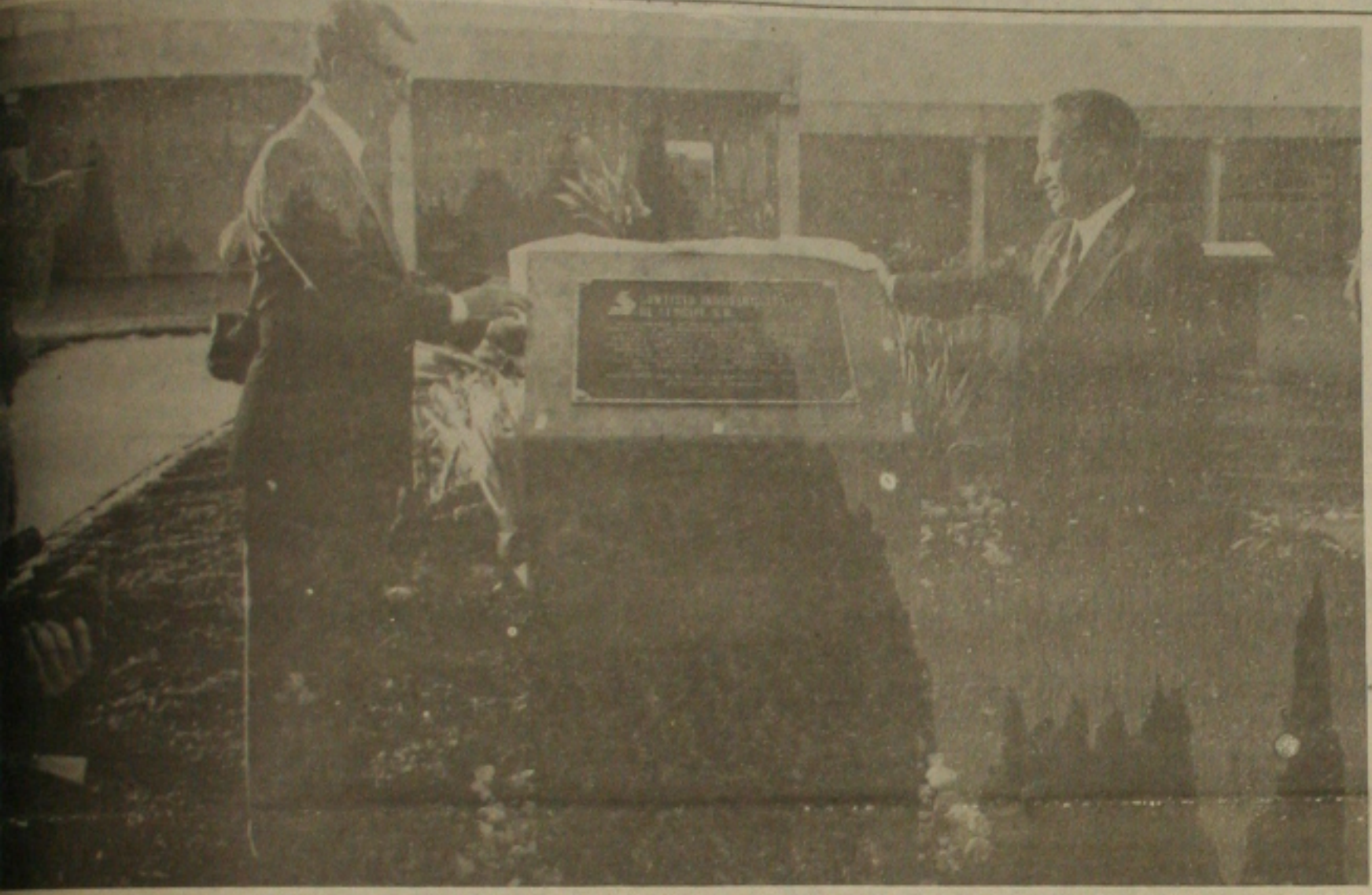
A Santista Indústria Têxtil concede férias coletivas aos operários da área de produção.