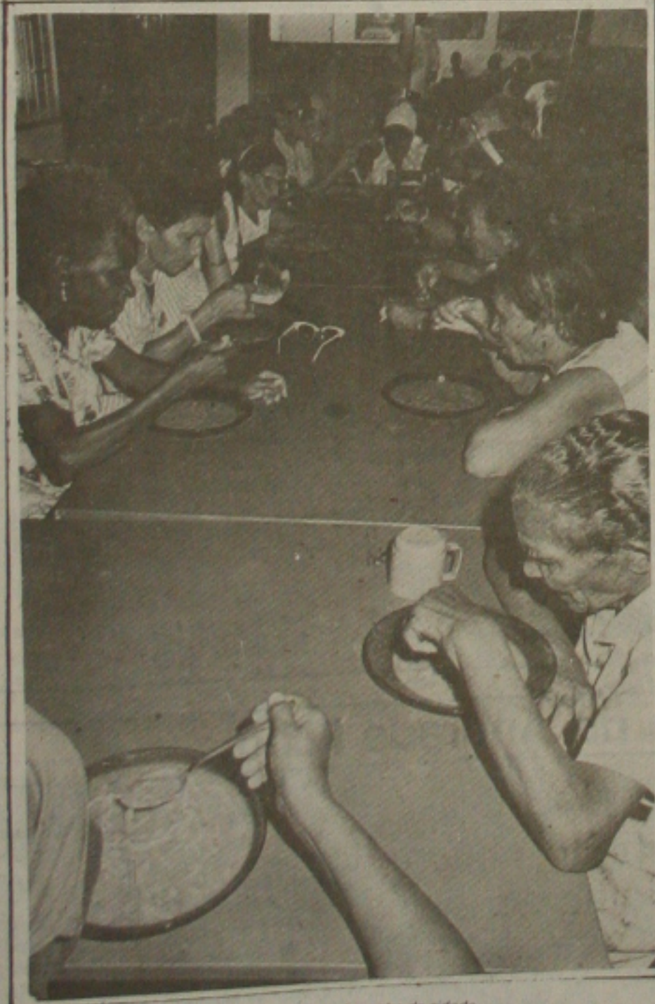
Sopão da LBA: o almoço dos trabalhadores do centro da cidade.

Os dias cerca de 210 professores da Legião Brasileira de Assistência, São os trabalhadores que desenvolvem atividades na área do centro da cidade. Participam do sopão da cidade, os garçons e as marceiras varrem aquela área da cidade. Os catadores, taxistas, ambulantes e até mendigos, que fazem a coleta de lixo e fazem a coleta de lixo fornecida pelo órgão de saneamento. (Página - 3-B).