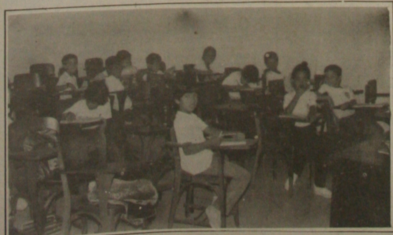
Pais de alunos defendem a criação de uma escola não lucrativa para que seus filhos possam estudar.