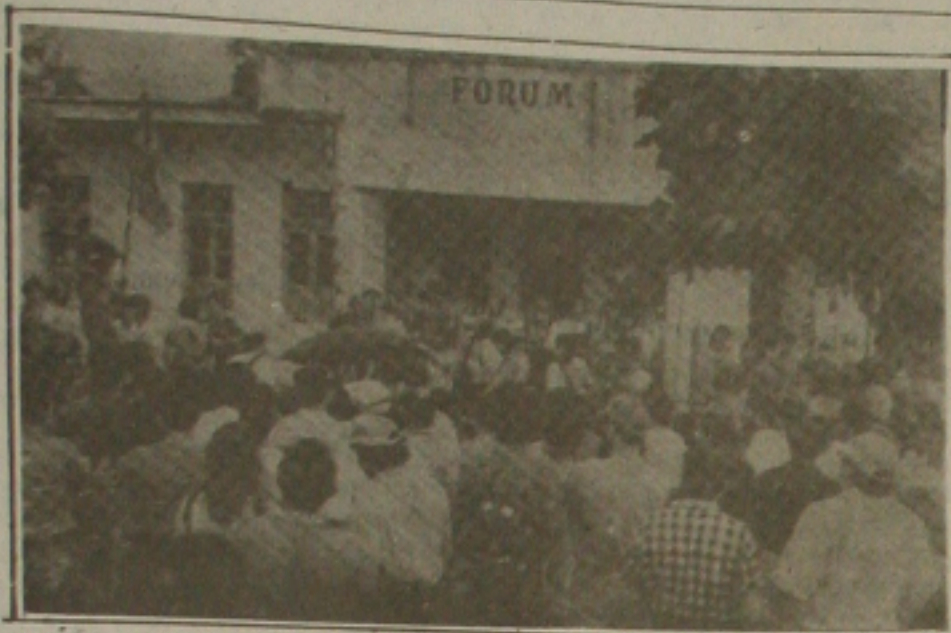
Até na porta do Fórum, centenas de pessoas acompanham o julgamento dos assassinos de Chico Mendes.