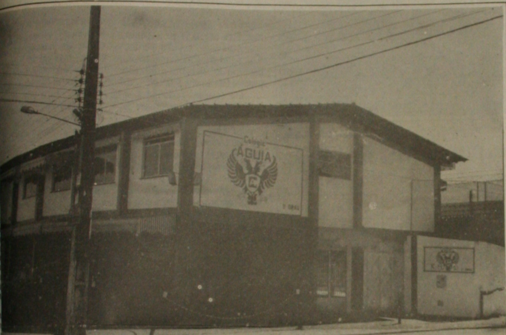
Águia quer reduzir o alunato em 1991.