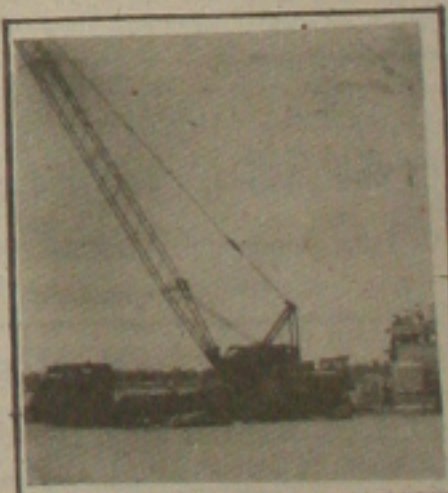
Porto de Aracaju.

Na opinião do presidente do Sindicato, o ideal seria um convênio com a Companhia Docas do Estado da Bahia, (Codeba). Com este convênio, nenhum dos 31 funcionários seriam demitidos. "É necessário que o governo estadual, em caso de se firmar convênio, pense nas questões sociais dos funcionários, porque em caso de demissão haverá um problema social grave", observou o presidente do Sindicato.