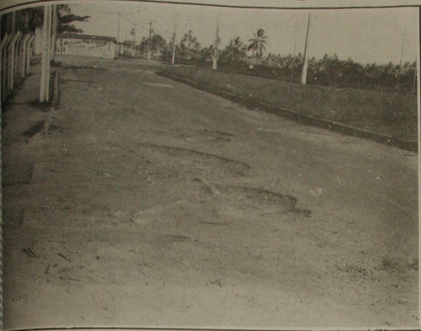
Moradores do Condomínio Vale Japarutuba reclamam do abandono das ruas pela administração municipal.