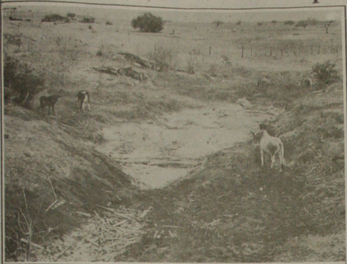
Sertanejos estão desesperados e não sabem mais para quem apelar, a fim de evitar a dizimação dos rebanhos, que não têm água e pastagens para alimentação.