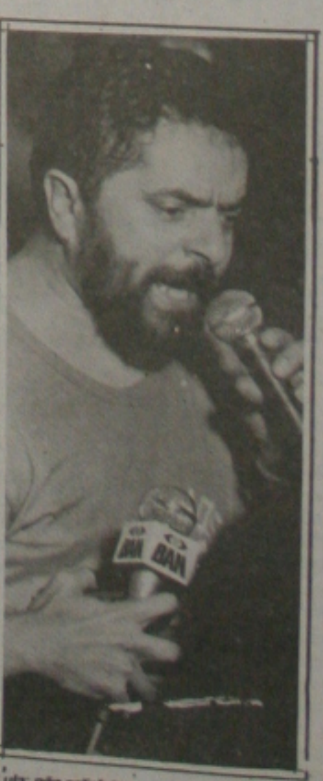
Lula: não satisfaz.

Lula espera que a condenação do crime praticado em Xapuri signifique pelo menos o início de novos tempos na relação entre proprietários de terra e camponeses.