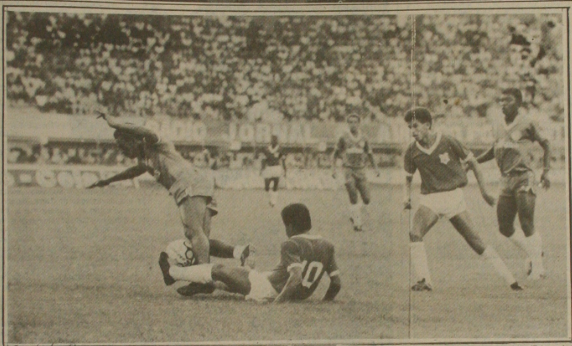
Sergipe e Confiança fazem no Batistão uma partida decisiva.

Proletários não abrem mão do direito de conquistar o título hoje