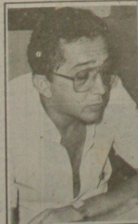
Mário diz que não deve haver privilégio e todos têm que receber

Muita gente deixou de gerar mais emprego e ajudar na economia do país como também diminuiu os problemas sociais com o desemprego, a partir do confisco do dinheiro, uma medida arbitrária e autoritária. Sei de pessoas que venderam alguns bens e aplicaram o dinheiro para a reforma da casa ou comprar outra coisa e não fizeram coisa alguma, porque não tinham o capital. Qualquer pessoa sabe que numa reforma de casa ou outra coisa, no mínimo, você gera dois empregos, mesmo que temporários, mas