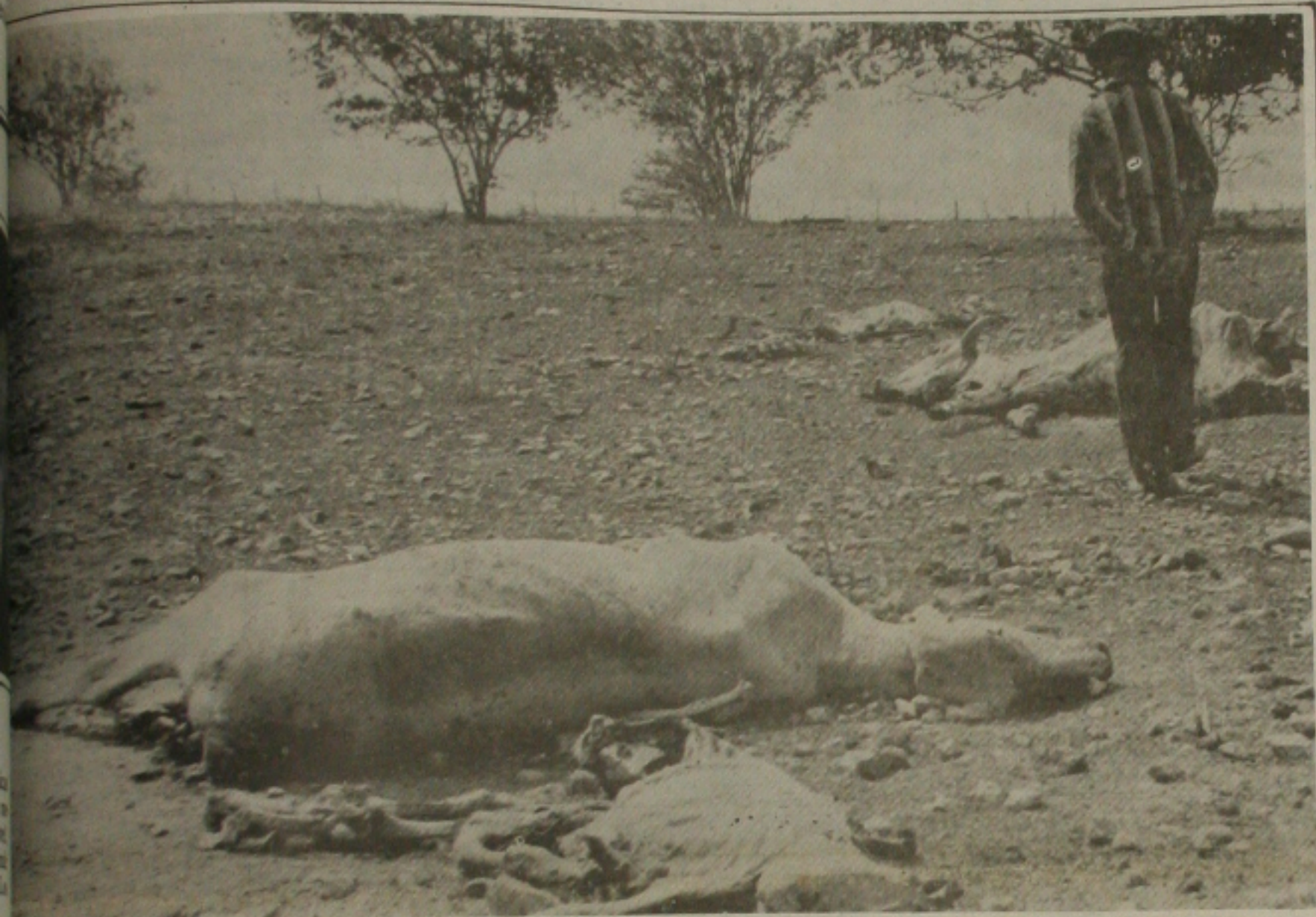
Um animal está morrendo de sede com a seca no sertão sergipano.