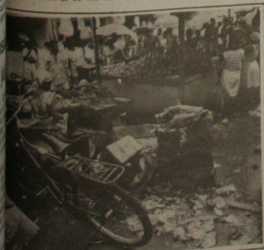
Feirantes e consumidores reclamam da sujeira que está invadindo o Mercado Thales Ferraz.

Em época de chuva é maior a incidência de ratos no Mercado o que tem colocado em risco a saúde pública. Os roedores são transmissores da leptospirose, que pode causar a morte se a doença não for devidamente tratada.