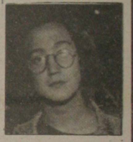
Sean Lennon de apenas 16 anos: louca por Amanda DeCadenet

Depois de muito tempo, um novo romance ronda a família Lennon. Agora é a vez de Sean Lennon, filho mais novo de John e Yoko, cair nas redes do amor. A eleita é uma alegre estrelinha pornô: a inglesa Amanda DeCadenet, de 18 anos, que tirou a roupa para a revista Playboy americana em fevereiro passado e é conhecida em Londres como "a criança rebelde". Sean está tão apaixonado por ela que, quando soube que Yoko ia ser entrevistada, via satélite, por Amanda em seu show The Word pela levê inglesa, implorou à mãe que trouxesse a moça a Nova York para uma conversa pessoal, e depois um romântico jantar. Yoko, que desde a morte de John Lennon, em dezembro de 1980, vem dedicando sua vida a Sean, concordou imediatamente, e Amanda voou para Nova York para se encontrar com os dois. Só que dessa vez Sean não teve sorte, pois a inglesinha, após a entrevista, sentiu-se mal e cancelou "a esticadinha".