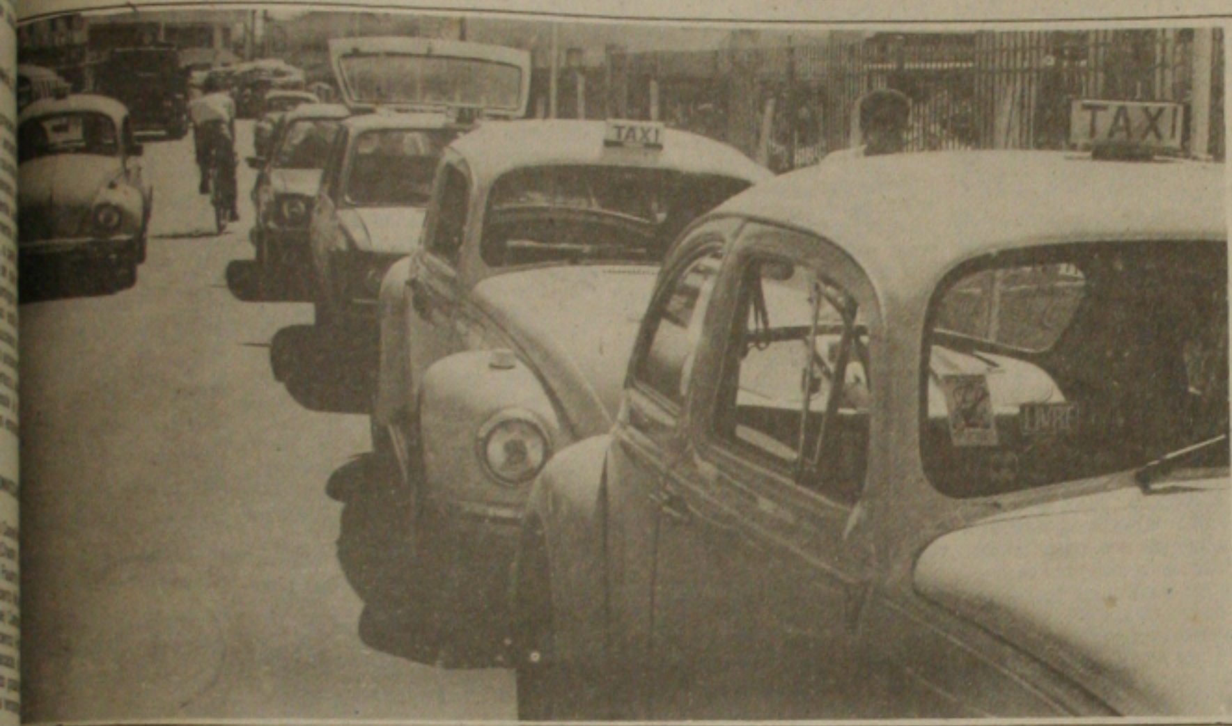
Estes taxis estão provocando pânico entre os taxistas que protestam contra a falta de segurança.