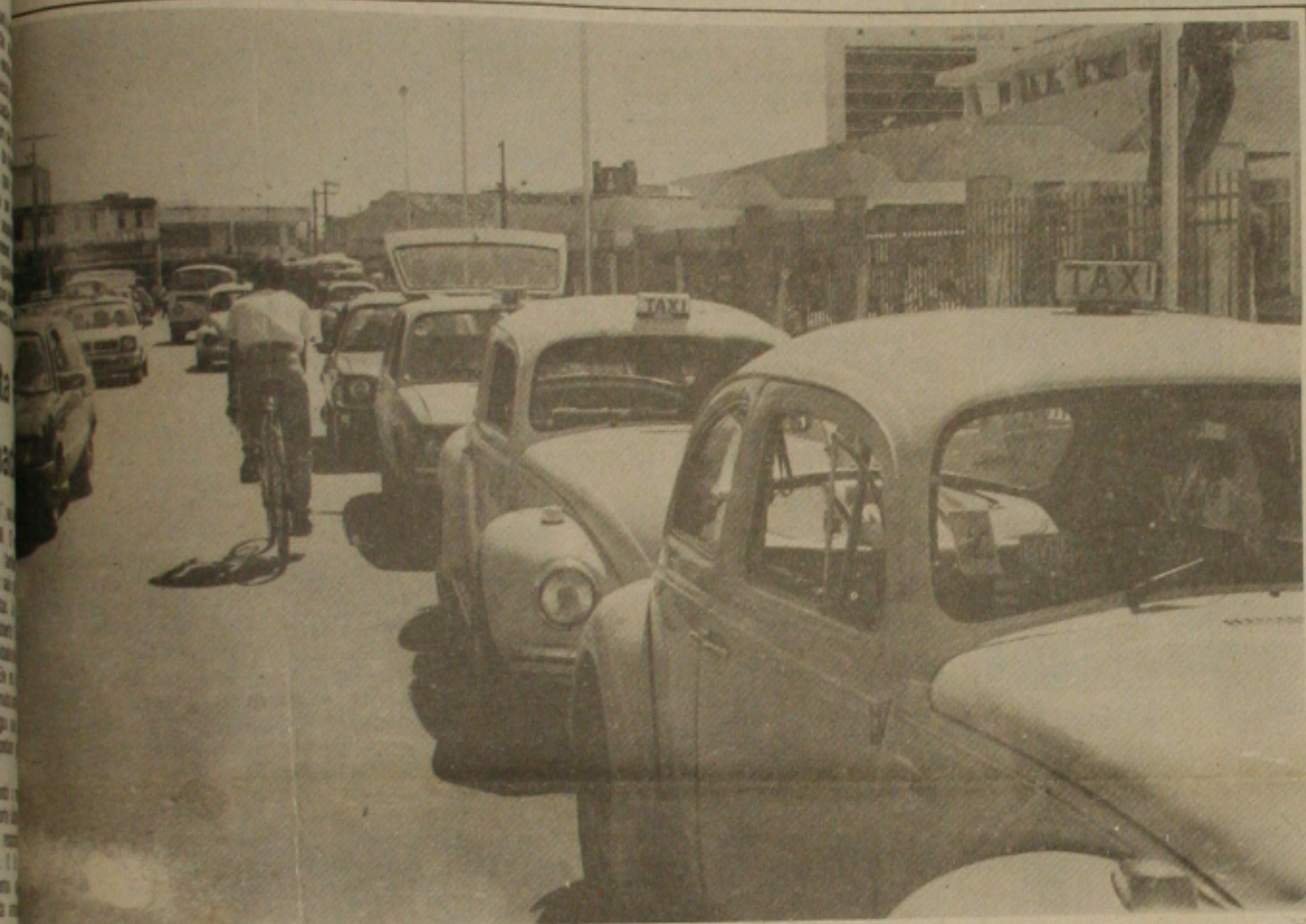
taxistas protestam contra crimes e pedem mais segurança.