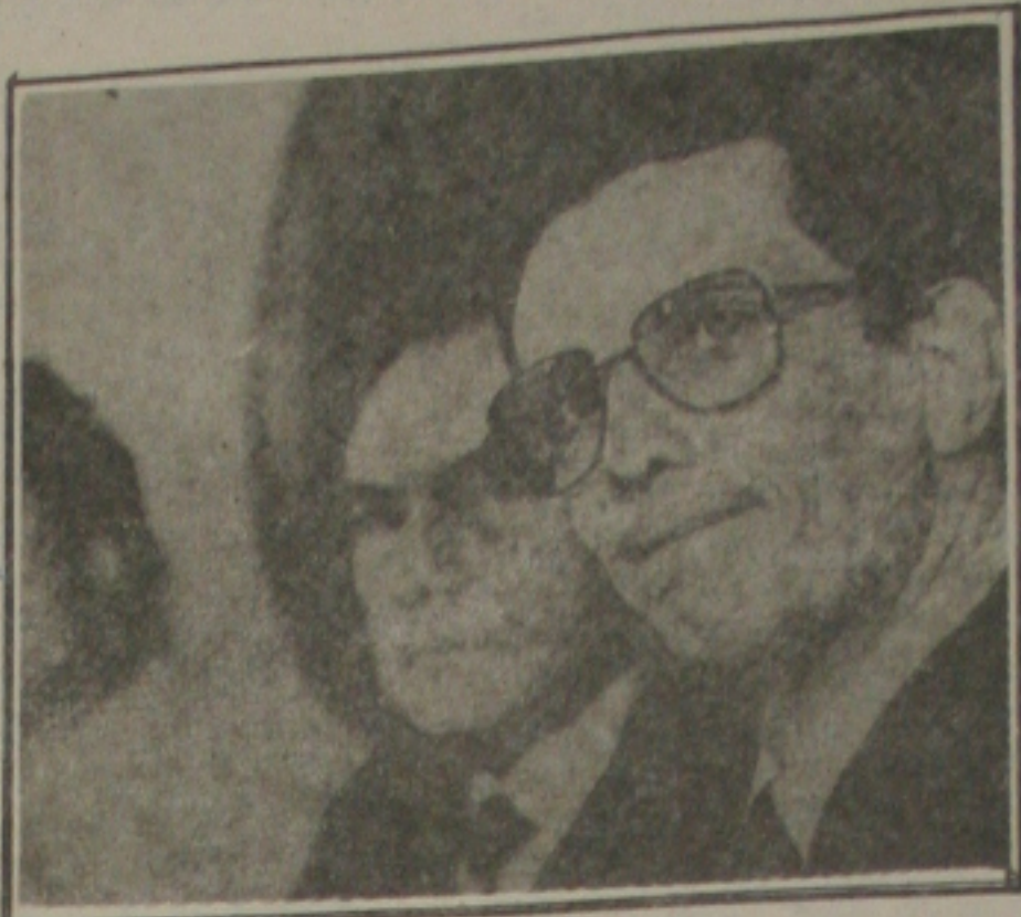
Ministro Carlos Chiarelli

Os laboratórios oficiais já são responsáveis por 47% da demanda por medicamentos básicos, na rede pública. Esse índice, no entanto, ainda pode subir para 70% se houver o aumento de produtividade, já que os laboratórios estão funcionando hoje desparelhados e ociosos. Como parte da estratégia para combater a dependência do Brasil em relação aos medicamentos, a Ceme, um órgão da administração direta vinculado ao Ministério da Saúde, a partir do ano que vem vai ganhar também mais autonomia, transformando-se em empresa pública, conforme informou ontem seu presidente, Antônio Carlos Alves dos Santos.