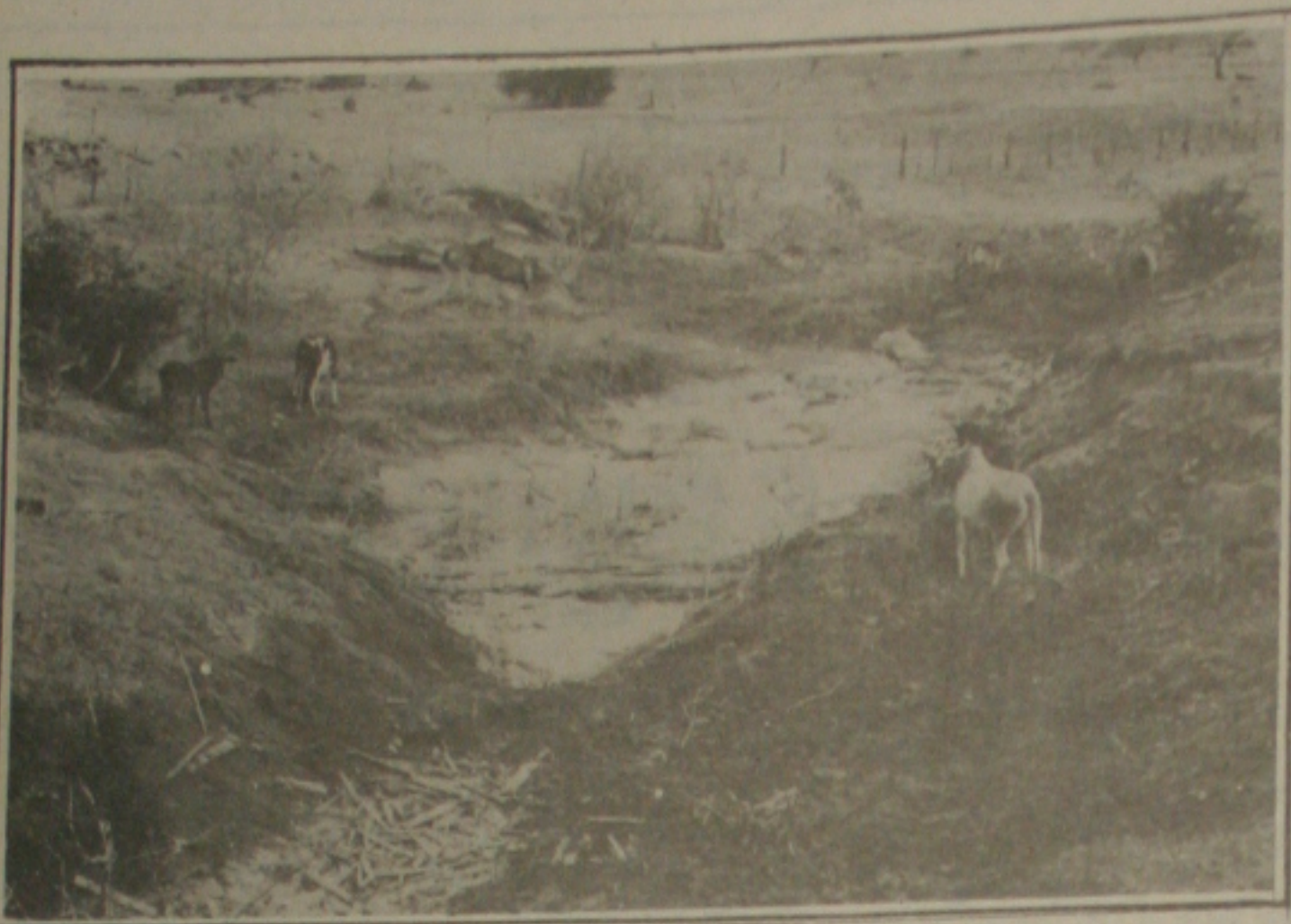
A seca no sertão continua dizimando os rebanhos bovinos.