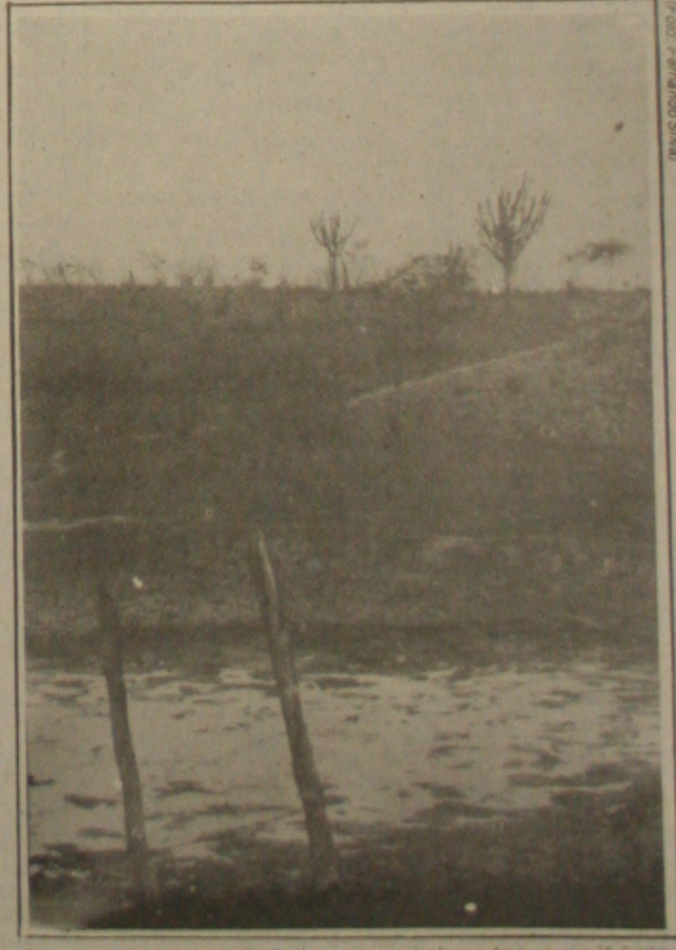
Os açudes estão vazios, a plantação desaparece e o gado sem água e sem pasto começa a morrer.

Saiba o que vai acontecer nos capítulos de hoje de suas novelas preferidas. Benigna de Alaguel - Tadeu é socorrido e levado para o hospital. Lua Cheia de Amor - Quilina volta a si e rasga toda roupa. Meu Bem, Meu Mal - Isadora fica com ciúme de Ricardo. Araponga - Araponga percebe que está sendo seguida e para em frente de casa e espera. (Página 4-C).