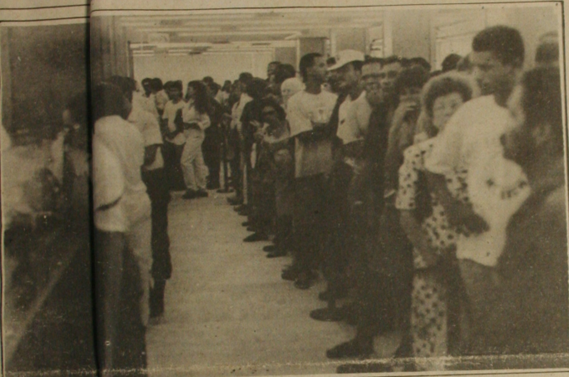
As filas nas agências bancárias no primeiro dia útil do ano foram imensas.

Na Assembleia Legislativa, um projeto de lei e uma Emenda Constitucional, encaminhadas pelo Governo do Estado para regulamentar aposentadorias de servidores, principalmente secretários de Estado, que estavam se aposentando com o vencimento de cargo que ocupava, até quando exerciam tal função por até 24 horas, está gerando polêmica, apesar de ser considerada imoral pela maioria dos deputados.