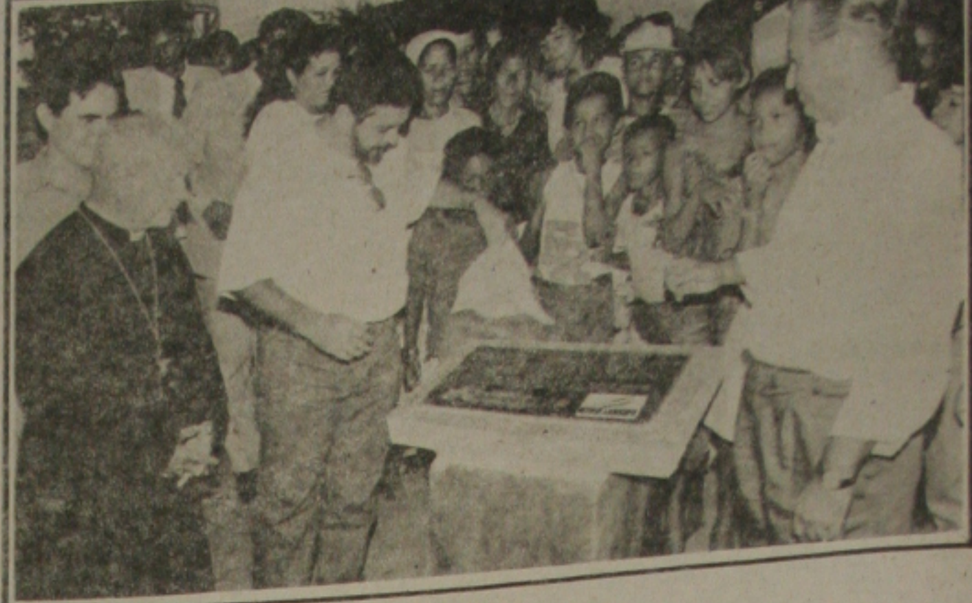
O governador Valadares e Theotônio Neto inauguram o Monte Carmelo

O Bradesco inaugurou, em dezembro passado uma micro-estação composta de uma antena parabólica em sua agência Canindé do São Francisco. Esse evento dá sequência a um projeto onde o balanço investiu US$ 25 milhões, que prevê a efetiva interligação de suas agências e demais postos de atendimento, em todo o País, através de uma rede privada de comunicação de dados via satélite.