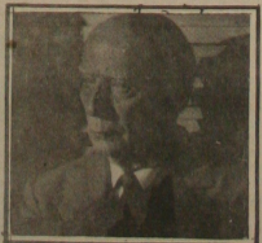
Ulysses falou pouco sobre política.

O presidente nacional do PMDB, ainda nesta entrevista, não considerou o fato do PMDB perder as eleições para governadores em vários Estados, elegendo só sete governadores, como um fracasso, argumentou que cada eleição é uma história e que se não ganhou no Rio de Janeiro, Minas Gerais e Rio Grande do Sul, mas venceu em São Paulo e no Paraná, além de mais cinco Estados importantes.