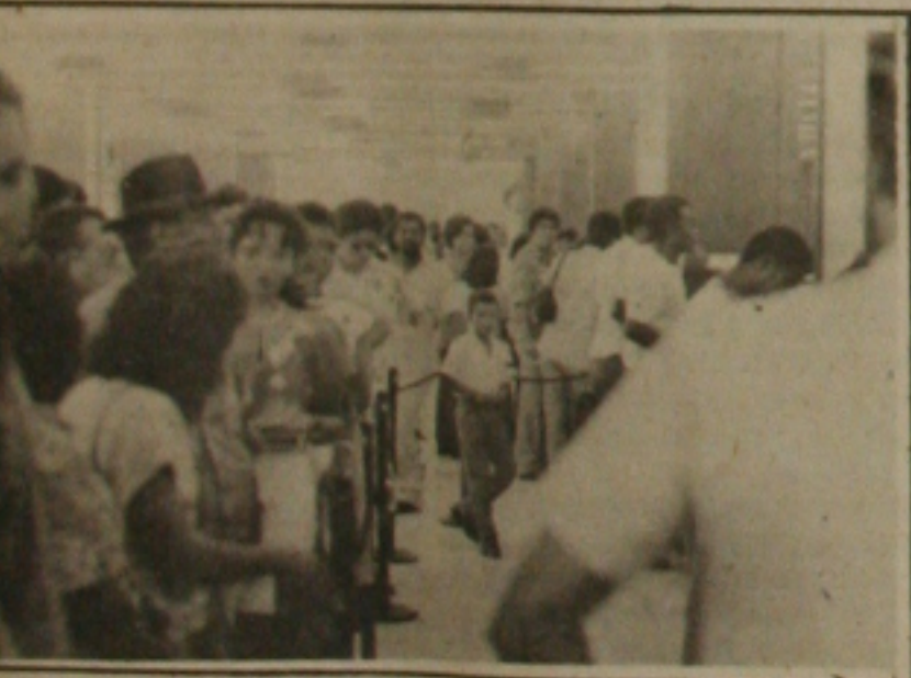
No primeiro dia útil do ano, os bancos estiveram superlotados. Todos queriam saldar os seus débitos.