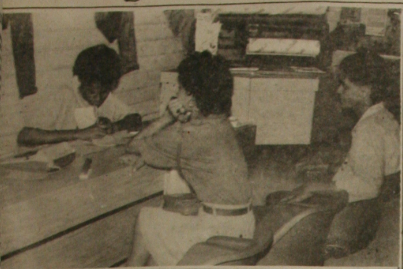
Para fazer o crédito que o SPC fornece as informações para concretização do negócio.