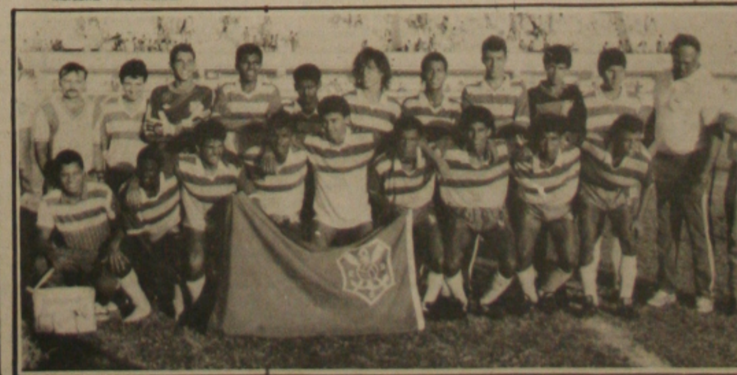
Juniões do Sergipe bicampeões embarcam hoje para a disputa da Taça Cidade de São Paulo.