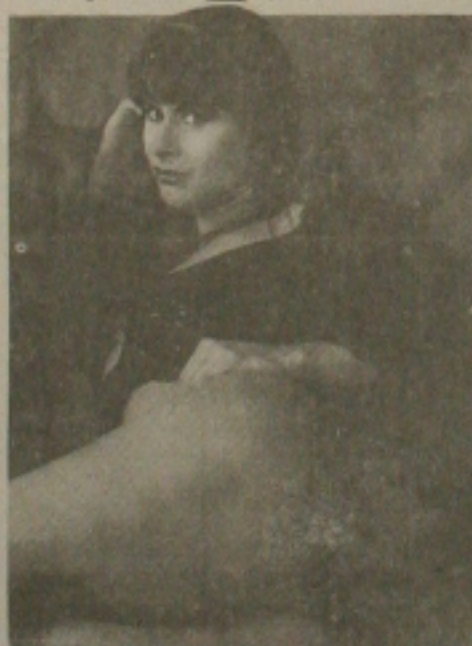
A atriz teve um caso com Fausto Silva que durou dois meses