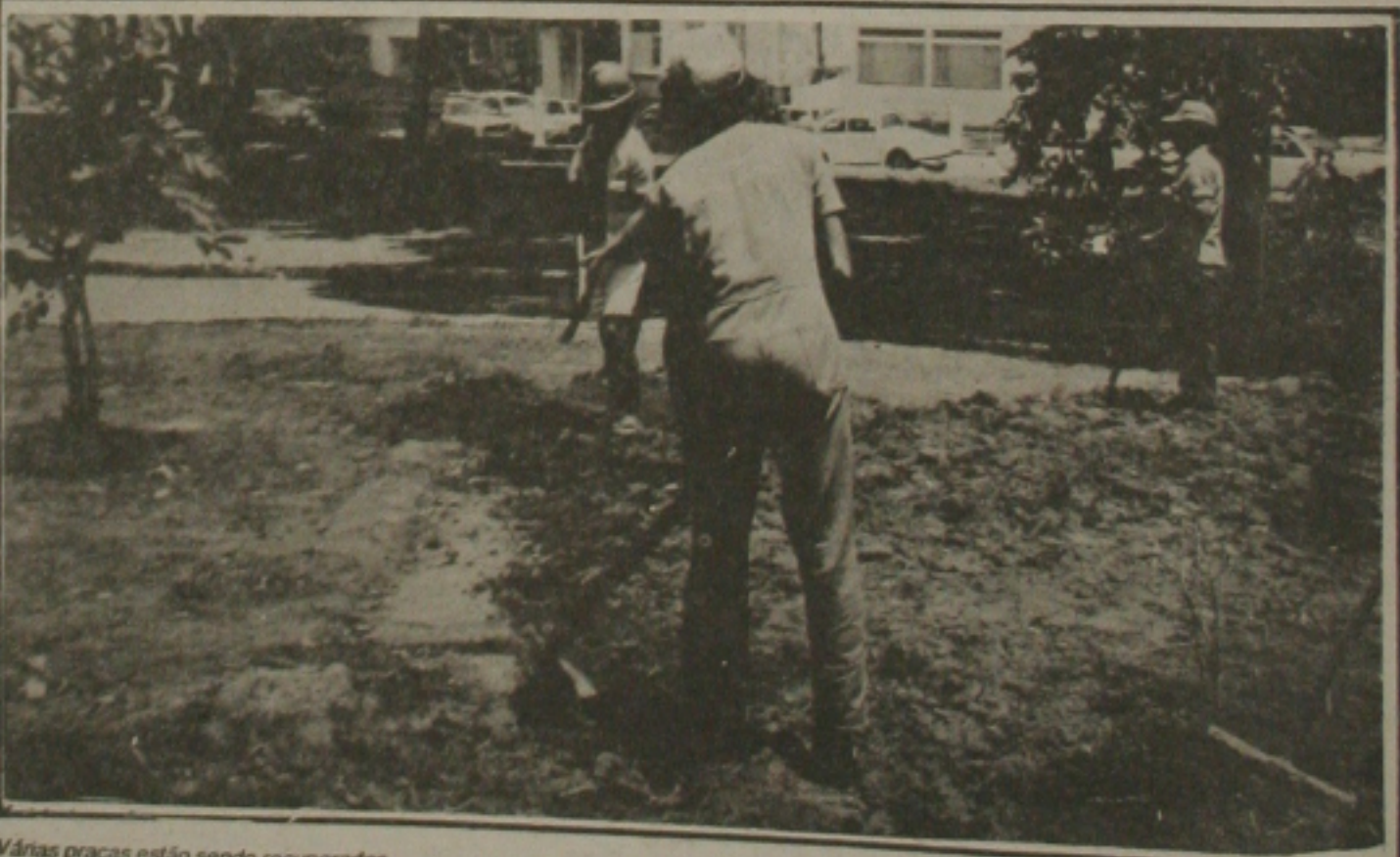
Várias praças estão sendo recuperadas

Albano lembrou que é o momento de se rezar bastante e pedir a Deus proteção para o nosso País e para o mundo, pela paz, por mais saúde e trabalho e principalmente, para que as elites dominantes procurem pensar mais neste povo sofrido que continua sendo o sustentáculo da Nação, porém ainda colocado em plano secundário. Aproveitou para elogiar o governador Antonio Carlos Valadares que de forma humilde conduziu o Estado com força, seriedade, trabalho, além de unir todas as forças políticas de Sergipe em