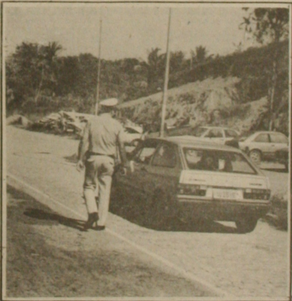
A Polícia Rodoviária esteve de prontidão durante a realização da "Operação Reveillon".

O chefe do 21º Distrito Rodoviário Federal, ao concluir, disse que com o término da Operação Reveillon volta a ser desenvolvida a Operação Verão, iniciada no começo de dezembro último e com data marcada para terminar em 02 de março próximo. Acrescentou também que, a finalidade dessa operação é evitar acidentes nas rodovias e prestar socorro aos feridos durante o período de férias quando há um fluxo maior de carros nas estradas.