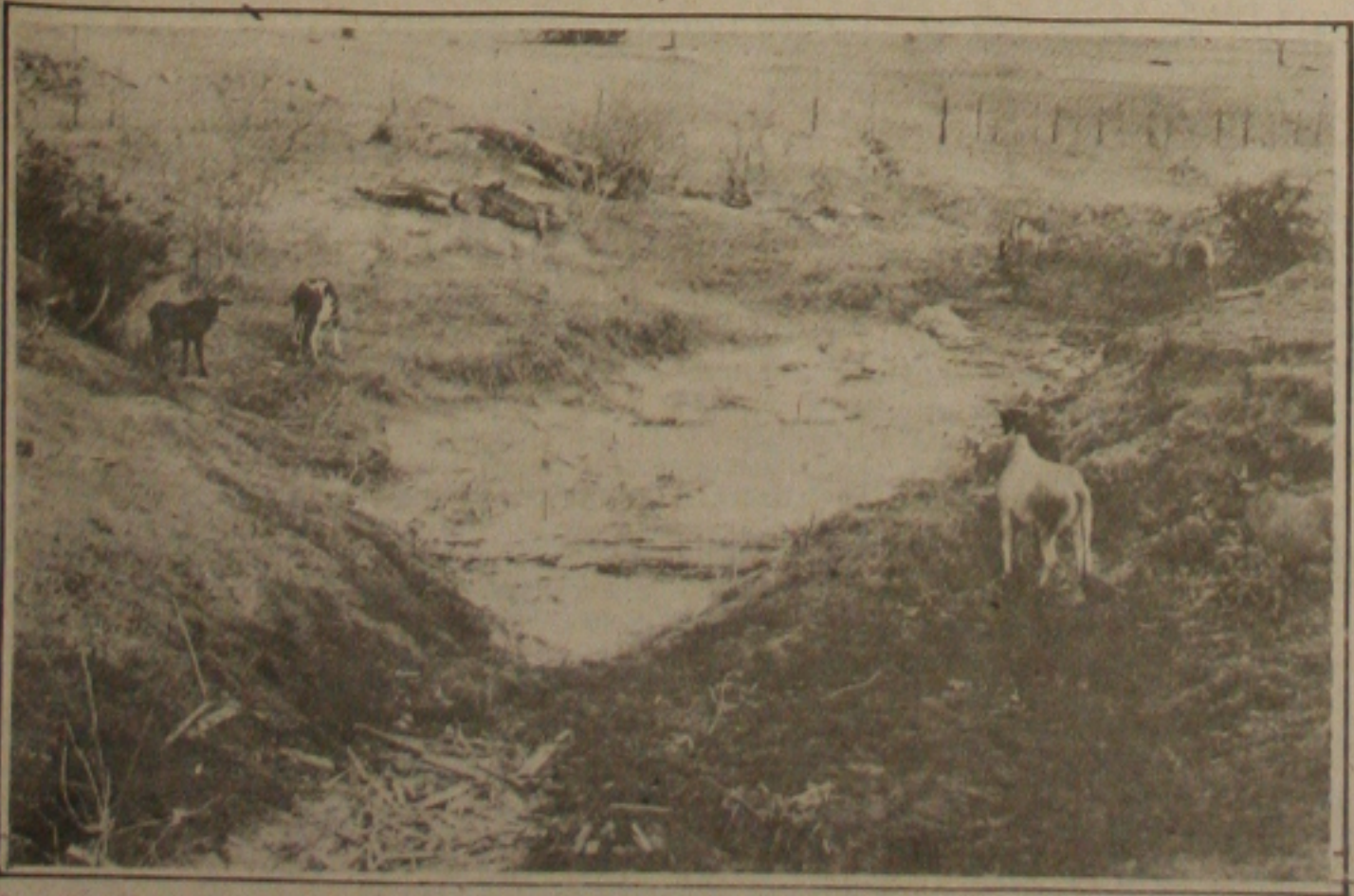
Sem chover há meses, a situação nos municípios do alto sertão sergipano é grave e o gado não tem mais o que comer.

O sindicalista informou ainda que a classe trabalhadora da zona rural ainda não sabe do paradeiro dos recursos liberados pelo Governo Federal cujo montante beneficiaria grande parte dos pequenos produtores da região nordestina. "O Governo anunciou a liberação desses recursos para minimizar a nossa situação, mas até agora ninguém sabe do paradeiro do dinheiro", finalizou o presidente da Fetase.