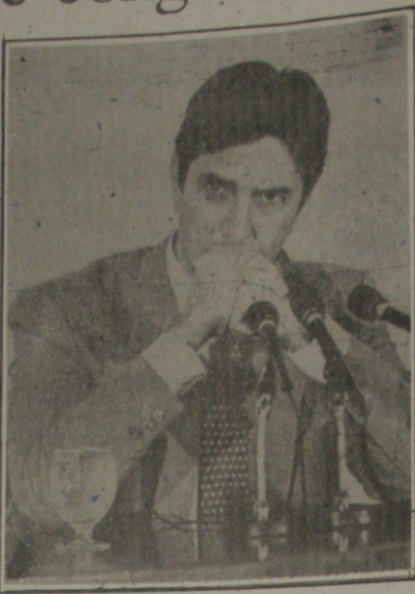
O presidente Collor vai ver a seca.

O líder do PSDB, Euclides Calco (PR) quer alterar a medida dos salários, das mensalidades escolares e dos alugueis. O vice-líder do PT, deputado José Genoíno (SP) disse que ainda não estudou detalhadamente as medidas, mas é simpático às medidas do ITR, extinção do Lloyd Brasileiro de navegação. Apesar de votar favoravelmente a essas matérias, o PT ameaça obstruir as sessões caso não haja quorum para a votação.