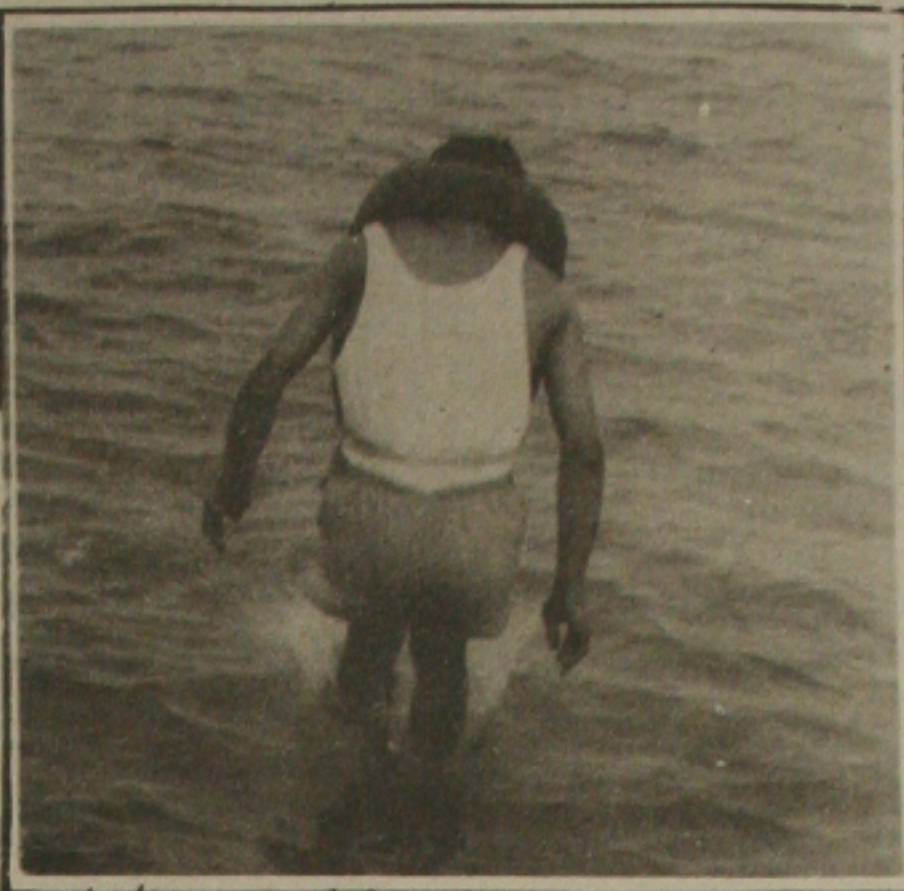
...os coletes salva-vidas estão em condição de uso como existe um marinheiro.