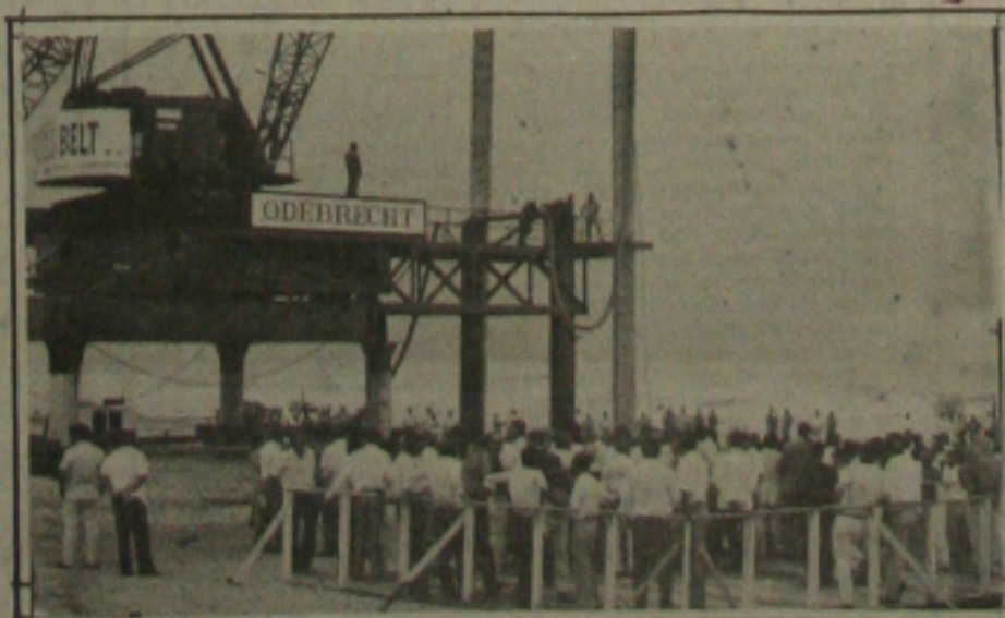
A Odebrecht disse que faltou dinheiro para continuar as obras.