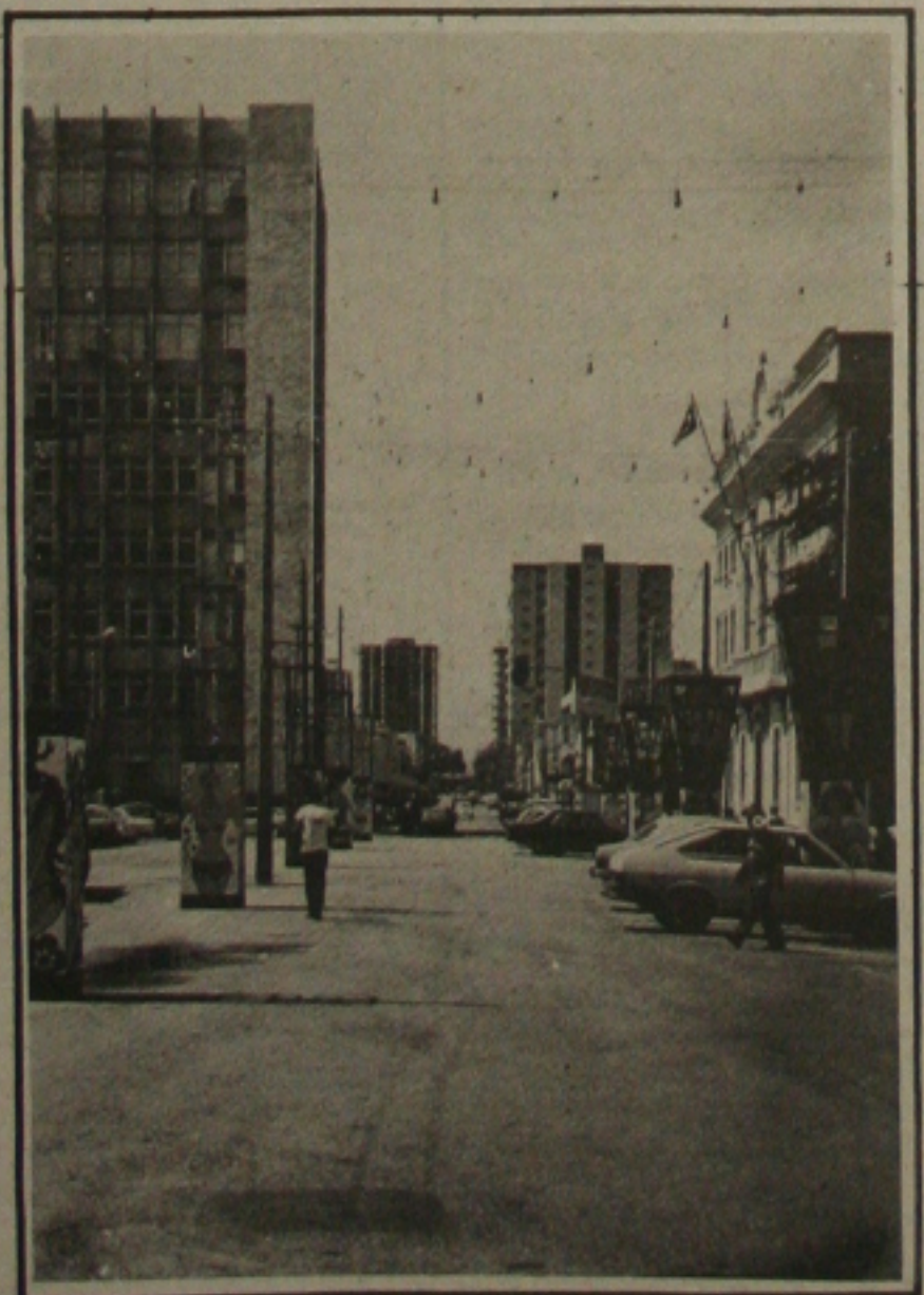
A Secretaria Municipal de Cultura garante que este ano os aracajuanos terão um carnaval animado a começar pelo Clube do Povo.

Por falta de recursos financeiros, conforme os organizadores do carnaval de rua em Aracaju, este ano, as prévias camavalescas que seriam realizadas nos bairros periféricos de Aracaju, criando um clima momesco, não serão realizadas.