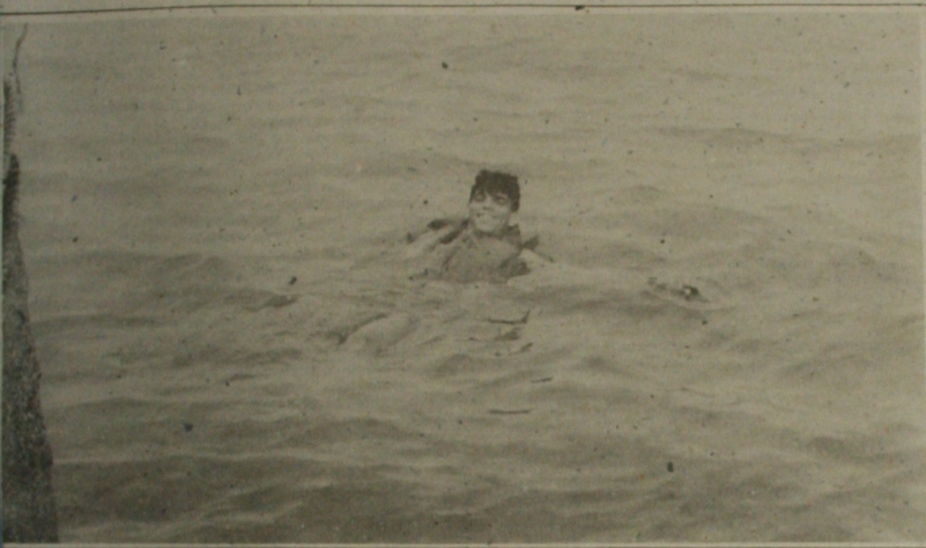
Um jornalista utiliza a bota para mostrar a jornalista que ela ainda é útil em condições.