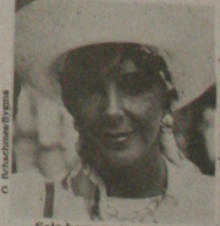
Seis homens fizeram de Elizabeth Taylor a mulher de maiores recursos no meio artístico.