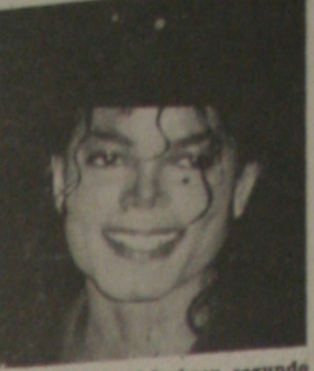
Michael Jackson, segundo LaToya, pretendia levá-la para o sítio da família e submetê-la a uma lavagem cerebral.