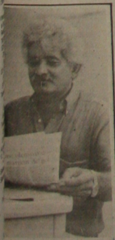
segura que a sociedade partici- do PCB.

PCB está convocando à para discutir o seu des- podemos, esconder que o seu veio na esteira do novo Leste Europeu, on- nova ordem econômica, social está-se estabelecendo - disse Marcelo Déda.