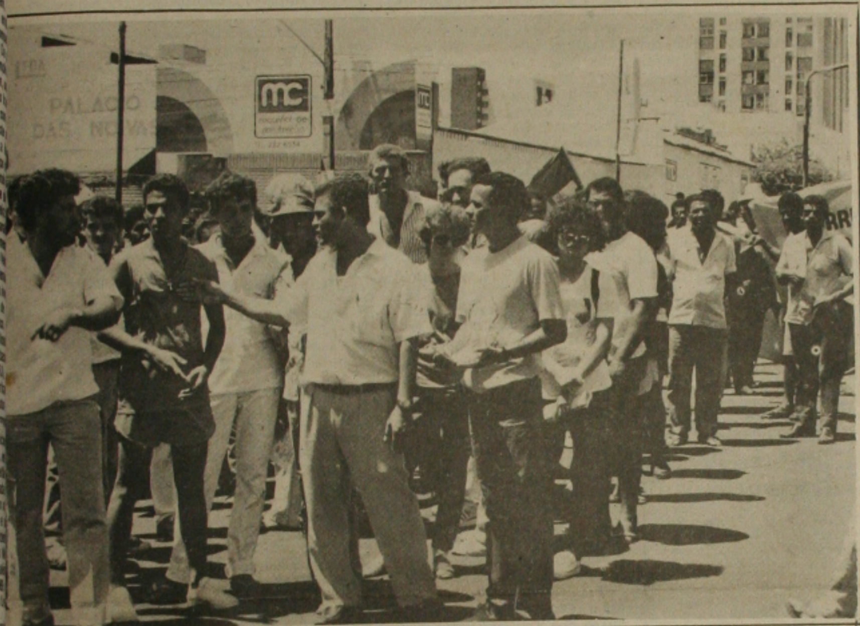
Os metalúrgicos em Sergipe poderão deflagrar uma greve geral.

Os metalúrgicos em Sergipe poderão deflagrar uma greve geral a qualquer momento. Esta iniciativa da classe trabalhadora depende apenas do resultado do processo de negociação. As classes patronal e trabalhadora ainda não chegaram a um acordo, mas acredita-se que até o final deste mês o acordo seja firmado.