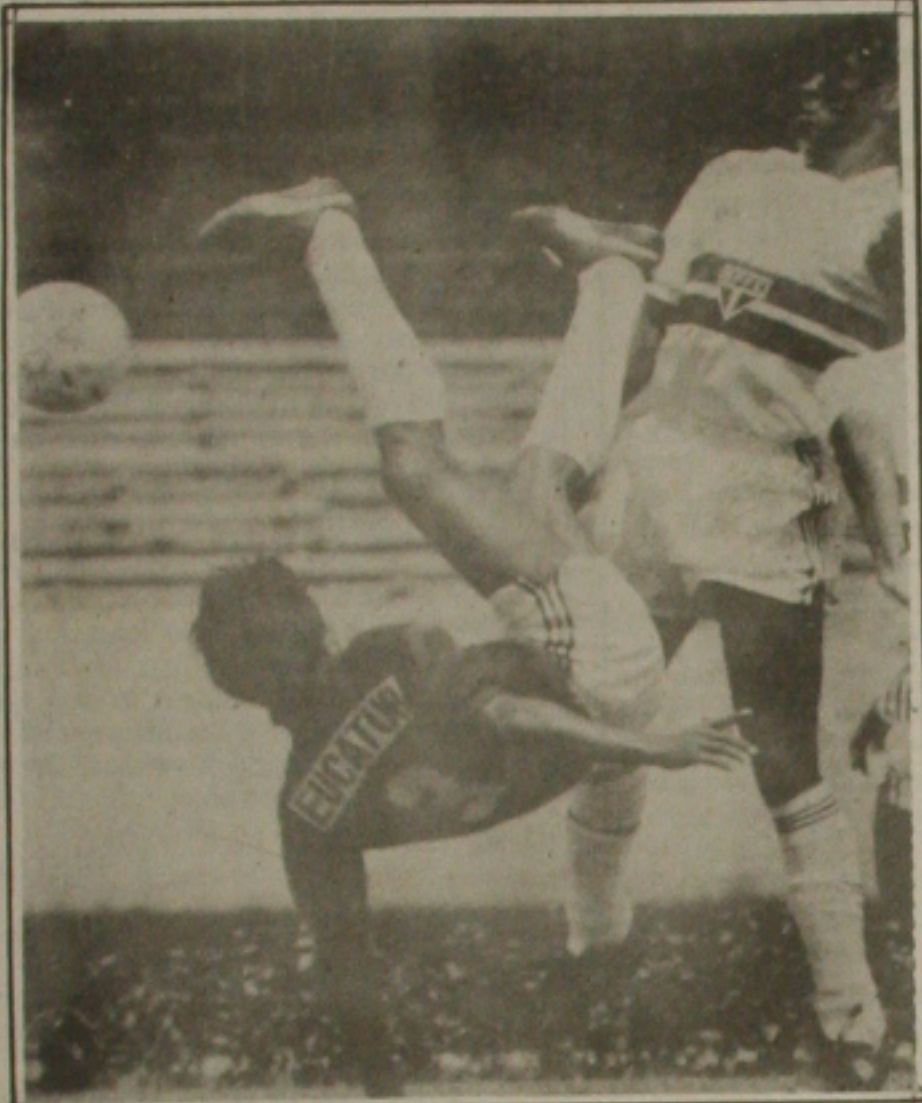
O São Paulo não teve dificuldades em goleiar o time sergipano por 6x0.

Confiança recebeu ontem o condão da Desportiva Maranhão da Silveira, para fazer o jogo da 20. O presidente Fernando recebeu o convite e a partida será disputada no sábado. O Maranhão recentemente campeão da Liga de Futebol Menor. Nessa partida o Maranhão estará atuando com a sua formação principal, inclusive com alguns jogadores que já estarão em fase de testes na Copa Brasil. Segundo Fernando, o convite foi aceito, por considerar-se uma forma de time principal e prestigiar uma equipe que tem à frente uma diretoria séria e a exemplo dos profissionais de futebol de campeão. A partida está marcada com certa expectativa pela Maranhão que vai prestigiar o jogo de Ribeiro.