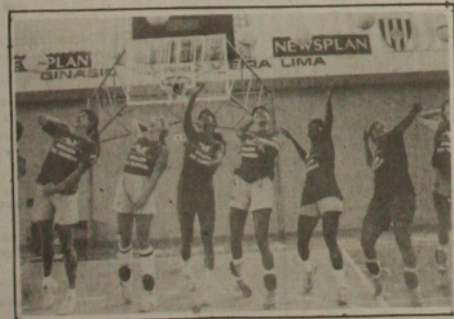
O voleibol do Rio de Janeiro representado pelo Armazém das Fábricas

A Sádía, grande favorita ao título brasileiro, viaja até São Caetano para enfrentar a São Caetano/BASF que perdeu na primeira rodada da Liga. Nos outros jogos, o Colgate/PÃO DE Açúcar jogará com a AAB/Brasilit, em Recife, enquanto a Recra/Laguna terá como adversária a Translitoral/AVS, em Ribeirão Preto.