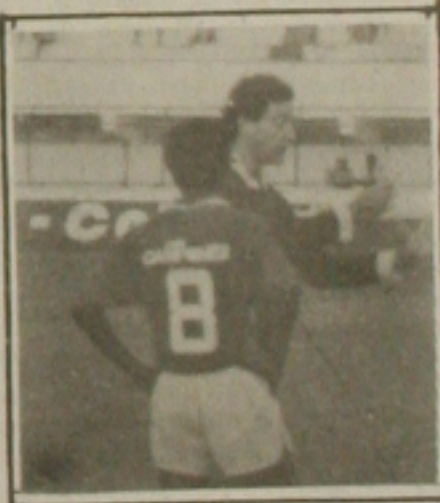
goleiro, marcando o segundo gol do Flamengo.