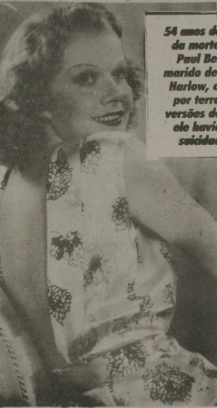
54 anos depois da morte de Paul Bern, marido de Jean Harlow, caem por terra as versões de que ele havia se suicidado