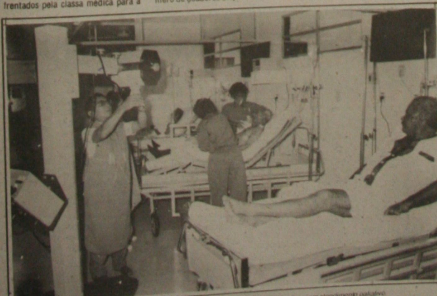
Enquanto não surgem doadores para transplantes, alguns pacientes são obrigados a conviver com atendimento paliativo.