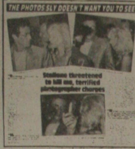
na Globe, a misteriosa louira que causou a briga de Stallone.

para ele e ameaçou matá-lo se aquelas fotos fossem publicadas. Ligier argumentou que estava fazendo seu trabalho e Stallone não conversou, distribuindo tapas e bolachas que obrigaram o fotógrafo a ir até um hospital, onde os médicos constataram concussão cerebral, maxilar quebrado, perda de consciência e contusões generalizadas. Ligier diz que até hoje ainda sente "terribles dores de cabeça" e que, por causa de tudo o que Stallone e seus guarda-costas o fizeram passar, entrou com um processo contra o ator. Se vitorioso, o fotógrafo faz a sua independência financeira, levando para casa alguns milhões de dólares, embora ele saiba que a batalha não será fácil: "Continuo recebendo ameaças de morte pois Stallone descobriu meu telefone e meu endereço. Ora são cartas, ora são ligações dizendo que, como transformei a vida dele num inferno, eu não vou viver muito mais tempo." A única coisa agradável que aconteceu para Ligier em tudo isso foi que Elle Samaha, proprietária do Roxbury Club, convidou-o para participar de uma festa oferecida para Mickey Rourke; algumas noites depois do incidente: "Ele e Mickey me trataram superbem e me deixaram fotografar tudo o que eu quisesse."