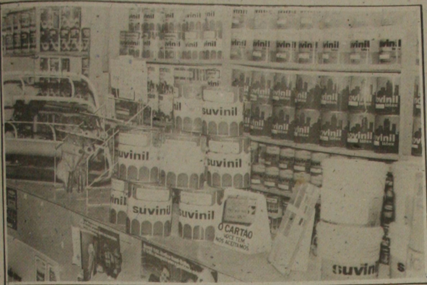
A crise econômica atingiu também o comércio das tintas e o que afirmam os gerentes das casas comerciais.