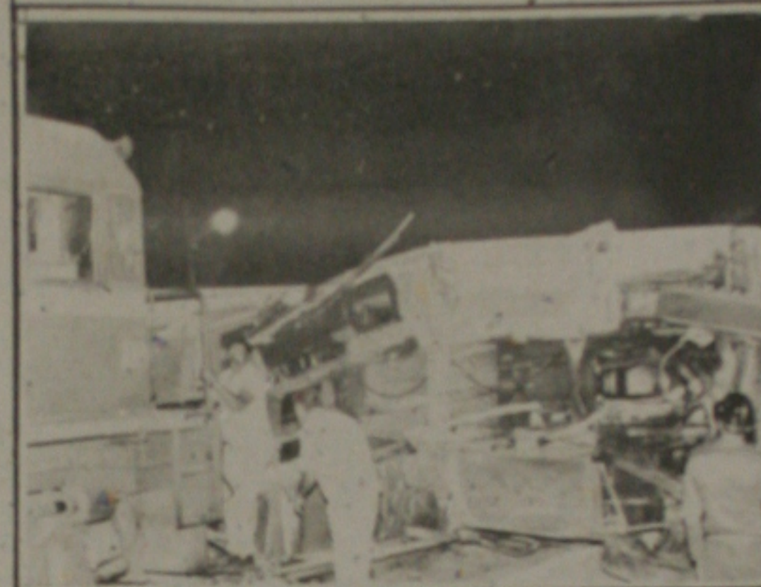
...e o amassado por aproximadamente 20 metros.