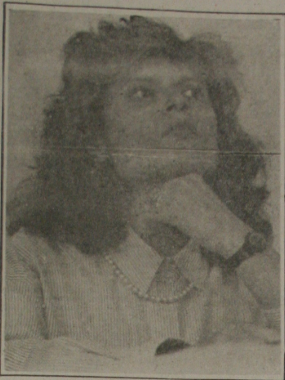
A ministra Zélia perde mais um auxiliar

O IPC recebeu forte pressão do grupo saúde e cuidados pessoais: a taxa registrada chegou a 31,10%, em função dos aumentos dos medicamentos e dos aparelhos de saúde. O grupo educação, leitura e recreação subiu 19,4%; despesas diversas, 14,38%; e alimentação, 13,50%. O vestuário apresentou a menor variação: de 5,56%. No IPA, a desaceleração foi maior na categoria de bens de consumo: passou a 4,36% contra os 7,29% de dezembro. Já a alta dos bens de produção passou de 2,91% para 2,11%. Na composição do INCC, os materiais de construção subiram de 8,11% para 9,77%, enquanto o custo da mão-de-obra deu um salto: de 8,49% para 13,06%.