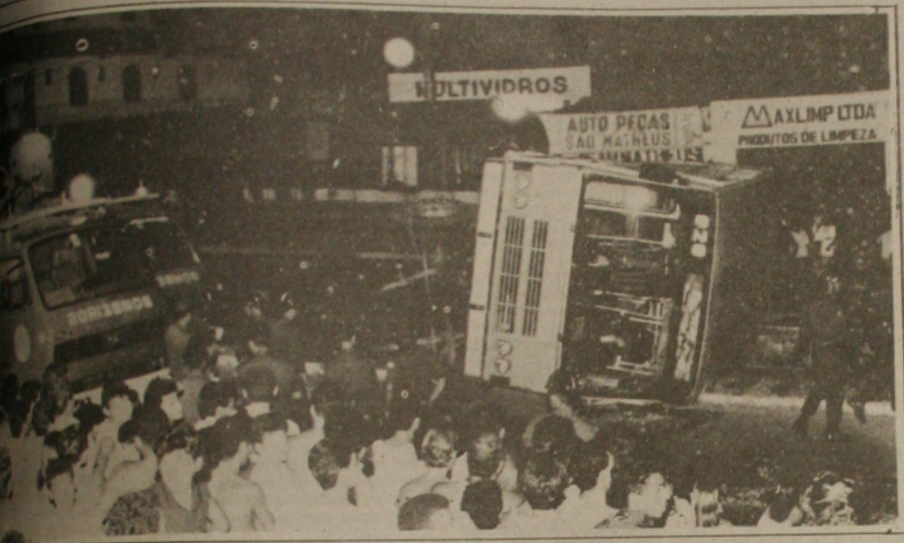
...colido com o ônibus da Graça e o arrastou a 20 metros de distância.