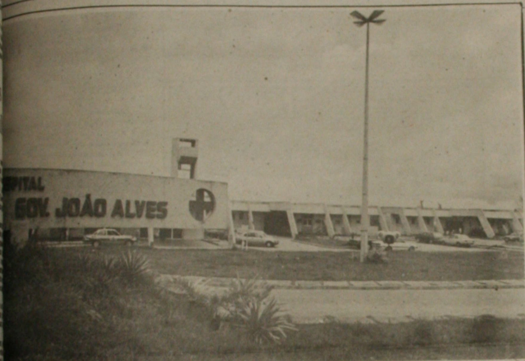
Os casos de Aids diagnosticados pela Secretaria da Saúde são encaminhados para o Hospital João Alves, o único especializado nesse tratamento.

Mais um caso da Síndrome da Deficiência Imunológica Adquirida, (AIDS), foi registrado em Sergipe no início deste mês pela Secretaria de Estado da Saúde. Com este novo caso, eleva-se para 41 o número de pacientes portadores da doença, dos quais 29 já faleceram. Os pacientes são atendidos no Hospital João Alves, o único que interna portadores de Aids.