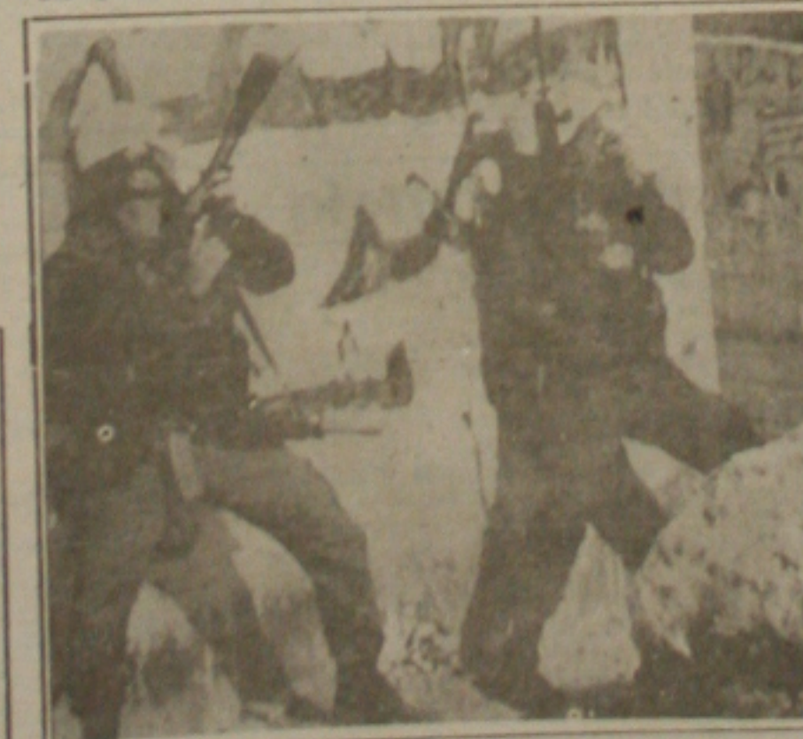
Soldados israelenses preparados para enfrentar Saddam e os palestinos