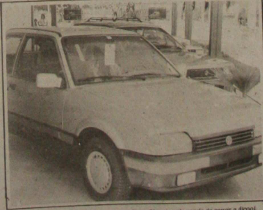
A possível escassez de gasolina por causa do conflito aumenta venda de carros a álcool.