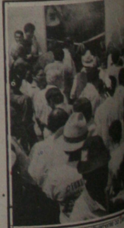
A comunidade participa ativamente

O levantamento das carências e potencialidades da região será feito por equipe composta por representantes da comunidade, da Prefeitura, da Emater e de outras entidades que atuam na área, sob coordenação de um técnico do Fundec. Para realização do trabalho ou aquisição de equipamento ou máquina, serão utilizados recursos do Fundec, dos governos estadual e municipal e da própria comunidade. Há que se destacar que, no caso da municipalidade e da comunidade, os recursos podem ser materiais (equipamentos e insumos), ou