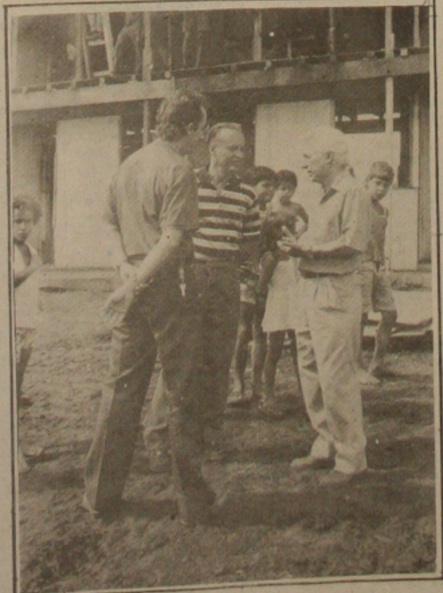
Governador Valadares vai a Marum ver de perto as obras do estádio.

A programação de inauguração não está ainda totalmente elaborada, mas além da presença da Seleção Brasileira e outras promoções esportivas fa-