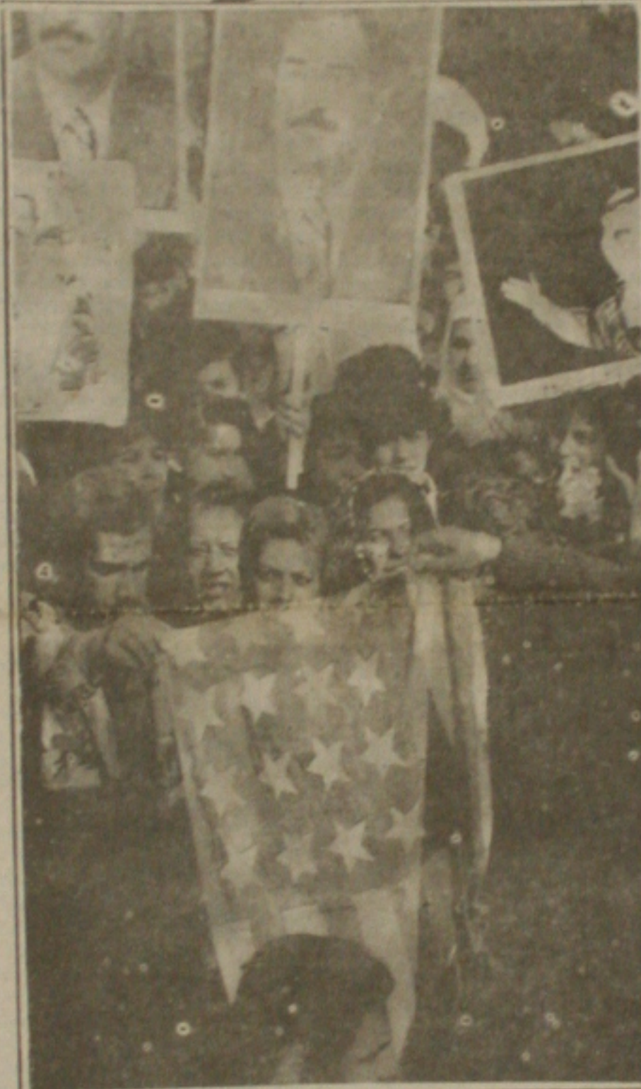
Iraquianos queimam bandeira dos Estados Unidos em manifestação em Bagdá, ontem à tarde, antes do bombardeio.

Alguns deputados comentavam ontem que o servidor público deve ser esclarecido da verdade dos fatos. (Página - 3).