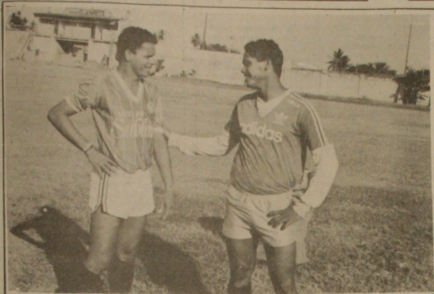
Edi sorá um falso extrema esquerda no novo esquema proletário.