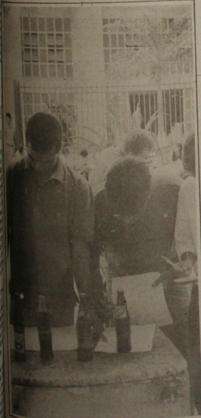
Os candidatos conferem os quesitos das três últimas provas do vestibular.