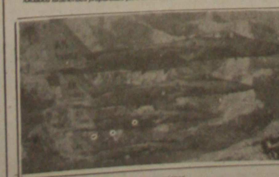
Aviões norte-americanos atacaram bases iraquianas.

A Força Aérea Americana atacou, ontem à noite, às 19 horas (horário de Brasília) a cidade de Bagdá, Capital do Iraque, atingindo determinados alvos para evitar baixas. O ataque foi feito de surpresa, exatamente 18 horas depois de passado o prazo dado pelos Estados Unidos para que Saddam Hussein se retirasse do Kuwait. O bombardeio foi feito com modernos aviões F-15, que tem dispositivos para que seus ocupantes enxerguem no escuro através de sensores infra-vermelhos.