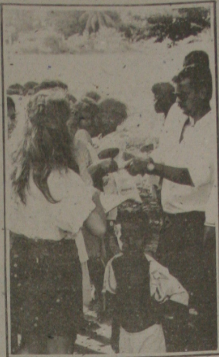
Projeto distribui leite com famílias carentes