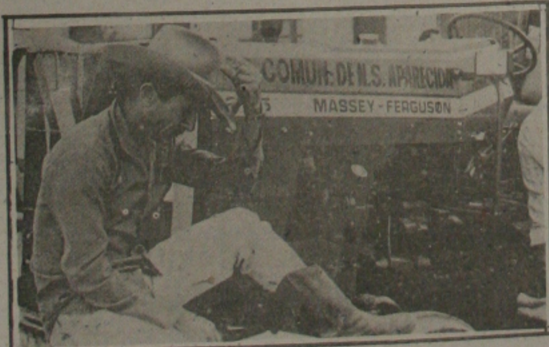
Um trator para atender mini e pequenos produtores

O Fundec - Fundo de Desenvolvimento Comunitário - do Banco do Brasil, trabalhando em estreita ligação com o Governo do Estado, está desenvolvendo em Sergipe um trabalho de apoio a ações comunitárias que é o segundo do País em volume de obras, só perdendo para Minas Gerais (723 municípios), e através do qual já foram ou estão sendo atendidos em necessidades básicas 72 dos 74 municípios sergipanos.