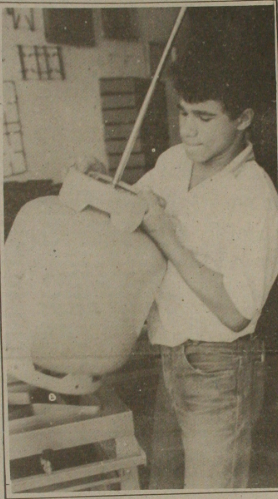
A ameaça de guerra no Golfo leva o aracajuano a comprar botijão por temer a falta de gás de cozinha.