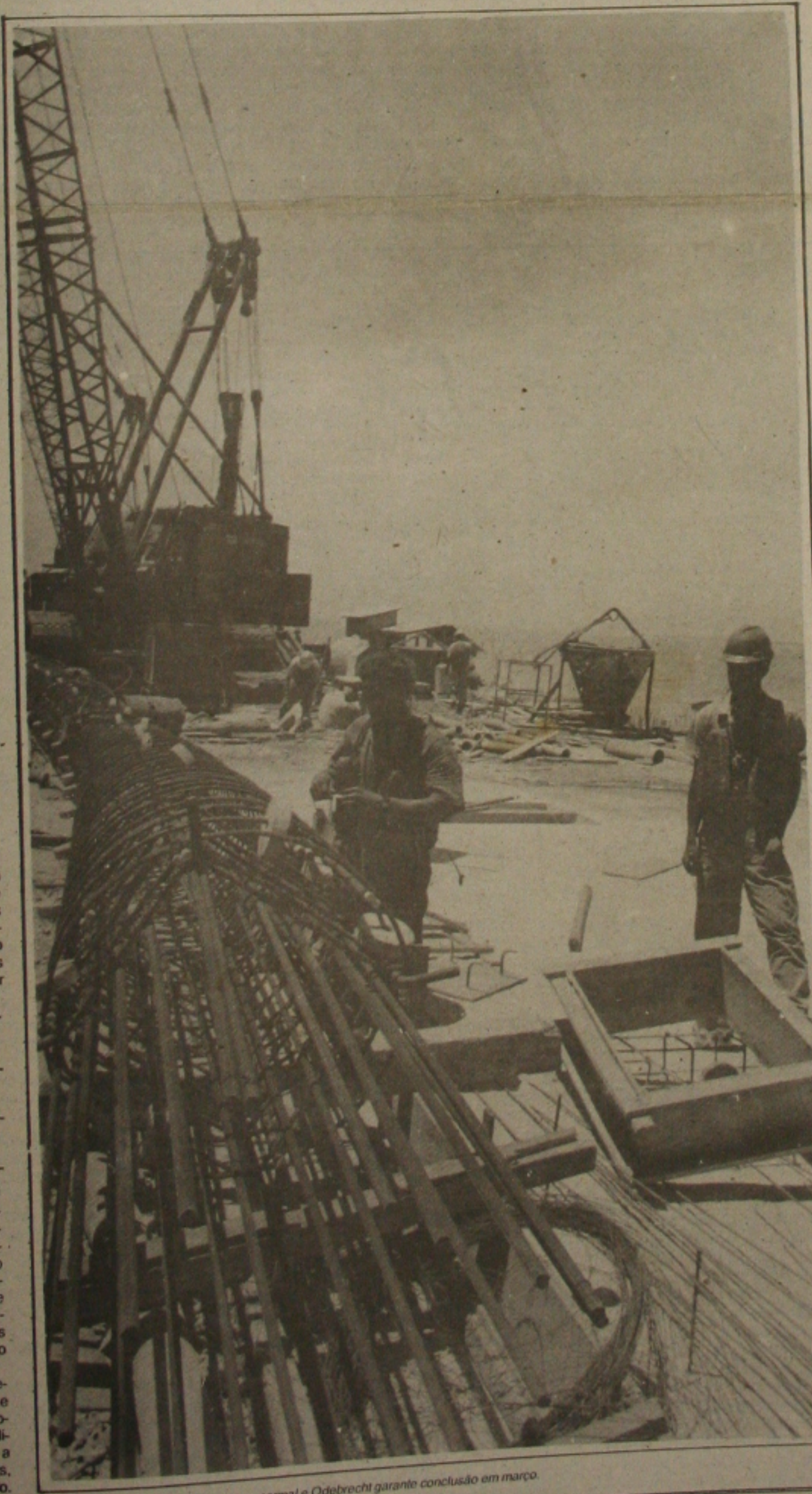
As obras do Porto continuam em ritmo normal e Odebrecht garante conclusão em março.

O presidente do Iraque, Saddam Hussein, cumpriu ontem a sua promessa de que Israel seria o seu primeiro alvo. As 205 horas da madrugada de hoje (22 horas de ontem em Brasília) pelo menos 8 mísseis iraquianos tinham atingido a cidade de Telaviv, inclusive um dos seus principais hospitais. O Iraque também lançou mísseis contra a Arábia Saudita e pegou de surpresa o Pentágono, que considerava destruídas todas as bases móveis de lançamísseis. Várias explosões foram ouvidas em Israel e teme-se que sejam armas químicas.