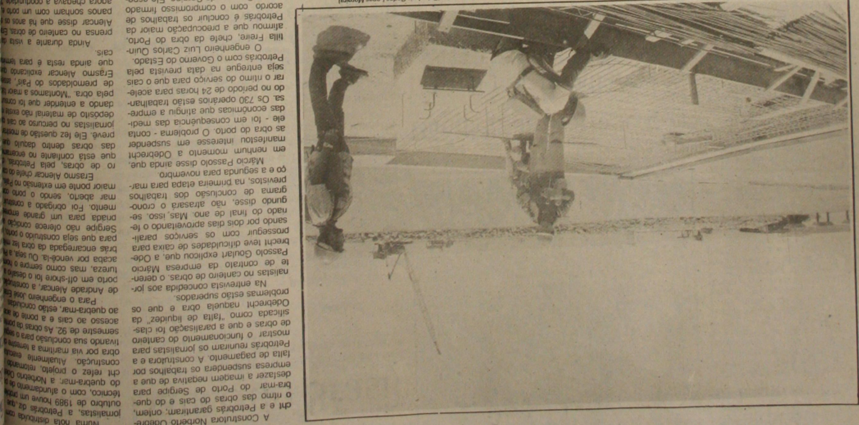
Os operários trabalham em ritmo acelerado para concluir as obras do cais do porto e do quebra-mar no prazo previsto pela Odebrecht.