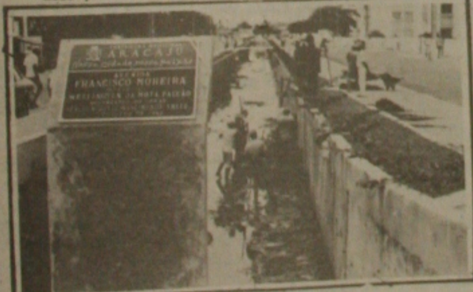
Trabalhadores limpam o canal para a inauguração