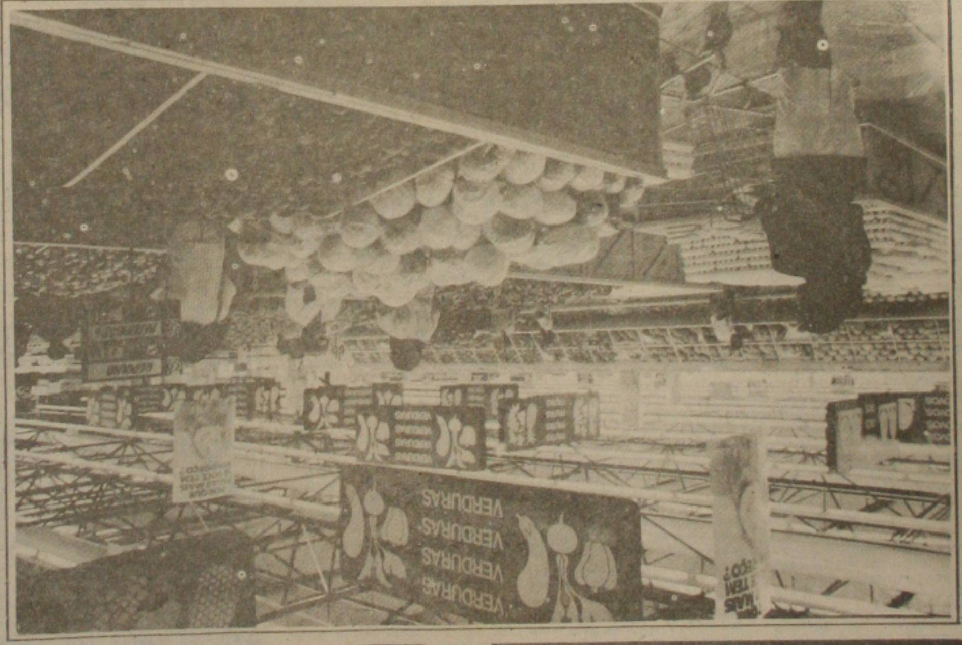
A eclosão da guerra no Golfo Pérsico já provoca uma corrida aos supermercados para fazer estoques tomando uma escassez de produtos básicos.

Com a eclosão da guerra entre o Iraque e as forças aliadas no Golfo Pérsico, a população aracajense passou a estocar gás de cozinha em suas casas, a população de outros pontos do Estado também fez o mesmo. O conflito no Golfo Pérsico já provocou uma corrida aos supermercados para fazer estoques tomando uma escassez de produtos básicos. Com a eclosão da guerra, essas vendas aumentaram assustadoramente. O período de duração da guerra não é conhecido, mas os estoques de gás de cozinha já foram verificados em algumas lojas de Aracaju. As maiores lojas foram verificadas no bairro de São José, onde se encontra o maior número de lojas de gás de cozinha. O conflito no Golfo Pérsico já provocou uma corrida aos supermercados para fazer estoques tomando uma escassez de produtos básicos. Com a eclosão da guerra, essas vendas aumentaram assustadoramente. O período de duração da guerra não é conhecido, mas os estoques de gás de cozinha já foram verificados em algumas lojas de Aracaju. As maiores lojas foram verificadas no bairro de São José, onde se encontra o maior número de lojas de gás de cozinha. O conflito no Golfo Pérsico já provocou uma corrida aos supermercados para fazer estoques tomando uma escassez de produtos básicos.