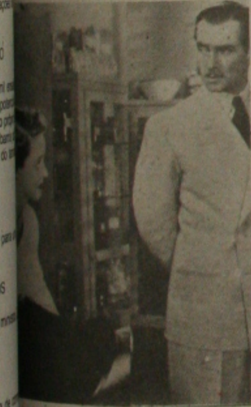
Amor e Coragem, com Bette Davis e Herbert Marshall.

AMOR E CORAGEM Titulo Original: Courage Nacionalidade: Americana Ano de Produção: 1986 Direção: Jeremy Kagan Elenco: Sophia Loren, Billy Dee Williams, Hector Elizondo