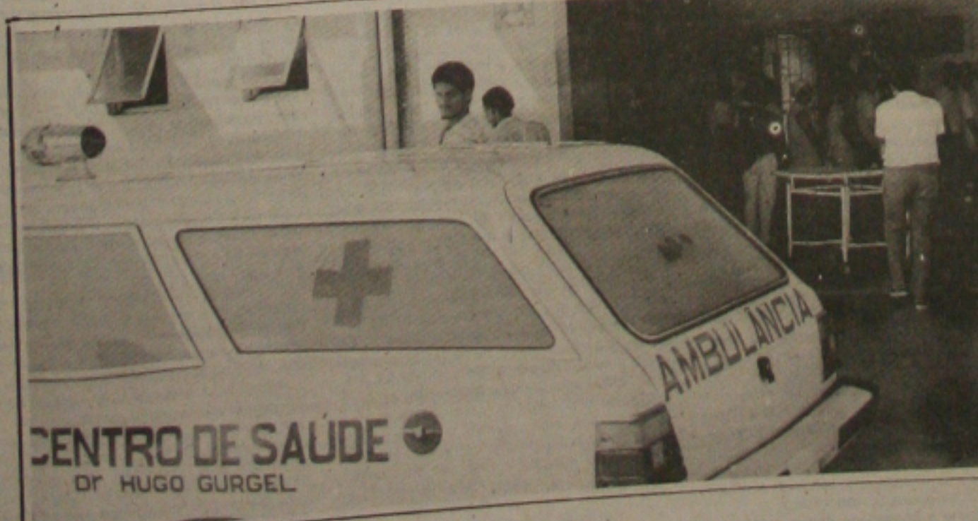
O atendimento é dos piores no Hospital João Alves. (Página 1-B).

A polícia acredita que o crime ocorreu por causa de problemas de maconha, entre ambos.