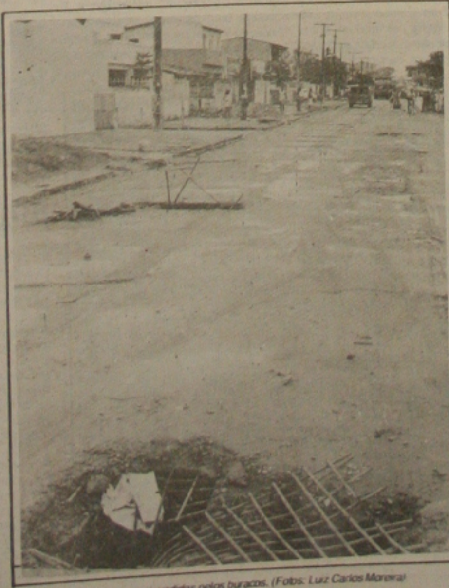
Ruas de Aracaju continuam invadidas pelos buracos.

Nas proximidades da igreja Espírito Santo uma cratera que estava tomando toda a pista, (com frente à redação da GAZETA DE SERGIPE), foi coberta com areial da praia de Atalaia e foi colocada por cima uma leve camada de asfalto. O trabalho foi tão precário que além de enterrar a poeira os motoristas estão encontrando dificuldade de circulação devido aos buracos que já começaram a surgir na pista.