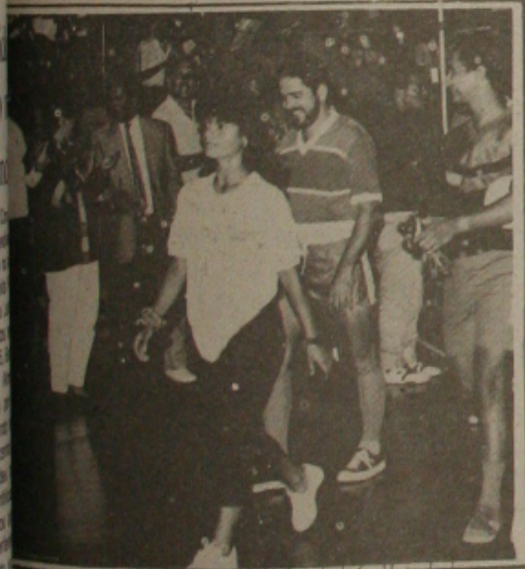
Esportes da PMA teve desfile de abertura.