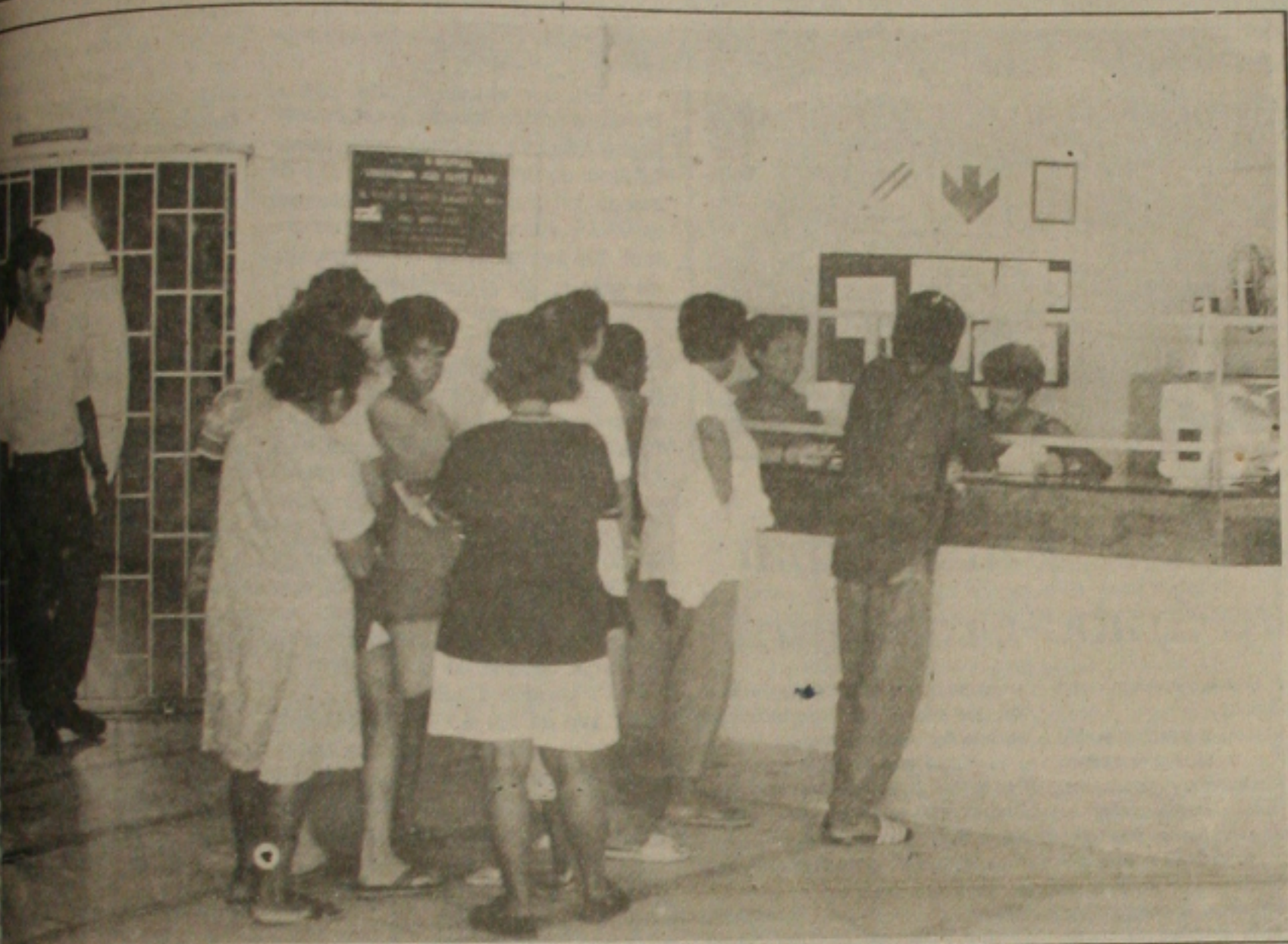
Crise no Hospital João Alves, os pacientes são encaminhados para outras unidades de saúde por falta de medicamento.

O atendimento no Hospital João Alves Filho é precário. Muitos pacientes estão sendo transferidos para outras unidades por falta de medicamento e também por falta de profissionais. São muitas as reclamações e os poucos servidores que permanecem naquela unidade de saúde dizem que nada podem fazer para melhorar o padrão de atendimento médico.