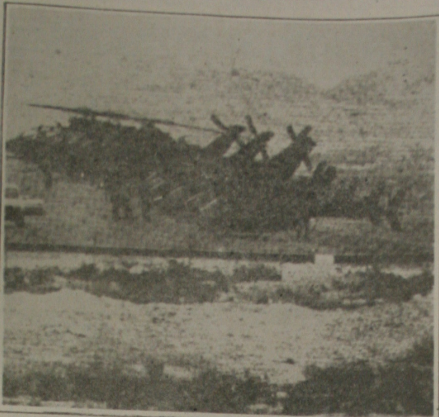
Helicópteros norte-americanos esperam o momento de entrar em combate

O esquadrão de caças entrou em ação horas depois do parlamento italiano ter dado autorização para que seu contingente aéreo se unisse à operação "Tormenta no Deserto", sob a liderança dos Estados Unidos. A Força Aérea Italiana não entra em ação desde 1943. Quando a Itália se rendeu durante a Segunda Guerra Mundial. Ela só estiveram envolvidas na força multinacional no Oriente, junto com efetivos dos Estados Unidos,