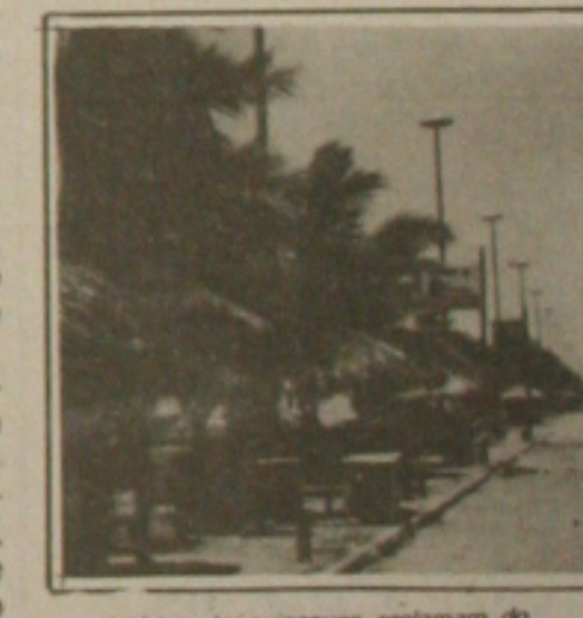
Proprietários de quiosques reclamam do fraco movimento.

As praias que banham Aracaju são os principais locais visitados pelos estudantes no período de férias esco- lares. O movimento que já era grande,