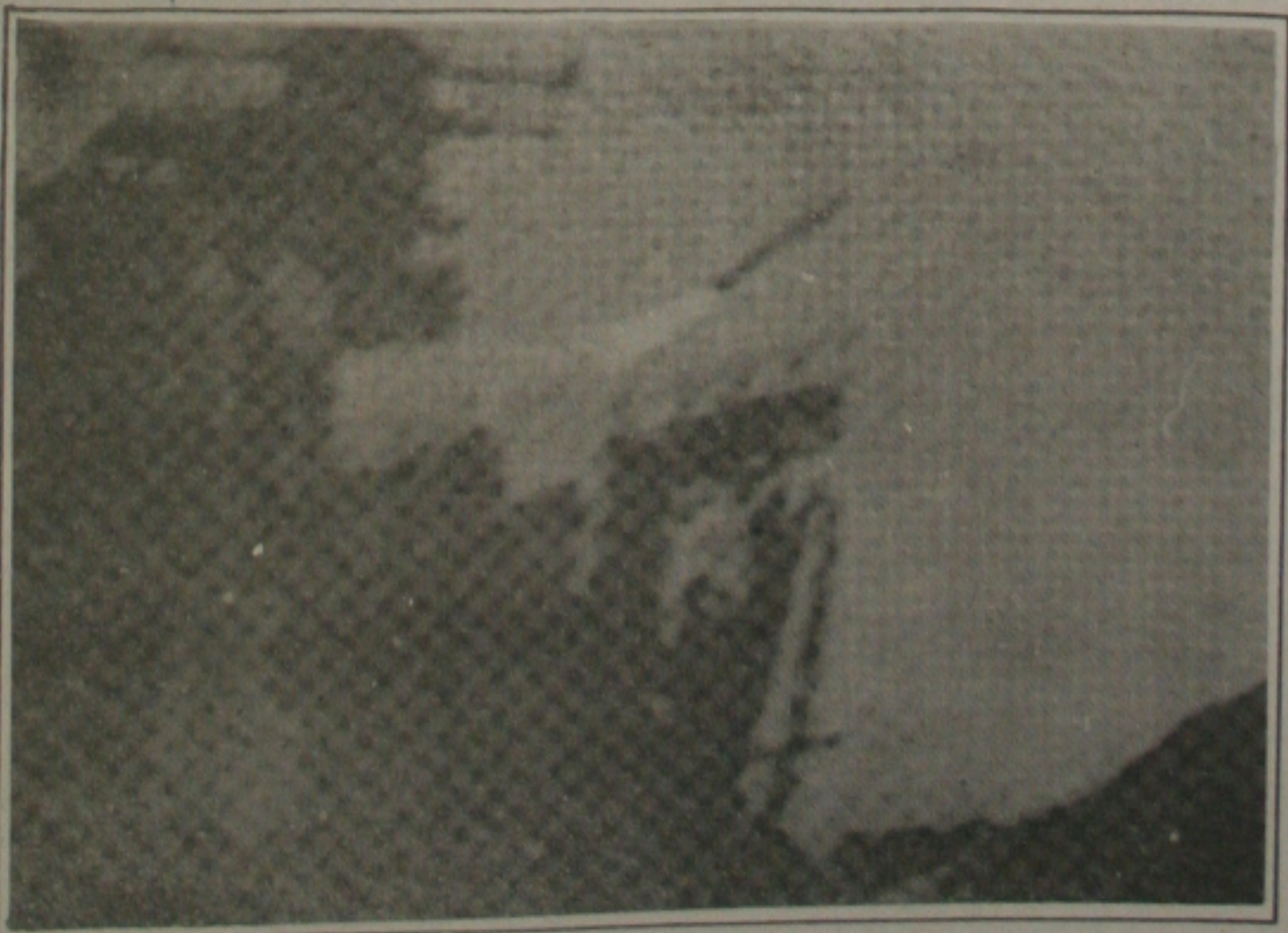
Um míssil disparado de um navio norte-americano durante os ataques ao Iraque e Kuwait.

O primeiro-ministro da Espanha, Felipe Gonzalez, declarou no Parlamento que o ataque iraquiano é uma tentativa de incitar Israel a se envolver na guerra e de dividir a aliança internacional formada contra o Iraque. "A Espanha, juntamente com a Comunidade Internacional, é contra uma ação em represália israelense, mas reconhecemos o legítimo direito de Israel de agir em defesa da pátria", declarou.