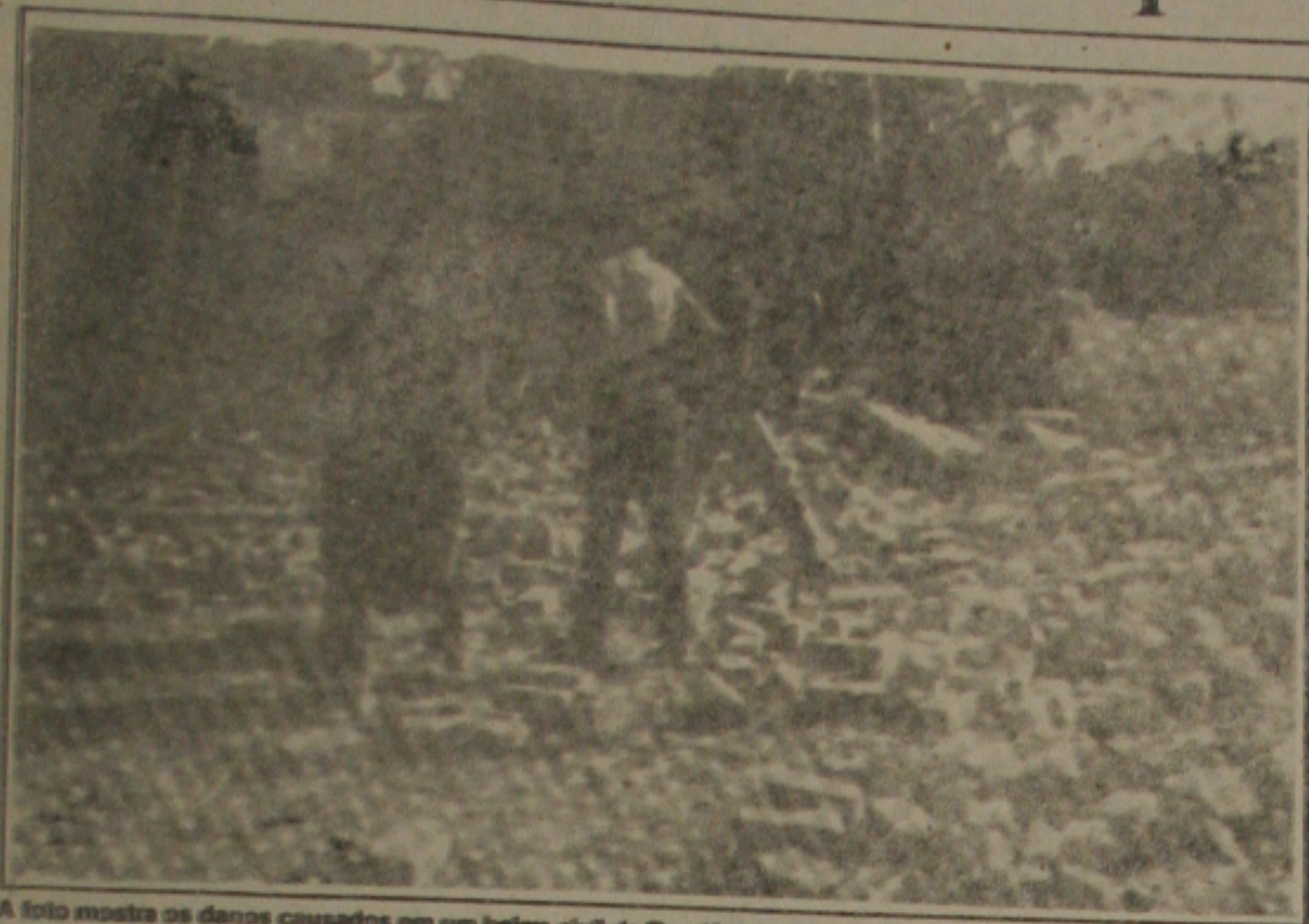
A foto mostra os danos causados em um abrigo civil de Bagdá pelos bombardeios aliados

NAÇÕES UNIDAS - O Iraque acusou ontem os Estados Unidos e seus aliados de provocar a morte de mais de 320 pessoas e ferimentos em cerca de 400, em menos de uma semana de ataques militares contra alvos civis, econômicos e religiosos do país. A acusação consta de uma carta enviada pelo governo iraquiano à Organização das Nações Unidas. Segundo a denúncia, o maior número de baixas civis ocorreu no dia 21 de janeiro, quando 144 pessoas morreram e 24 ficaram feridas no bombardeio às cidades sagradas de Najaf e Kufa, a 144 quilômetros de Bagdá.