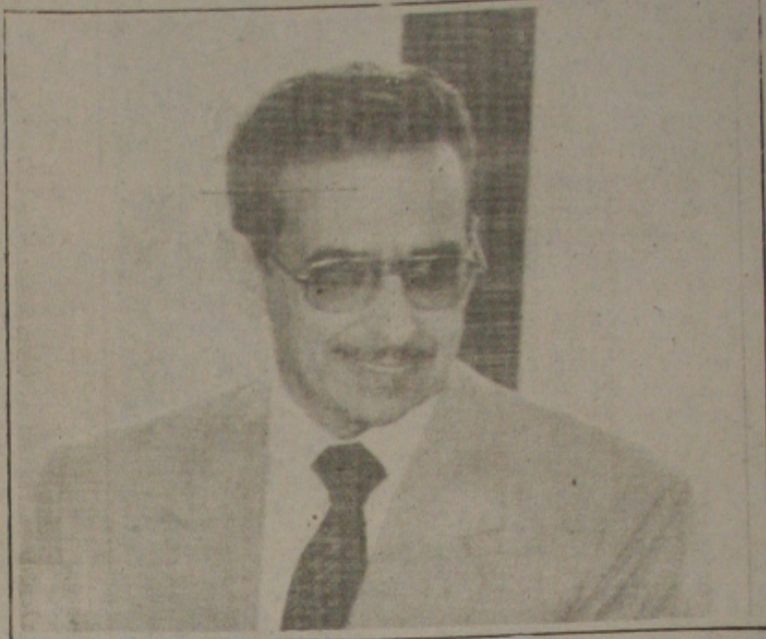
Comandante em Chefe do Exército Carlos Tinoco.

O Exército dispôs cerca de 42 mil conscritos com um mês de antecedência, comprometendo 20% do adiantamento de soldado, para fazer uma economia de aproximadamente Cr$ 2 bilhões. Ou como reduzir os expedien-