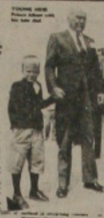
Prince Albert von Thurn und Taxis, 7, is the richest kid in the world. He just inherited $3.4 billion from his father, Prince Johannes von Thurn und Taxis, who died last December.

Meet the richest little kid in the world - 7-year-old Prince Albert von Thurn und Taxis. He just inherited $3.4 billion. The little Prince von Thurn und Taxis is the richest kid in the world. He just inherited $3.4 billion from his father, Prince Johannes von Thurn und Taxis, who died last December. The prince is the son of Prince Johannes and Princess Gloria. He is the only child of the prince and princess. The prince is the richest kid in the world. He just inherited $3.4 billion from his father, Prince Johannes von Thurn und Taxis, who died last December. The prince is the son of Prince Johannes and Princess Gloria. He is the only child of the prince and princess.