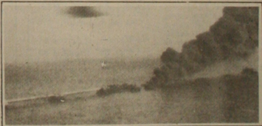
O fogo destrói o terminal Ahmadi, na Ilha do Mar, no Kuwait, após os bombardeios das tropas multinacionais.

O Iraque afirma que atacou três posições militares aliadas e avançou vinte quilômetros em território da Arábia Saudita. O comando militar iraquiano considera uma vitória por ter resistido durante treze dias de bombardeios aéreos, e, segundo ainda fontes do Governo do Iraque, um piloto é mandado como escudo humano, após a captura em um dos ataques das tropas aliadas.