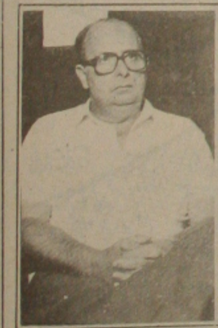
O senador Francisco Rollemberg