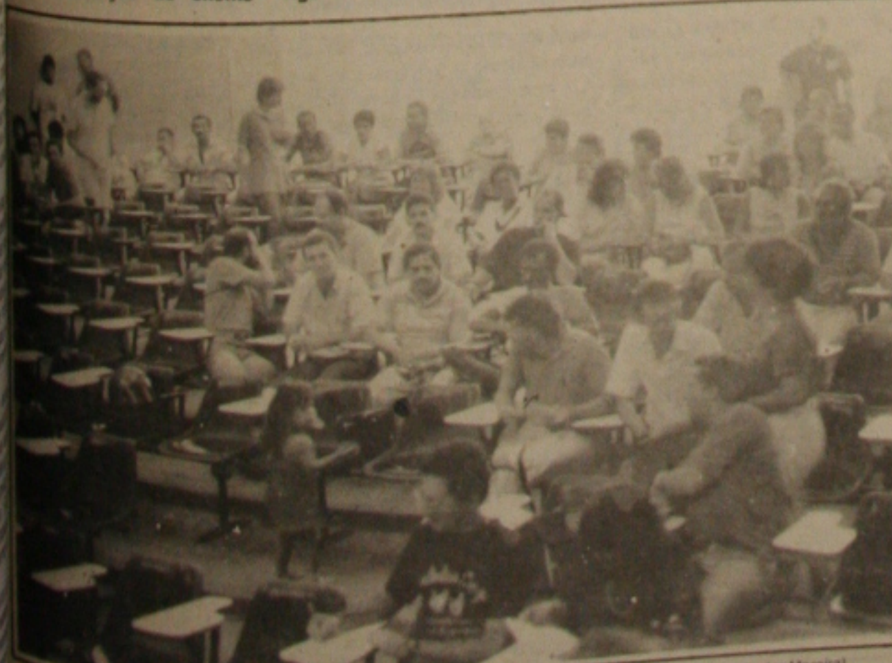
Os servidores da UFS querem brigar pela manutenção do turno de seis horas diárias, mesmo contra a lei.