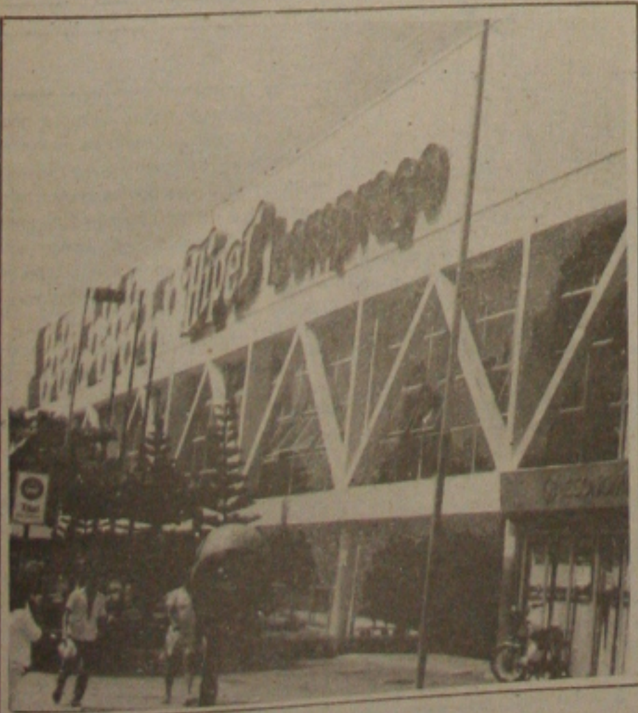
O vigilante morto trabalhava nessa loja do Bompreço