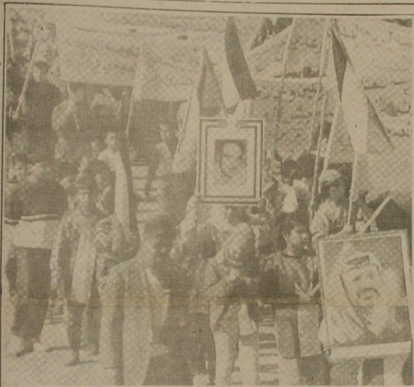
Os palestinos desfilam pelas principais ruas do Líbano, com os retratos de Yasser Arafat e Abu Yyad em apoio ao presidente do Iraque, Saddam Hussein.

O secretário de imprensa do Sindicato disse que em dezembro as demissões chegaram a 356, ficando a maior fatia com as empresas de Sergipe Industrial, Indústria e Comércio, e por enquanto não há previsão de recuperação econômica, pelo menos, a curto prazo, pois alguns setores ainda estão em recessão e metade da capacidade produtiva.