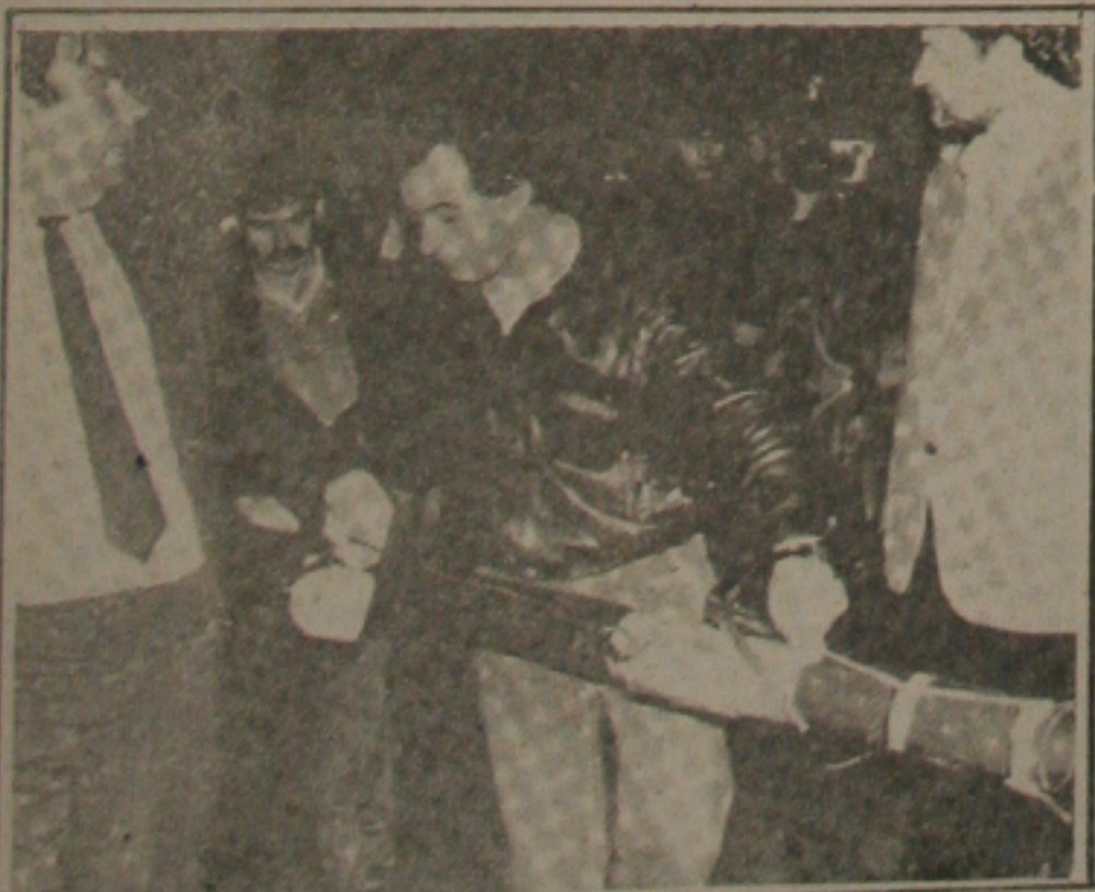
Polícia inspeciona uma bazuca utilizada em atentado na Grécia

Em Ancara, na Turquia, uma bomba explodiu do lado de fora de uma coletoria de impostos no início da manhã de ontem, quebrando muitas janelas, mas sem causar vítimas. A Polícia acredita que o atentado foi obra de extremistas de esquerda.