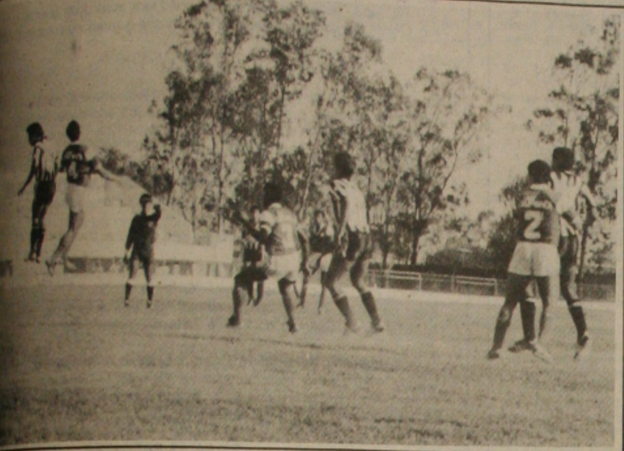
Quarta volta a lutar hoje no Constância.