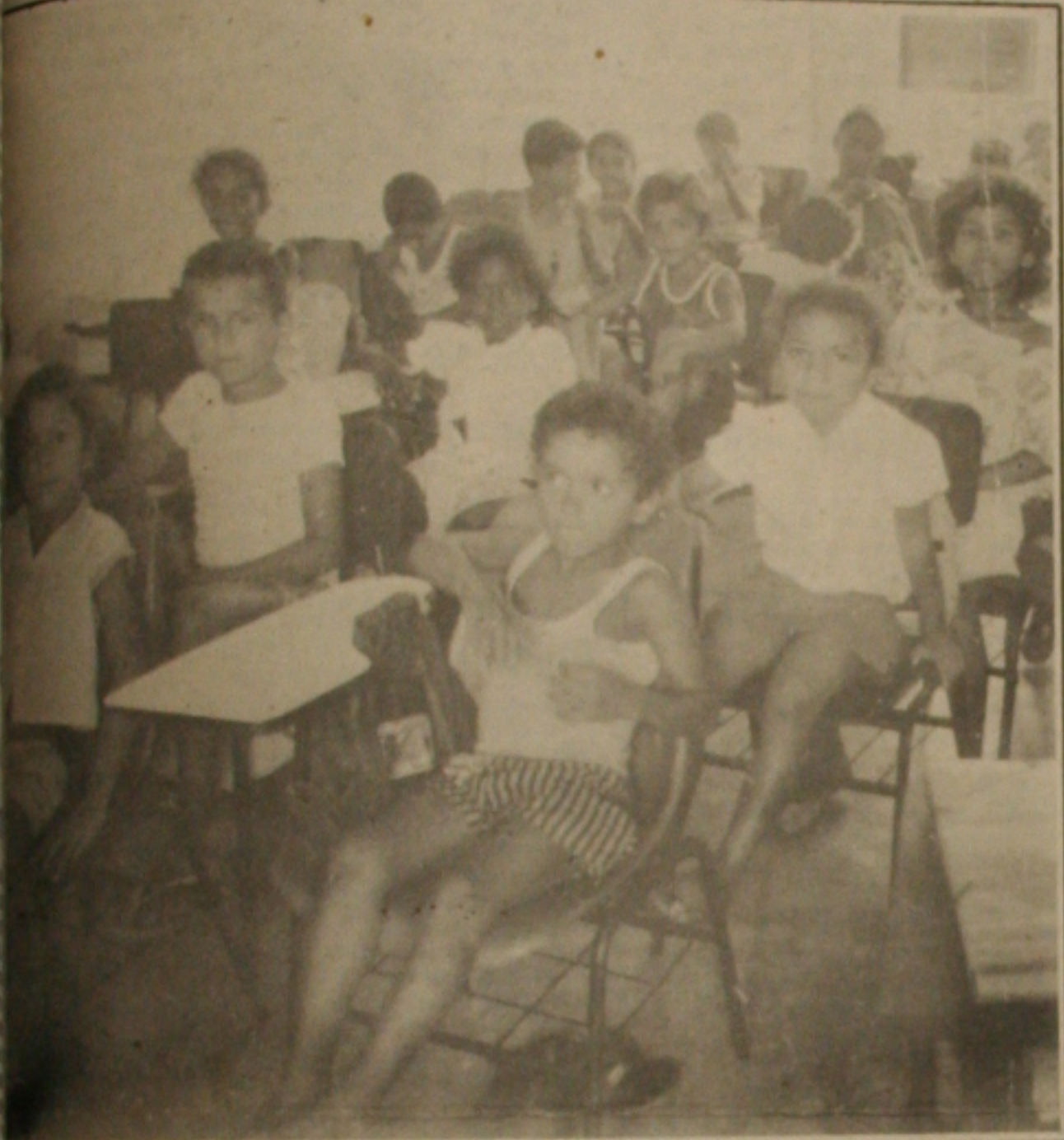
Em 18 de fevereiro, as 102 escolas da Rede Municipal estarão iniciando as atividades do primeiro semestre.

Em outra visão, existe também a deteriorização cada vez mais crescente do ensino público. Esse problema atualmente tão questionado, sendo considerado um dos temas imprescindíveis nas pautas colocadas em discussões por vários segmentos da sociedade, continua pelo que se pode observar a longo prazo sem solução imediata. Os políticos que colocam a questão da educação como prioridade em seus comícios durante as campanhas eleitorais e aqueles que estão à frente das principais decisões para o progresso, desenvolvimento e, principalmente, para os problemas que afligem as camadas mais carentes da sociedade, precisam se conscientizar de que não há preço para educação, nem sacrifício que a impeça de ser colocada à disposição de todos sem distinção. Basta, no entanto, que priorizem em suas medidas e decisões o bem estar social.