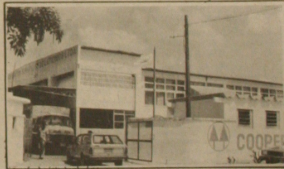
O leite vendido pelos ambulantes é processado pelas usinas de beneficiamento.

O comportamento desses pais se deve aos preços do material escolar que estão elevados. Mas o que mais atrapalhou as matrículas nas escolas particulares foi o calendário da escola pública. Muitos pais correm para a iniciativa privada somente em último caso, enquanto não conseguem vagas na escola da rede pública.