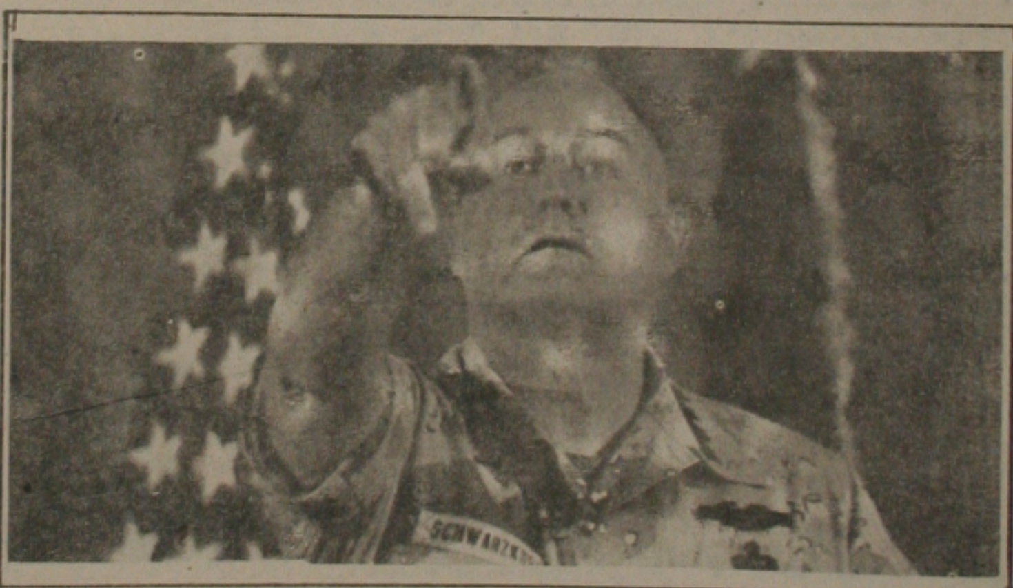
Comandante das Forças Armadas dos EUA, general Norman Schwarzkopf, é o responsável pela atuação aliada