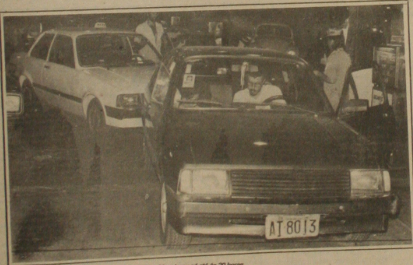
As filas nos postos de gasolina eram quilométricas. Mas durou só até às 20 horas.

BRASÍLIA - Dez meses e meio depois de lançar o plano de estabilização com o qual pretendia derrotar de uma só vez a inflação, o Governo anunciou ontem um novo pacote econômico, com o congelamento de preços por tempo indeterminado, feriado bancário hoje, mudanças nas regras de reajustes salariais e fim do overnight, da BTN e de todas as formas de indexação. Ao mesmo tempo, anunciou aumentos de 46,78% para gasolina e álcool, 60% para o gás de cozinha, além de reajustes para energia elétrica, correios e outras tarifas públicas. O objetivo é combater a inflação, que no mês passado chegou a 20,21%, conforme divulgou ontem o IBGE.