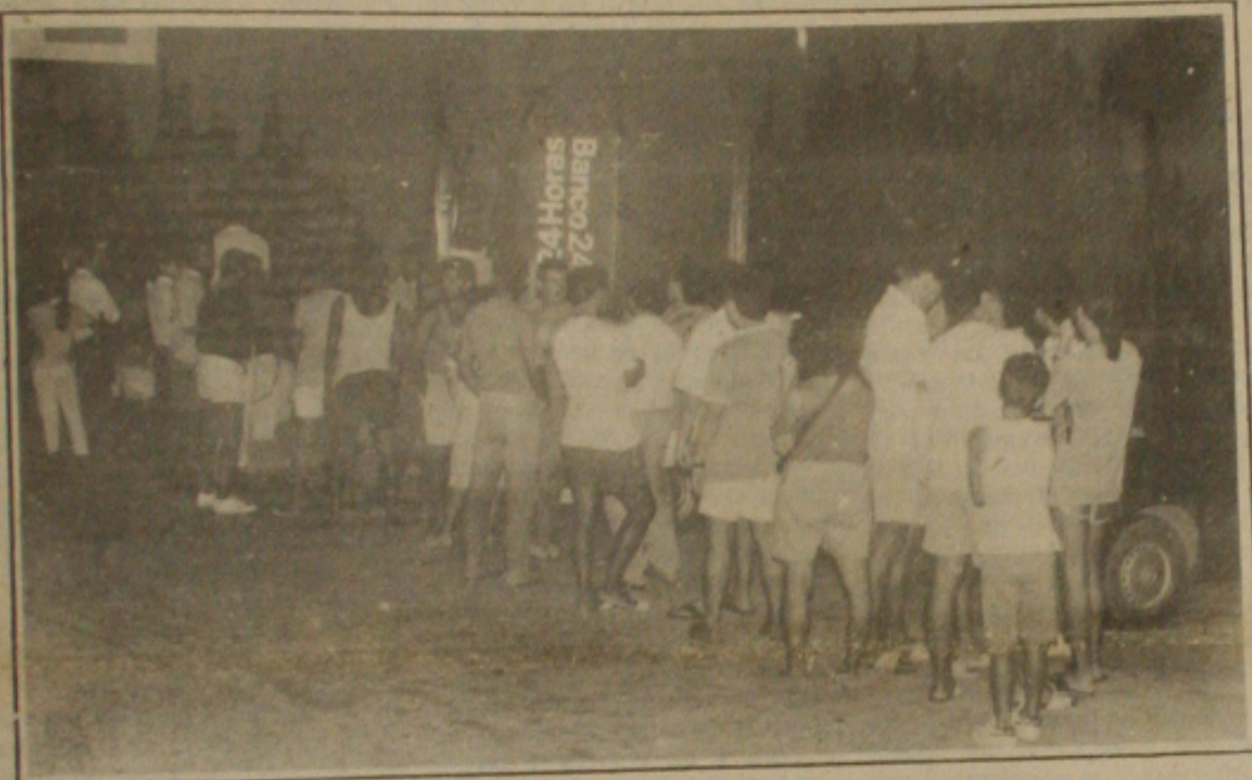
Os bancos eletrônicos tiveram uma grande movimentação para saques de emergência.