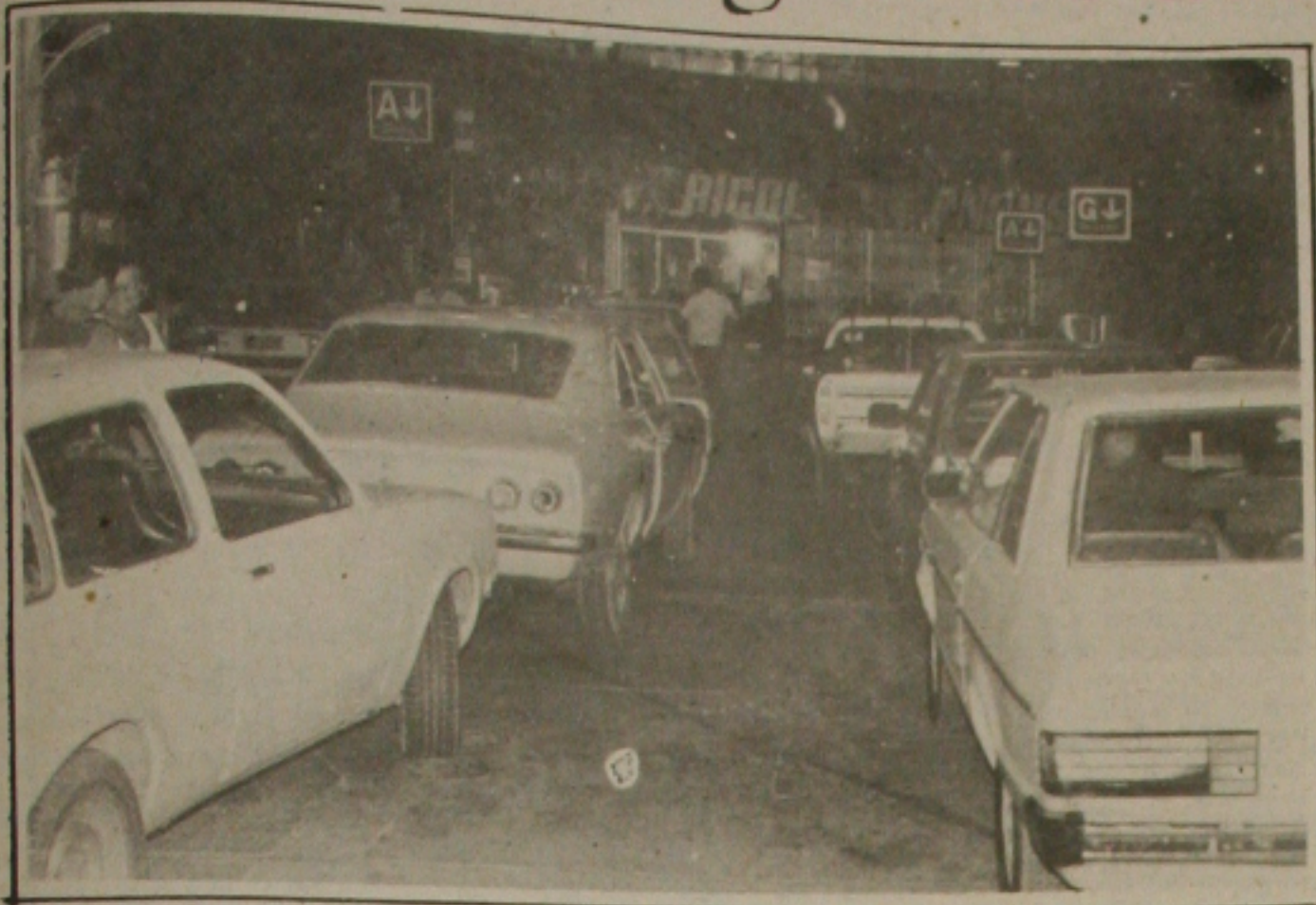
O anúncio do aumento dos combustíveis resultou em filas nos postos.