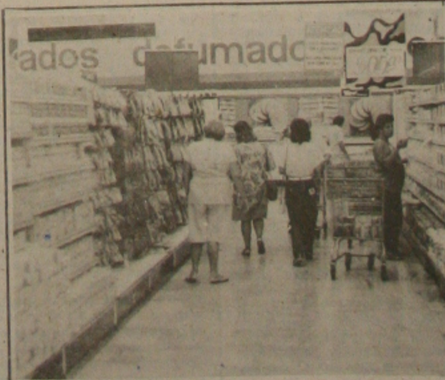
Pressão da indústria eleva preços nos supermercados

O presidente da Associação dos Supermercados chamou a atenção da produção do sentido de que todos compreendam que os preços não são remarcados por uma atitude isolada dos proprietários de supermercados. "Nós somos apenas prestadores de serviços e somente remarcamos nossos produtos quando as indústrias aumentam seus preços", finalizou.