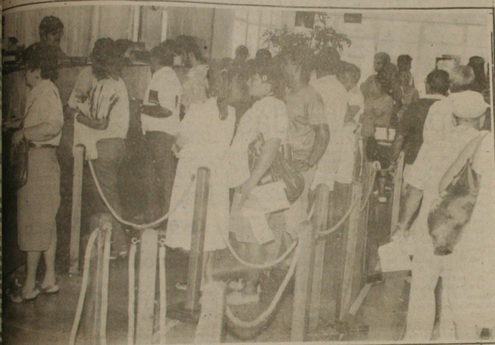
Proprietários de veículos que desejaram pagar o IPVA no último dia, foram obrigados a enfrentar longas filas nas agências do Banese