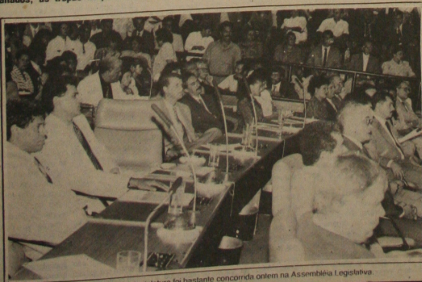
A solenidade de instalação da nova legislatura foi bastante concorrida ontem na Assembléia Legislativa.