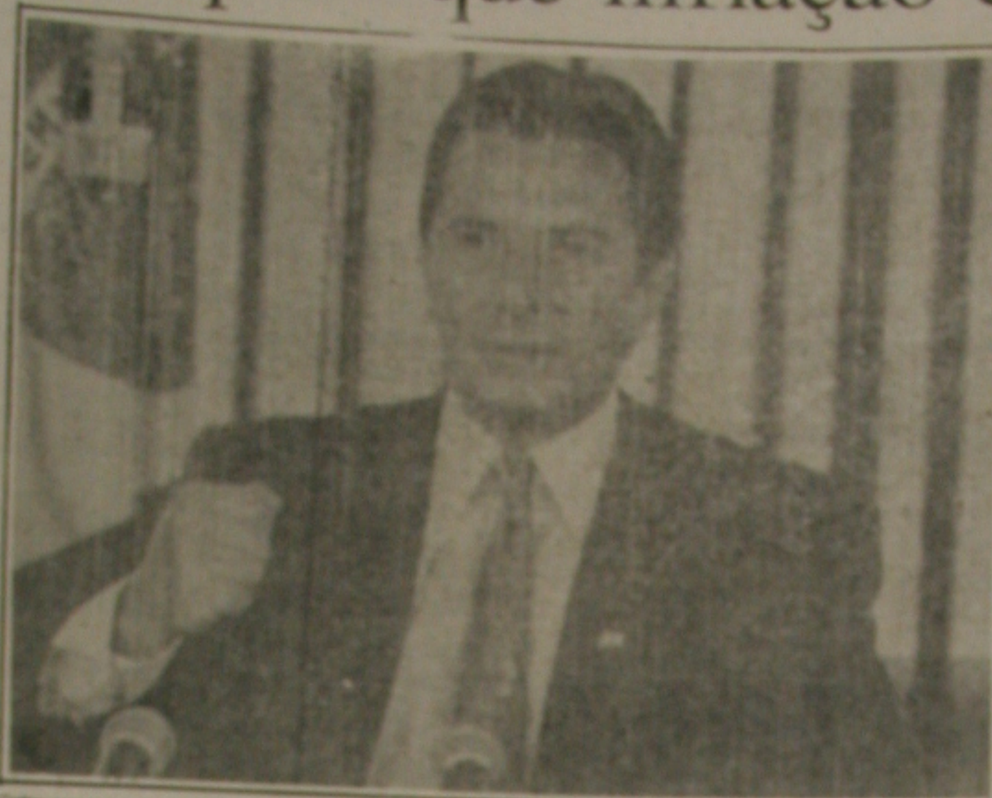
Collor: expectativa da queda da inflação no mês de março próximo.

BRASÍLIA - Surpreendidas e ainda atordoadas pela edição do segundo plano econômico do Governo Collor, sobre o qual não foram consultadas, as principais lideranças dos partidos ligados ao Palácio do Planalto no novo Congresso movimentaram-se ontem para apoiar o plano, mas com uma ressalva: ao contrário do que ocorreu no Plano Collor, alguns líderes acham que não há chance para pedir aos parlamentares que antes tomaram posse para que não apresentem emendas às medidas e acreditem que algumas delas poderão ser objeto de modificações. Apesar do apoio, houve crítica a forma de encaminhamento das medidas ao Congresso e a pontos como o congelamento.