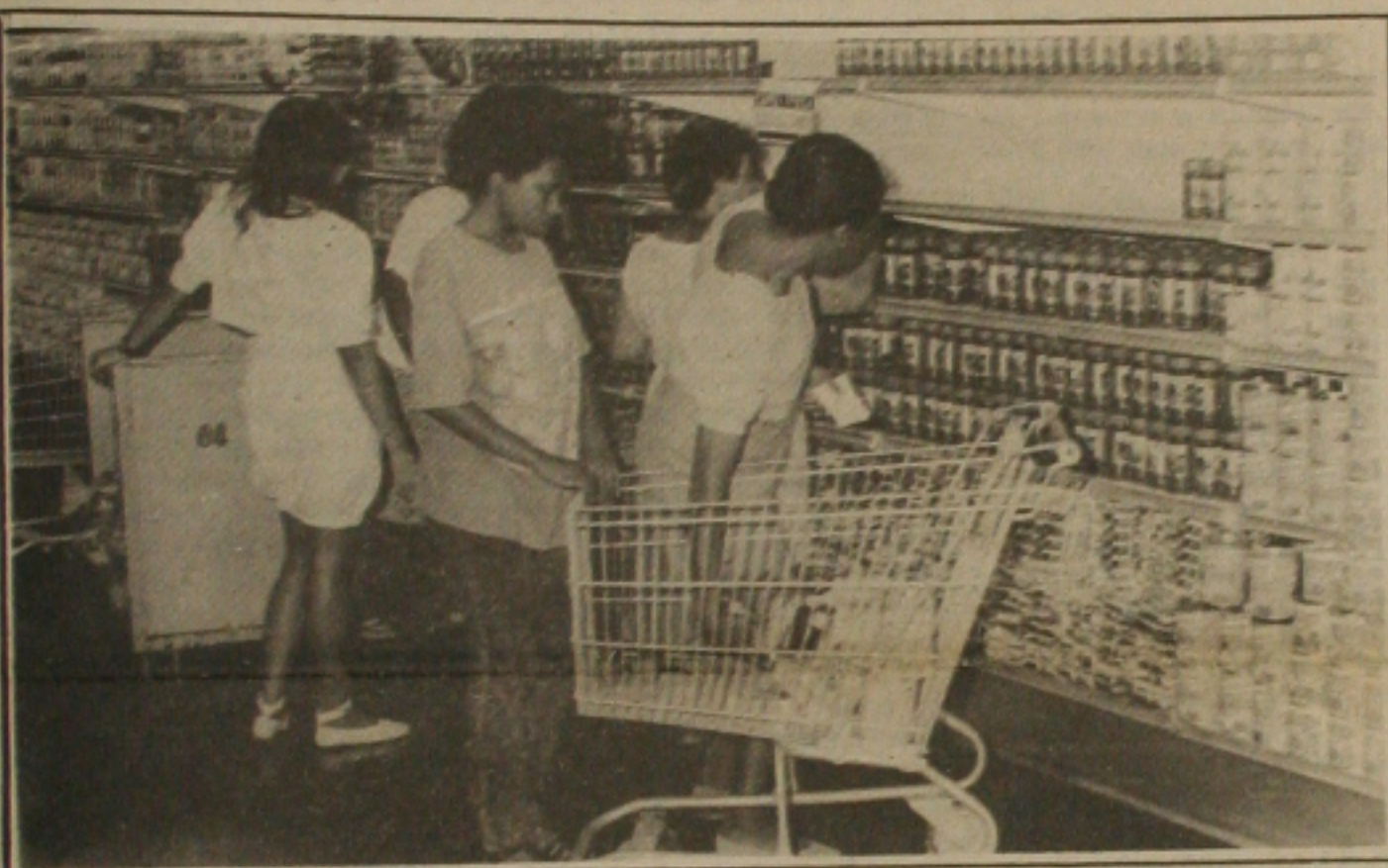
O anúncio do congelamento de preços não motivou a corrida de consumidores aos supermercados em Aracaju.