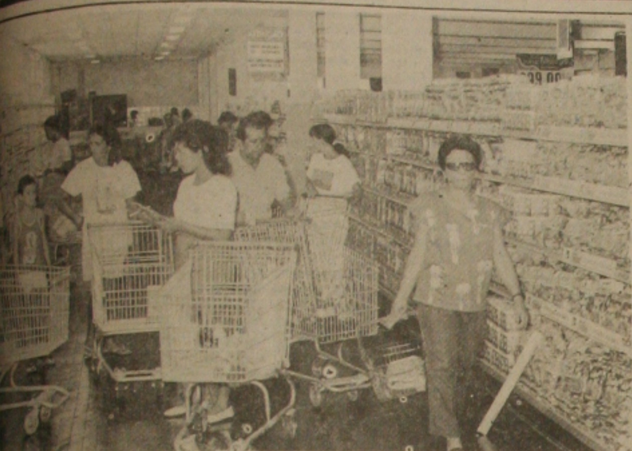
As novas medidas adotadas pelo Governo Federal, o movimento no supermercado manteve-se inalterado se comparado com os preços. (Foto: André Moreira).