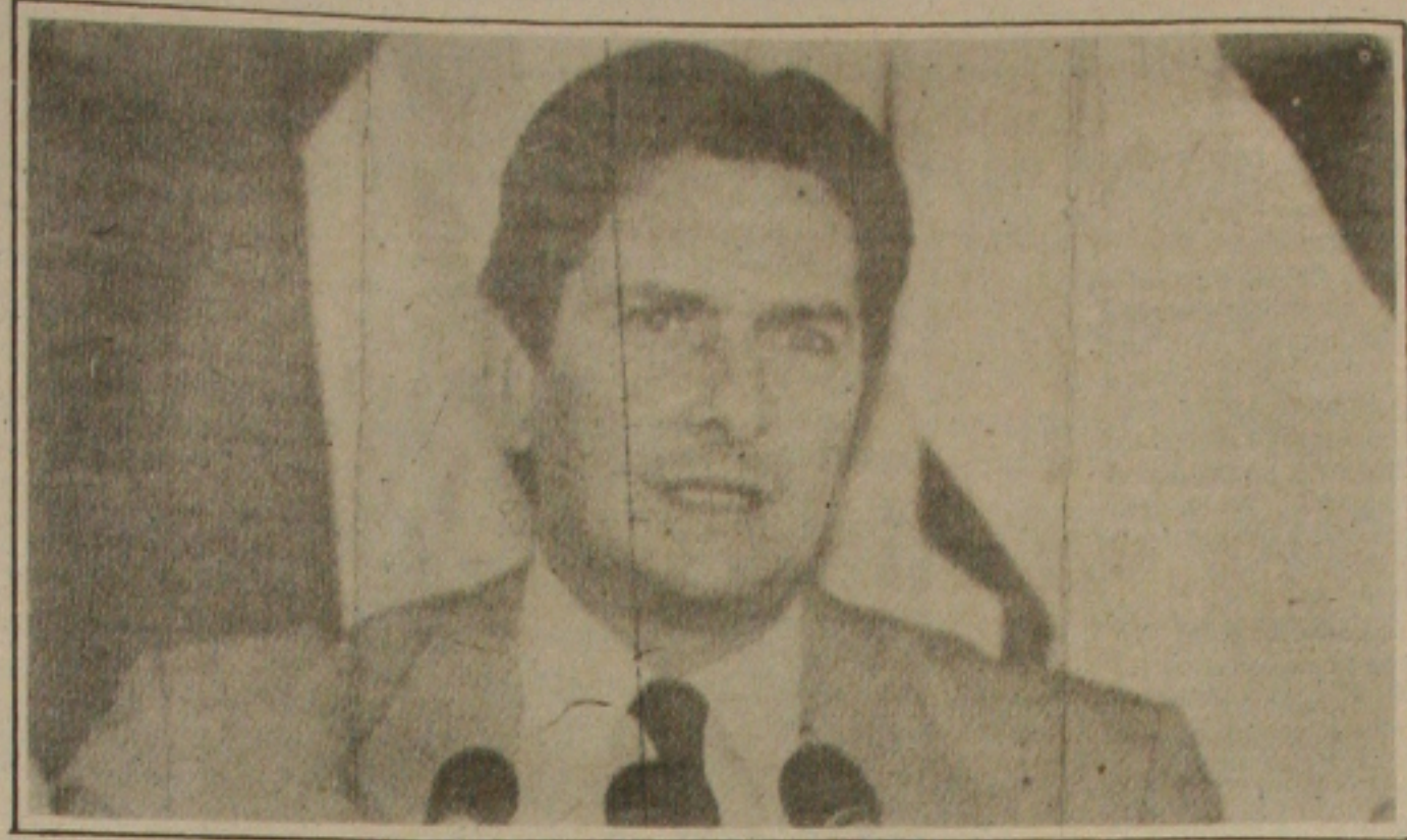
Collor vai hoje a TV explicar o pacote.