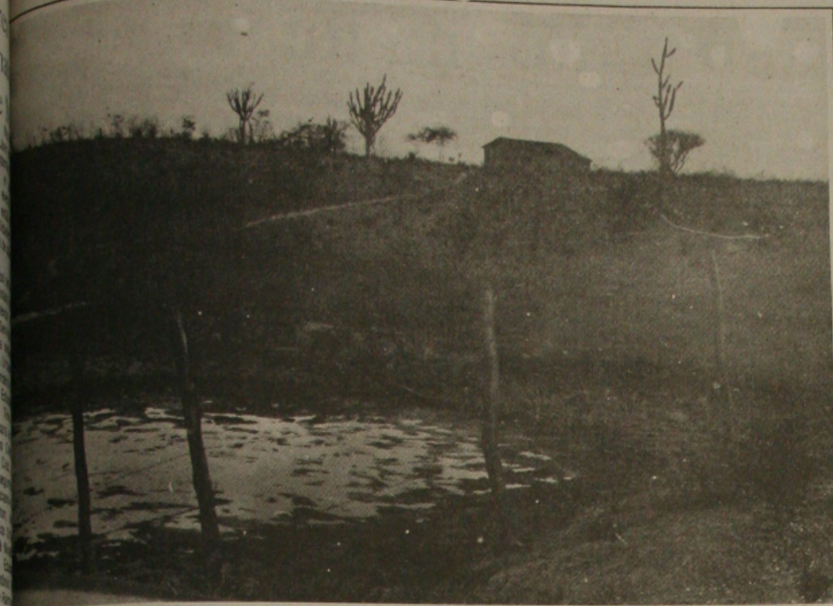
A estiagem transforma os lanques em crateras levando o desespero para o sertanejo que sofre com a falta de alimento na região.

Trabalhadores e produtores rurais do sertão sergipano estão preocupados com a situação em que se encontra a região, sem chuva para fazer abastecimento de água. Animais estão morrendo, plantação secando e a população deixando sua terra procurando a sobrevivência em regiões ainda não atingidas pela estiagem que castiga os nordestinos.