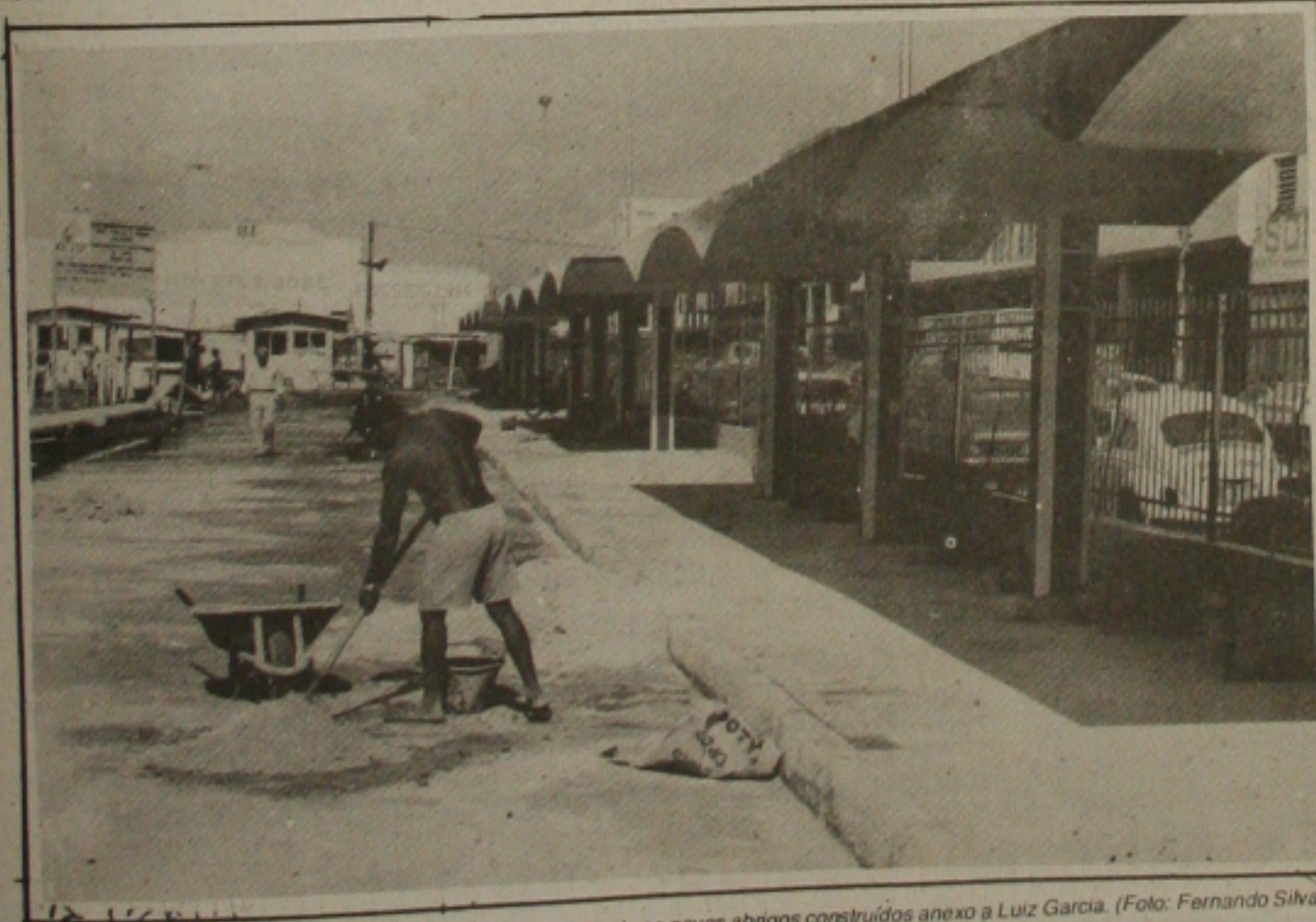
A partir da primeira quinzena de março, o DER estará recebendo os novos abrigos construídos anexo a Luiz Garcia. (Foto: Fernando Silva).

Disse ainda que os abrigos estão sendo construídos com recursos próprios do DER e serão gastos cerca de 6 milhões e 500 mil cruzeiros na obra, ressaltando que, a comunidade de um modo geral ganhará com o funcionamento dos novos abrigos anexo ao Terminal.