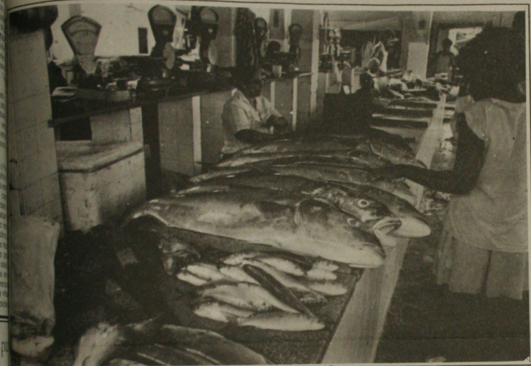
Se Ibama proibir a pesca ainda este mês, centenas de pescadores ficarão impossibilitados de desenvolver suas atividades e com isso o peixe corre o risco de faltar.