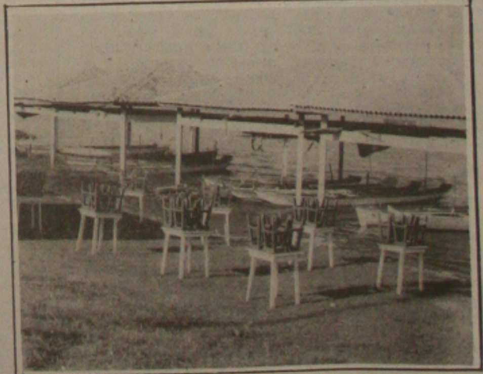
Os bonitos abrigos enfeitam, mas não protegem as canoas dos raios do sol.

sol, o que acelera o desgaste da madeira e também das redes de pesca. Os pescadores reconhecem a preocupação do governador Valadares em atender antiga reivindicação dos trabalhadores, mas reclamam que os técnicos responsáveis pelo projeto de urbanização da estrada da Atalaia, não se preocuparam em ouvi-los. Eles afirmam que se fossem consultados, recomendariam que o abrigo fosse erguido com o teto mais próximo do nível da água e o problema sena evitado. Para corrigir basta que o Governo determine o rebaixamento do teto e é o que eles estão solicitando ao governador do Estado. (Página - 1-B).