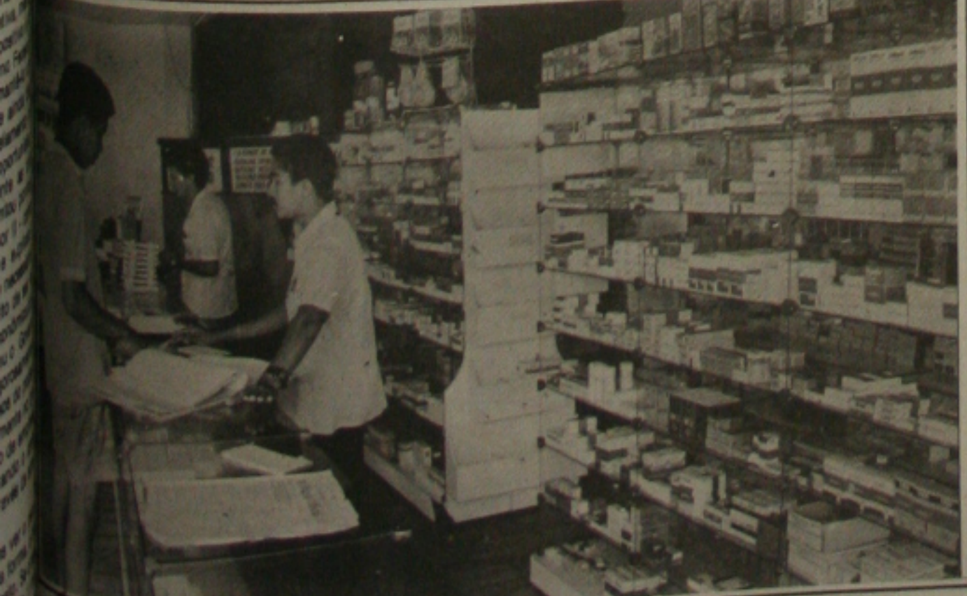
Medicamentos do Governo com redução de preços podem levar as pequenas farmácias à falência.