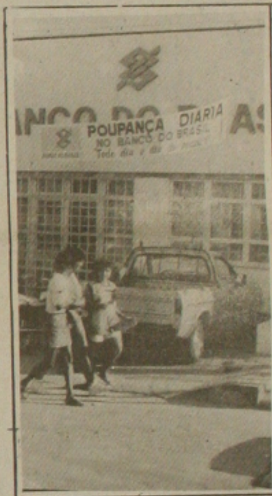
Essa agência está na mira do BB.

O superintendente afirmou que enquanto não chega qualquer orientação sobre o assunto os funcionários continuam trabalhando normalmente nas agências a serem desativadas. Ao concluir, declarou não saber quantos bancários do BB serão afetados por essa reforma administrativa da instituição.