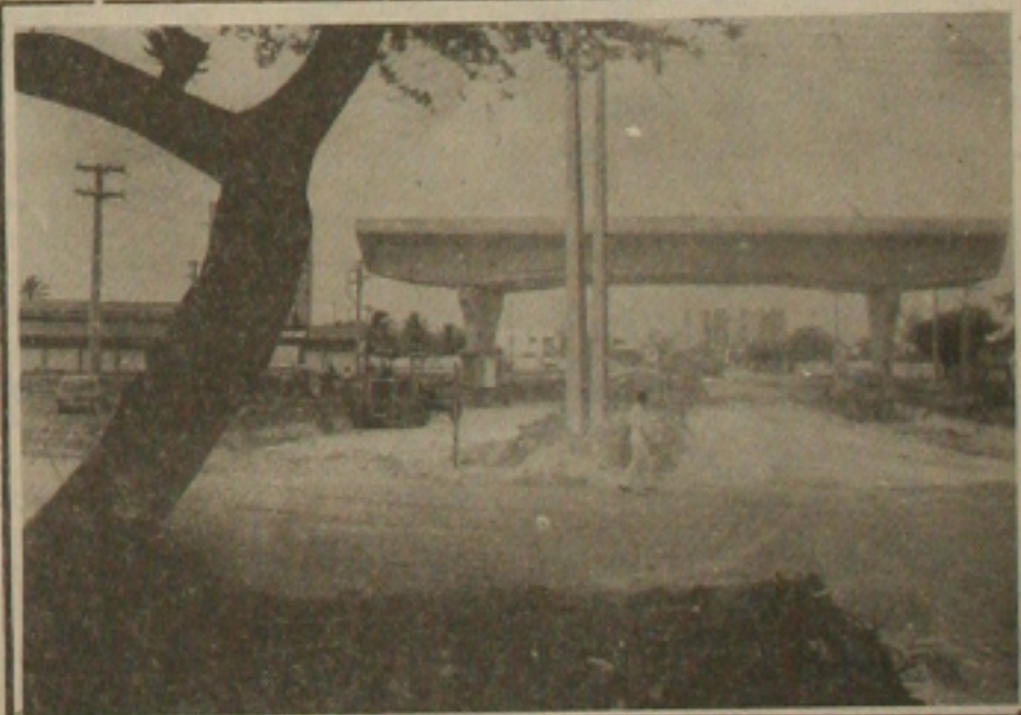
Na semana que vem o trânsito será liberado na Hermes Fontes.