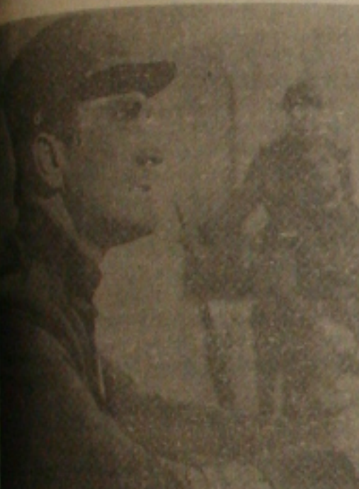
Douglas em cena de "Glória Feita de Sangue"

Direção: Americana Produção: 1983 Diretor: Tommy Lee Wallace Elenco: Tom Atkins, Stacey Nelkin, Dan O'Herlihy Esta é a terceira série iniciada em 1978 por John Carpenter. Aqui, um fabricante de máscaras preparadas para matar as pessoas no dia das bruxas.