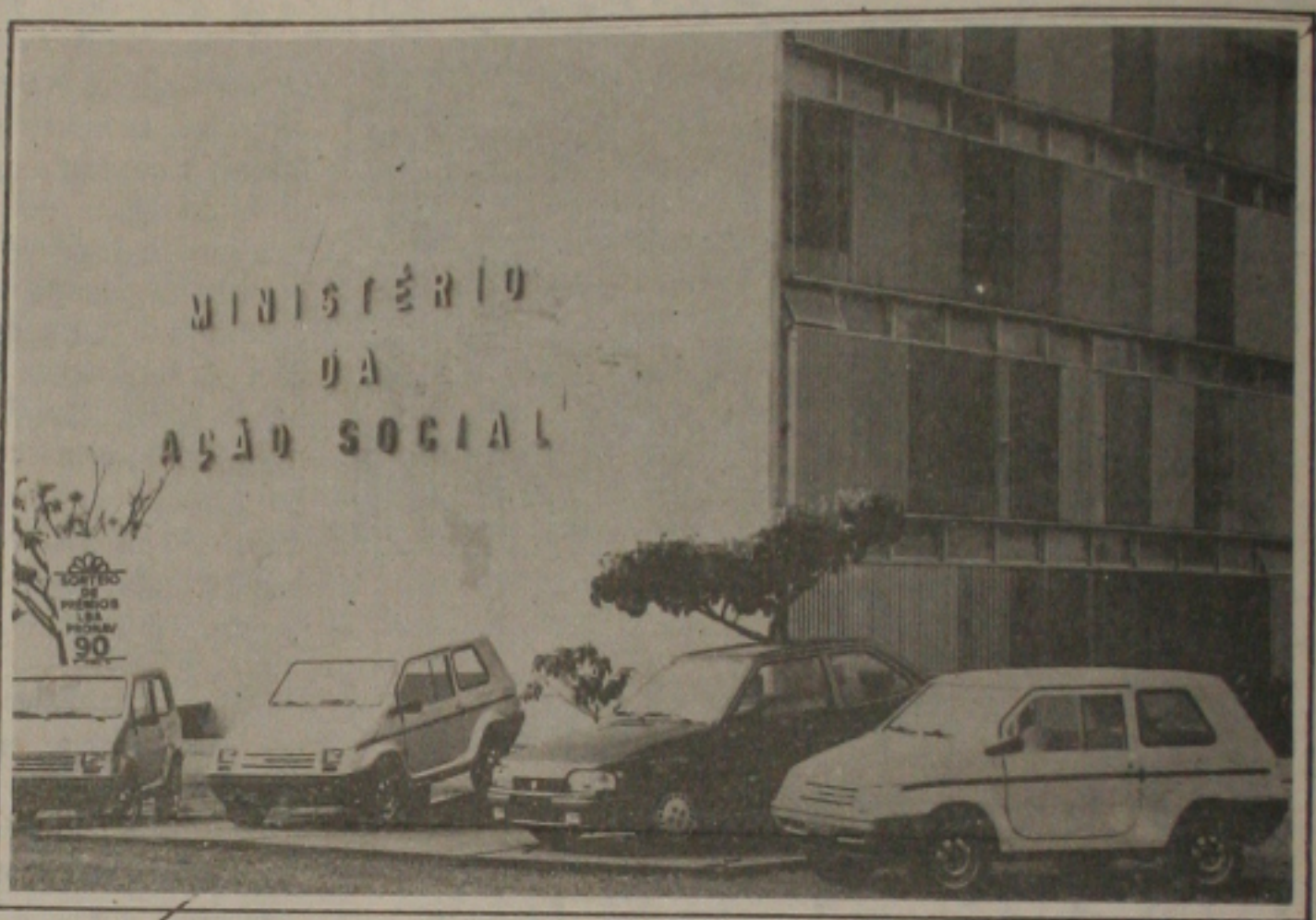
A LBA vai sortear esses quatro veículos e mais passagens aéreas no dia 26.