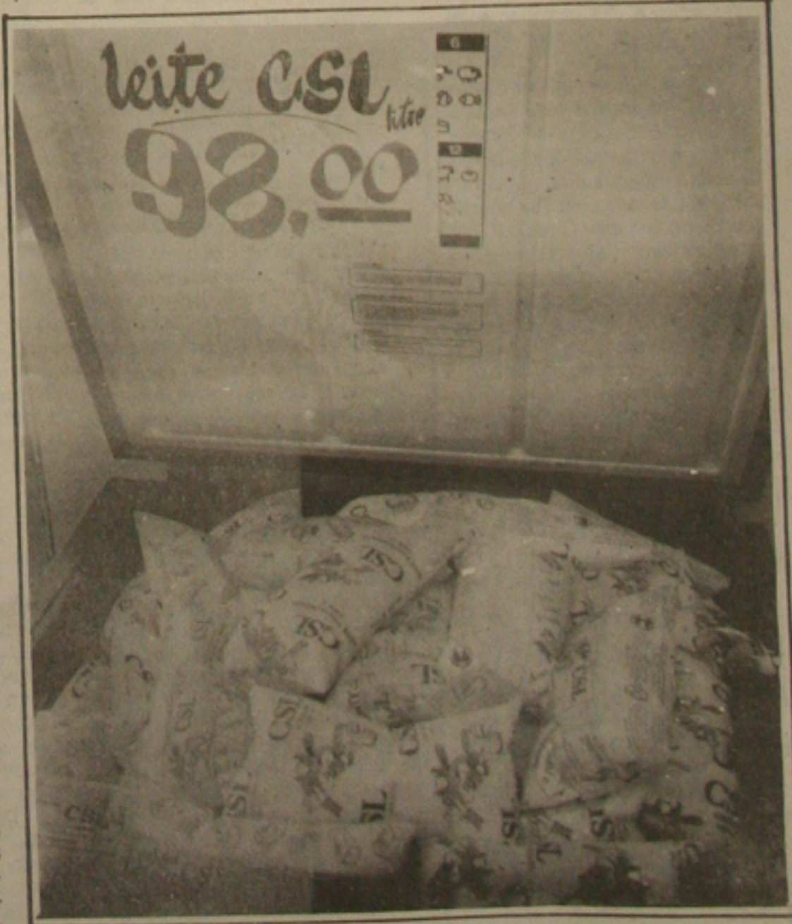
Venda de leite in natura caiu 35 por cento em Sergipe

A Betânia vende uma média de 30.000 litros de leite por dia no Estado, fornecendo ao consumidor um produto adquirido na própria bacia leiteira sergipana e está instalada no Município de Nossa Senhora da Glória.