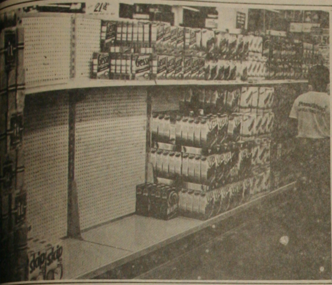
Produtos começam a faltar nos supermercados com a introdução do Plano Collor II.