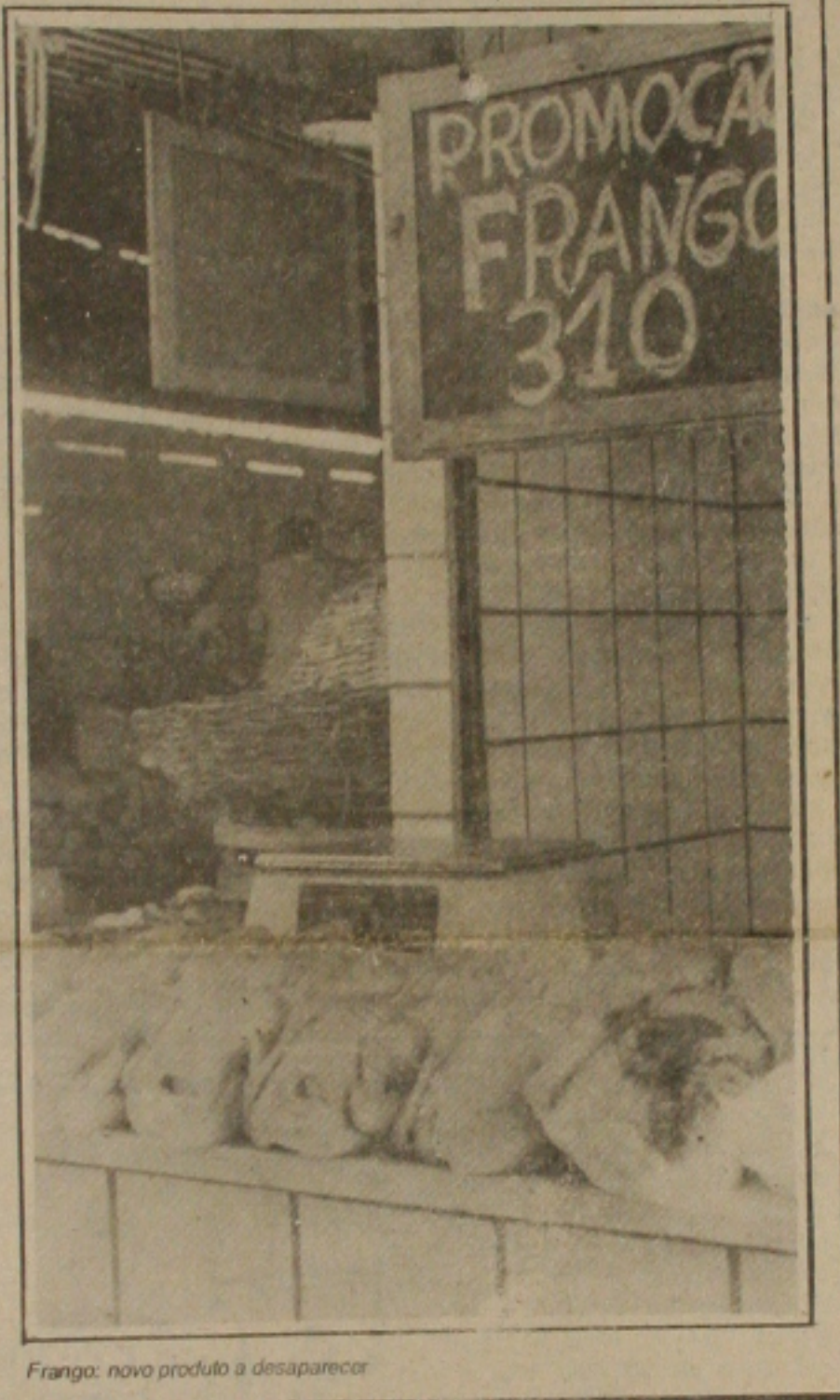
Frango: novo produto a desaparecer

zende Filho, ao acrescentar que o problema se agrava ainda mais porque há cerca de 60 dias, devido ao excesso de produção de frangos nos Estados do Sul, que passaram a exportar a preços inferiores para o Nordeste, os produtores sergipanos foram obrigados a reduzir seus plantéis em 50%. Agora com o aumento do consumo, os plantéis sergipanos são insuficientes para no momento suprir a grande demanda.