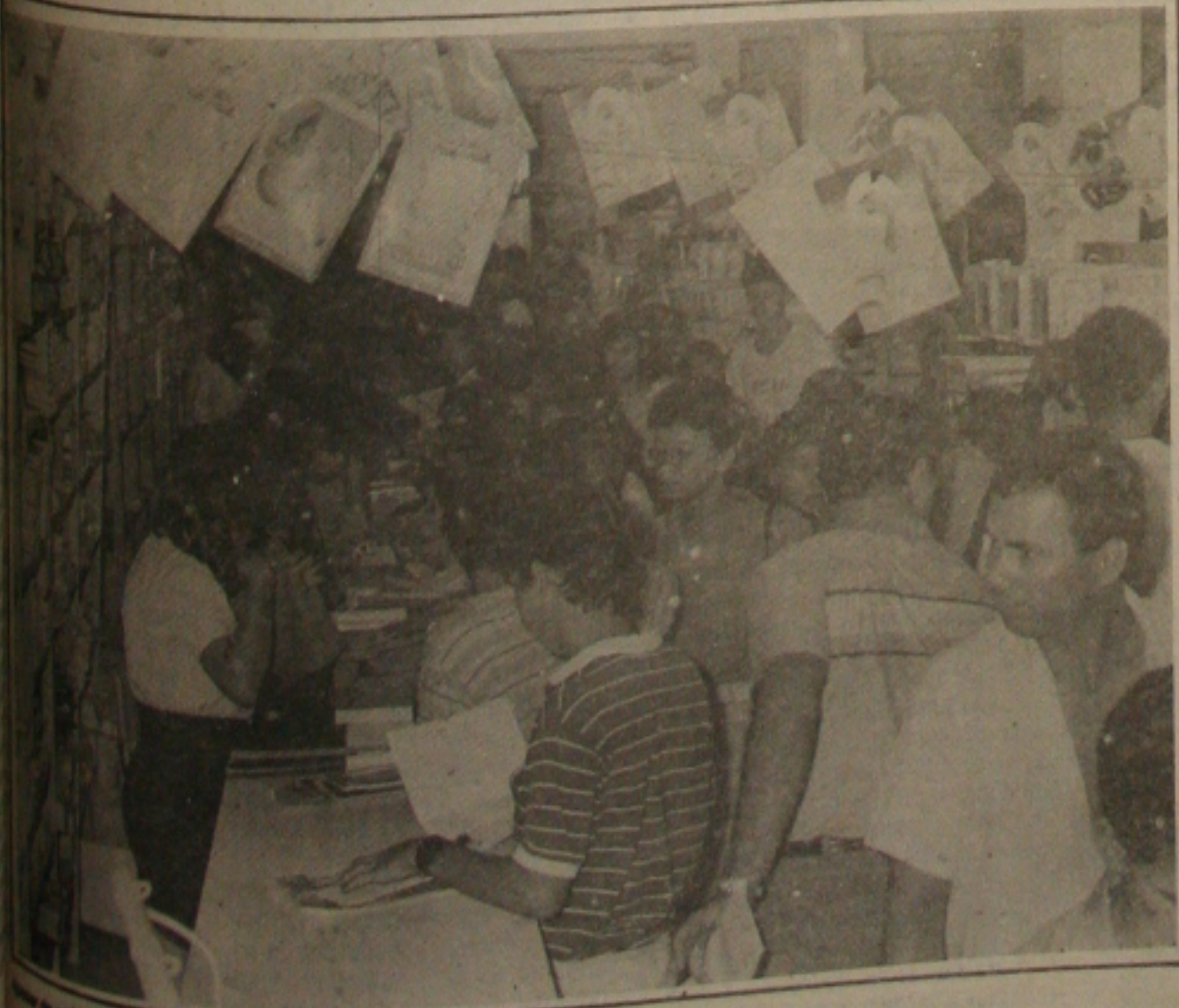
Com o início do ano letivo, as livrarias estão lotadas na volta às aulas.