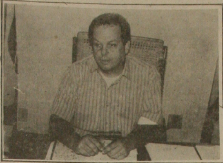
a falta de solidariedade - isto foi catalogado por quem entende de comportamento no trânsito. As pesquisas mostram que o sergipano é um mal motorista, tão péssimo que é incapaz de ser humano no trânsito, concluiu.