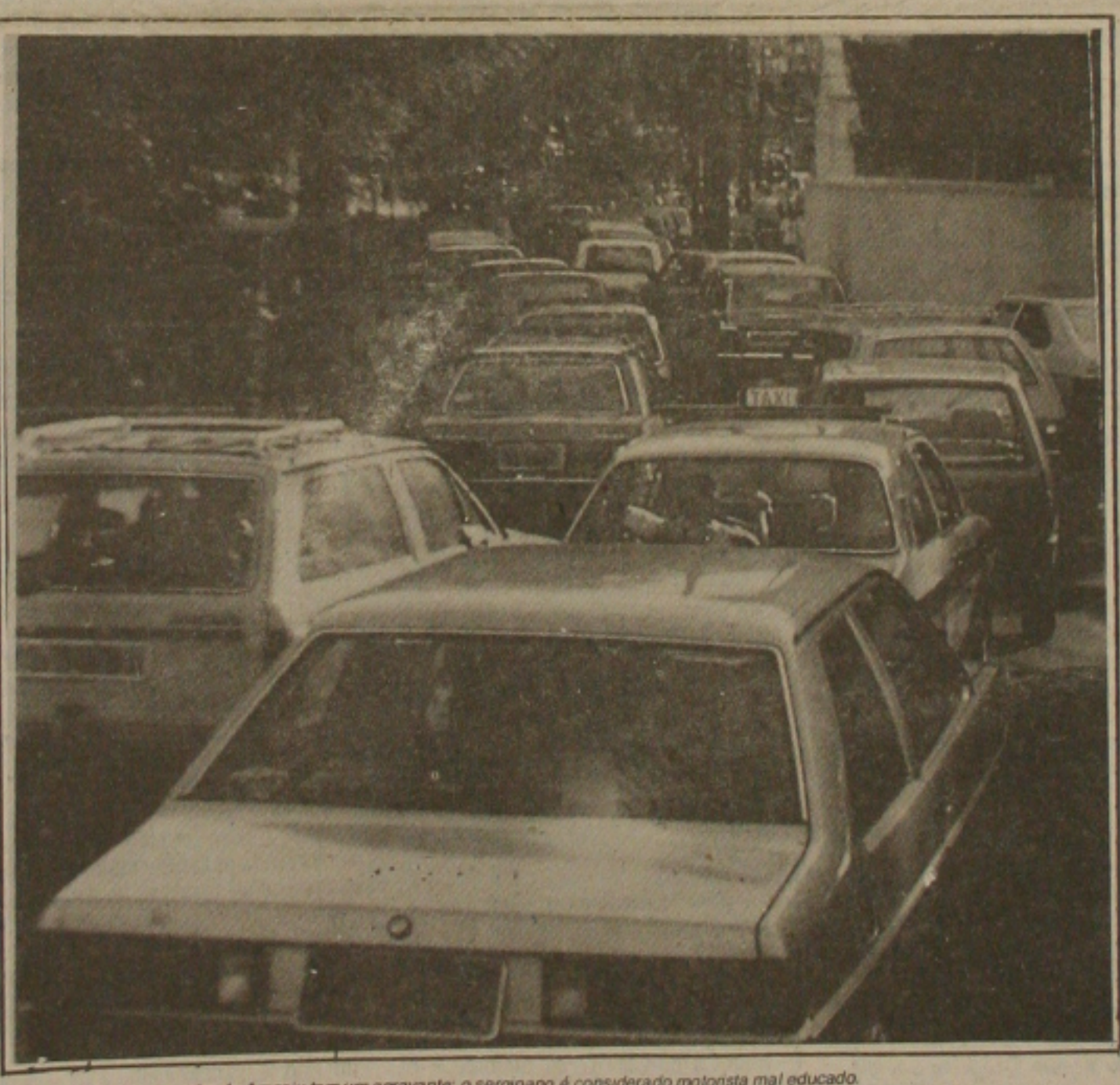
O difícil trânsito no centro de Aracaju tem um agravante: o sergipano é considerado motorista mal educado.