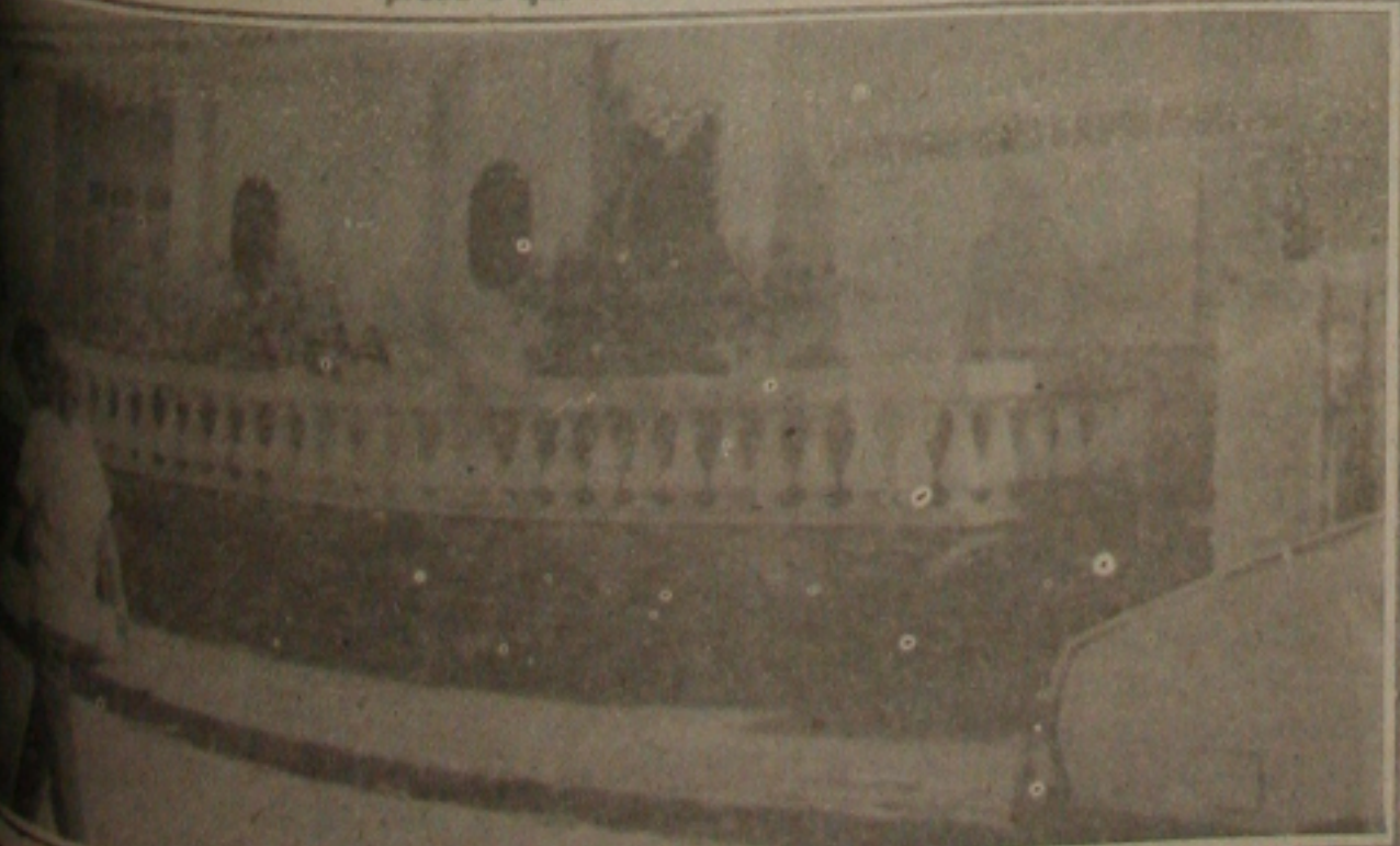
Essa casa fechada há dois anos, mas o Deso cobrou mais de Cr$ 36 mil de consumo de água

De lá para cá - conta o proprietário - ninguém nunca mais utilizou-se da casa e es-