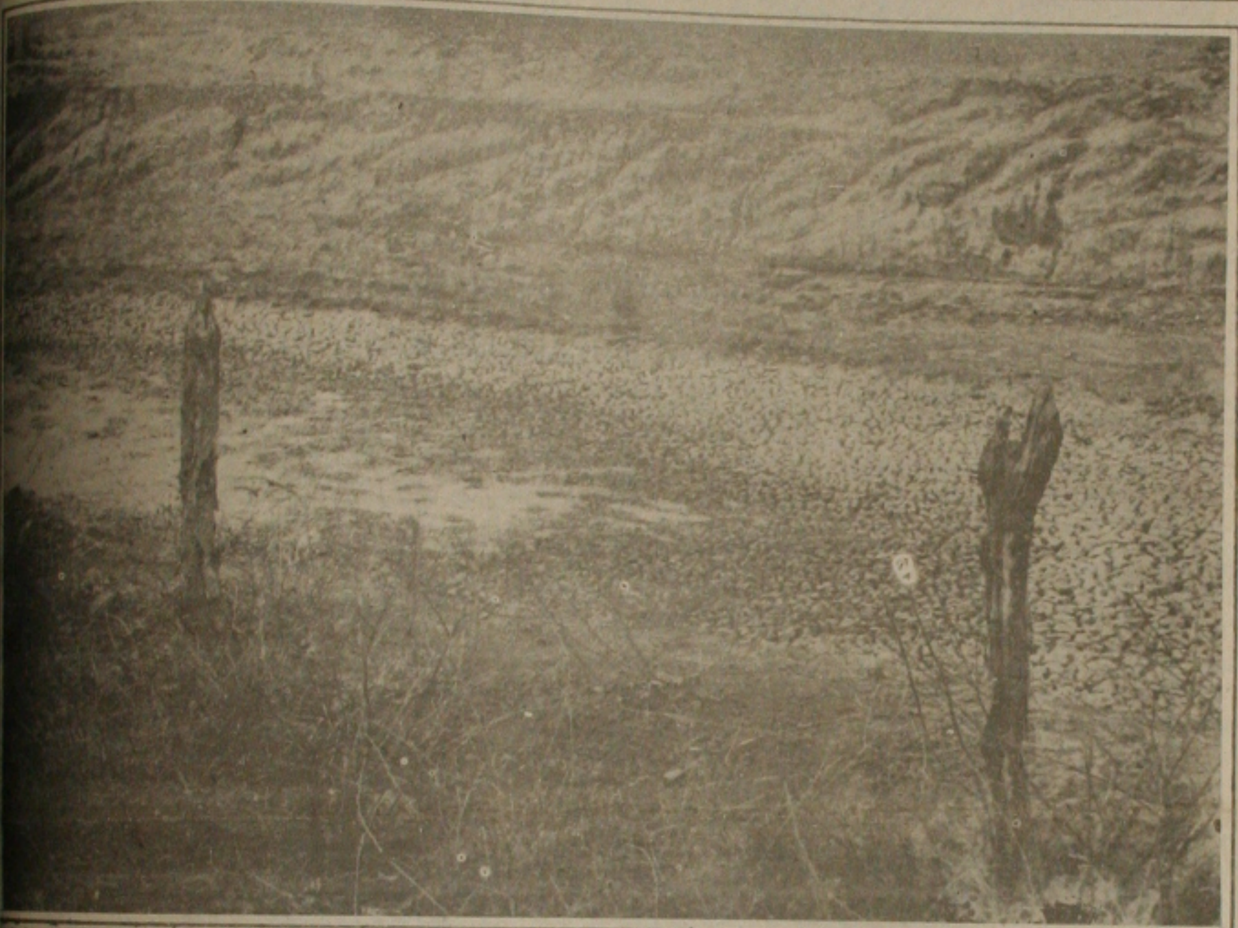
Se não chover dentro de trinta dias, o sertanejo pode ser dizimado pela seca, pois os tanques transformaram-se em crateras.