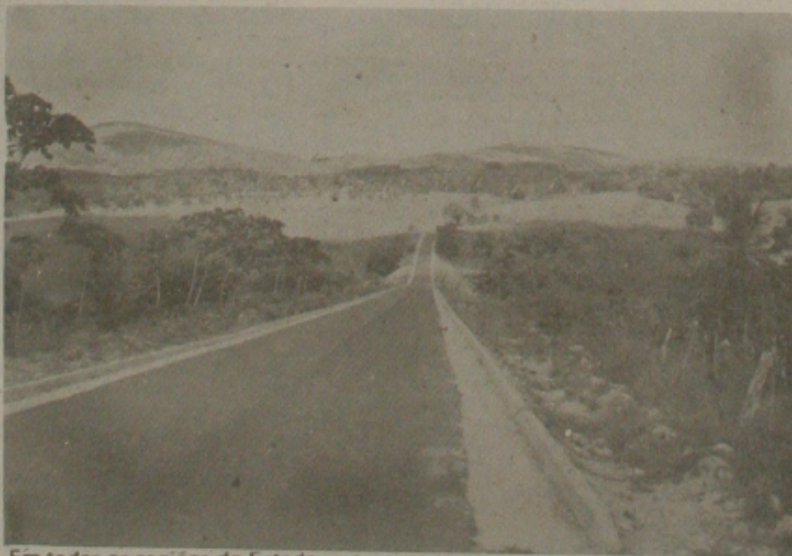
Em todas as regiões do Estado...

O cais de acostagem tem 340 metros, e está totalmente pronto. O equipamento para o sistema de manuseio de grãos está adquirido e estocado no retroporto, pronto para montagem. Do total da obra - cujo custo final é de 162 milhões de dólares - 70% estão prontos, faltando obras civis no retroporto (dois armazéns, urbanismo e paisagismo) e complementação de trabalhos já em andamento, a cargo do Governo Estadual: rodovias, fornecimento de água e energia elétrica, rede de telecomunicações e esgotamento sanitário.