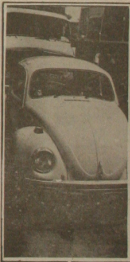
tomada pelos carros dos alunos e professores das Faculdades Tiradentes.