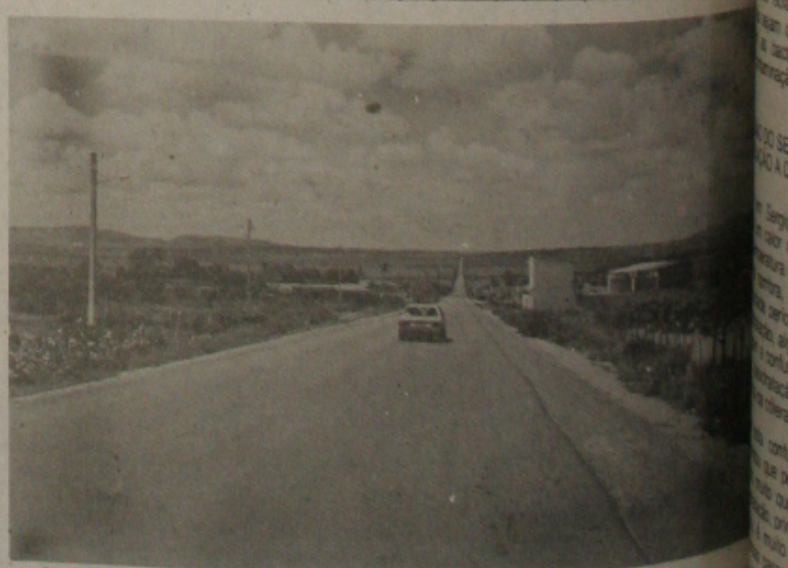
... as estradas estão sendo recuperadas