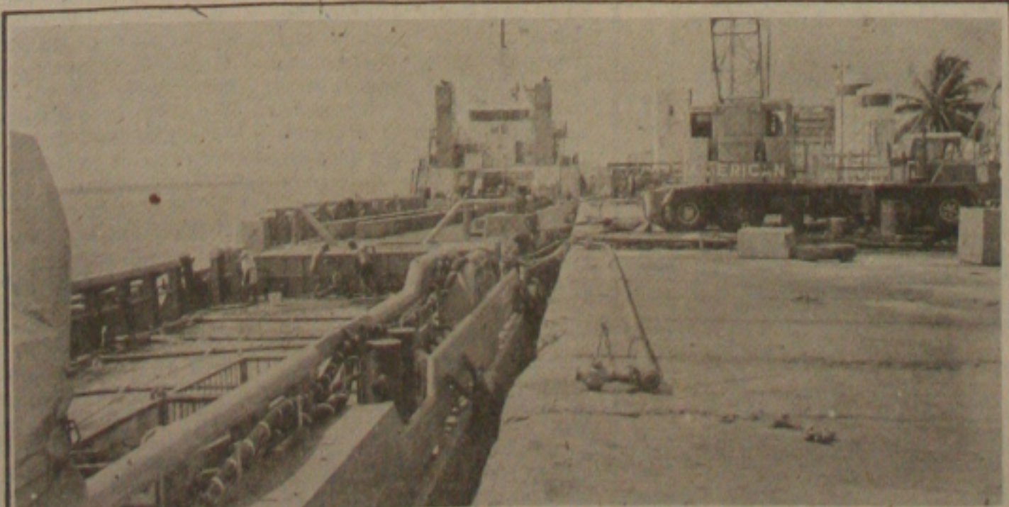
Na Administração do Porto de Aracaju, os trabalhos estão suspensos há meses e os funcionários não sabem o que fazer (Fotos: Luiz Carlos Moreira).

O presidente do Sindicato acrescentou ainda que a Petrobrás deixou de investir em perfuração agravando assim ainda mais a queda na receita. Atualmente a receita da estatal é de Cr$ 2 milhões enquanto que a despesa gira em torno dos Cr$ 4 milhões. "Se não for encontrada alternativas para suprir esta disparidade entre receita e despesa, as demissões serão inevitáveis. Vamos conversar com o diretor presidente para encontrar uma solução para o nosso problema", finalizou o presidente do Sindicato.