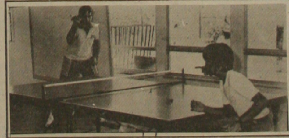
O ténis sergipano vai a João Pessoa