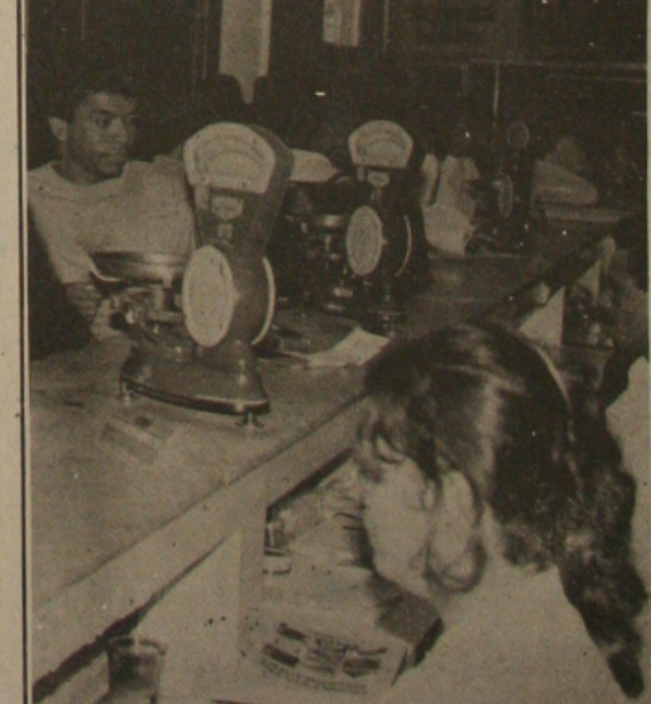
Agências de Correios começam a receber contas de água, luz e tarifas telefônicas.