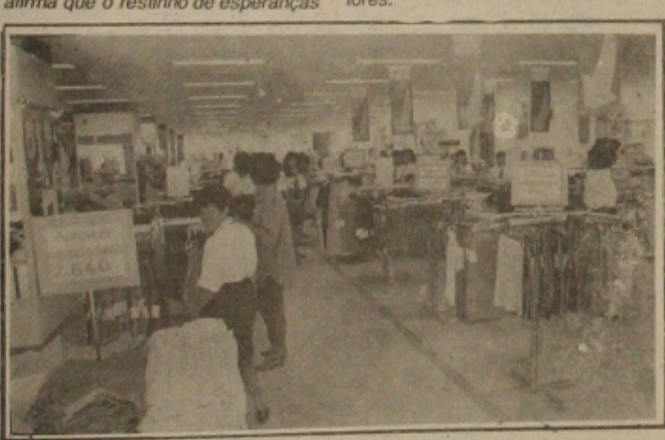
Comércio de Aracaju pode sofrer falência.