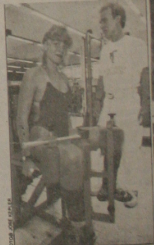
Milhação na academia: fisioterapia para desenvolver a musculatura