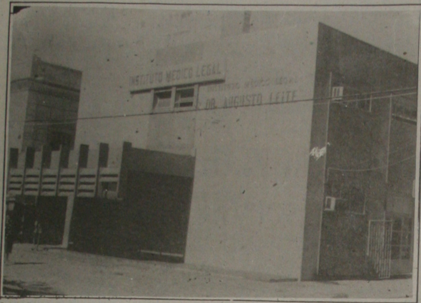
Com a deflagração da greve dos médicos-legistas, o movimento no IML caiu em 70 por cento.