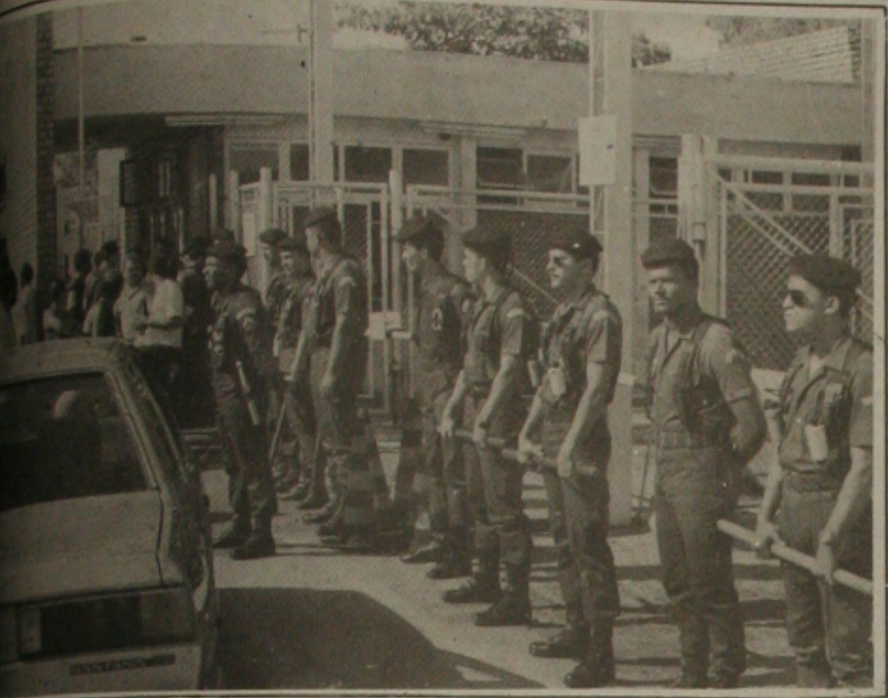
...choque da Polícia Militar ficou de prontidão na porta da RPNE, para garantir o patrimônio...