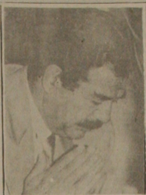
Diante da impotência para conter o avanço das tropas aliadas na retomada do Kuwait, Hussein determinou a retirada imediata de suas tropas e em discurso ontem pela rádio de Bagdá anunciou pessoalmente a rendição, mas disse que o Iraque venceu por ter legalmente anexado o Kuwait de agosto até ontem.