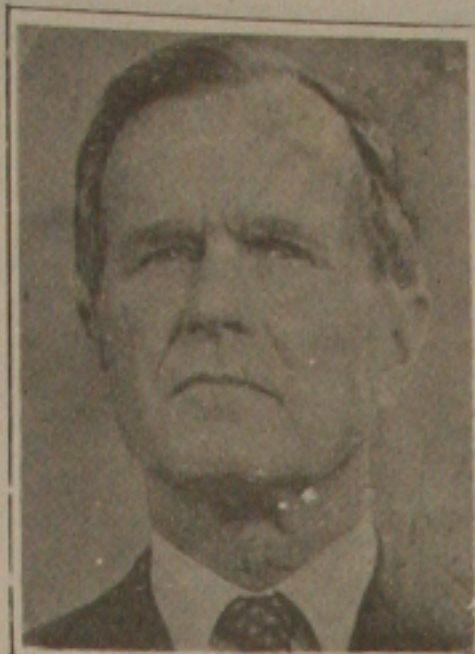
A retomada do Kuwait pelas tropas aliadas não representa para o presidente George Bush o fim da guerra no Golfo Pérsico. Ele quer destruir a Guerra Republicana, a tropa de elite de Saddam Hussein para acabar o poder militar do ditador do Iraque.