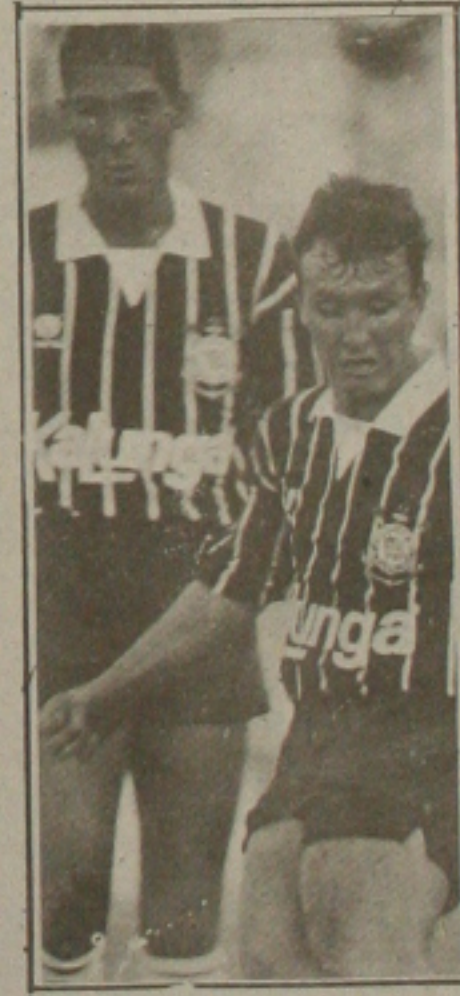
Neto joga pela Seleção. Não enfrenta o Confiança.