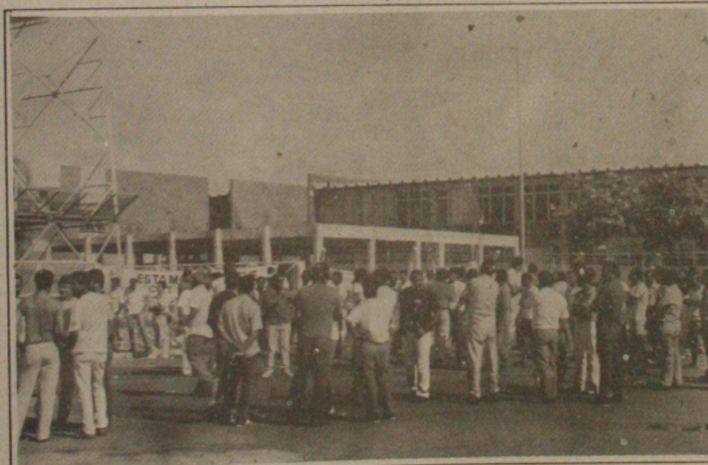
Com a presença da polícia, os piqueteiros desobstruíram o acesso, mas permaneceram em frente à sede da empresa.

A cidade do Kuwait ocupada militarmente pelos iraquianos no dia 2 de agosto do ano passado, motivando a guerra no Golfo Pérsico, já está em poder dos soldados aliados, que desde o último sábado iniciaram a ofensiva por terra para expulsar as forças de Saddam Hussein. O fim da guerra está bem próximo e o Iraque praticamente não oferece mais resistência, e sim rendição.