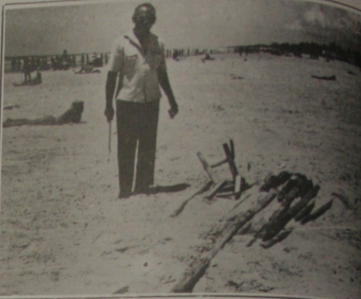
Barraqueiros são acusados de contribuir para o acúmulo de lixo na orla marítima.