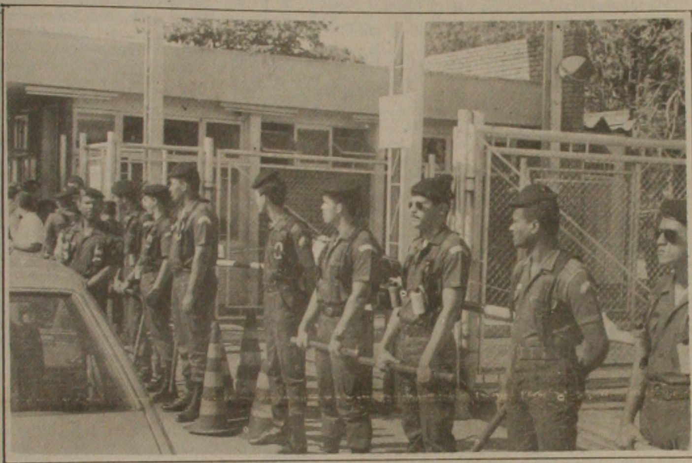
Para impedir a ação dos piqueteiros, o pelotão de choque da PM foi solicitado pela Petrobrás.