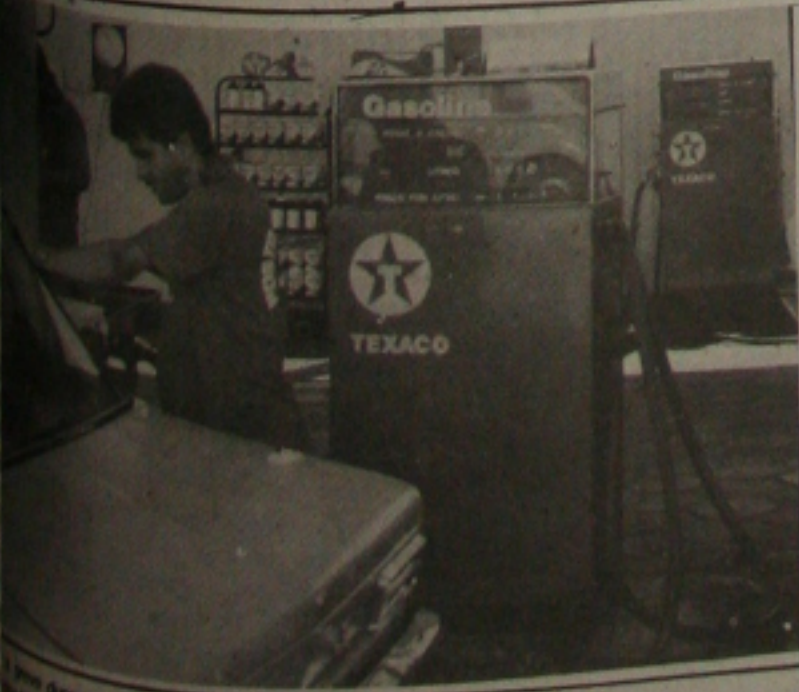
...sem mais de oito dias pode faltar combustível em Sergipe

trabalhadora por considerar que a mão de obra contratada através de empreiteiras vem substituindo a mão de obra dos próprios funcionários. No documento, a direção da estatal se compromete que a questão está sendo discutida e estudada minuciosamente. Os resultados desses estudos, segundo a direção da empresa, deverão ser concluídos dentro de um prazo de 90 dias. A situação dos demitidos também é uma bandeira detida pela classe trabalhadora, mas a direção da estatal se nega a negociar a reintegração destes funcionários.