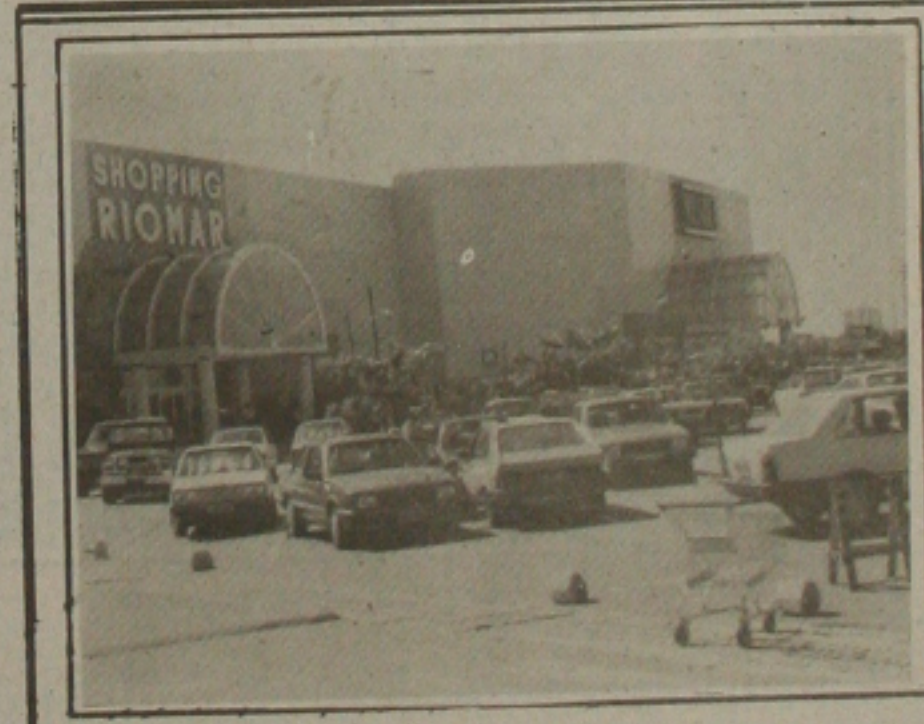
Direção do Shopping apura caso de menor