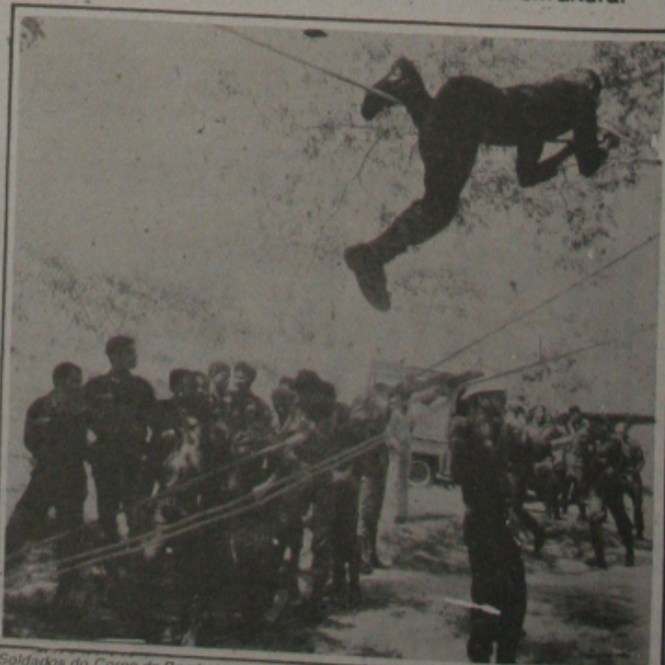
Soldados do Corpo de Bombeiros da PM praticando salvamento em altura.