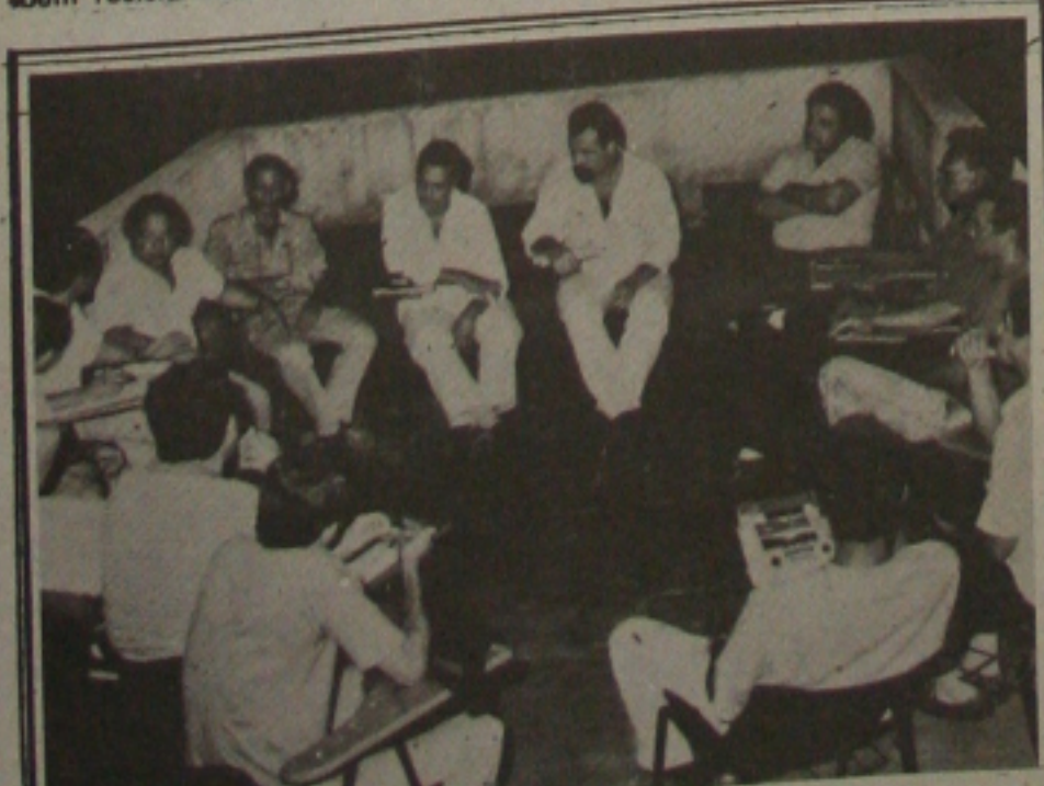
Radialistas querem a sede no centro da cidade