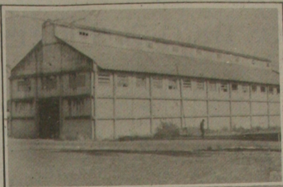
Armazém do terminal portuário de Aracaju