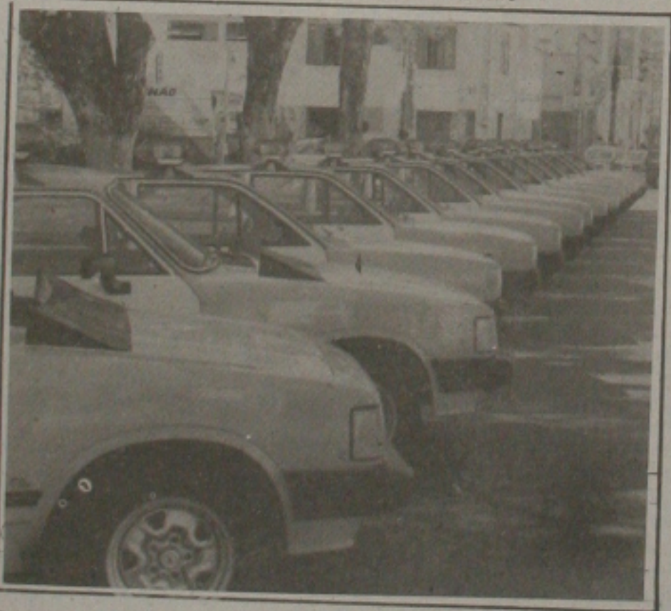
Delegacias recebem viaturas para policiamento ostensivo.

Com a entrega das novas viaturas aos delegados da capital o secretário Edniardo solicitou deles a devolução de um carro que não esteja em condições normais de uso "Eles serão recuperados e depois distribuídos para as delegacias do interior, onde existe a deficiência de viaturas". Argumentou na reunião que manteve com os delegados metropolitanos para apresentar recomendação de uso das novas viaturas.