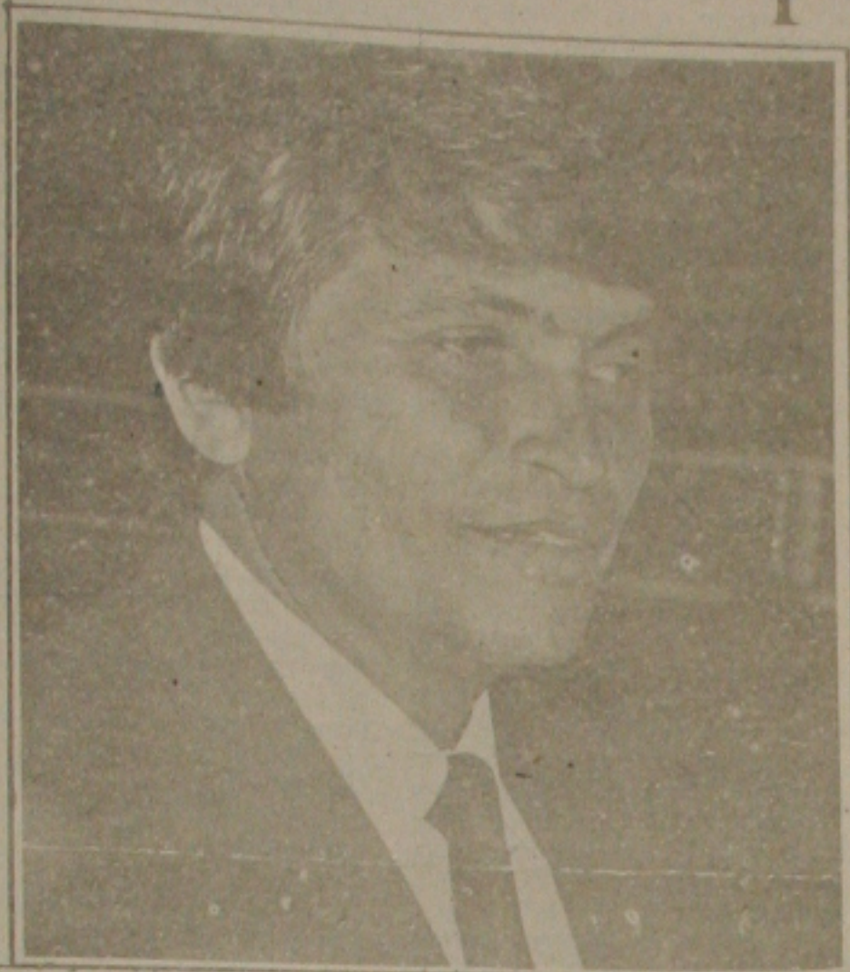
Falcão faz segredo dos nomes...