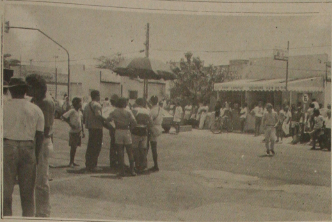
Diariamente os grevistas comparecem a Petrobras na esperança de que as negociações sejam iniciadas.

... mais expressiva greve dos sergipanos entrou no terceiro dia sem qualquer perspectiva de negociação entre as entidades sindicais e a direção da empresa. Desde o primeiro dia da greve, praticamente 50% dos trabalhadores aderiram a greve geral e os engenheiros que nunca aderiram de paralisações, decretaram a greve. As lideranças sindicais tranquilizaram ontem a população de que não há risco de desabastecimento dos gás de cozinha, e a direção da empresa não perdeu o mesmo otimismo e já afirma que nos cinco dias de greve a negociação poderá ter problemas de abastecimento. (Página - 1-B).