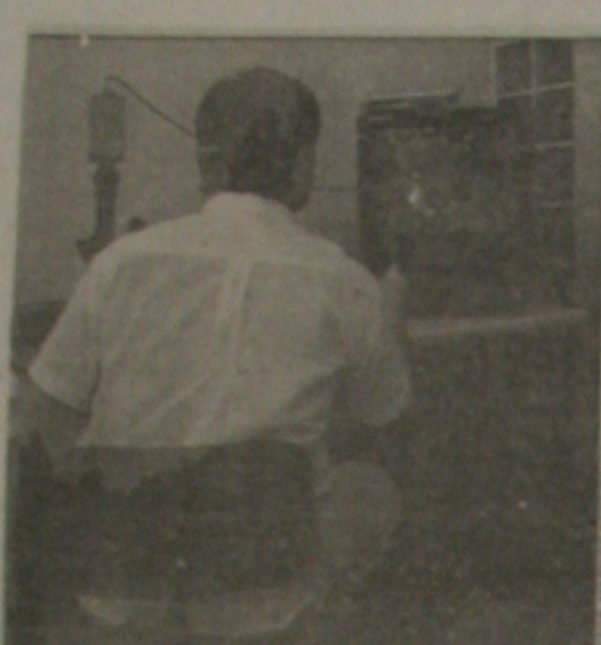
Alta tecnologia: computador acoplado a um microscópio analisa o sistema imunológico do paciente e registra todas as alterações em fotos

11:00h. Chaplín 11:30h. Cinema em Casa 12:10h. Jô Soares Onze e Meio 12:30h. T.J. Internacional 00:50h. T.J. Brasil - Resumo 01:10h. TV Shopping TV JORNAL CANAL 13 07:15h. Programação Educativa 07:30h. Brasília 07:30h 08:00h. Cometa Algodão 12:00h. Manchete Esportiva - 1ª Edição 12:30h. Jornal da Manchete - Edição da Tarde 13:10h. Clube de Criança 17:00h. Cassino Super Hardis 18:55h. Repórter Jornal 19:10h. Manchete Esportiva - 2ª Edição 19:30h. Corpo Santo 20:30h. Jornal da Manchete - 1ª Edição 21:30h. Ana Raio/Zé Trovão 22:30h. Filhos do Sol 23:30h. Documento Especial 00:30h. Jornal da Manchete - 2ª Edição