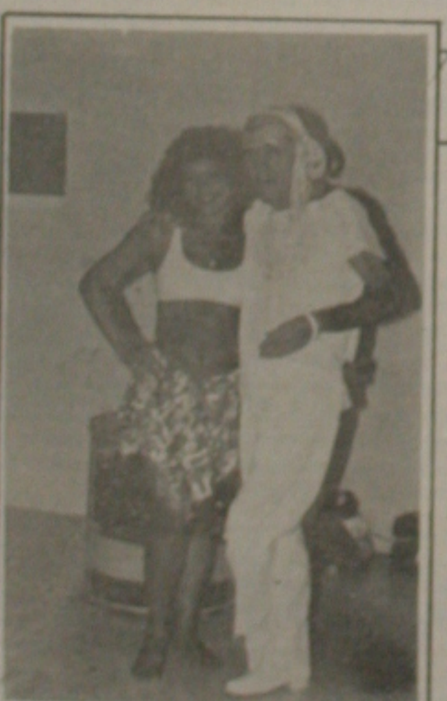
Notaram o pedaço de morena ao lado do escriba? Óf eu, com medo de mim mesmo!