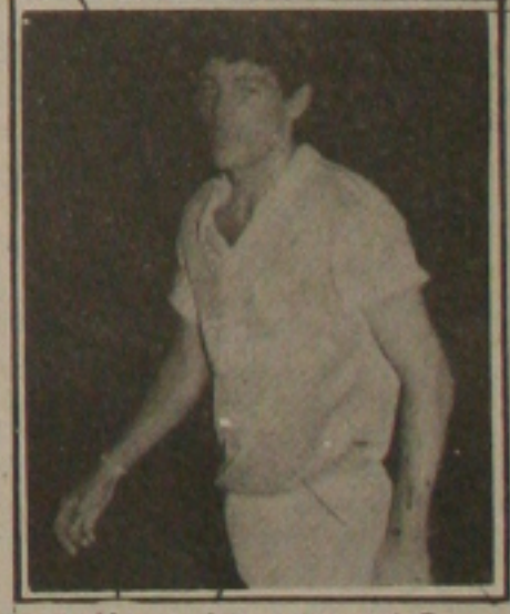
Pedrinho pode enfrentar o time da Desportiva.

A equipe só será definida hoje à tarde, mas Beto pretende fazer poucas modificações. O meia Paulinho se ganhar condições de jogo poderá ter sua estréia confirmada. Valdson, pela sua atuação no segundo tempo, pode ganhar também uma posição. A dúvida no entanto é que Beto esteve bem durante todo o tempo que esteve em campo. Dessa forma os problemas de Alberto Meneses são por excesso de bons jogadores.