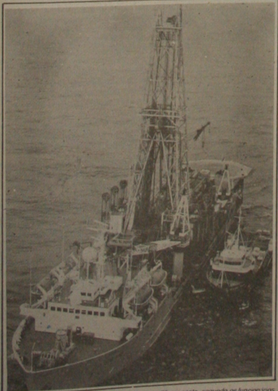
A greve paralisa a produção de petróleo no mar em 70 por cento, segundo os funcionários

naria Landulfo Alves, na Bahia. Por enquanto a Petrobrás dispõe de estoques de gasolina e óleo diesel para garantir o abastecimento de Sergipe, através do terminal de distribuição em Laranjeiras. Se a greve se prolongar a situação começa a ser invertida com a possível falta de produtos em vários postos no Estado.