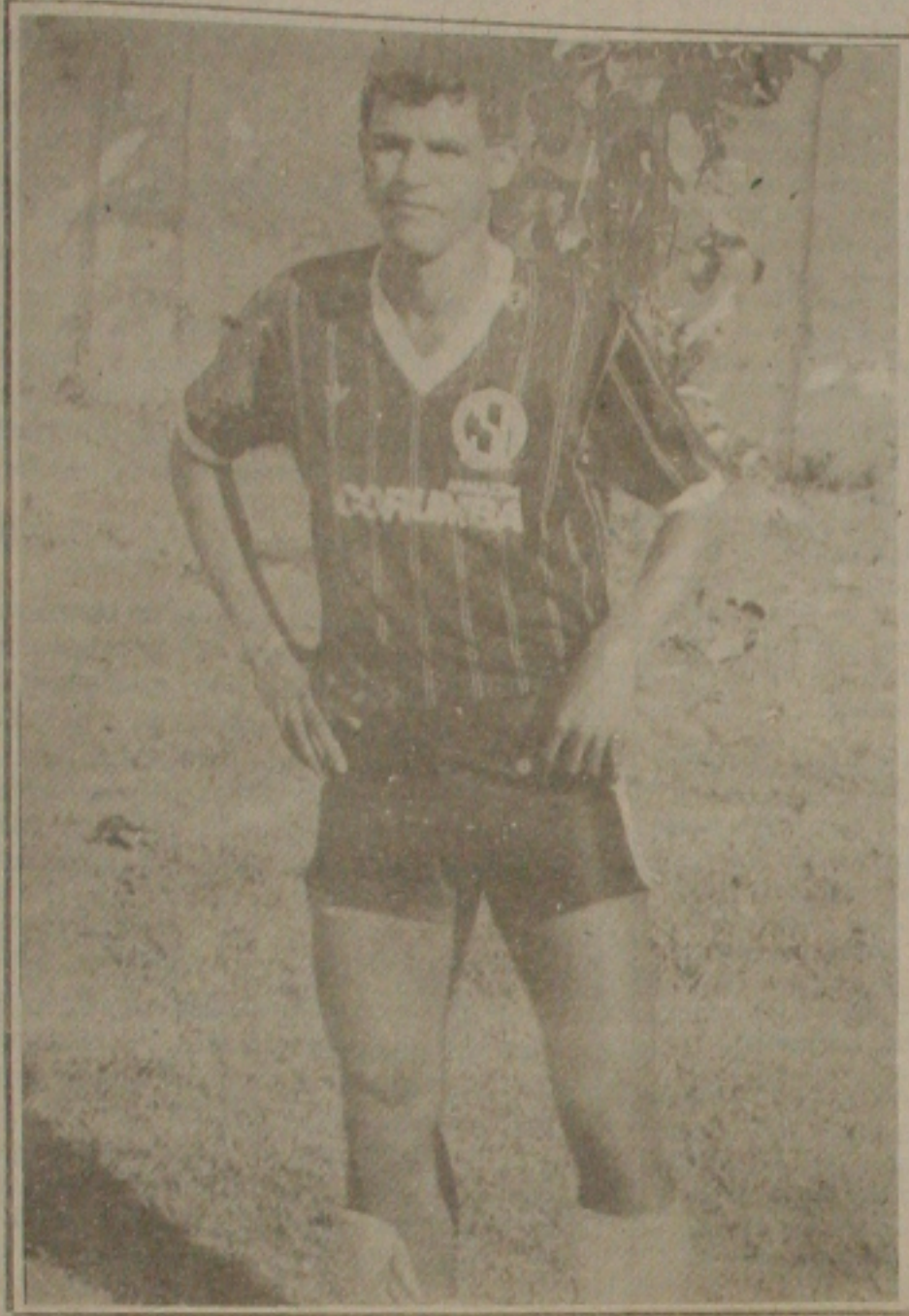
Tuíca é a mais nova contratação do Sergipe.

Mundo parece mais preocupado com o jogo. Foi a sétima vez que dirigiu o Brasil sem conseguir uma vitória. Parece que todos compreendem as dificuldades que todos enfrentamos. Mostramos garra e vontade.