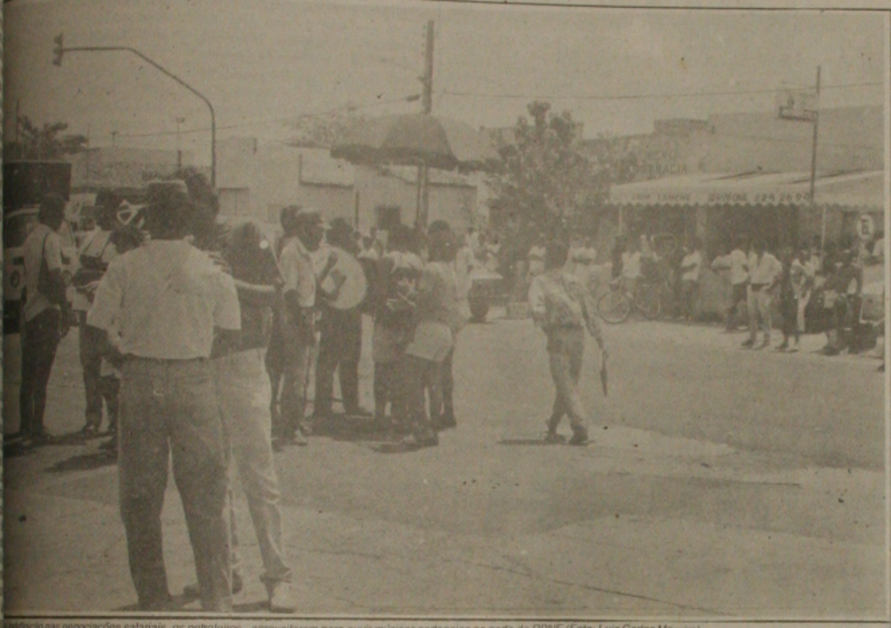
Em reunião nas negociações salariais, os petroleiros aproveitaram para ouvir músicas sertanejas na porta da RPNE

Sem avanço nas negociações salariais e na readmissão do pessoal, os petroleiros sergipanos e alagoanos se mantêm em greve por tempo indeterminado, ocupando a porta da sede da Região de Produção do Nordeste (RPNE). Os grevistas esperam uma posição da presidência da Petrobrás para reiniciar as discussões salariais, pois entendeu ser necessário a reposição de 310% para correção dos salários defasados com as medidas adotadas pelo Governo Federal.