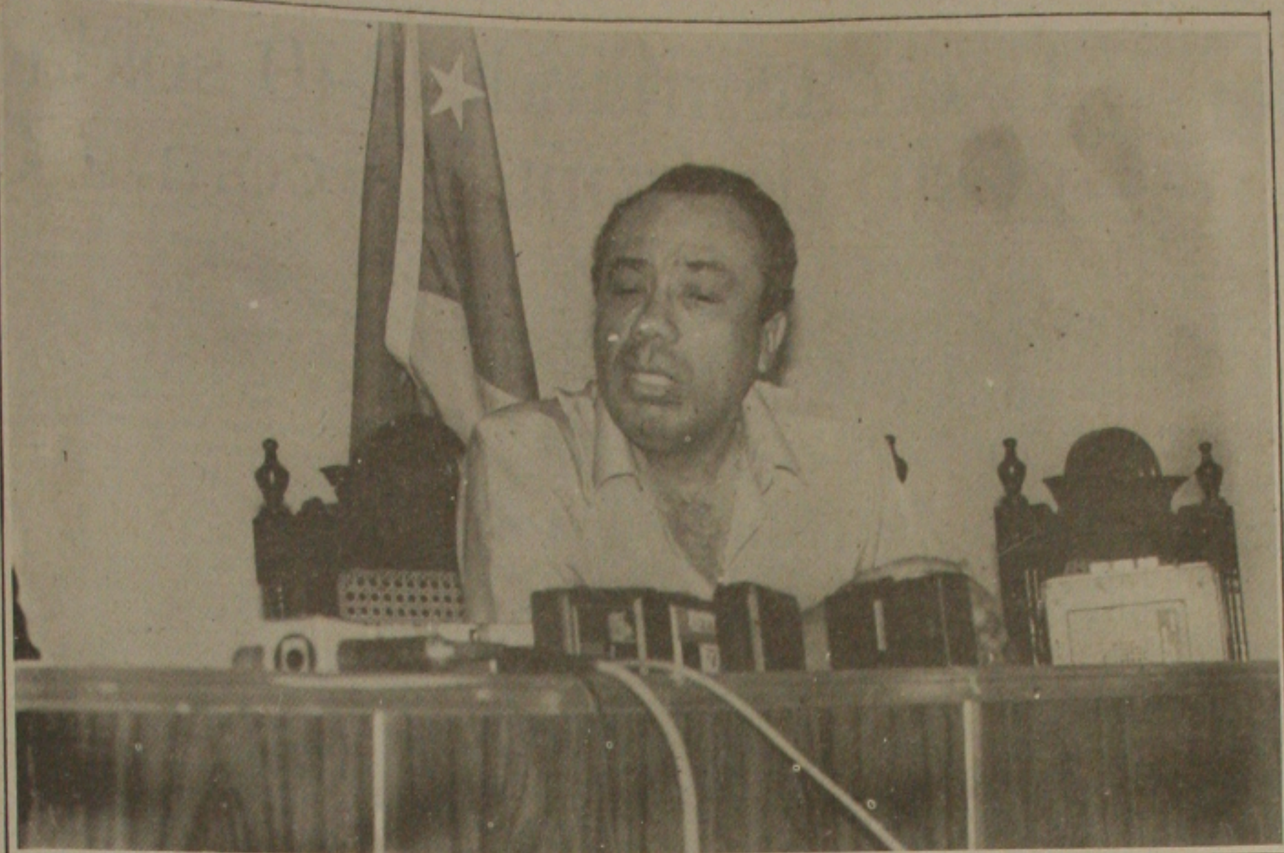
João acha que o momento não é de entretimento, mas sim de entendimento, para tirar o País da crise.

Devemos esquecer que o entendimento não é para se estabelecer em nomes para a sucessão de Luciano Bispo, mas o futuro candidato é ponto de discordância, pois um entendimento que tem 25 membros que busca uma convergência para