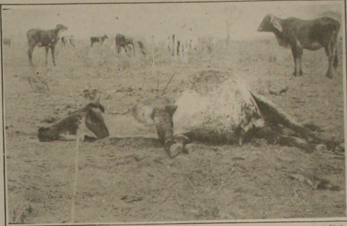
...a seca destruiu a plantação e secou o açude no município de Monte Alegre...