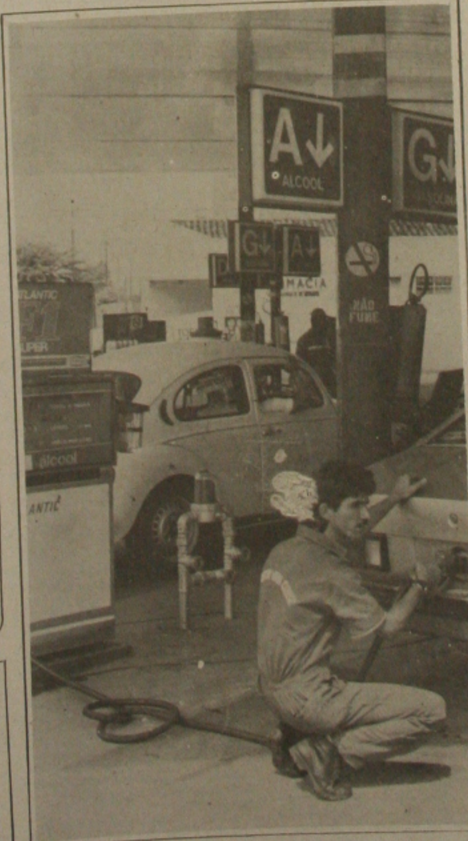
Postos poderão ficar sem combustível a partir desta quarta-feira

1º Prêmio 08.166 2º Prêmio 11.835 3º Prêmio 18.323 4º Prêmio 21.247 5º Prêmio 18.482