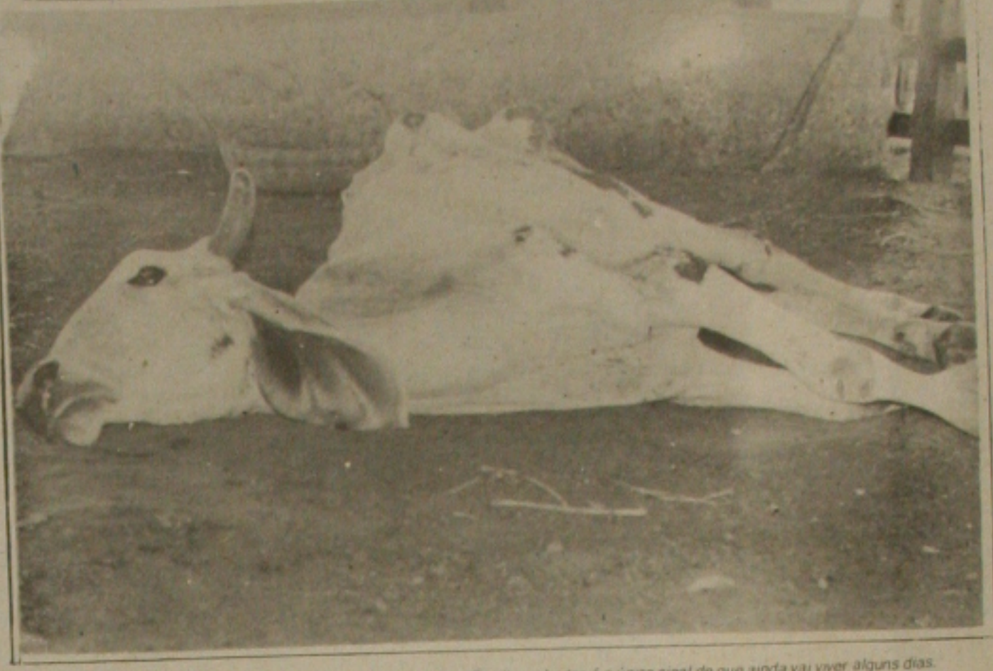
A vaca caiu no curral no momento que os repórteres chegavam. Os olhos abertos é o único sinal de que ainda vai viver alguns dias.