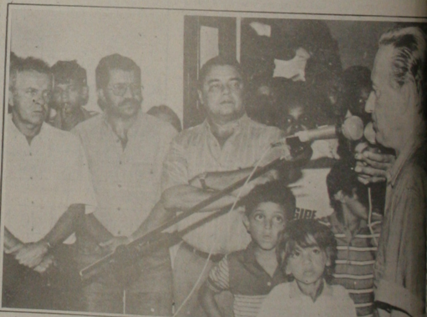
...e logo em seguida discursou para agradecer aquele povo a confiança de depositada em sua administração.