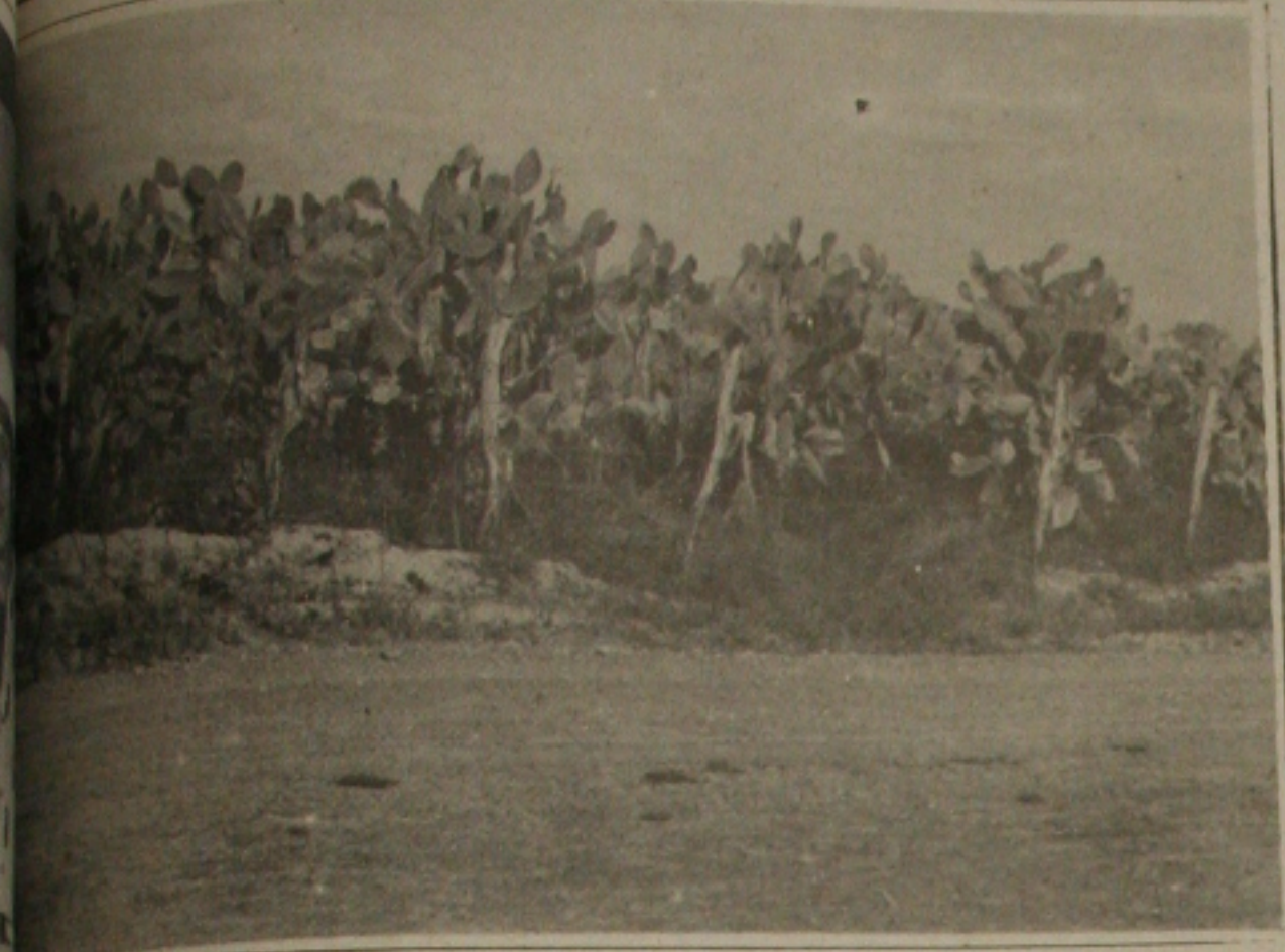
Nesta terra está seca, e com rachaduras. A vegetação destruída, só a palma resiste a longa estiagem