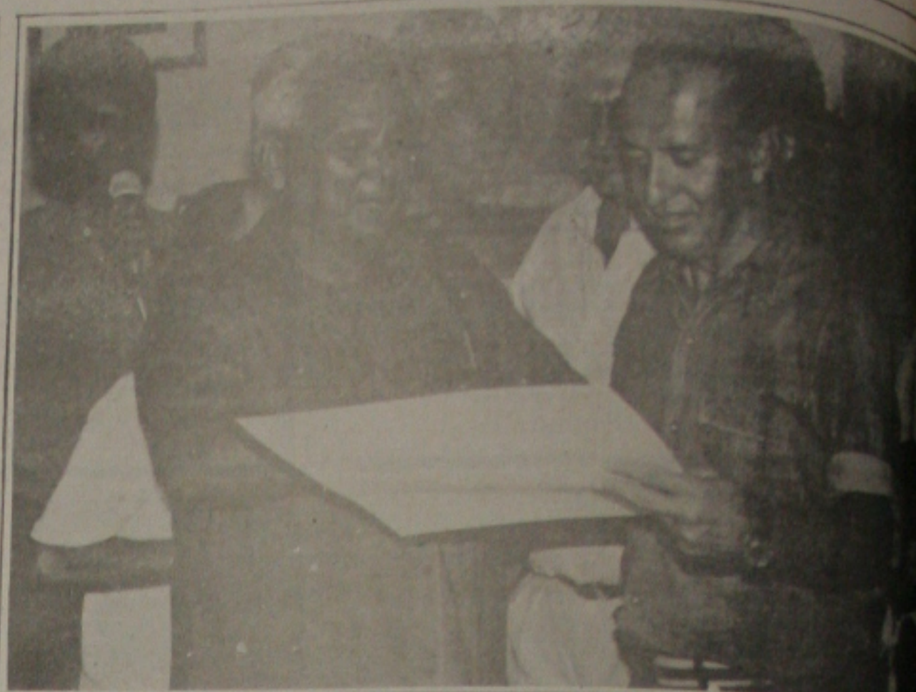
...e depois Valadares foi homenageado com o título de Cidadão Gararuense, pela Câmara.