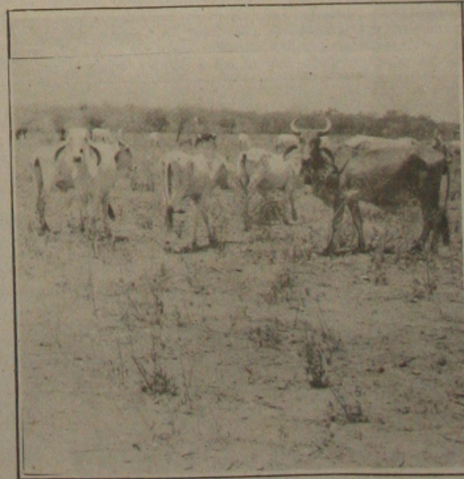
A vegetação nativa praticamente inexistente devido a seca.

Os agricultores estão desesperados e torcem por melhores dias. A cena mais comovente foi assistida pela equipe de reportagem da GAZETA DE SERGIPE: uma vaca tomou um empurrão de um outro animal e, pela fraqueza, acabou caindo. A cena é triste. O animal permanece caído totalmente imobilizado, acompanhando os passos das pessoas que entram no curral apenas com os olhos. Os ossos estão visíveis e o pessoal que cuida desta vaca acredita que ela não viverá mais de dois dias.