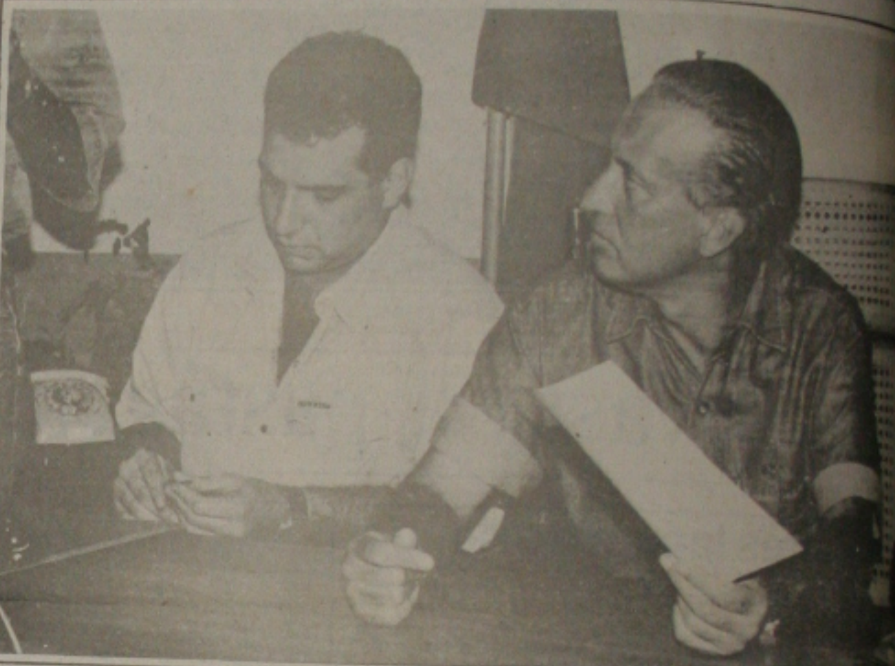
Na cidade de Munbea, ele assinou convênio para a construção de obras de interesse da comunidade...