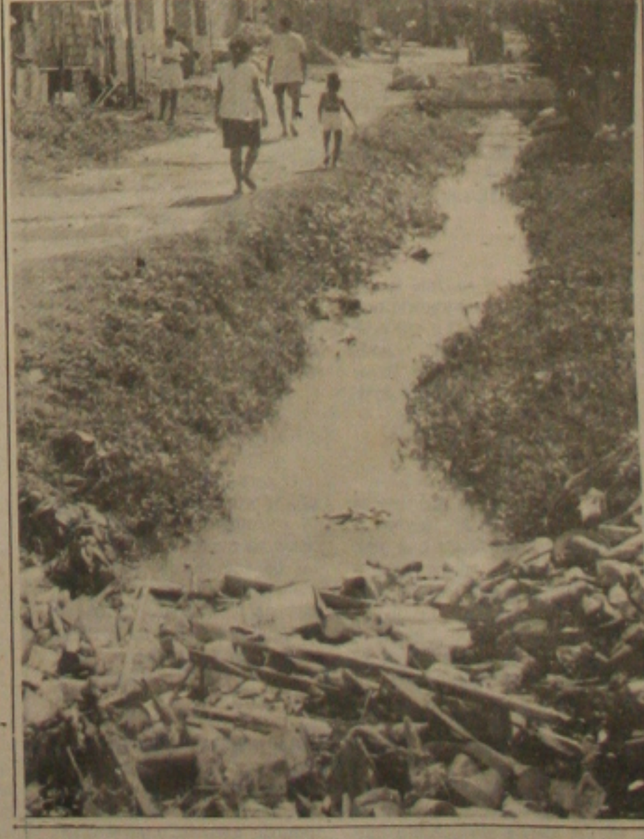
Moradores da Jaboliana reclamam o canal obstruído (Página 1B).

O Confiança, campeão sergipano de 90, foi eliminado ontem da Copa Brasil dos Campeões, ao ser derrotado por 1 a 0 pelo campeão paulista, o Corinthians. O jogo aconteceu no Estádio Pacaembu, em São Paulo, e a vitória do time paulista foi consolidada através de uma penalidade máxima cobrada pelo armador Neto, aos 13 minutos do primeiro tempo. O penalte que terminou dando a vitória do Corinthians não existiu de fato e a sua marcação surpreendeu a todos que estavam no Estádio e deixou revoltados os jogadores e dirigentes do Confiança. O atleta Batista tirou a bola dos pés do atacante Mirandinha, sem atingi-lo, quando este estava pronto para marcar o gol. O juiz Aloisio Viug decidiu por marcar o penalte que terminou prejudicando ao Confiança. Pelo que apresentou em campo o Corinthians não mereceu a vitória, enquanto que o Confiança teve seu bom desempenho reconhecido e elogiado até pela imprensa paulista. Agora o Confiança vai continuar representando o Estado apenas no Campeonato Brasileiro e neste domingo joga no Rio de Janeiro contra o Itaperuna. (Página - 1-C).