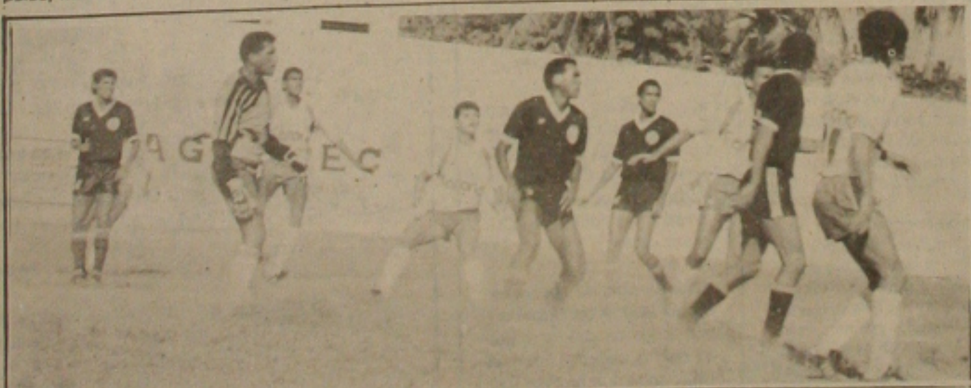
Empate em zero garante título ao Maruimense.

O juiz da partida foi o sr. Jairo Nascimento, com um péssimo trabalho investiu faltas anulou gol, enfim tentou prejudicar o espetáculo.