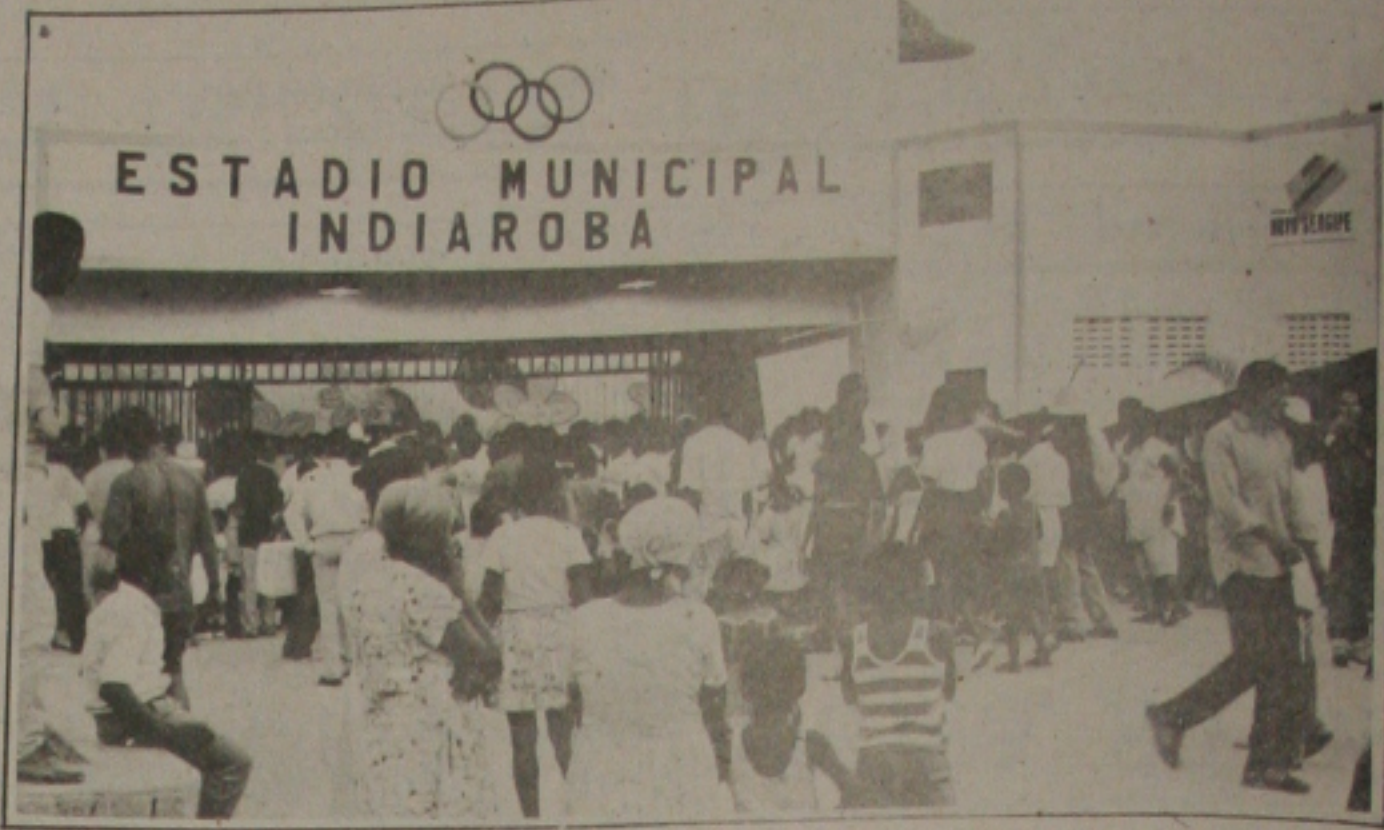
Em Indiaroba, o Governo do Estado construiu um estádio para atender uma reivindicação da população.