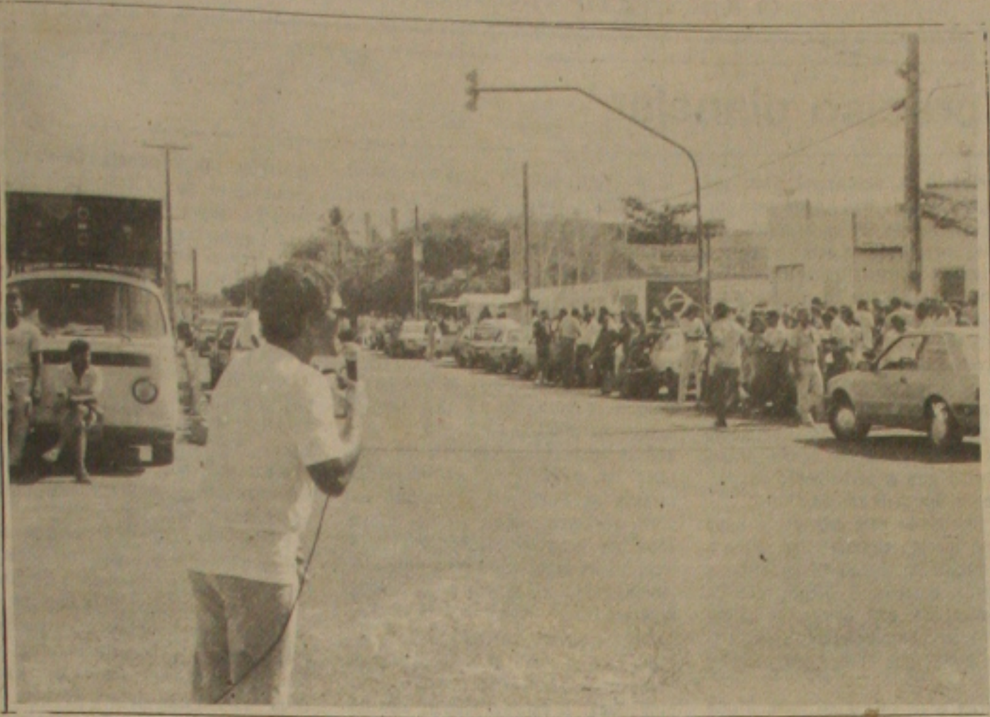
Concentração e discursos das lideranças sindicais ocupam os petroleiros em greve há oito dias.

As ameaças de punições e o risco de demissões dos grevistas não sendo suficientes para evitar o recuo dos petroleiros em direção à paralisação nacional, os petroleiros voltaram a se concentrar ontem em frente a sede da Associação de Produtores do Nordeste, na Rua do Acre, que funciona sob o comando de greve. Sindicatos e políticos dos partidos aproveitaram a concentração para discursar criticando a política econômica do Governo Federal e o arrocho salarial decorrente da falta de política econômica. Hoje os sindicalistas vão realizar em assembleia geral a realização de uma passeata que deverá ocorrer nas principais ruas do centro da cidade. Ontem a direção geral dos petroleiros anunciou a demissão dos petroleiros. (Páginas - 1-B e 2-B)