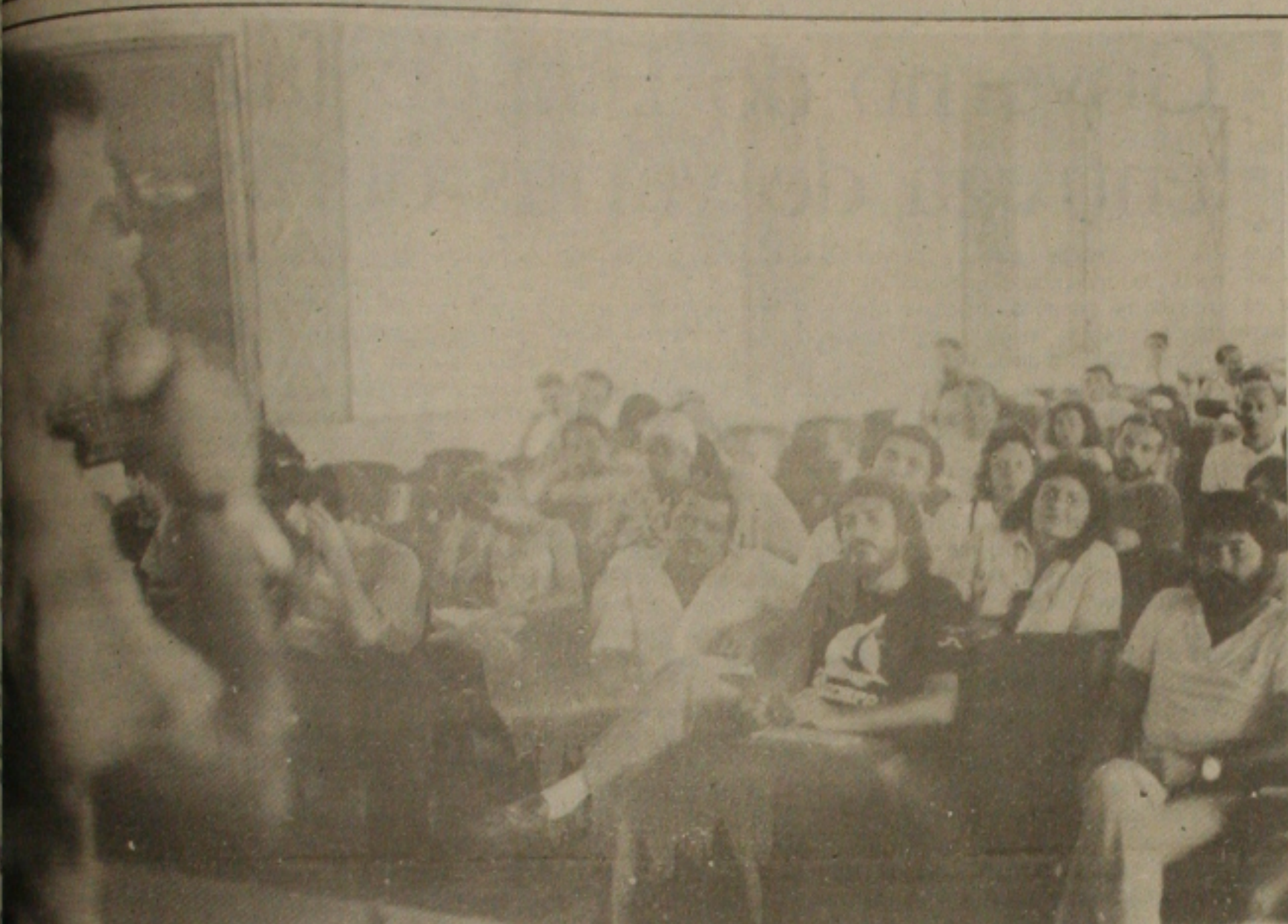
Em assembleia geral, os professores da rede estadual decidiram pelo estado de greve e vão esperar o andamento da questão salarial da categoria.

Os professores da Rede Estadual de Ensino entraram ontem em estado de greve e prometem paralisar as atividades se as perdas salariais da categoria que atingem cerca de 600% não forem negociadas com o governador Antônio Carlos Valadares. Os alunos que estudam pela manhã não tiveram aula em função da assembleia geral realizada no Instituto Histórico e Geográfico, mas à tarde e à noite as atividades aconteceram normalmente no primeiro dia de aula neste ano letivo.