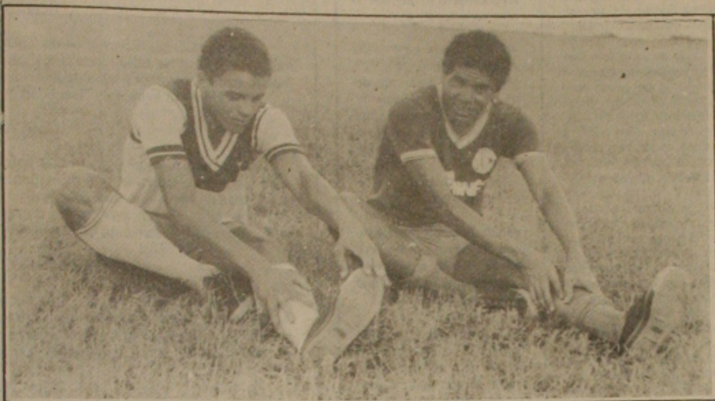
Futebol de Edi desperta interesse dos paulistas.