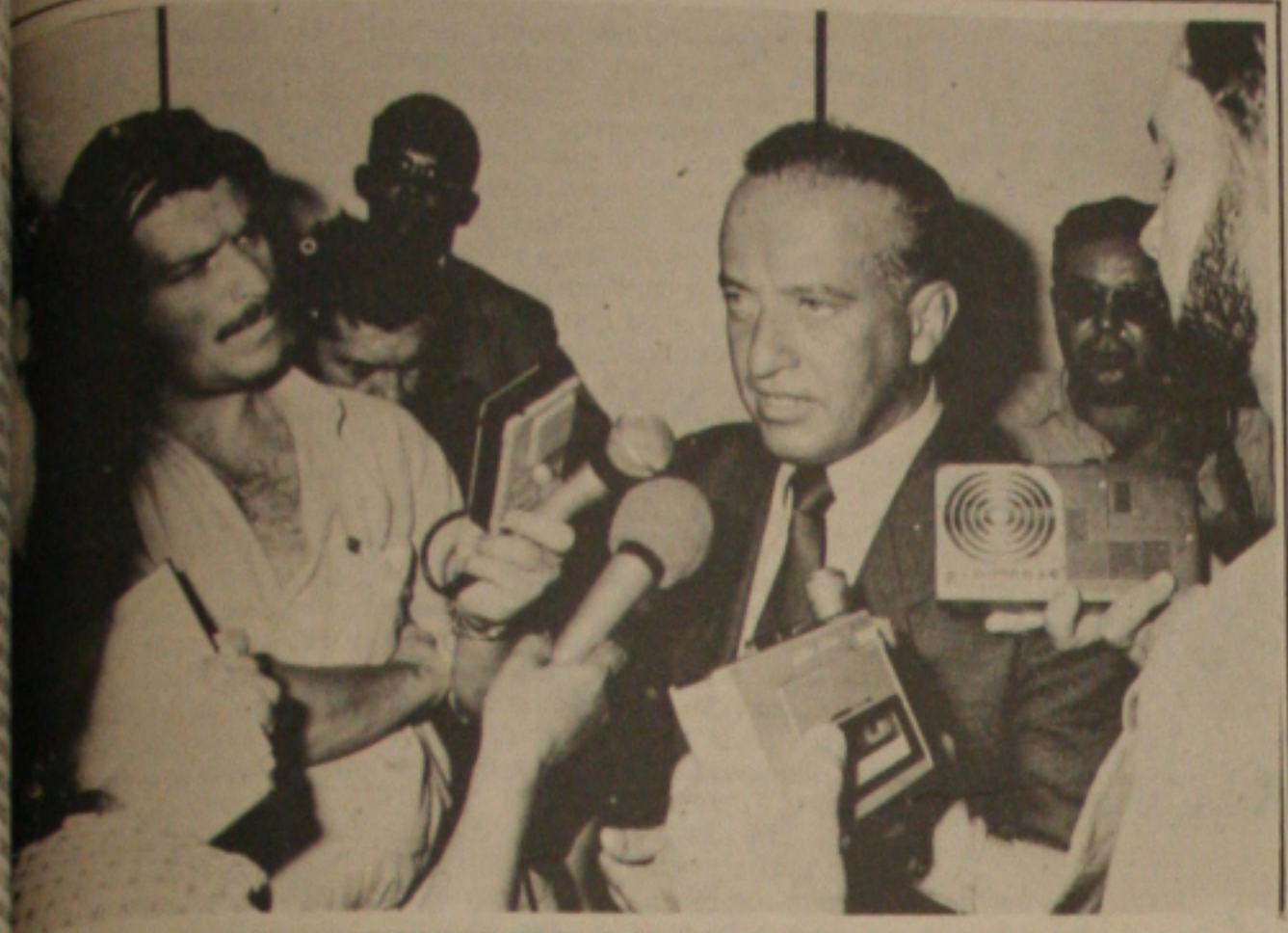
Governador Valadares disse que queria dar mais, mas o índice concedido é o que o Estado pode pagar.