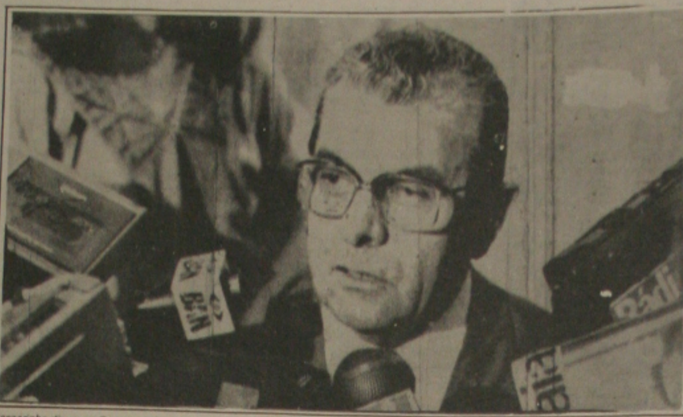
Passarinho diz que o Governo lutará pelas Medidas Provisórias.

Com uma chapa única - apesar de o governador Álvaro Dias ter anunciado a possibilidade de apresentar uma chapa de oposição, não a registrou até o prazo limite - o novo presidente do PMDB, a ser escolhido na convenção marcada para o dia 24, deverá ser o governador Orestes Quercia.