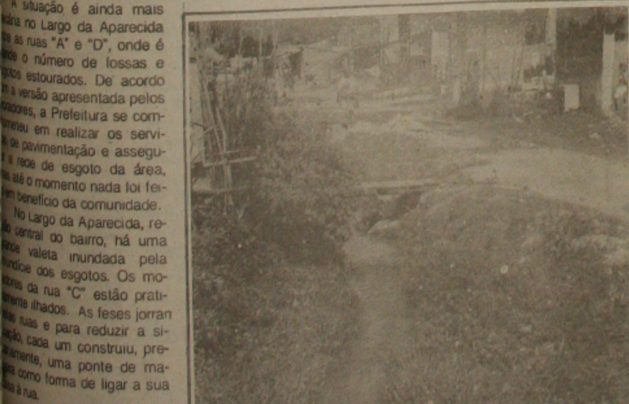
Na Jabotiana, as ruas se transformaram em foco de contaminação.

Os moradores do bairro Jabotiana, atravessam os mais variados problemas por falta de saneamento básico. Naquela localidade as crianças estão constantemente doentes com problemas de pele e gripe. A Prefeitura de Aracaju conforme declarações da população, esqueceu completamente aqueles moradores que os moradores enfrentam. A coleta de lixo não está regularizada. São poucas as caixas coletoras existentes no bairro e como forma de se livrar do lixo os moradores utilizam os terrenos baldios da área como depósitos de lixo. Consequentemente as mucocacas e uma infinidade de insetos dominam o bairro.