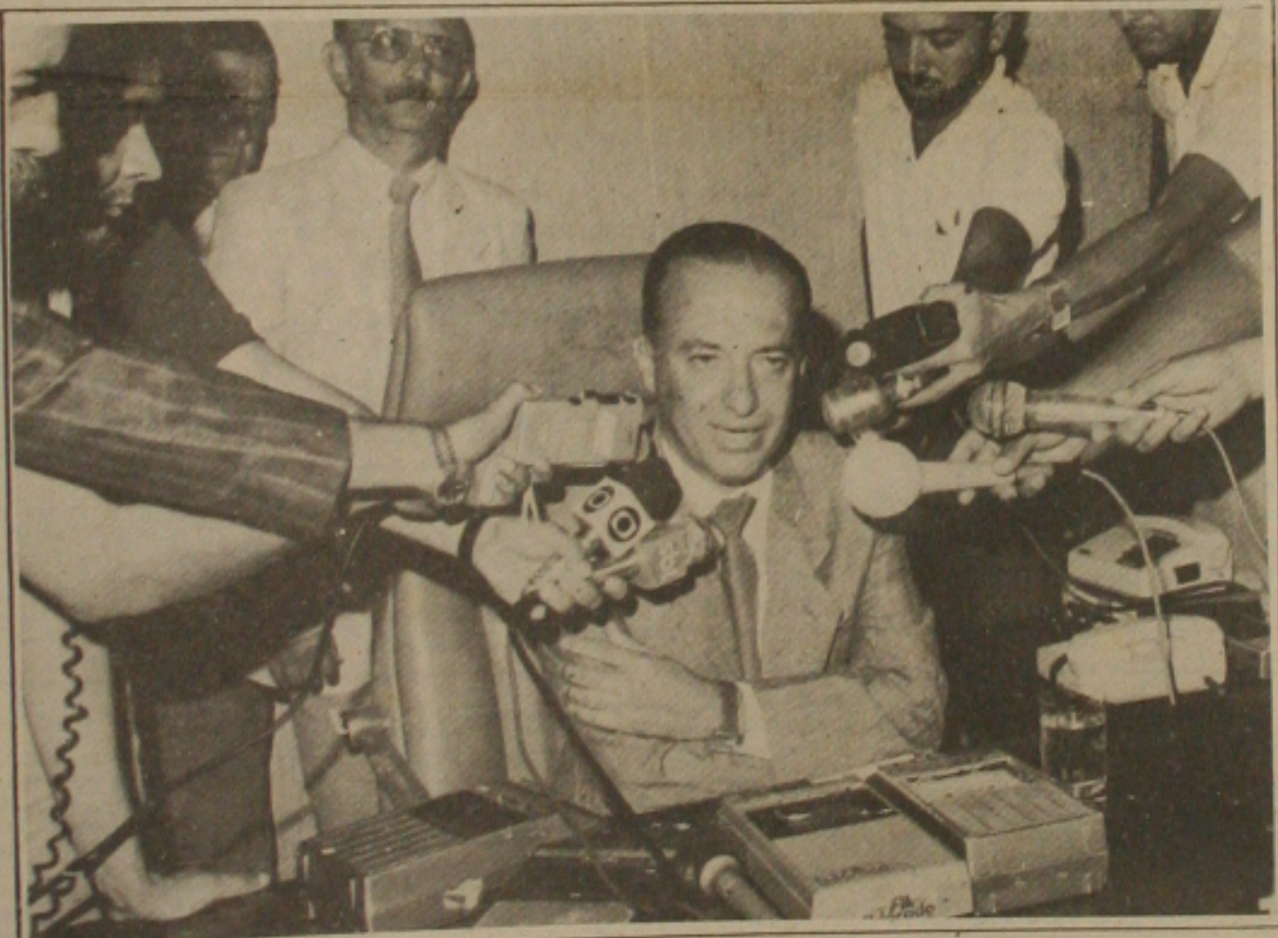
O governador Valadares admitiu que apenas está recompondo as perdas salariais do funcionalismo público.

Sem Tabela O Governo desistiu de tabelar as hortaliças, os tubérculos e as verduras e ainda resolveu que as frutas não ficarão com preços congelados. A liberação de preços desses produtos simplesmente gratuita o que já vinha ocorrendo desde que foi decretado o congelamento, no dia 31 de janeiro passado, ou seja, os preços desses produtos vinham variando no mercado.