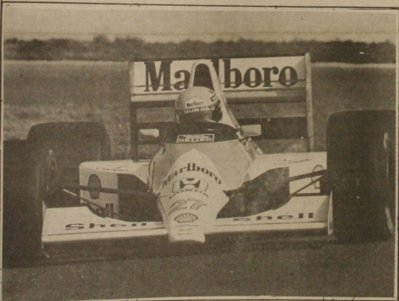
Senna arranca hoje em busca do tricampeonato.