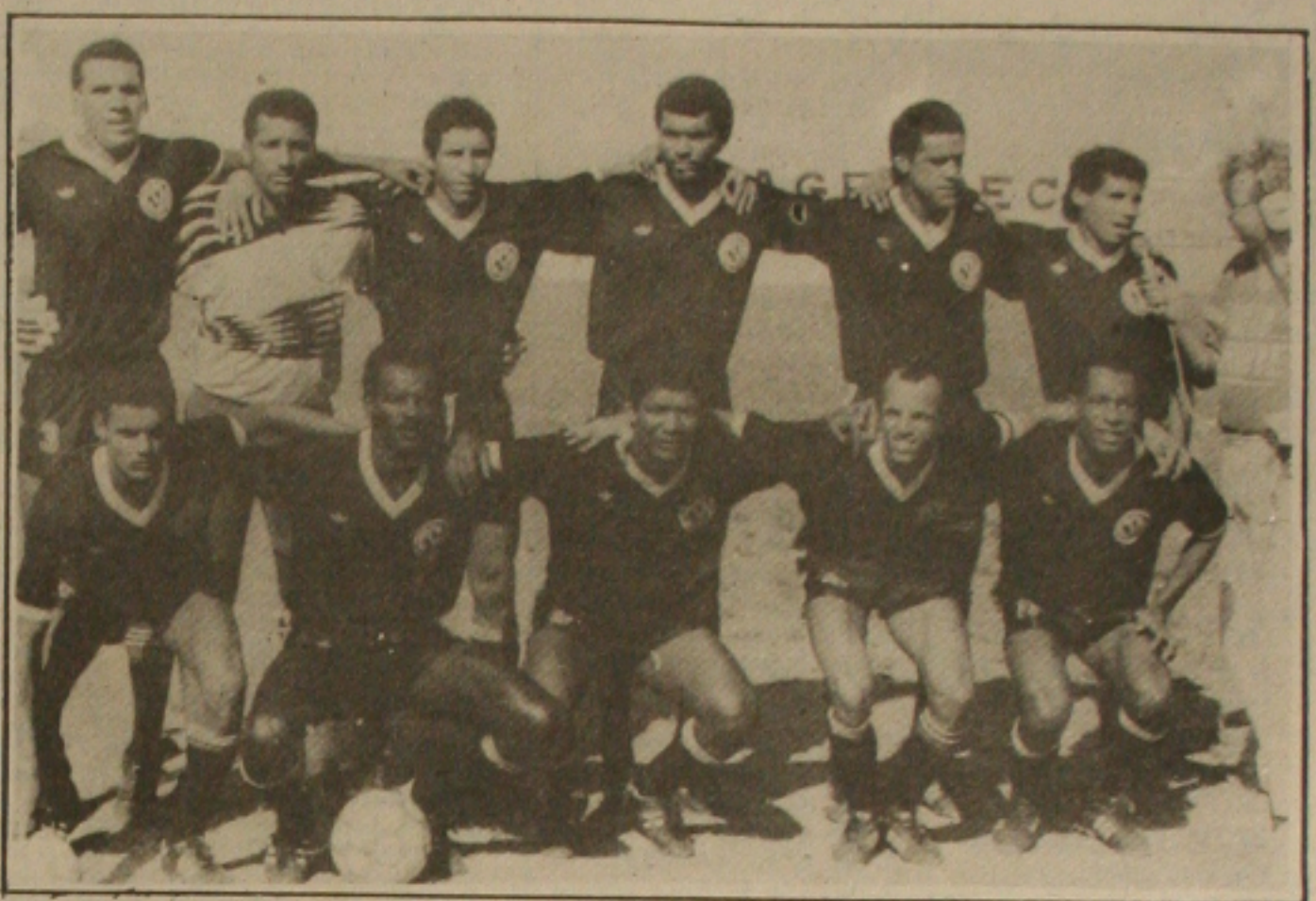
enfrenta o Maruimense, na inauguração do estádio governador Valadares. (Foto: Fernando Silva).