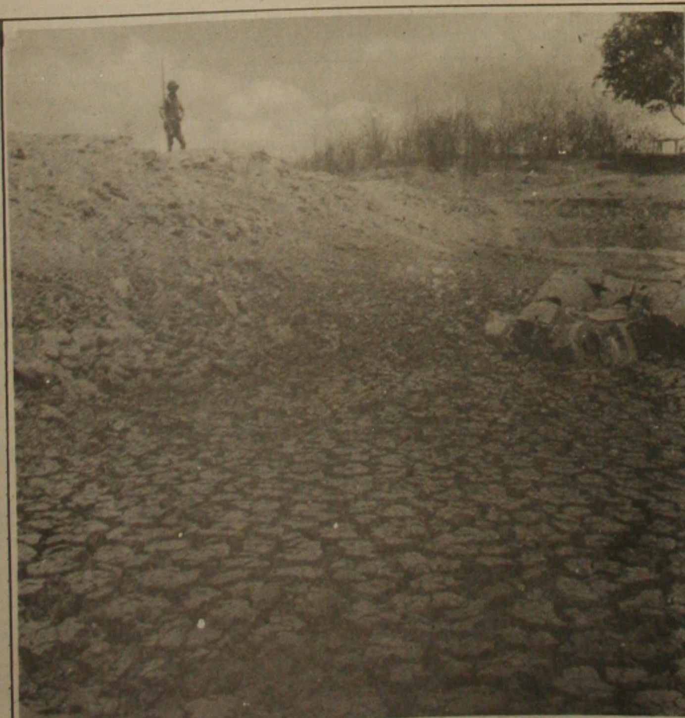
A vegetação morreu e a terra está rachada pela longa estiagem.