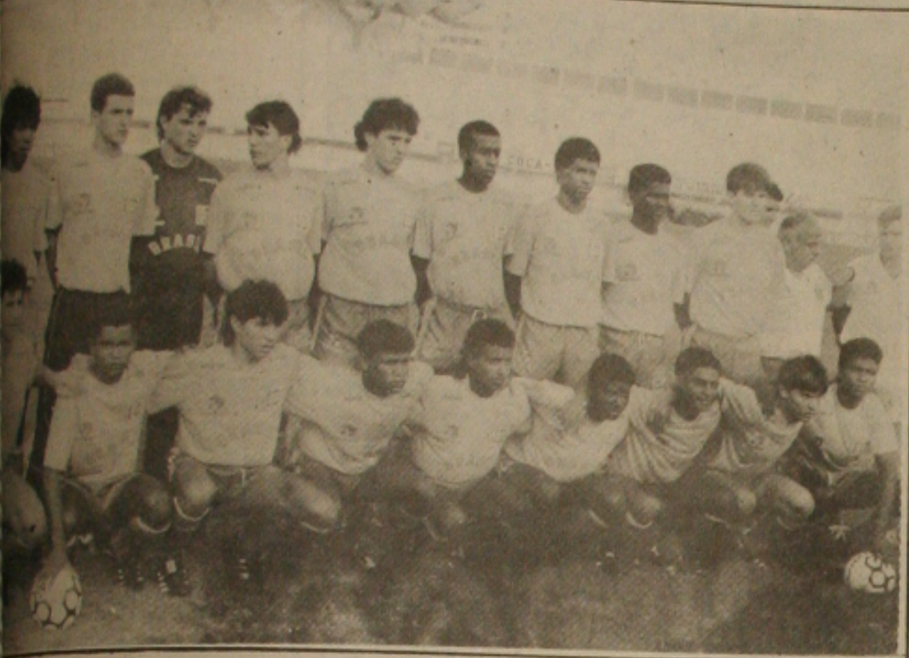
Equipe Brasileira de juvenis...