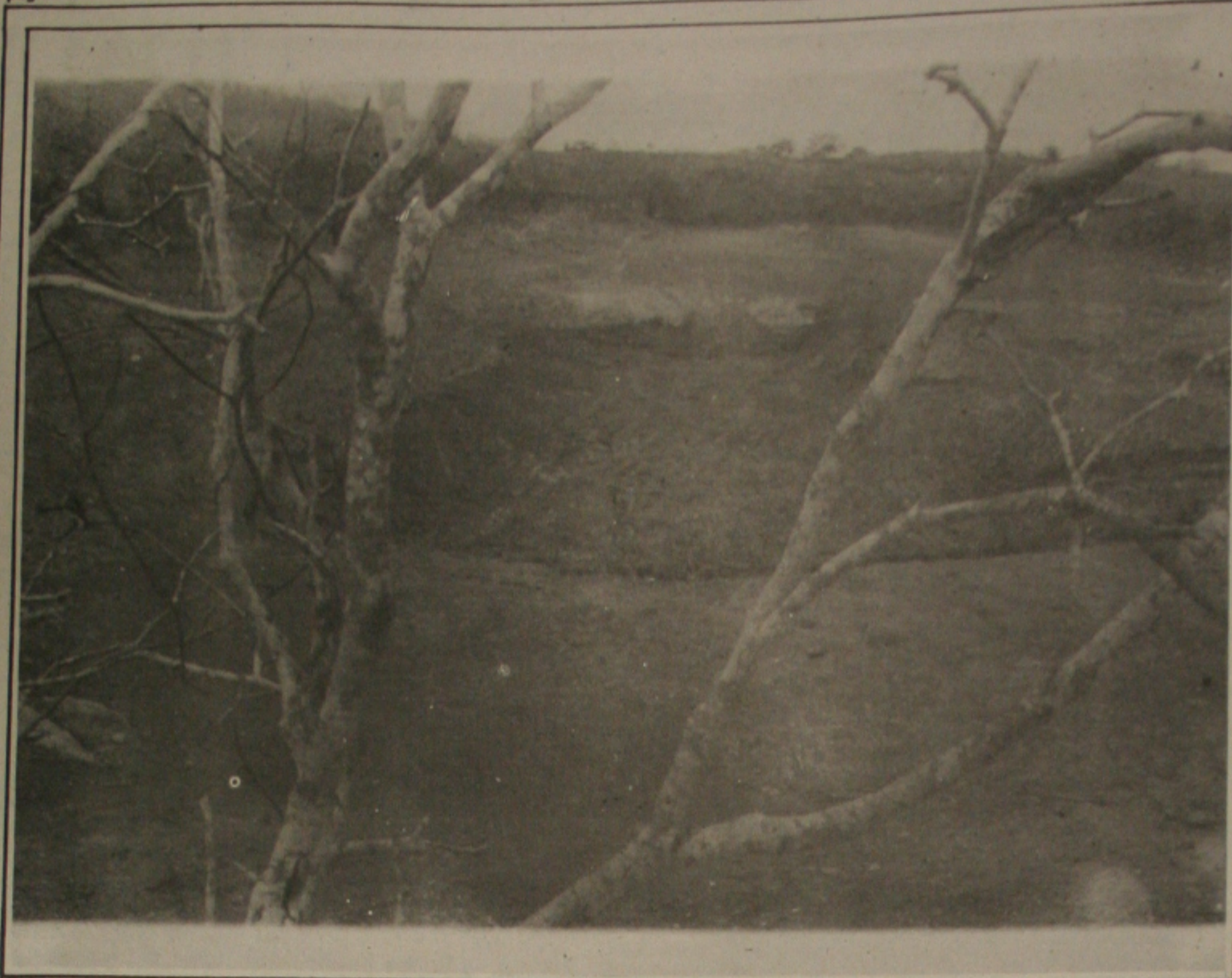
Com a estiagem prolongada o tanque secou e agora está sendo preparado para represar as chuvas que são esperadas pelo homem do campo.