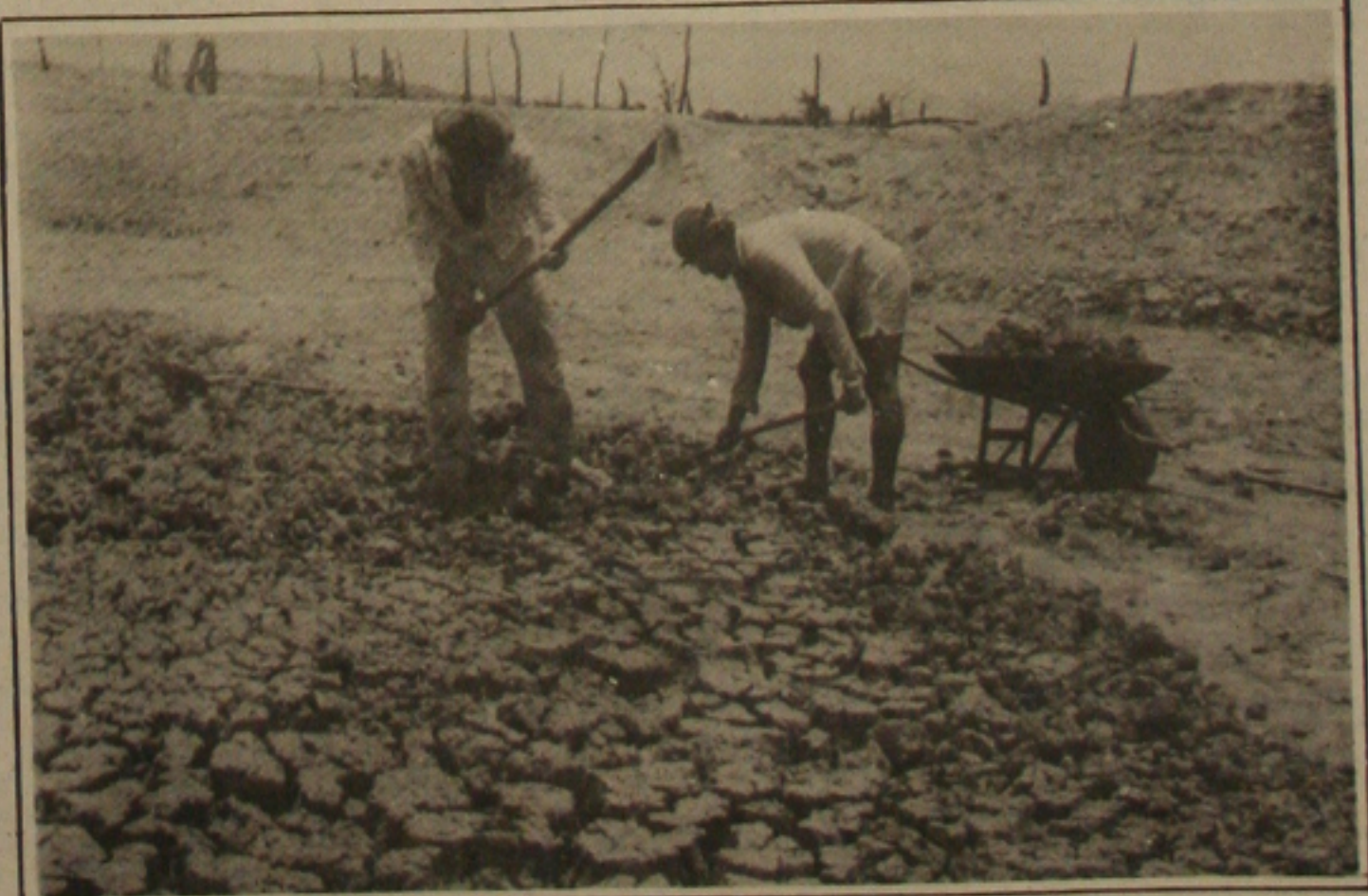
Os sertanejos limpam o tanque na certeza de que em breve a chuva cairá para acabar com o martírio.

Editoria de Cidade Texto: Cássia Santana Fotos: Luiz Carlos Moreira