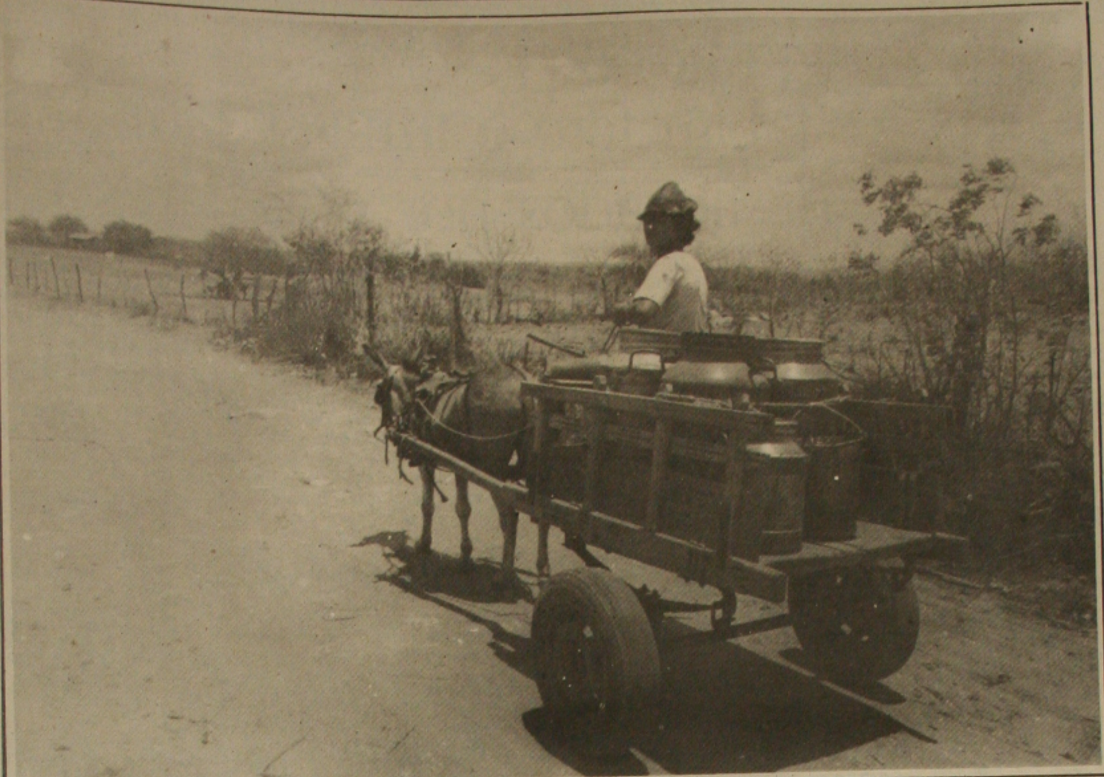
O garoto com sua carroça sai em busca de algum açude para encher os vasilhames e se manter no sertão aguardando melhores dias.