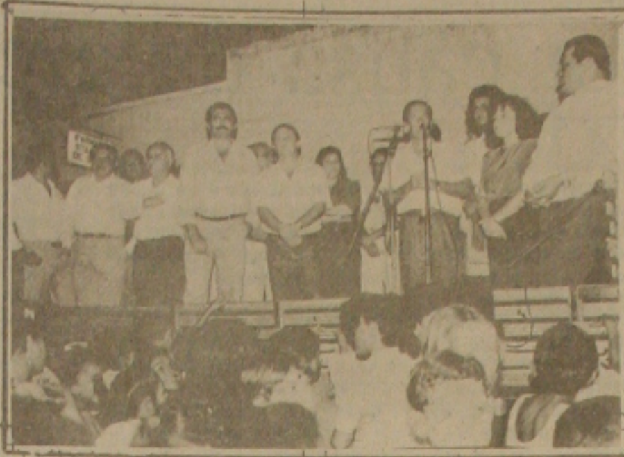
Políticos e a população beneficiada não têm faltado as inaugurações de obras construídas na administração de Valadares, que discursou em Pedrinhas.

Em seguida o governador foi a Pedrinhas, sendo recebido pelo povo do Município e o prefeito Eribaldo Alves Goes (Bó). O prefeito fez questão de no palanque enumerar os diversos benefícios traduzidos em obras para a sua comunidade, entre elas a doação de um ôni-