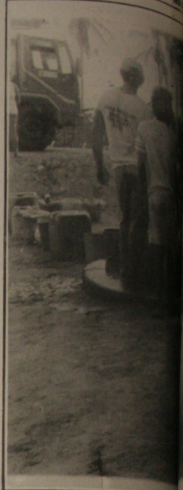
Os moradores da Zona Rural disputam, em longo fila, um balde de água.