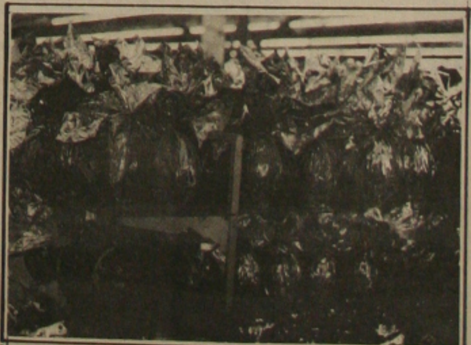
Ainda é fraca a venda de ovos de páscoa nos supermercados.

Mas antes de comprar vale fazer uma pesquisa de preços porque há estabelecimentos comerciais que praticam preços diferentes.