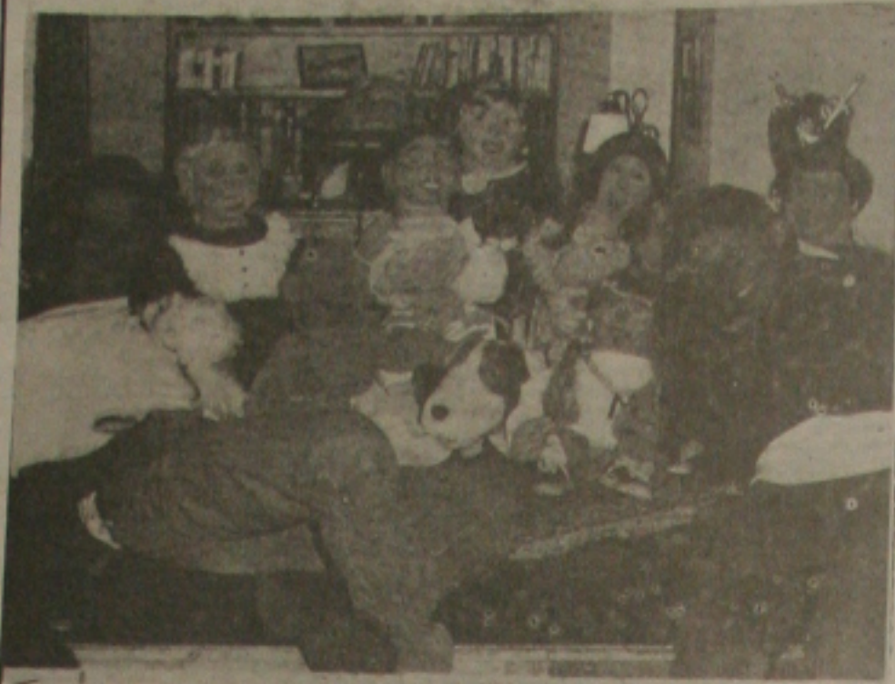
Os bonecos de Condomínio transmitem a fantasia de volta à TV.