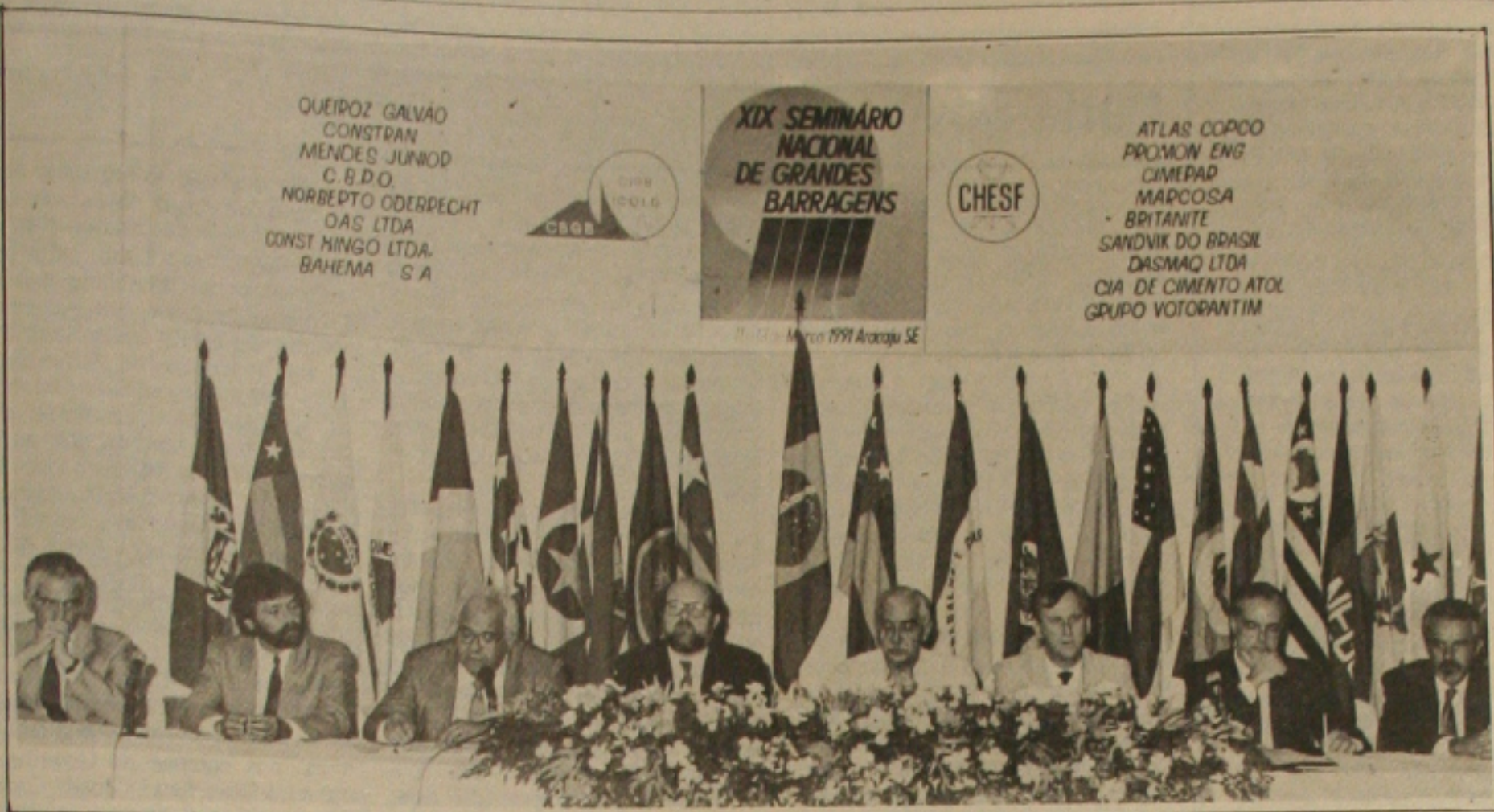
A construção da Usina de Xingó foi debatida ontem no XIX Seminário Nacional de Grandes Barragens.