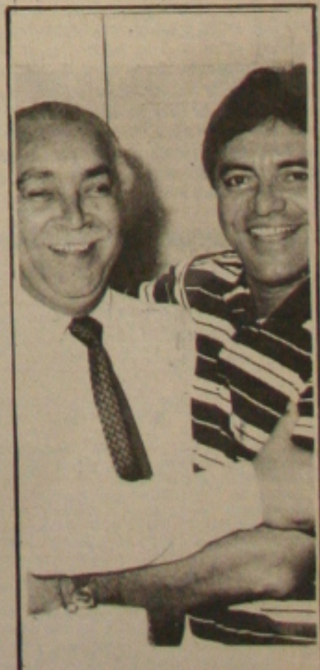
Paixão e Acival querem um PSDB unido e forte

Sobre o ingresso de fundadores do PDT ao PSDB, no mesmo dia da filiação do prefeito, Paixão disse que "o problema é de forum íntimo de cada um", mas não tem dúvidas de que os que manifestaram a vontade de segui-lo nessa nova empreitada política, são pessoas sérias, amigas e comprovadamente comprometidas com o desenvolvimento.