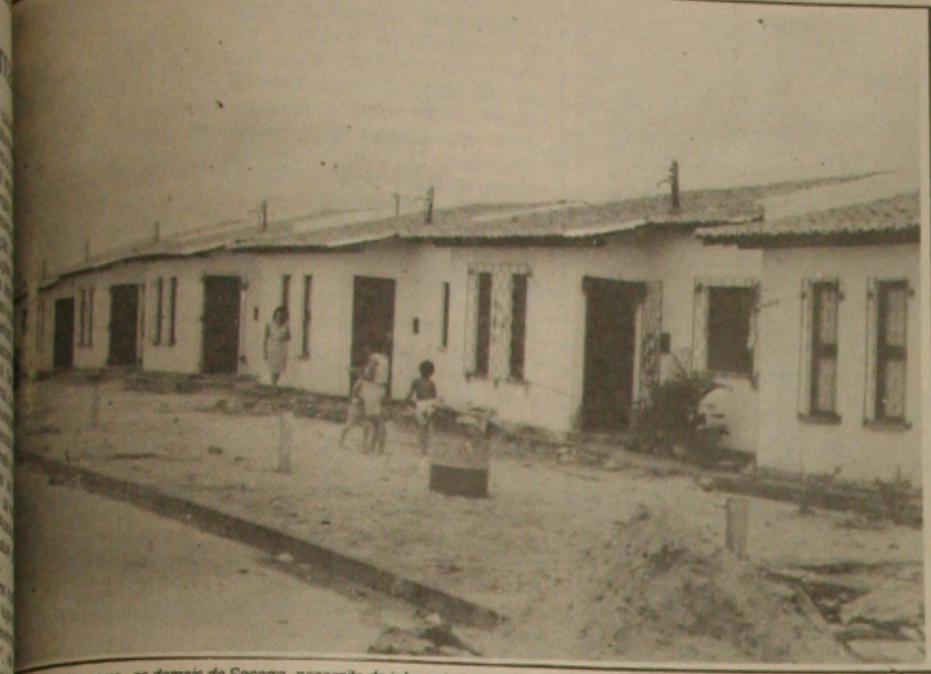
Correio Freire, como os demais de Socorro, necessita de infra-estrutura para funcionar adequadamente.