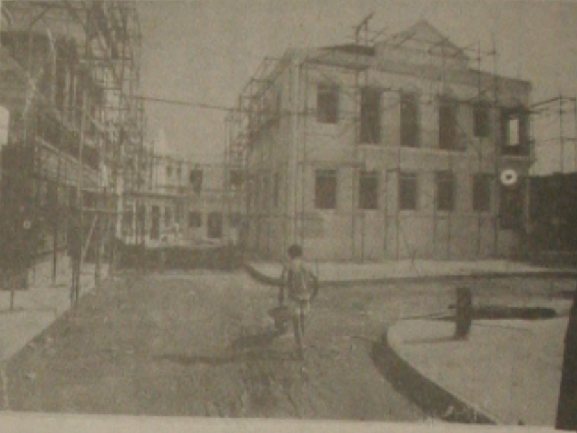
A cidade de Chico Anysio tem até o palácio do governo.