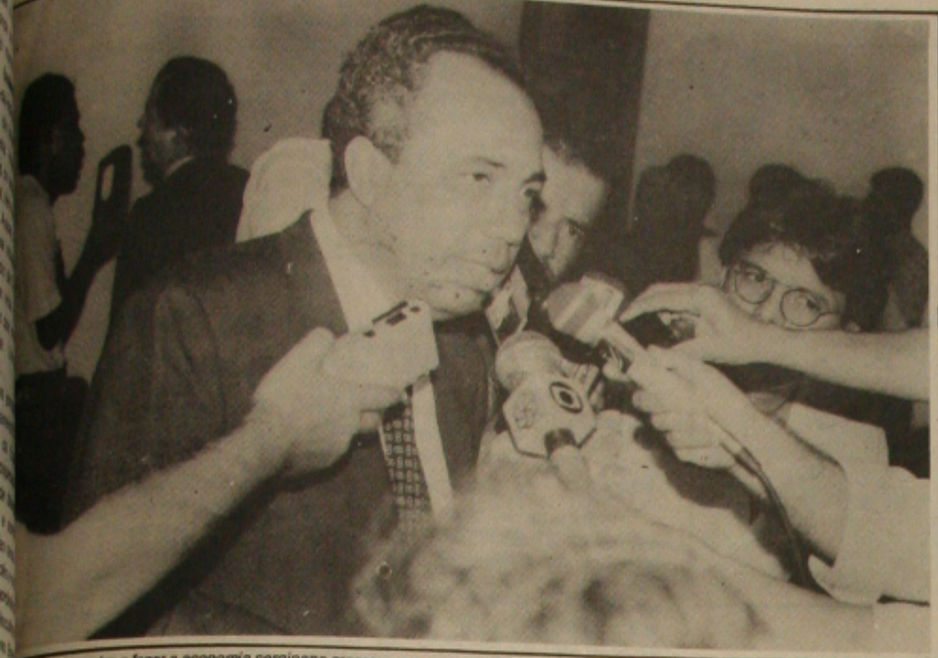
João promete recuperar a economia sergipana