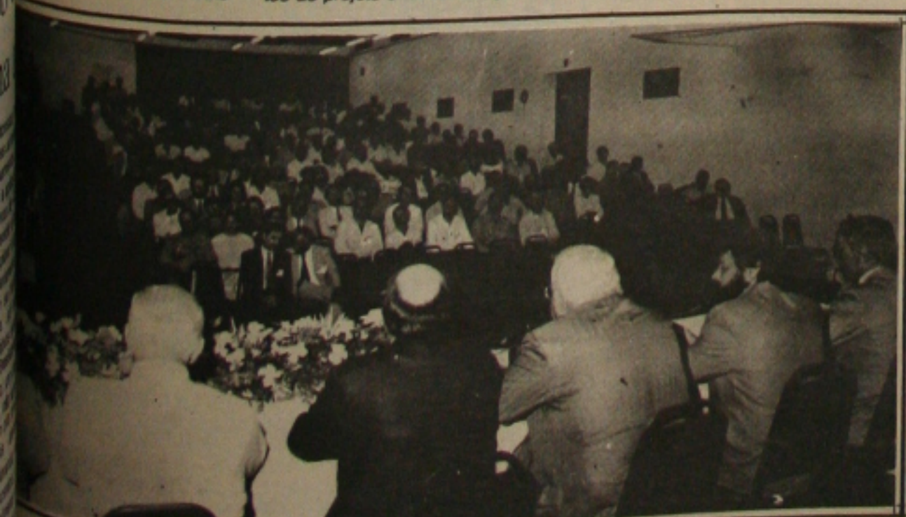
As grandes barragens são debatidas em seminário no Parque dos Coqueiros.