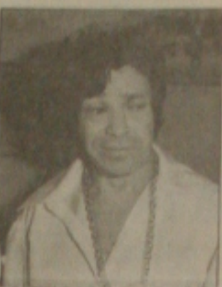
tranquilo. Com isso, ele começou a ajudar as pessoas no hospital, animando os outros doentes, com suas brincadeiras e otimismo.