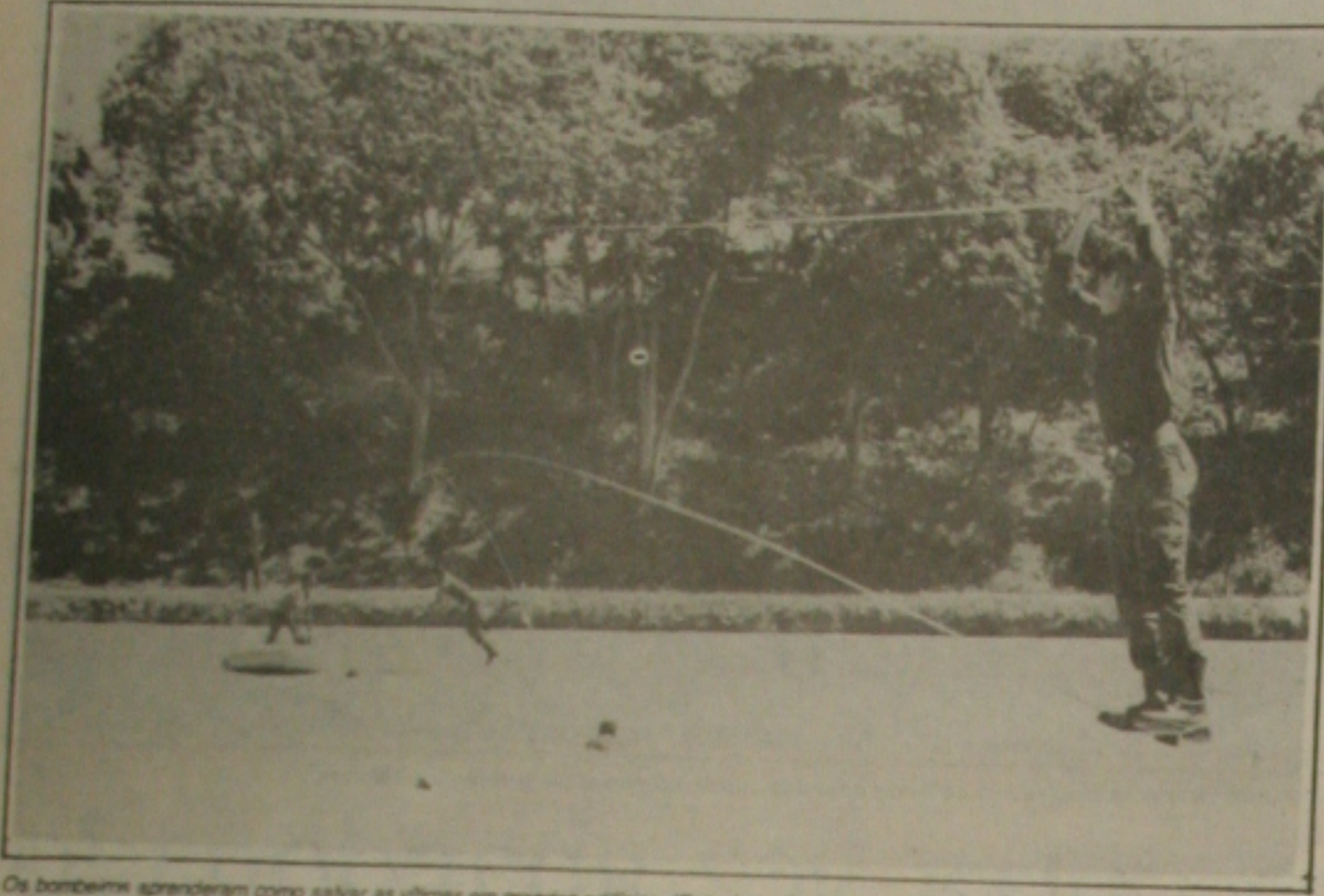
Os bombeiros aprenderam como salvar as vítimas em grandes edifícios.