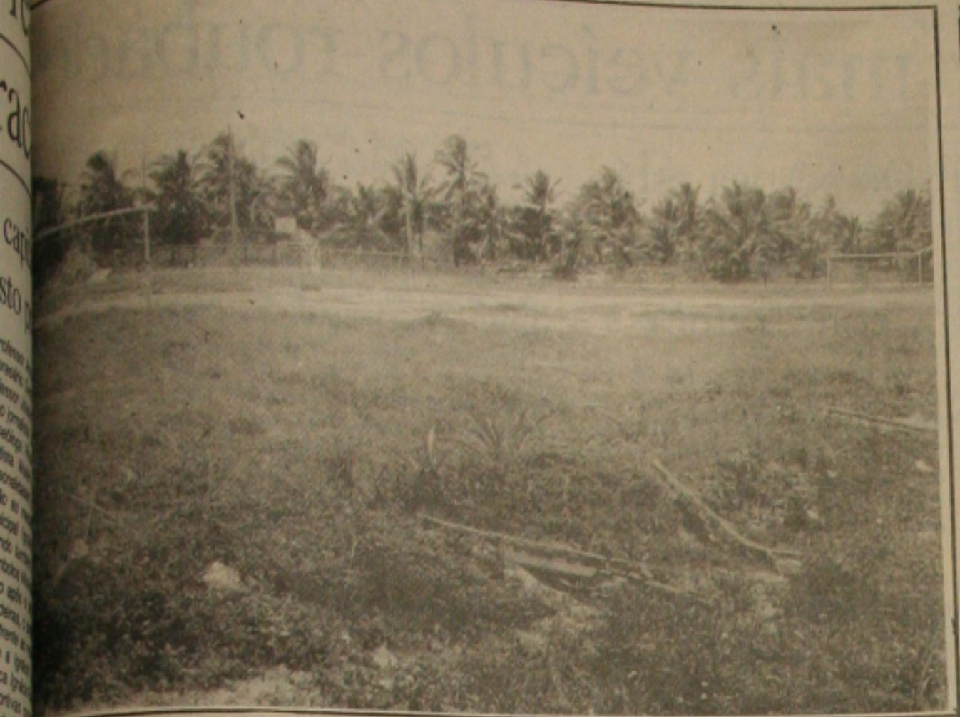
Clube do Servidor Público Estadual está entregue ao abandono, apesar dos recursos investidos pelo Governo.