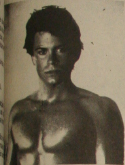
em "Sobre Ontem à Noite"

Título Original: Earth II Nacionalidade: Americana (TV) Ano de Produção: 1971 Direção: Tom Gries Elenco: Gary Lockwood, Tony Franciosa, Hylands, Hari Rhodes, Lew Ayres, Ma-Hartley, Gary Merrill, Inga Swenson, Dewey, Edward Bell, Diana Webster, James, John Carter, Herbert Nelson. No futuro, o dia-a-dia da estação espacial II, a primeira nação habitada no espaço, com cerca de duas mil pessoas. Terra II funciona como laboratório de pesquisas e como avançado no cosmo para o planeta