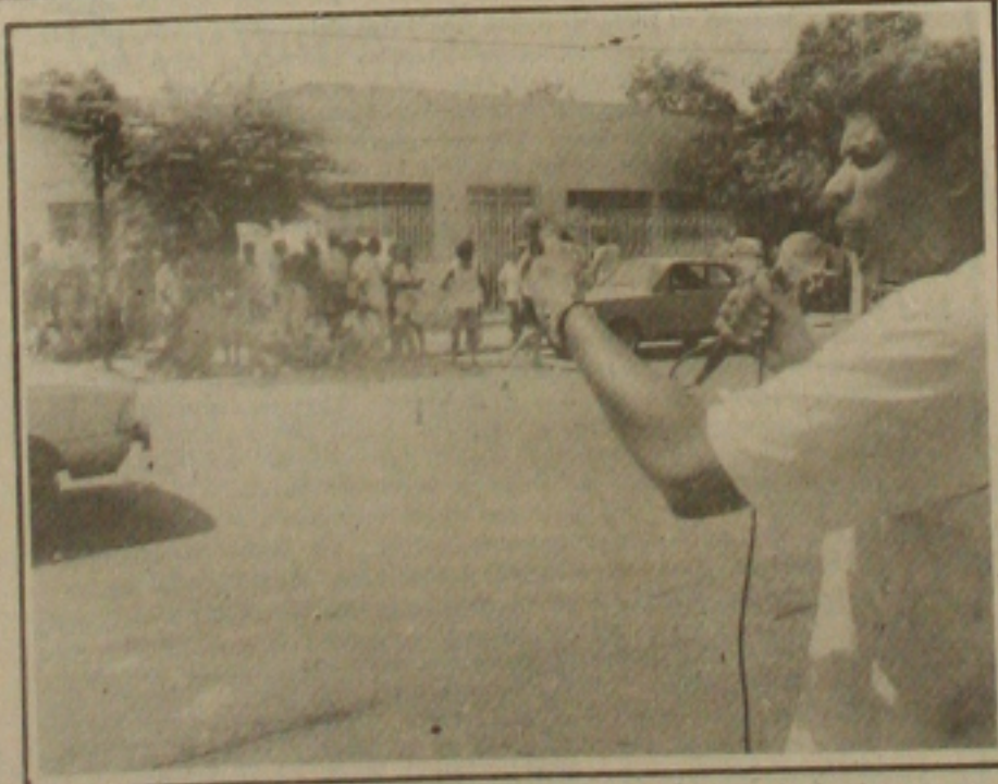
Os petroleiros continuam com as atividades paralisadas em Sergipe.