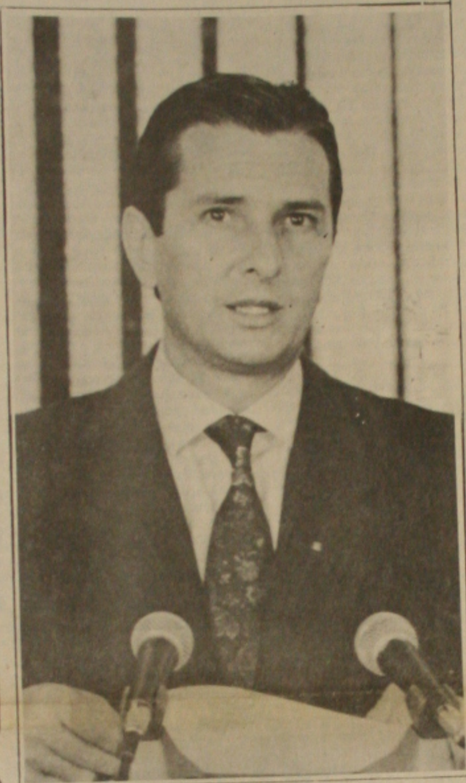
O presidente Collor no anúncio do projeto de reconstrução nacional.

Para o amistoso contra a Argentina, dia 27, em Buenos Aires, Falcão pretende convocar a força máxima. Sendo assim, é seu pensamento convocar "estrangeros" para substituir outros "estrangeros" que não possam jogar. Se Taffarel, Aldair, Mazinho ou João Paulo não puderem ser liberados, é idêntica a possibilidade de convocar outros jogadores brasileiros que atuam no exterior.