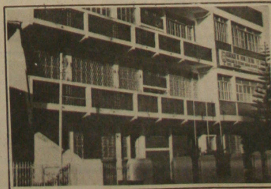
Na Pio Décimo, os alunos pagam até ágio nas mensalidades.