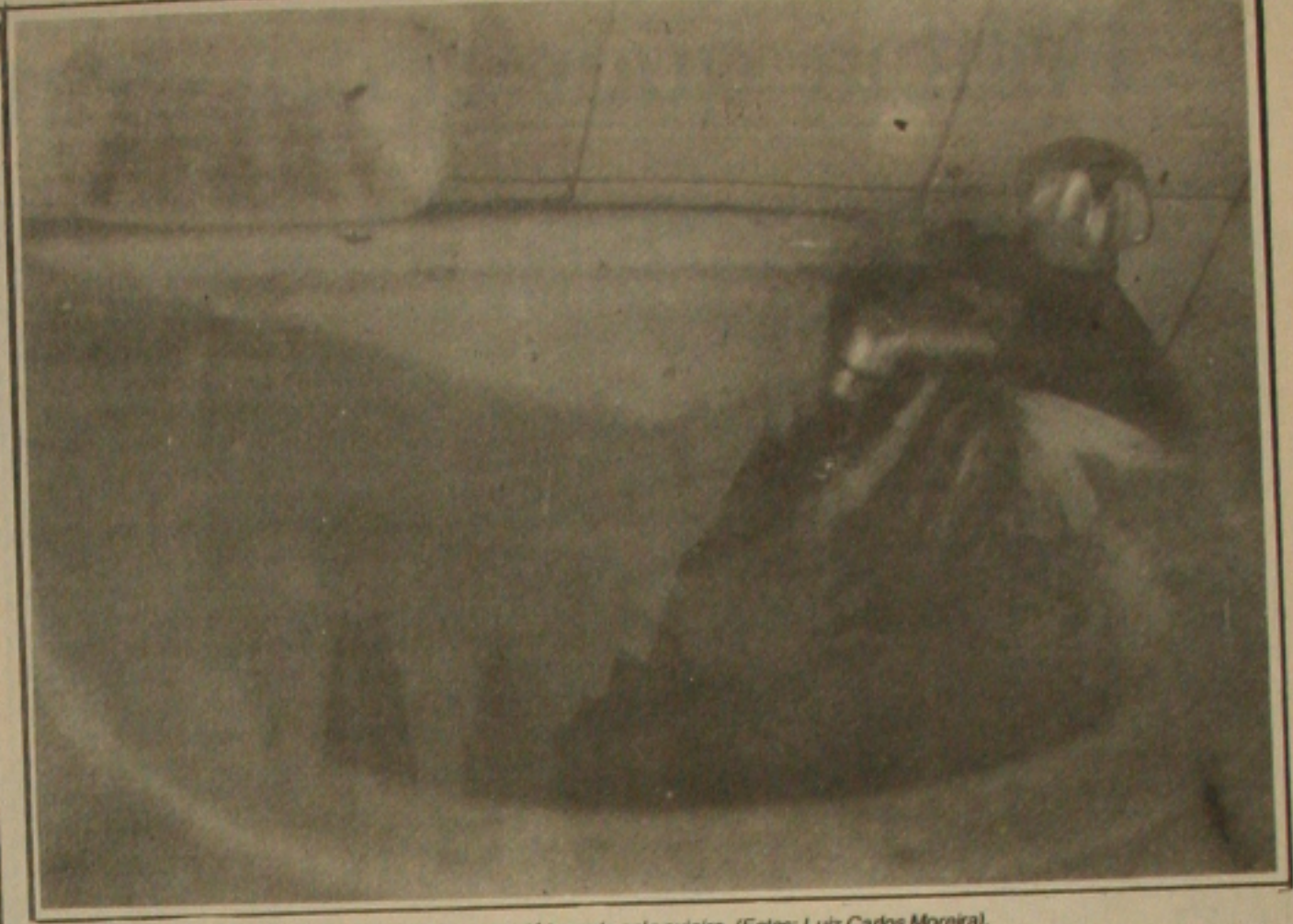
A ação dos vândalos destruiu a pia do banheiro que está tomada pela sujeira.