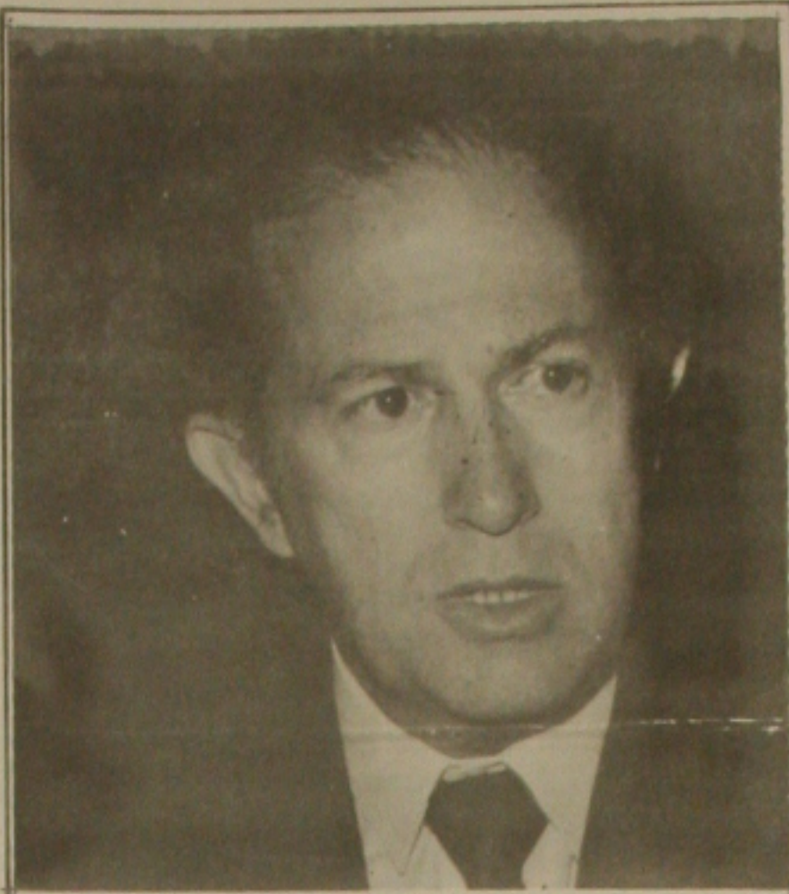
Senador Albano Franco, presença viva nos trabalhos em prol do desenvolvimento industrial de Sergipe.