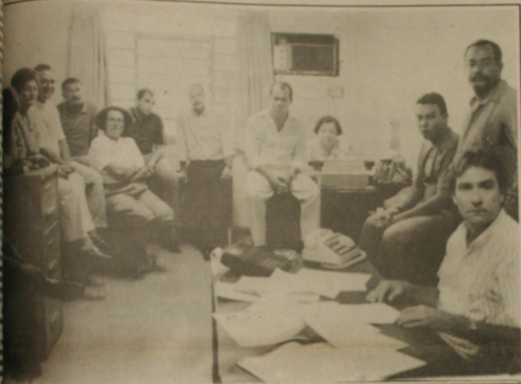
Os portuários do Porto de Aracaju se reuniram, ontem, quando decidiram pela paralisação das atividades na quinta-feira.