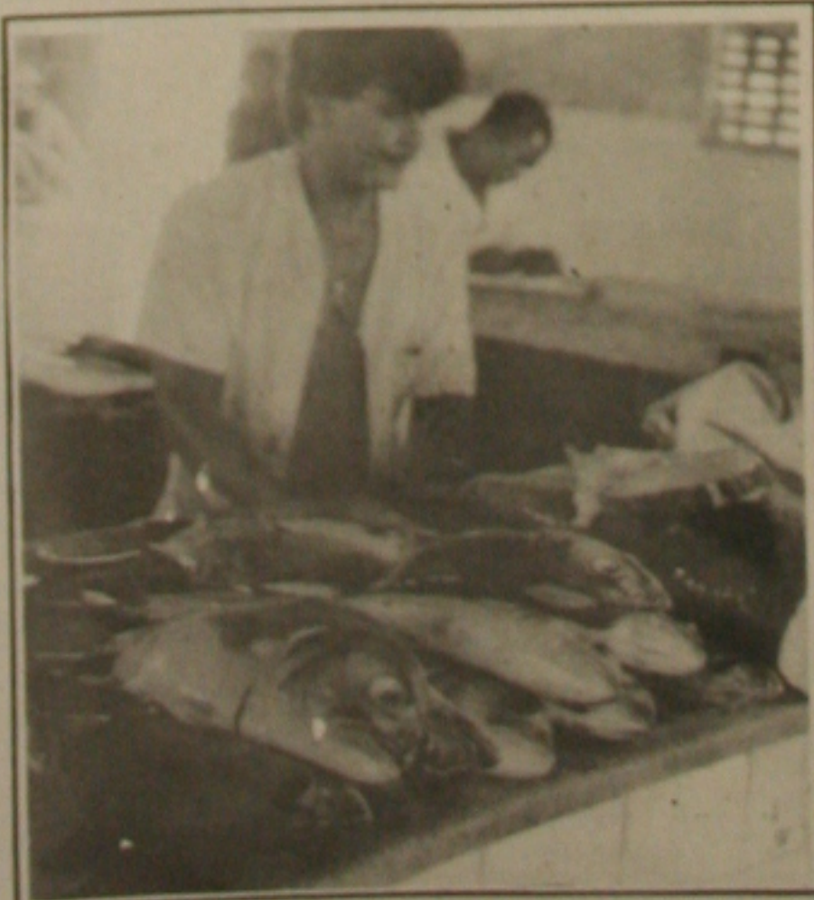
A Sunab vai tabelar o pescado para a Semana Santa em todo Estado.

O quilograma do cação ou arraia custou Cr$ 600 enquanto que o inteiro (vermeia e outros) foi vendido a Cr$ 800 e a posta chegou a ser comercializada a Cr$ 900.