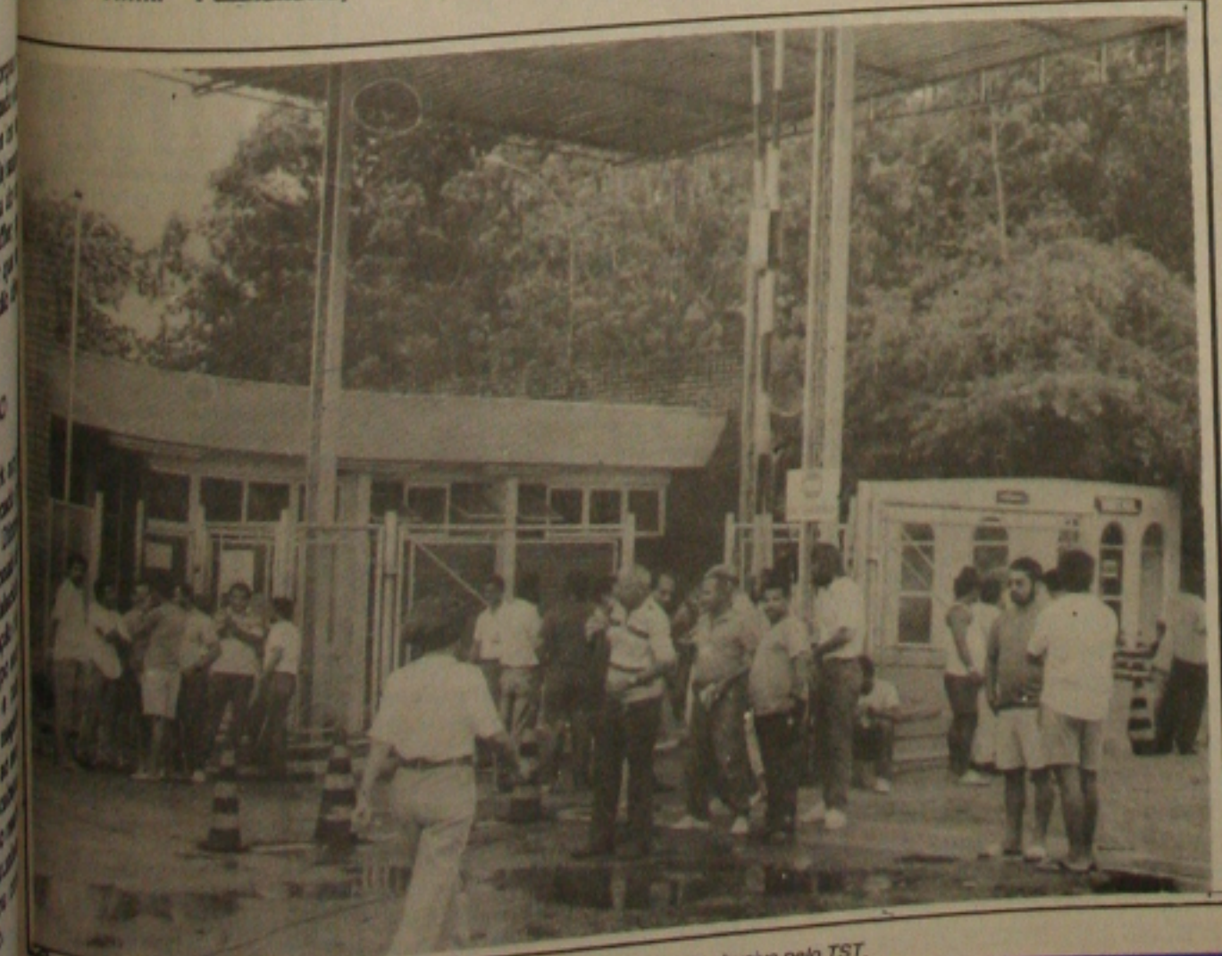
Petroleiros acompanharam na sede da RPNE o julgamento da greve considerada abusiva pelo TST.

blemas surgidos com as finanças estaduais, foi impossível a equipe do novo Governo concluir em tempo hábil o projeto a ser encaminhado ainda na administração do ex-governador Antônio Carlos Valadares", comentou Machado. Ele disse que as mudanças são profundas e radicais, e necessitam ser amplamente debatidas pelos deputados, que nas discussões terão oportunidade para aperfeiçoar o projeto. (Página 3).