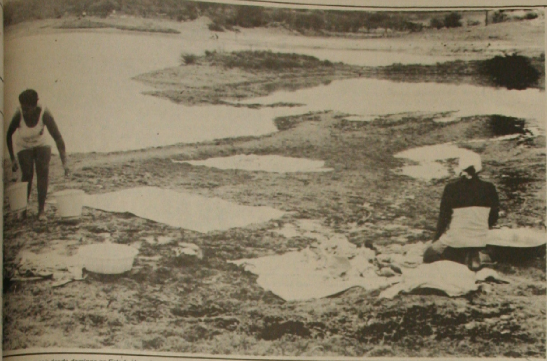
Chuva começou a cair desde domingo no Estado já mudou a paisagem de alguns municípios com a represa da água nos açudes.