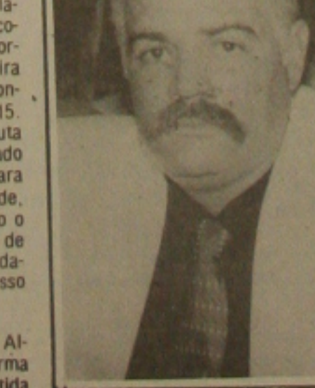
Laércio mencionou Collor de Mello