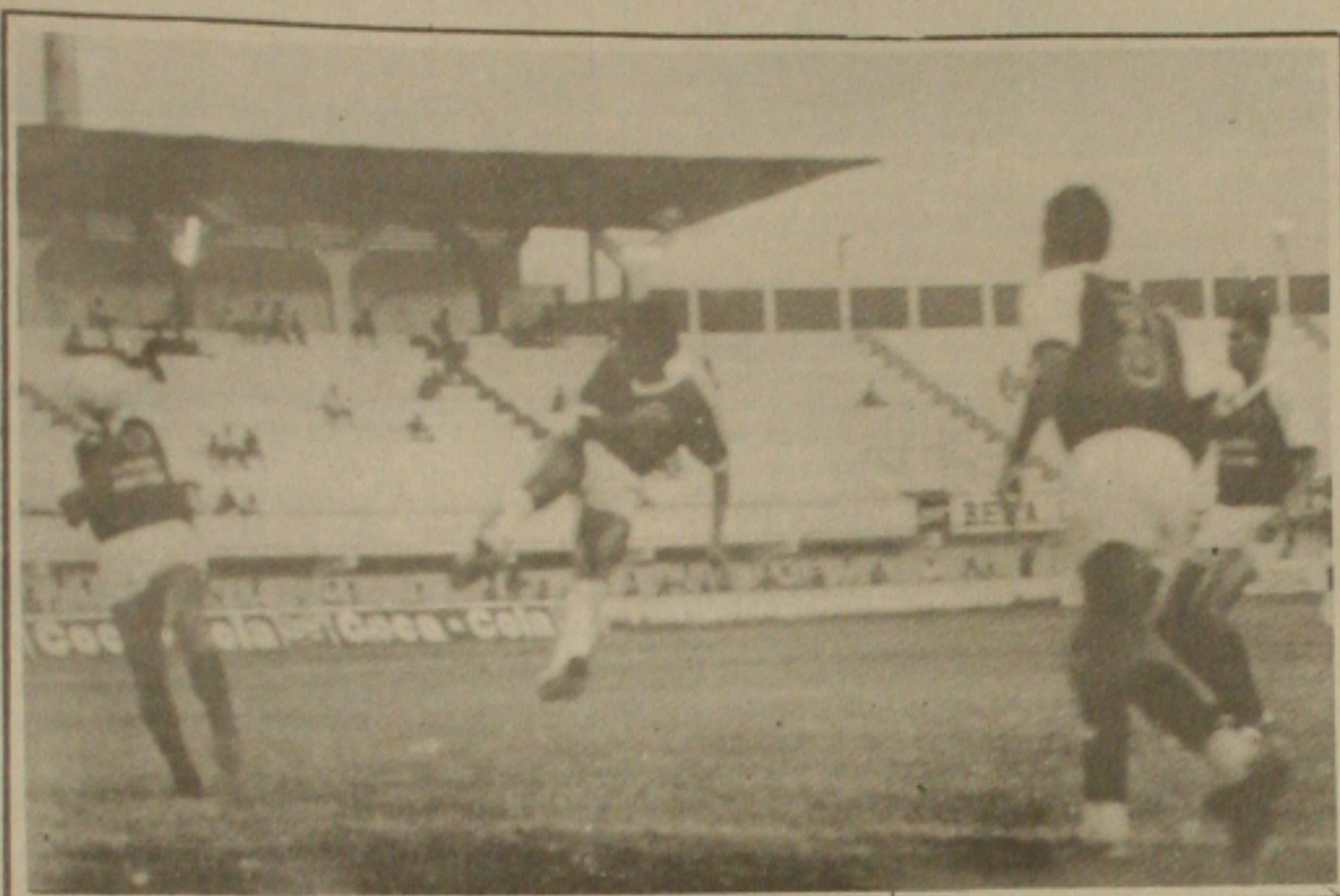
O Sergipe venceu fácil ao fraco União: 5x0

teve que ser substituído por Paulo Sérgio. Enquanto o vestiário do Sergipe vivia momentos de alegria pela vitória, o treinador Dimas, no União lamentava a derrota e principalmente o número de gols, ele afirmava que foi um verdadeiro castigo a vitória do Sergipe contra o União. Mas justificava a derrota pelo fato do time ter sido totalmente diferente do que treinou na sexta-feira. O União está a espera da liberação de nada menos que sete jogadores. Dos considerados titulares, apenas quatro atletas estiveram em campo. No próximo compromisso, a esperança de Dimas é que possa contar com o time completo. O União enfrenta o Itabaiana domingo no Pre-