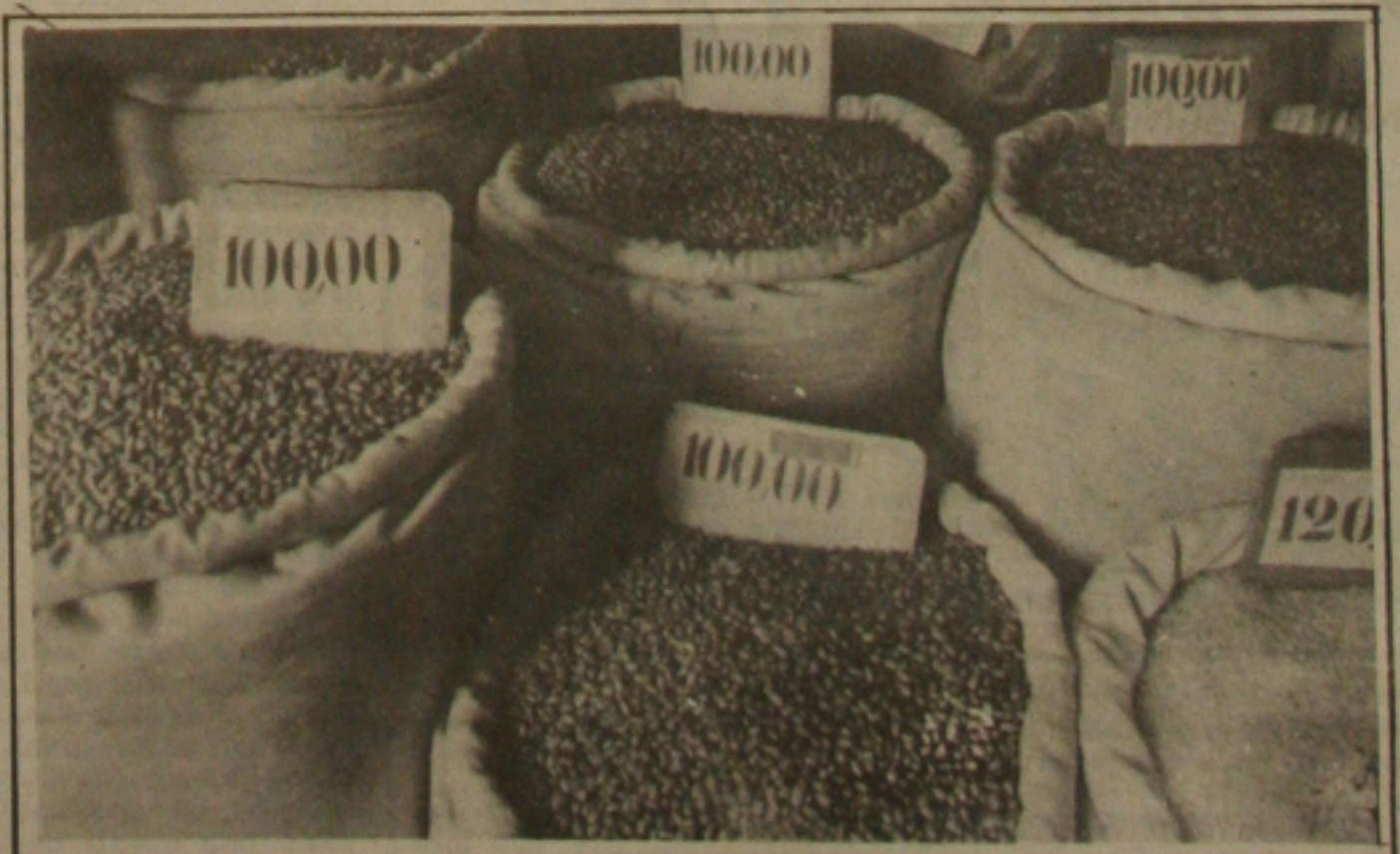
O feijão começa a sobrar nas feiras livres de Aracaju, pelo preço.

Para sanar os problemas de caixa dos cofres públicos, a Secretaria de Economia e Finanças deverá arrecadar ainda este mês um montante equivalente a aproximadamente Cr$ 500 milhões, correspondente a cerca de 30 por cento do Imposto de Circulação sobre Mercadorias e Serviços, (ICMS), que ainda não foram recolhidos. Além deste montante, a Secretaria de Finanças está aguardando a liberação das duas parcelas do Fundo de Participação que ainda não foram liberadas.