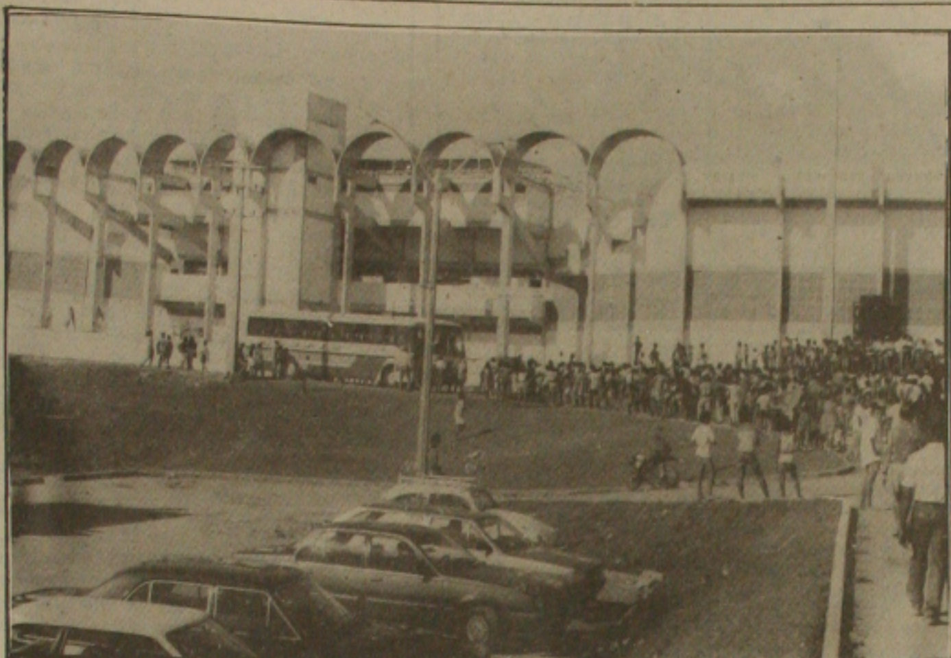
A Construtora Góes-Cohabita ameaça não reabrir o estádio Antônio Carlos Valadares, para o jogo entre Maruimense e Sergipe.

Empatando jogando domingo pela manhã no Estádio Adolfo Rollemberg, o Santos Torneio dos Campeões, o Santos