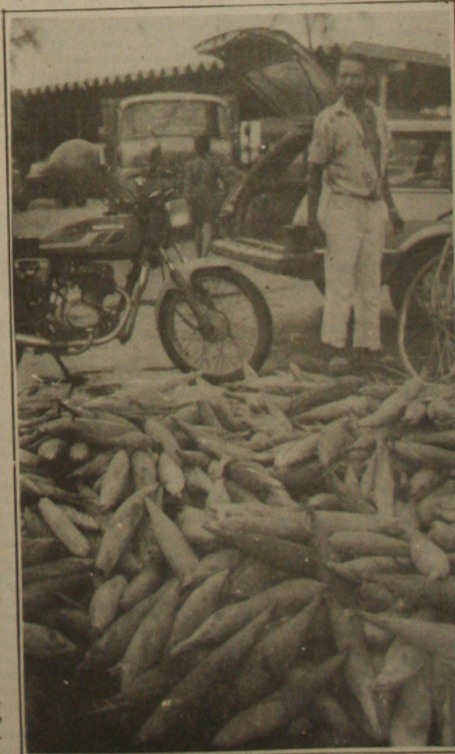
Os produtos sobram na Ceasa por falta de compradores.

As chuvas que estão caindo no sertão sergipano não serão aproveitadas pelos agricultores para a plantação de cereais, devido a falta de sementes no mercado. Foi o que denunciou ontem o presidente da Felase, que vai procurar o secretário da Agricultura, Edmilson Machado, na tentativa de obter sementes para os pequenos agricultores. Ele disse que o Estado tem 160 toneladas de sementes para as áreas de colonização e no Estado serão necessárias 300 toneladas. (Página - 3-B).