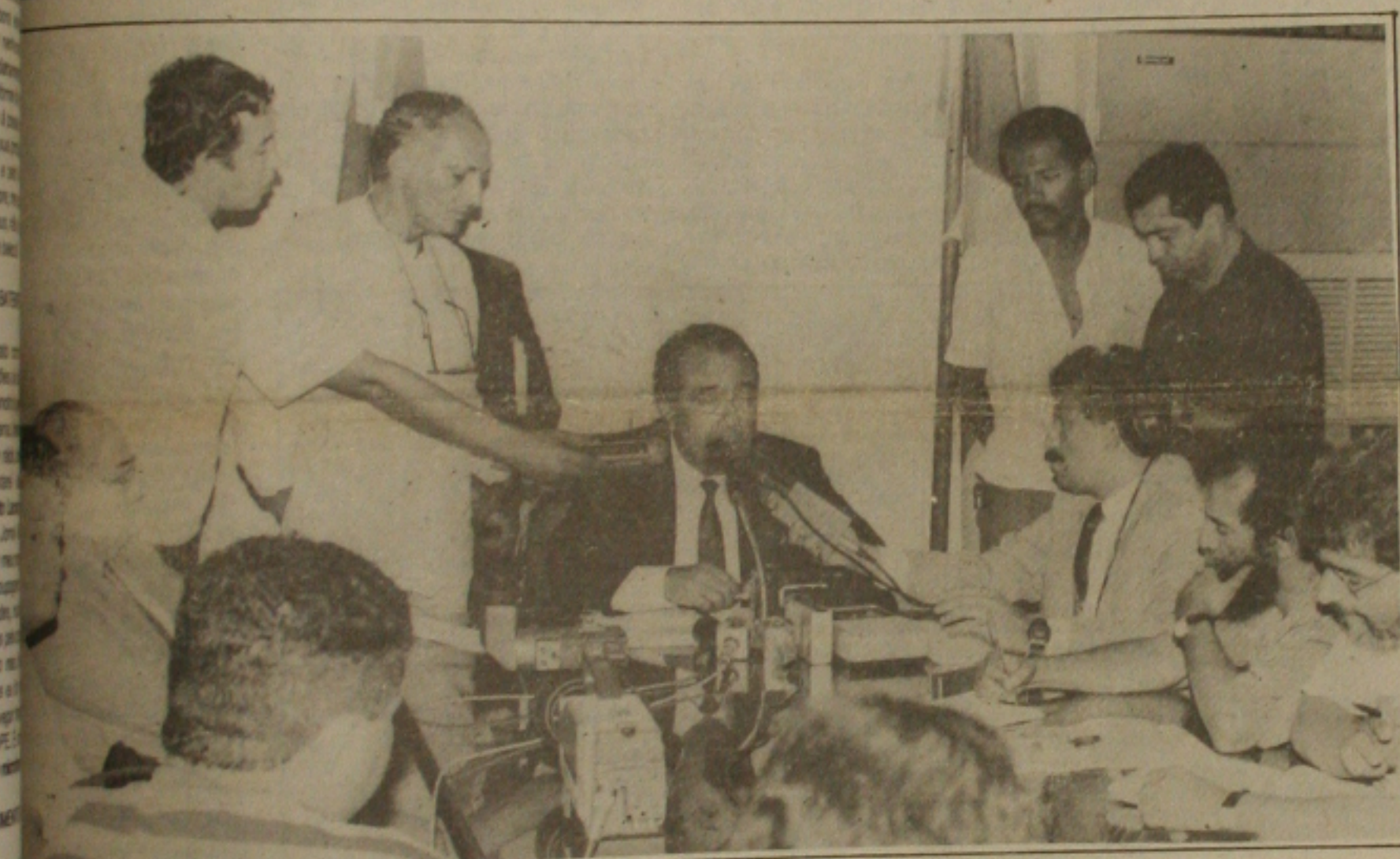
João Alves anunciou as medidas durante entrevista coletiva no Palácio Olympio Campos.

Diante da "caótica" situação financeira do Estado, o governador João Alves Filho anunciou ontem em entrevista coletiva à imprensa, as primeiras medidas para o enfrentamento da crise. Impossibilitado de pagar o débito de 13 milhões de cruzeiros deixado pela administração do ex-governador Antônio Carlos Valadares, o governador João Alves Filho decretou a moratória, suspendendo todos os pagamentos aos credores e suspendeu também o pagamento da folha salarial com o reajuste proposto pelo Governo passado, através do projeto de lei em tramitação na Assembleia Legislativa. Agora o funcionalismo público vai receber os salários de março sem reajuste e o início do calendário de pagamento ainda não foi definido.