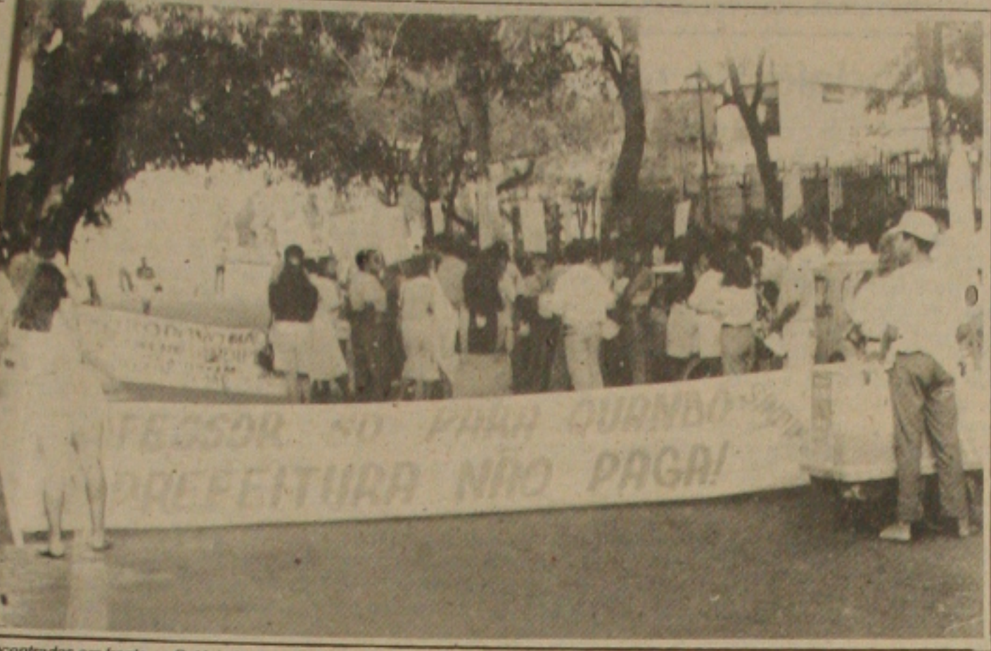
Concentrados em frente ao Palácio Ignácio Barbosa, os professores municipais realizam o protesto.

Em greve há 9 dias, por reivindicação de reajustes salarial de 61%, os professores da rede municipal de Aracaju realizaram ontem, tarde, manifestação pública em frente ao Palácio Ignácio Barbosa, sede do poder executivo municipal. Os professores portavam faixas e cartazes protestando contra a política salarial da administração municipal. Exigiam a abertura das negociações para discussão da pauta reivindicadas. Na cidade de Simão Dias, os professores da rede municipal iniciaram ontem greve por tempo indeterminado. Eles também indicam reajuste salarial e denunciam que tem professor ganhando até 6 mil cruzeiros por mês. (Página 3-B).