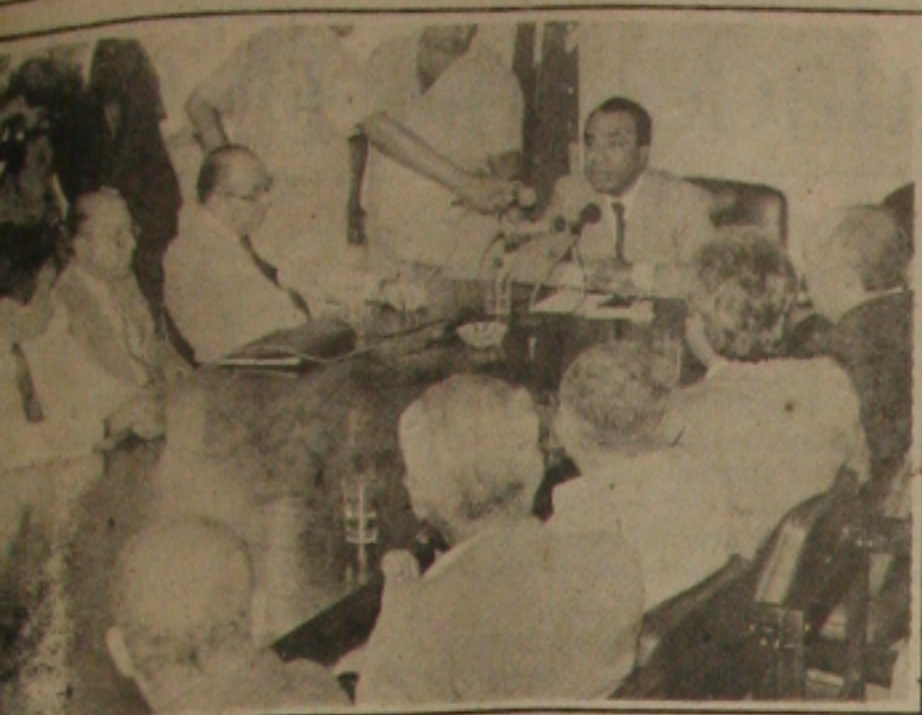
... (em centro) fala sobre a colaboração do empresariado.