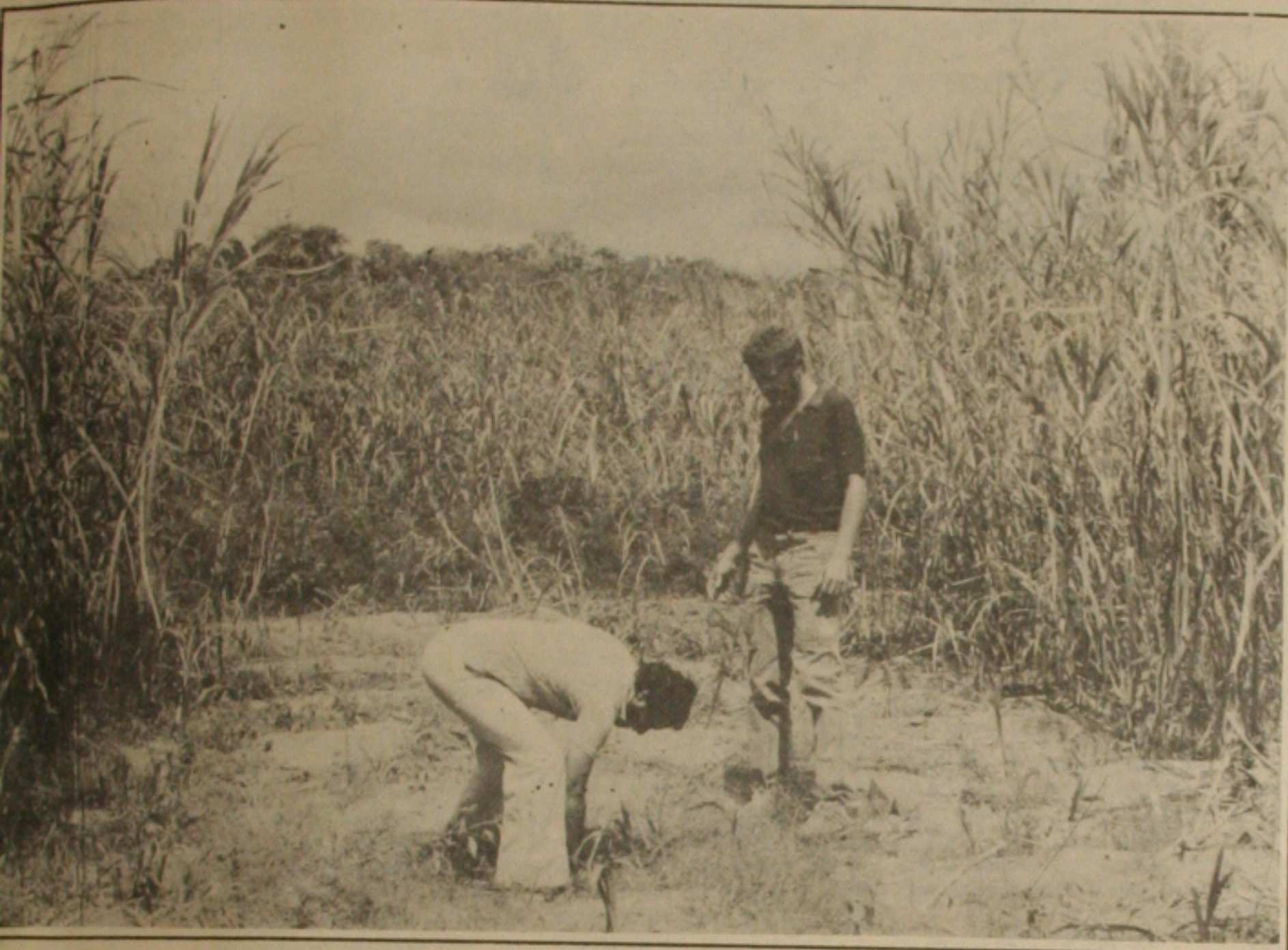
Agricultores preparam a terra para iniciar o plantio depois de um longo período de seca que devastou a lavoura no semi-árido.