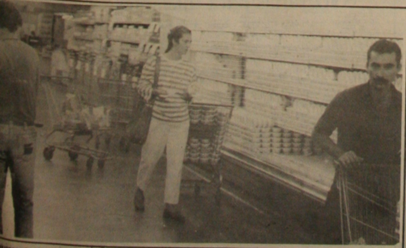
Consumidores não observam mais os preços dos produtos.