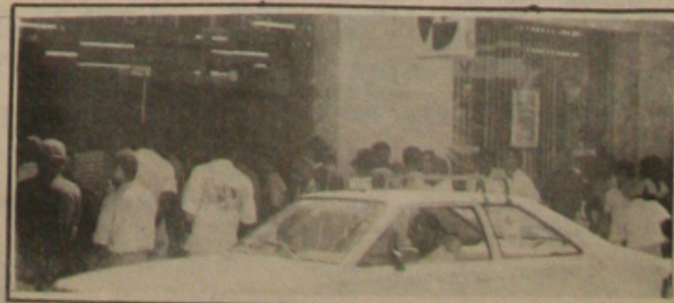
Os bancos estiveram superlotados com longas filas.