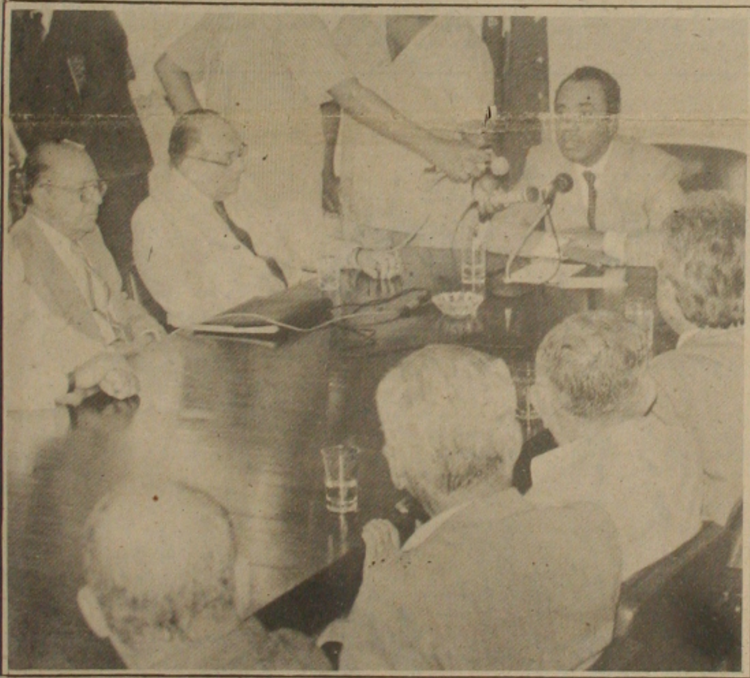
O governador recebeu os empresários e agradeceu o atendimento do pedido para antecipação do ICM por 6 meses.