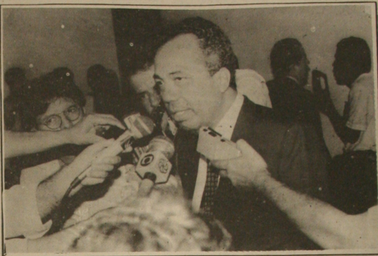
João chega hoje, às 11 horas, e deve trazer novidades sobre a obtenção de recursos para administrar o Estado com a reforma implantada.

Após enumerar uma série de vantagens que o governador João Alves Filho concedeu no seu primeiro Governo para os servidores públicos estaduais, como o 13º salário, a estabilidade e o turno único, o líder do Partido da Frente Liberal na Assembleia, deputado José Carlos Machado, afirmou que João não pretende fazer demissões e que não é o bicho-papão dos servidores, conforme imagem que tentam fazer dele.