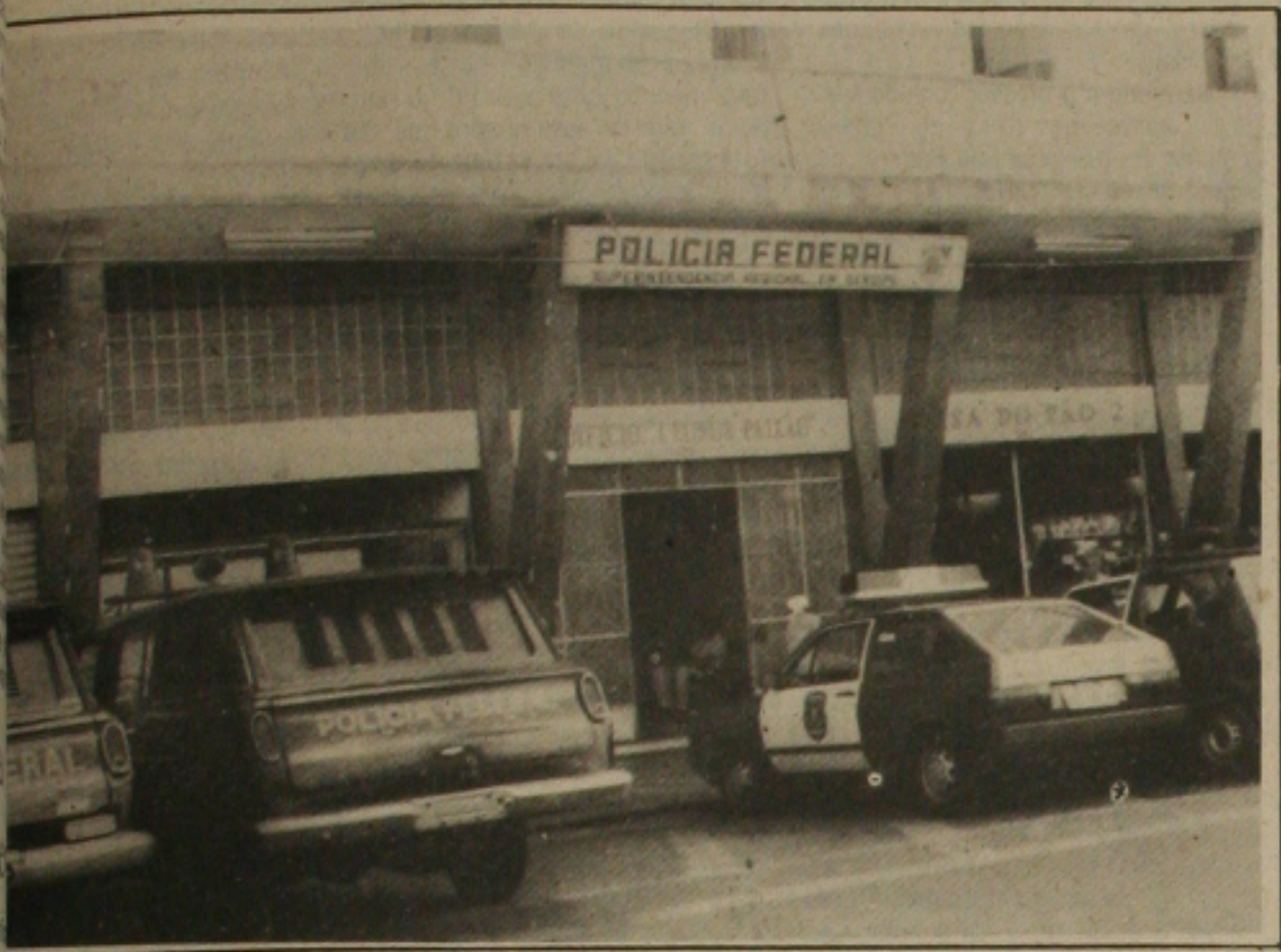
Relatórios concluídos pelos auditores do INSS serão remetidos para a Polícia Federal