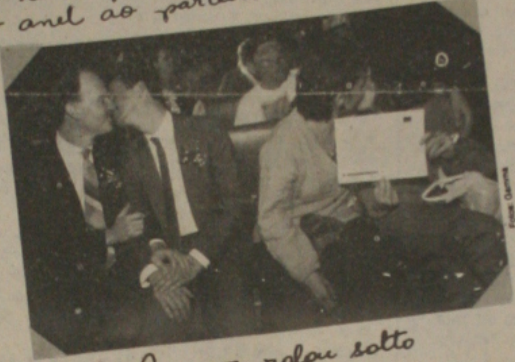
O amor rolou solto na cerimônia

G ays e lésbicas de todo o mundo, uni-voe! Ao menos em San Francisco, nos Estados Unidos, a união legal entre pessoas que gostam da mesma fruta está liberada. Em janeiro passado, foi sancionada uma lei que reconhece oficialmente casais do mesmo sexo que já moravam juntos, mas se encontravam em situação irregular devido à falta de um dispositivo constitucional deste nível.