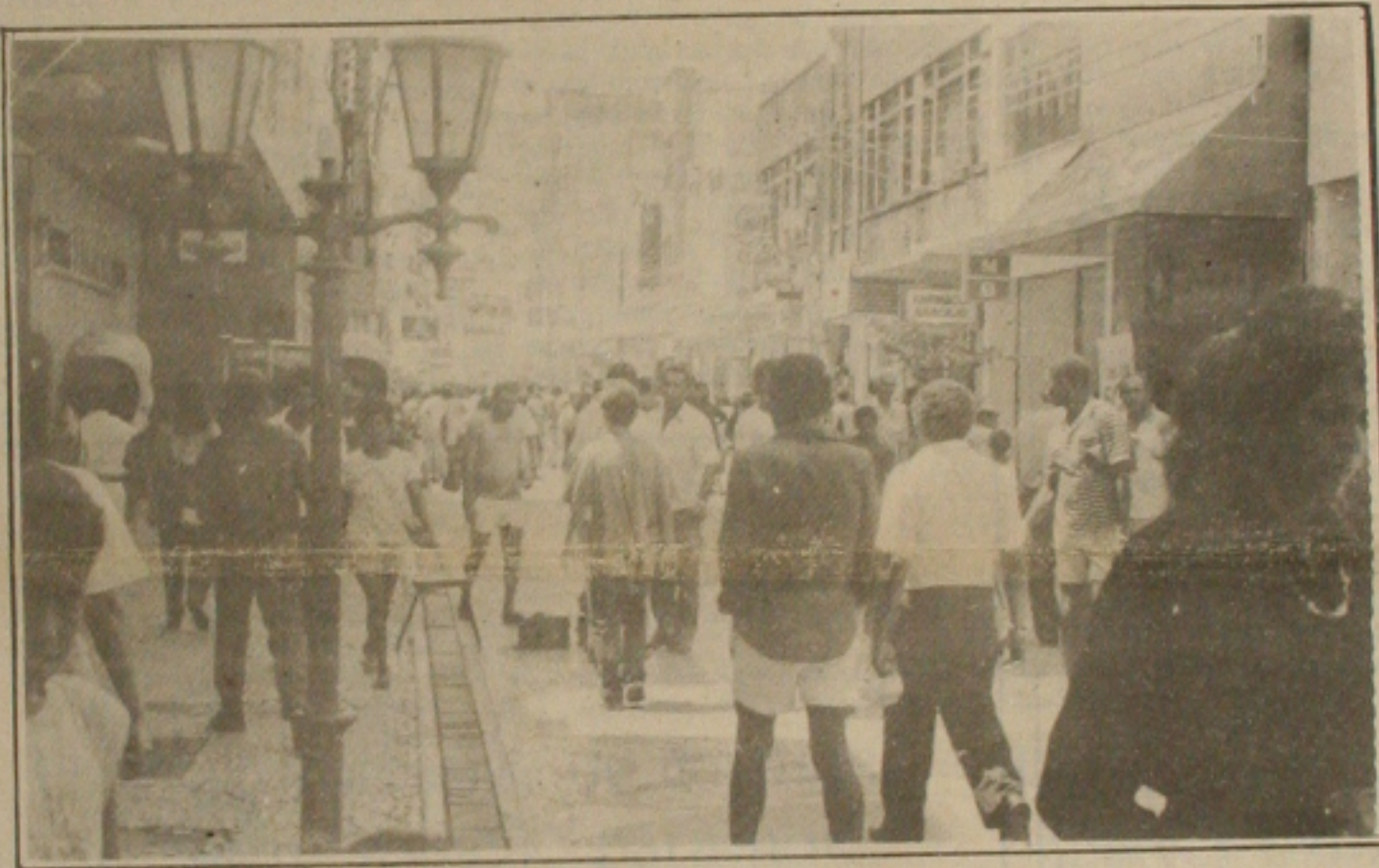
O comércio de Aracaju cria instrumentos para anular os direitos dos consumidores.

Até mesmo o ministro Rogério Magri, em entrevista concedida à imprensa, após a audiência com o presidente Fernando Collor, admitiu que o relatório foi frustrante. Ele revelou que o "presidente não ficou satisfeito com a resposta, eu não fiquei satisfeito, ninguém ficou satisfeito, por isso vamos continuar investigando". Magri concordou que a listagem da Dataprev é fria, pois, dos 315 aposentados relacionados como marajás, apenas 34 recebem aposentadorias superiores a 50 salários mínimos. (Página 4).