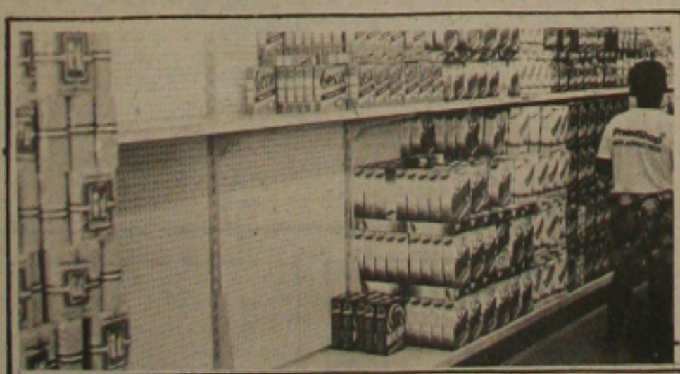
Os produtos faltam nos supermercados