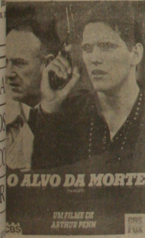
O ALVO DA MORTE UM FILME DE ARTHUR PENN CBS FOX

Um dos últimos filmes de Arthur Penn, versátil realizador de policiais, onde o clima de thriller é sempre constante. São dele filmes importantes mesmamente: Pequeno Grande Homem (com Dustin Hoffman), Bonnie and Clyde - Uma Rajada de Balas, Lance no Escuro, Duelo de Gigantes (com Marlon Brando), A Morte no Inverno..... O elenco astros como: Gene Hackman: de Sob o Cerrado, Superman-O Filme, Uma Rajada de Balas, A Conversação, Reds, De Volta para o Inferno, Momentos Decisivos, Sem Saldo..... O filme de Dillon: o jovem de Tex, Vidas Sem Rumo, Onde o Amor é Mais Forte..... Parte filmado na Europa, em cidades como Paris, Milão..... Um Filme Inédito no Brasil. Passou no Festival de Cannes. O pai, mãe e filho vivem numa pacata cidade americana, até que a mãe resolve fazer uma excursão para Paris. Dois dias depois o pai (Hackman) recebe um telefonema dizendo que ela havia sumido. O filho vai para lá, onde acabam envolvidos numa delicada e perigosa trama onde estão homens da CIA, agentes secretos de outros países, num clima de espionagem. Para explicar melhor, dizemos que o pai, Walter foi agente da CIA, e responsável (no pensamento dos bandidos) pela morte de uma família. O filme é surpreendente, muito tenso, com cenas fortes. Um verdadeiro thriller.