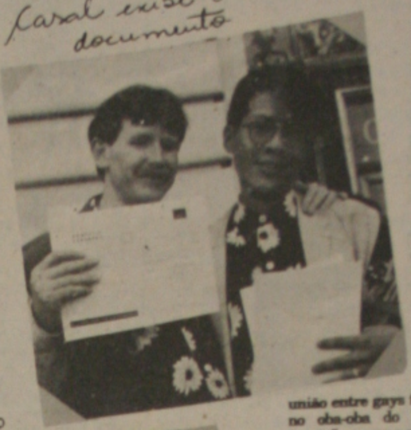
Casal exhibe o documento