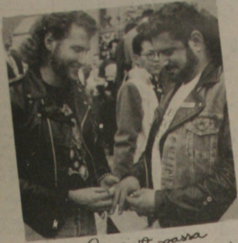
O noivo passa o anel ao parceiro