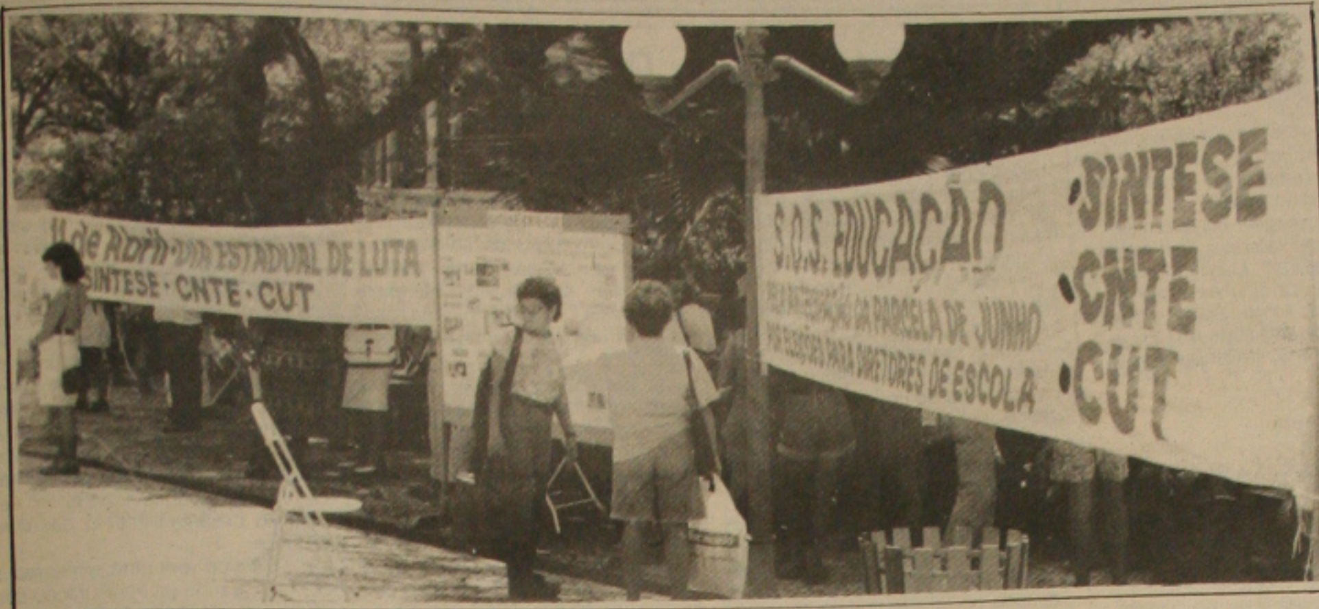
Apesar da presença dos professores, o Dia Estadual de Luta terminou não obtendo o sucesso esperado.

O Dia Estadual de Luta contra o Sindicato dos Trabalhadores em Educação, terminou frustrado para os organizadores por não conseguir atingir os objetivos pretendidos. O fechamento de todas as escolas estaduais de ensino com o pagamento de 100% dos professores em Aracaju, na capital, não ocorreu. Na capital, a greve chegou a 90% e no interior a 80%. A audiência com o governador do Estado para a contraproposta foi adiada para hoje. Durante o dia, professores participaram de feira de artesanato e à tarde de apresentação de artistas locais. (Página 3-B)