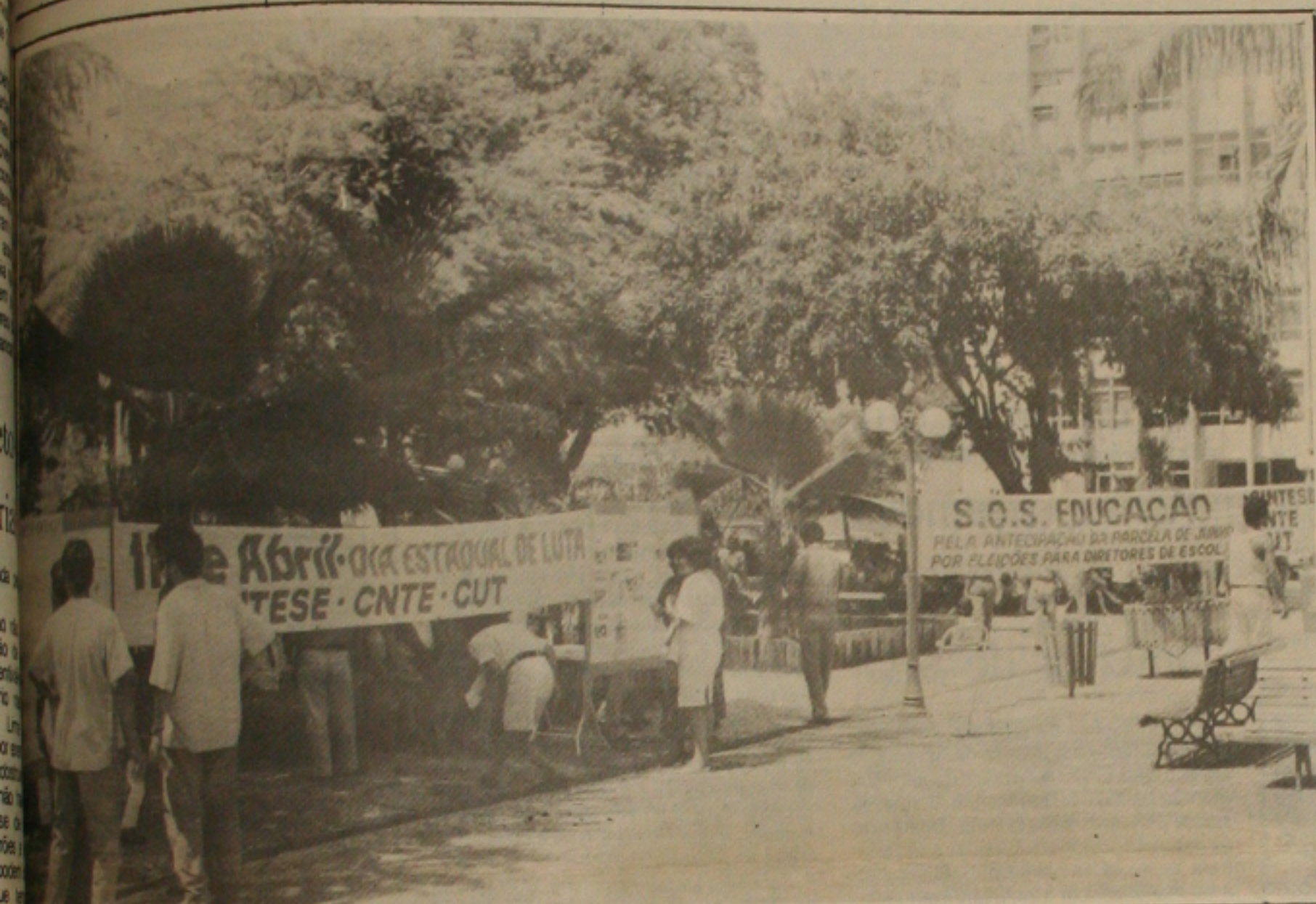
Professores da rede estadual realizaram ontem o dia de luta com concentração na Praça Fausto Cardoso