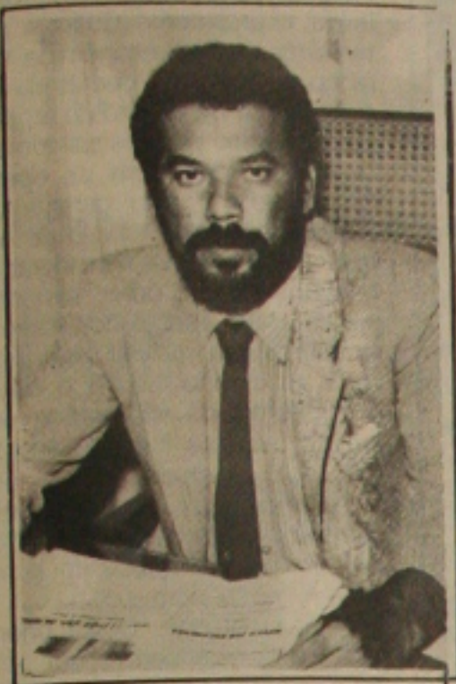
Emanuel espera que a vontade da maioria seja respeitada.