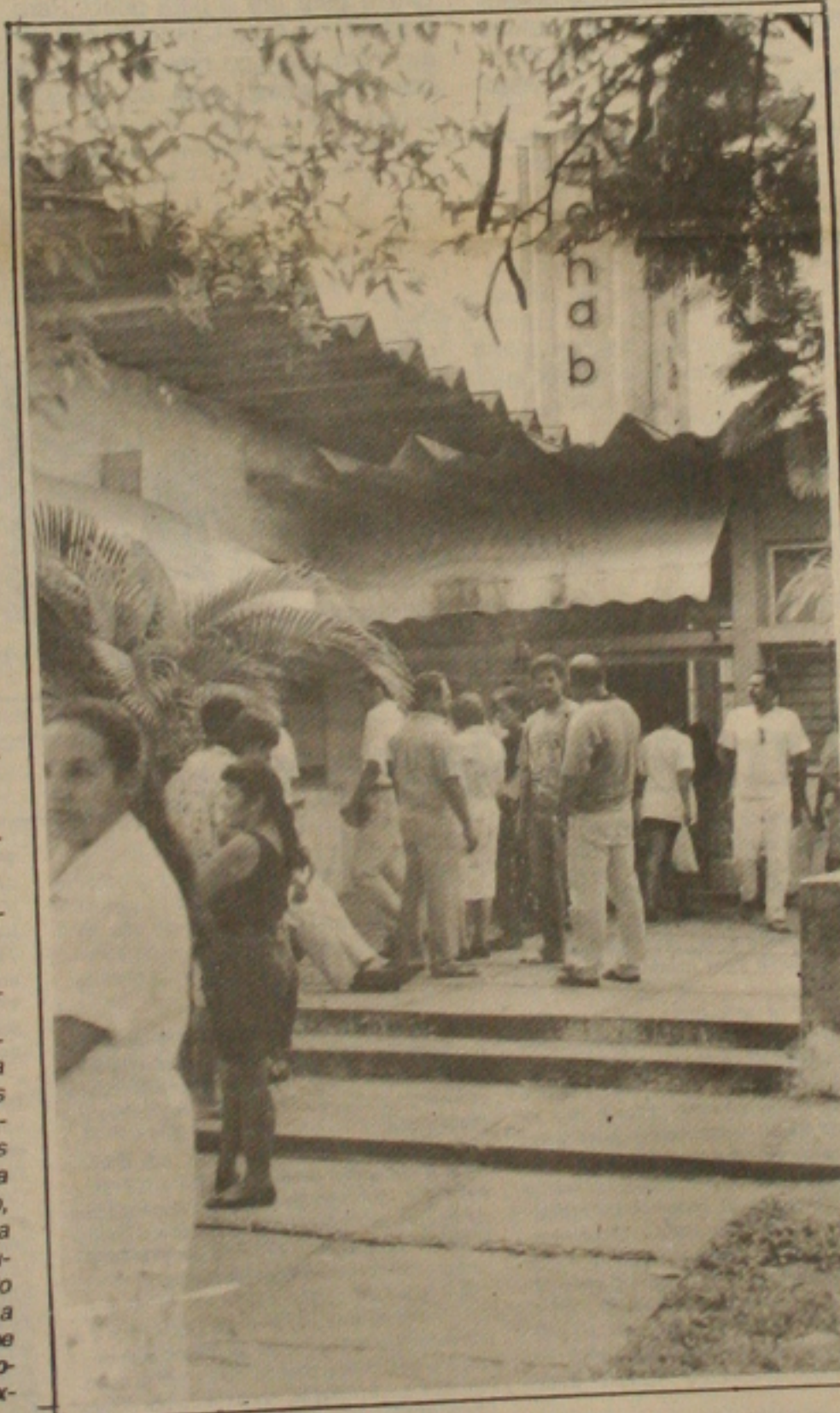
Os mutuários da Cohab fazem filas para quitar os imóveis.

Dos 36 mil mutuários do Sistema Financeiro de Habitação através da Cohab, cerca de 1.500 já quitaram seus imóveis, aproveitando as vantagens oferecidas pela lei 8.177/90, que reduz o saldo devedor em 50%. Diariamente longas filas estão sendo formadas no setor de cobranças, na Cohab, que funciona na sede da Companhia, na Avenida Adélia Franco. Só podem ser quitados com as vantagens da nova legislação, os contratos firmados até fevereiro de 1986 que estejam amparados pelo Fundo de Compensação de Variação Salarial. O prazo para a quitação é até 30 de abril. (Página - 1-B)