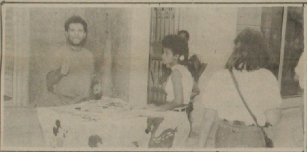
O crescimento do comércio informal só tem deixado satisfeitos os camelôs.

Ao finalizar, declarou que a solução para que os comerciantes estabelecidos e o próprio Governo Federal ou Estadual não continuem sendo prejudicados estaria no fato desses governantes procurarem essas camelôs no sentido de regularizar a situação, pois somente assim ele pagariam impostos e concorreriam lado a lado com os comerciantes formal.