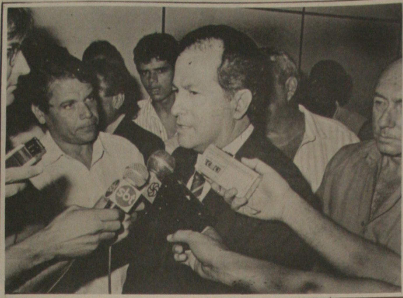
O senador Albano Franco está em Hannover