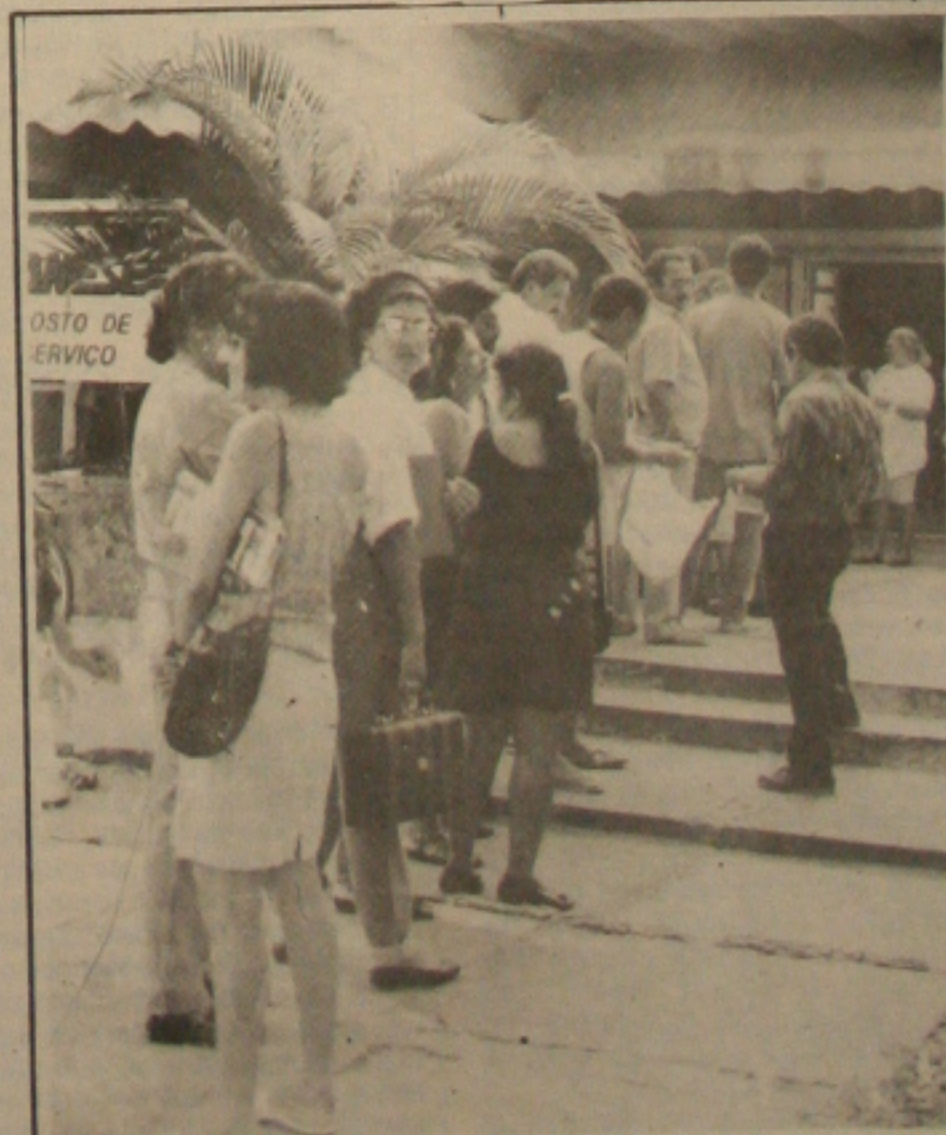
Na Cohab, os mutuários formam longas filas para ficar livre da prestação

A maioria não está entendendo muito bem as vantagens e desvantagens da lei 8177, mas temem os aumentos e preferem quitar o saldo devedor. "Eu utilizei meu FGTS e acredito que fiz um bom negócio. Estou livre de enfrentar filas para pagar as prestações e também dos elevados aumentos que estão por vir", ressaltou uma mutuária que preferiu não ser identificada.