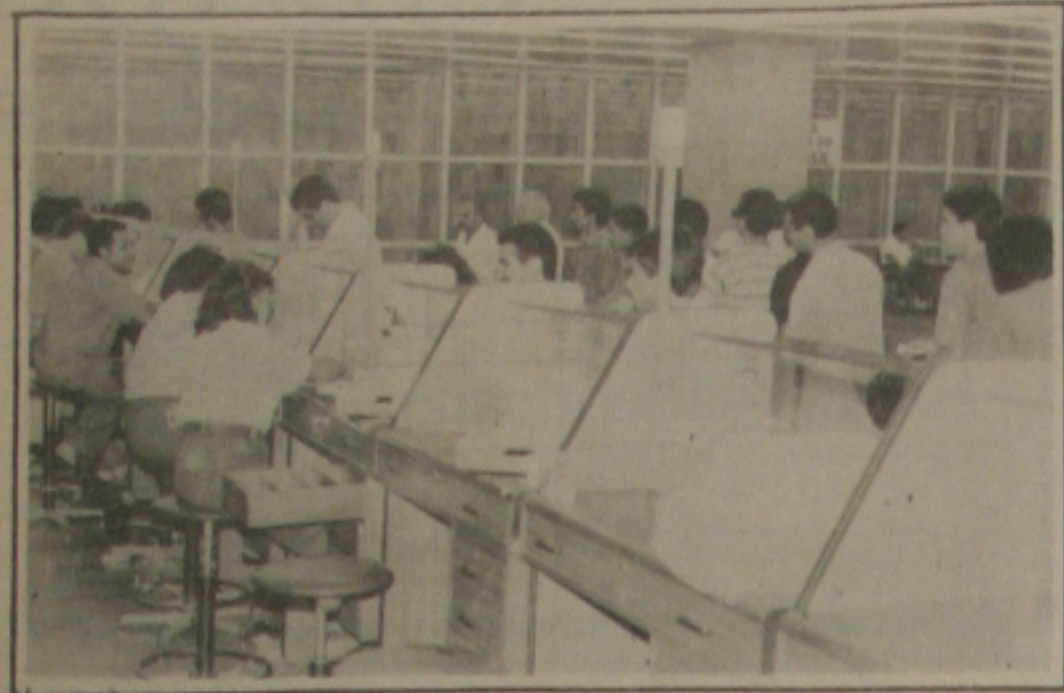
A procura pela caderneta de poupança, nos bancos, aumentou acentuadamente em Sergipe.