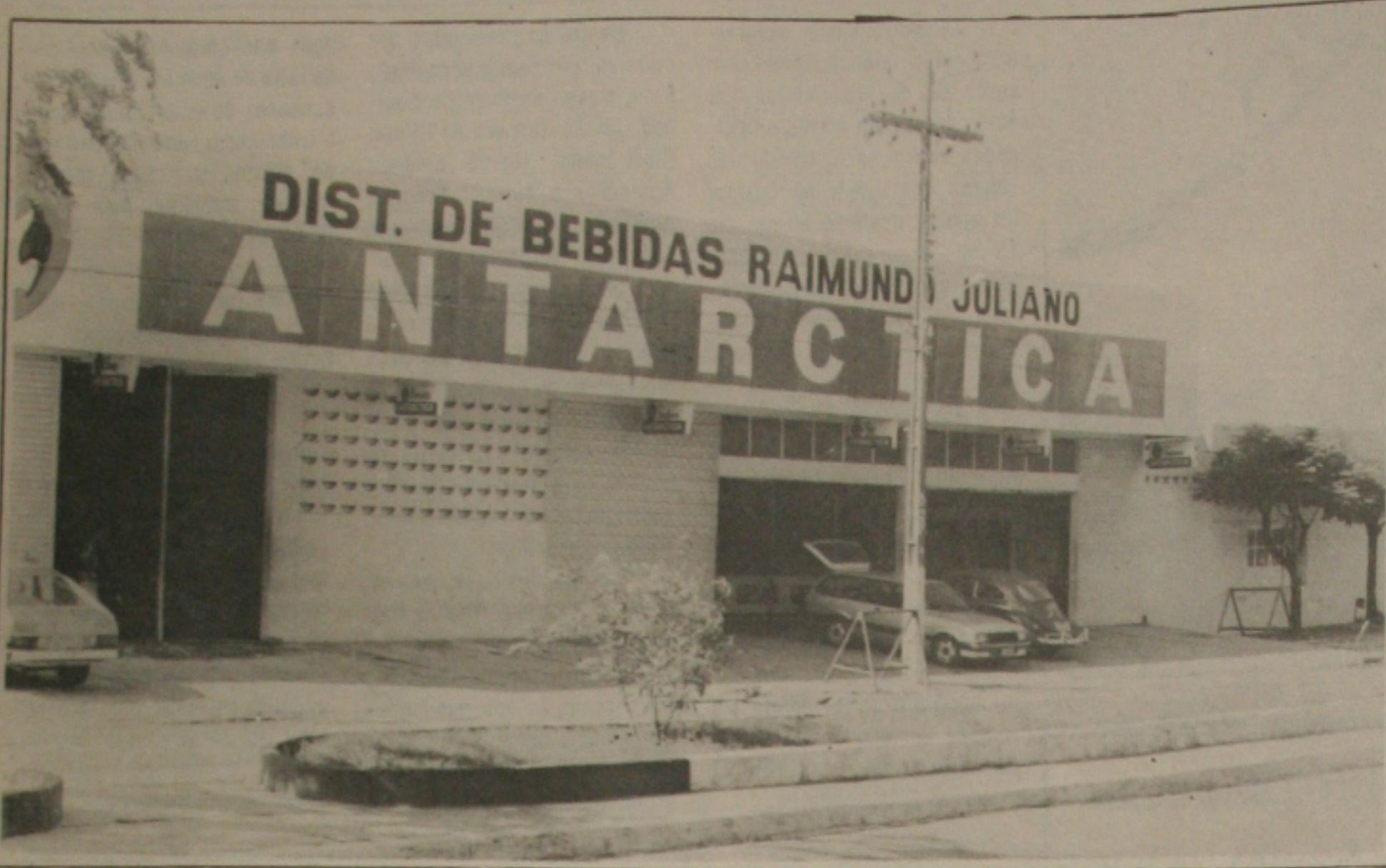
A sede da Disberj foi invadida por seis homens armados de revólveres e escopeta e roubaram Cr$ 8 milhões.

Seis homens fortemente armados de revólveres e escopetas invadiram as dependências da Distribuidora de Bebidas Raimundo Juliano (Disberj), na Avenida Simião Sobral, 300, Bairro Industrial, e renderam todos os funcionários. Roubaram toda a arrecadação do dia e depois fugiram.