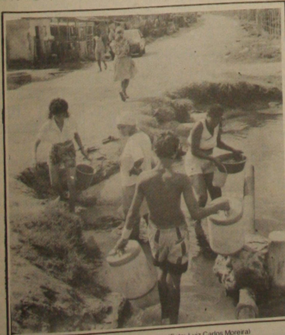
O povo convive com a miséria no Bairro Matadouro.

"É horrível - dizem os moradores - quem passa por aqui não suporta e pergunta como a gente consegue ser gorda e sadia neste local". Para aquela comunidade, o governo estadual deveria tomar providências energéticas e solucionar o problema daquela comunidade.