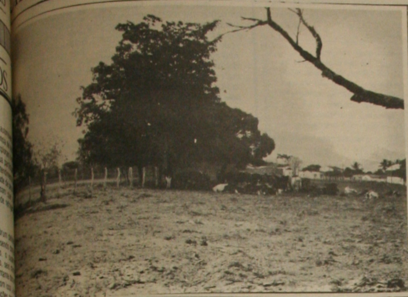
As chuvas nos municípios do alto sertão não surtiram efeitos porque a seca continua se aprofundando.