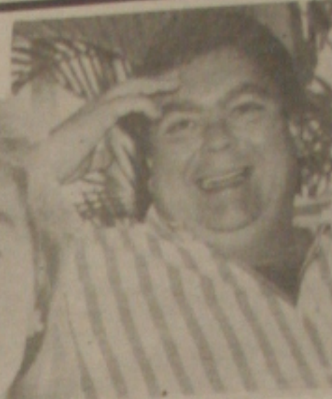
A atriz gaúcha atua com Fausto Silva em seu programa e no novo filme

rá-la — ambos gaúchos. "A mulher não deve ficar pulando de galho em galho", opina ela, apesar de não se opor a um contato mais íntimo entre o casal. "Para mim sexo é muito importante, mas deve ser uma consequência e não um princípio do relacionamento."