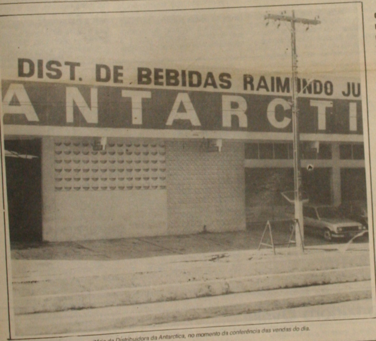
Os assaltantes invadiram o escritório da Distribuidora da Antartica, no momento da conferência das vendas do dia.

Em protesto ao atraso dos serviços coletivos, que servem ao bairro de Santo Amaro, na zona paulista, cerca de 3 mil pessoas participaram ontem, de violento quebra-quebra, no Largo 13 de Maio, causando a destruição de cerca de 100 ônibus, saques, destruição de lojas e grande engarrafamento de trânsito. Ninguém ficou ferido e a fúria da massa terminou com a chegada de cerca de 300 policiais do 1º batalhão de choque da PM, que começaram efetuando apenas duas horas de prisão. O quebra-quebra começou por volta das 7 horas da manhã e depois das 8 horas de tumulto generalizado, de sete horas de prisão dos policiais, que começaram dispersar a multidão. Os policiais das três empresas de ônibus que servem as linhas do bairro de Santo Amaro, ficaram surpresos com a violência e alegaram que os ônibus circulavam normalmente. Alguns comerciantes prejudicados reclamaram a violência a grupos de assaltantes. O quebra-quebra iniciado por cerca de 100 pessoas, mas no final conseguiu ter a participação de cerca de 3 mil pessoas. (Página - 4).