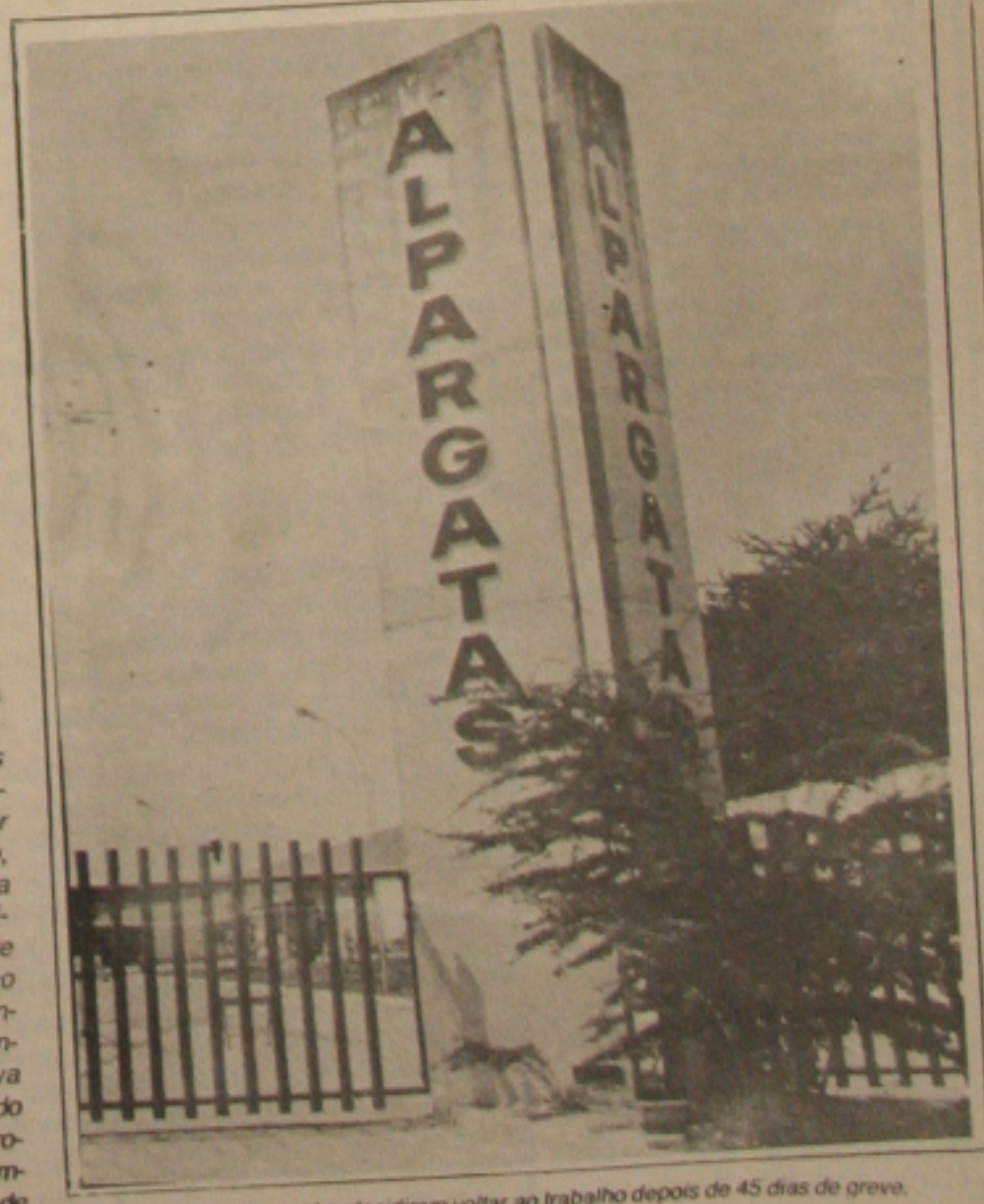
Os operários da Alpargatas decidiram voltar ao trabalho depois de 45 dias de greve.