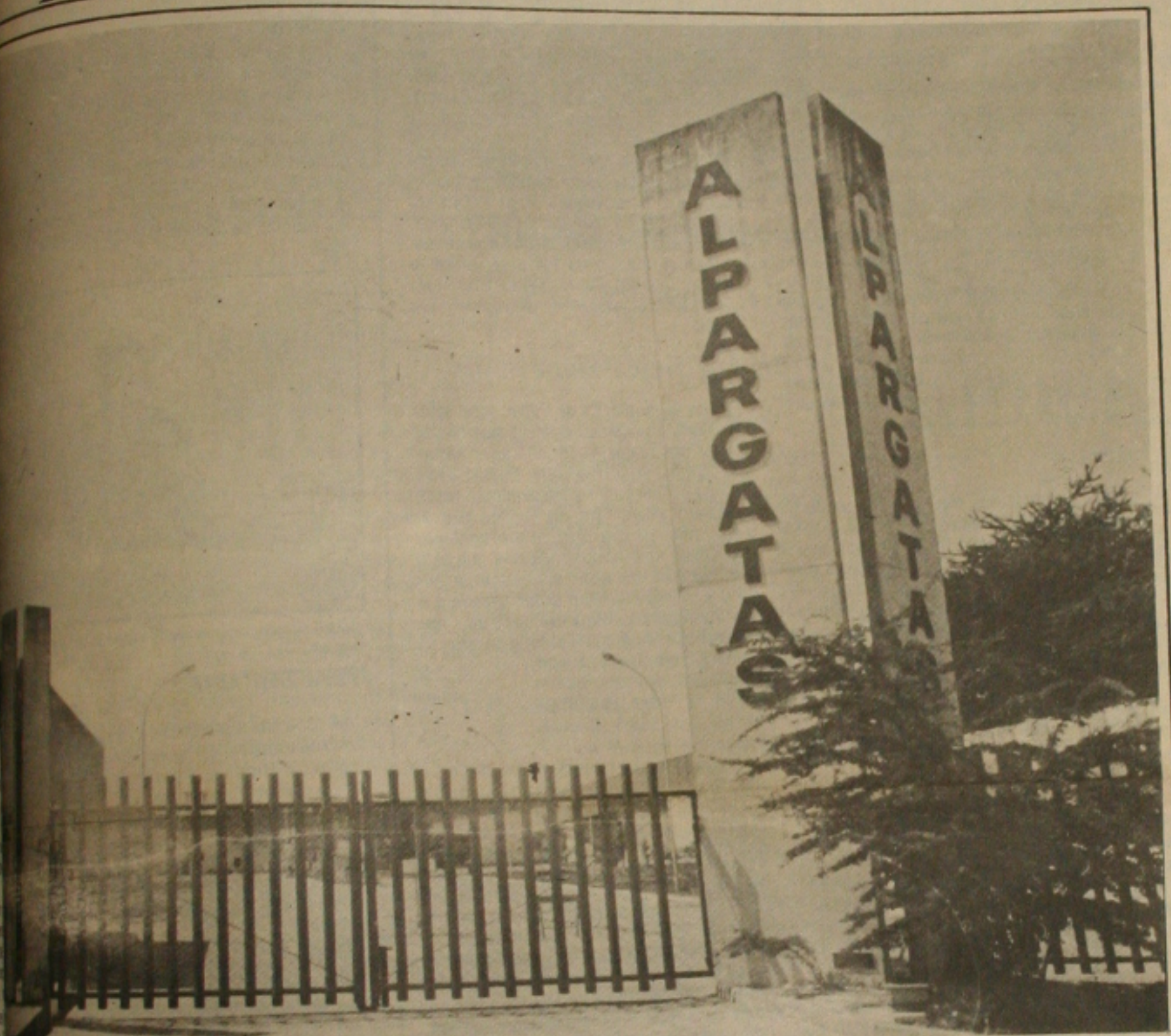
Depois de 45 dias de greve que necessitou a interferência do Estado, os operários da Alpargatas retornaram ontem ao trabalho.

A greve mais longa da história da indústria têxtil de Sergipe chegou ao fim ontem depois de 45 dias com suas atividades paralisadas em defesa de melhores condições de trabalho e salários, os operários da Alpargatas do Nordeste S/A decidiram retornar ao trabalho. Eles aceitaram a contraproposta apresentada pela direção da empresa, após várias tentativas de negociação.