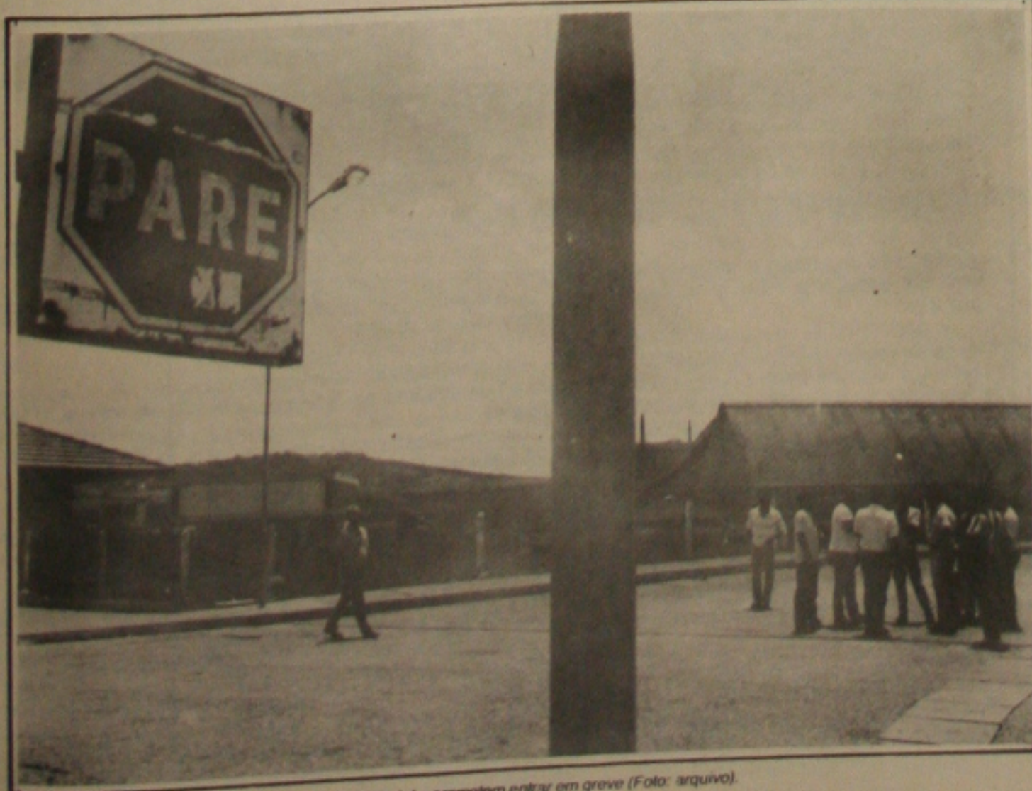
estão em campanha salarial e prometem entrar em greve.

Quando a Petromisa passar a comercializar o sal extraído do potássio, o município também começa a melhorar a sua arrecadação de impostos, além disso pode ser o surgimento de mais emprego que ainda escasso na região. Para trabalhar nos galpões, a Petromisa terá que contratar mais funcionários para essa atividade.