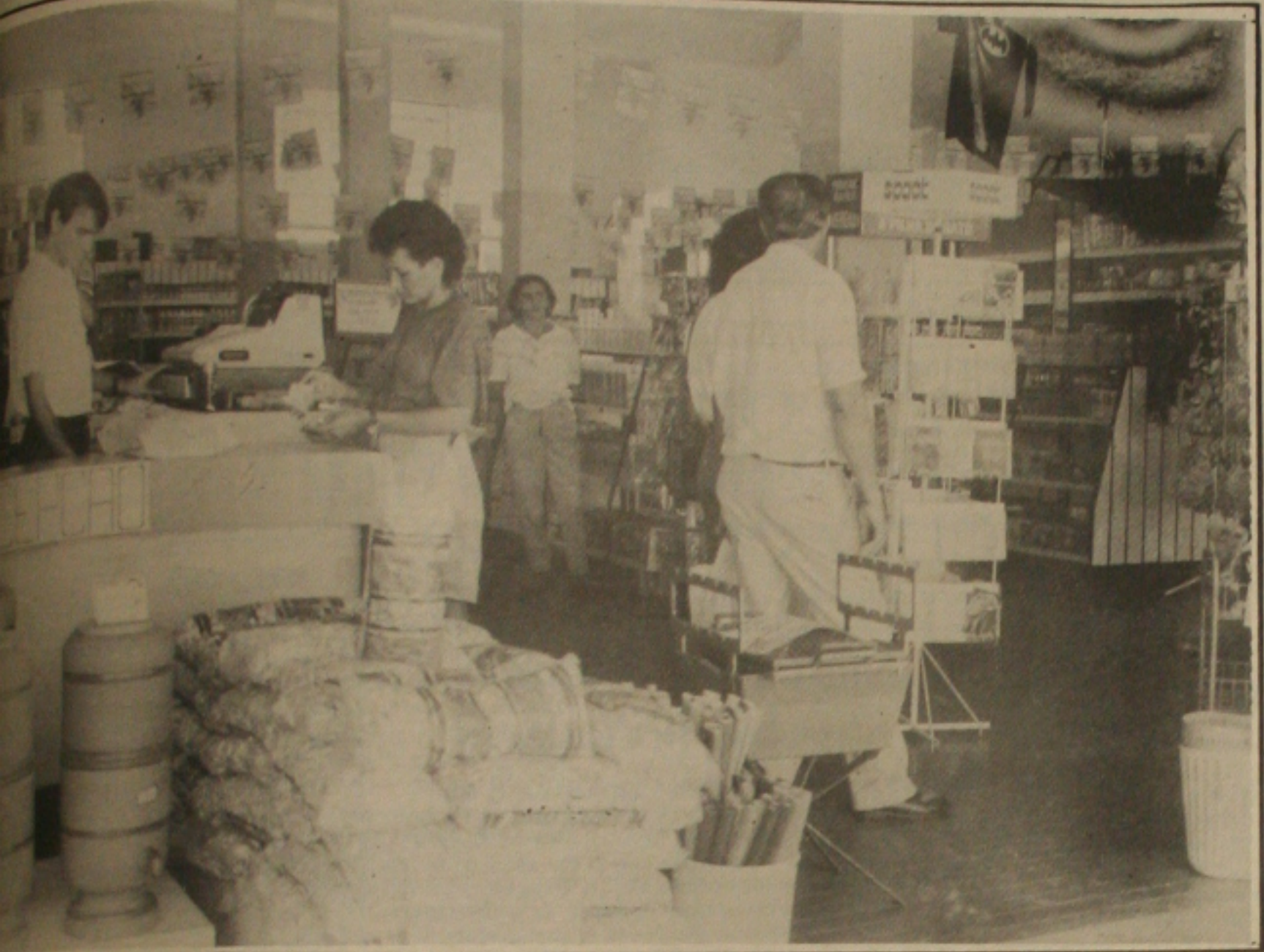
nos últimos trinta dias, uma queda na emissão de cheques sem fundos atribuída às medidas do Governo.