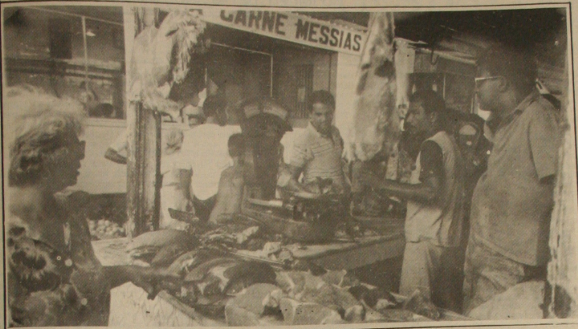
Os açougueiros queixam-se de que estão comprando o boi com aumento todas as semanas.

Como um dos deputados do governador João Al- cides Alcides Cordeiro em entrevista exclusiva à GAZETA DE SERGIPE, Alcides pretende disputar a prefeitura de Aracaju em 92 e fala sobre a situação política, desde a eleição de Pernambuco, Alcides diz da sua atitude à frente da Assembleia Legisla- tiva do Estado. Só a pro- pria riqueza, e o governador Alcides afirma que há o risco de Sergipe ser desestabilizado de Alagoas, mas que o fato do Estado ser pequeno e fazer parte de Sergipe, pode beneficiar o Estado. Ele defende que os sergipanos reivindiquem o Estado do Governo Federal. (Página 1)