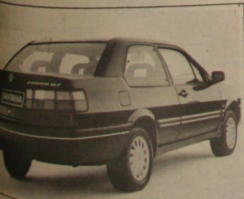
O novo Santana destaca-se pelo porta-malas alto

A traseira é do tipo high-deck , ou seja, está em posição mais alta do que a frente, o que facilita a passagem do ar vindo do teto e dá maior estabilidade ao carro. O porta-malas, com 530 litros de capacidade, tem tampa com abertura que vai até a linha do pára-choques, facilitando as operações de carga e descarga de bagagens e objetos. A tampa do porta-malas é erguida com o auxílio de molas e permanece aberta em um ângulo de 90 graus.