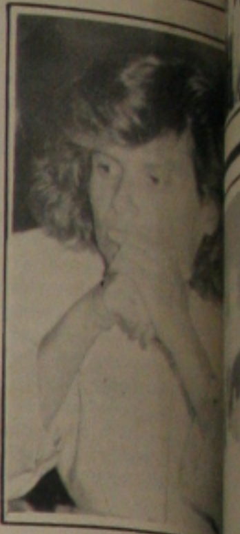
A ministra Zélia.

O Ministério da Saúde irá construir cerca de três mil sanitários em Tabatinga, afirmou o presidente da Comissão Nacional de Combate à Cólera, Baldur Schubert. Ele assegurou que a região do Alto Solimões receberá 11.200 fossas sanitárias, distribuídas entre Tabatinga, Atalaia do Norte e Benjamin Constant. A Ilha de Santa Rosa também receberá sanitários em todas as moradias, feitas pelo Governo Brasileiro.