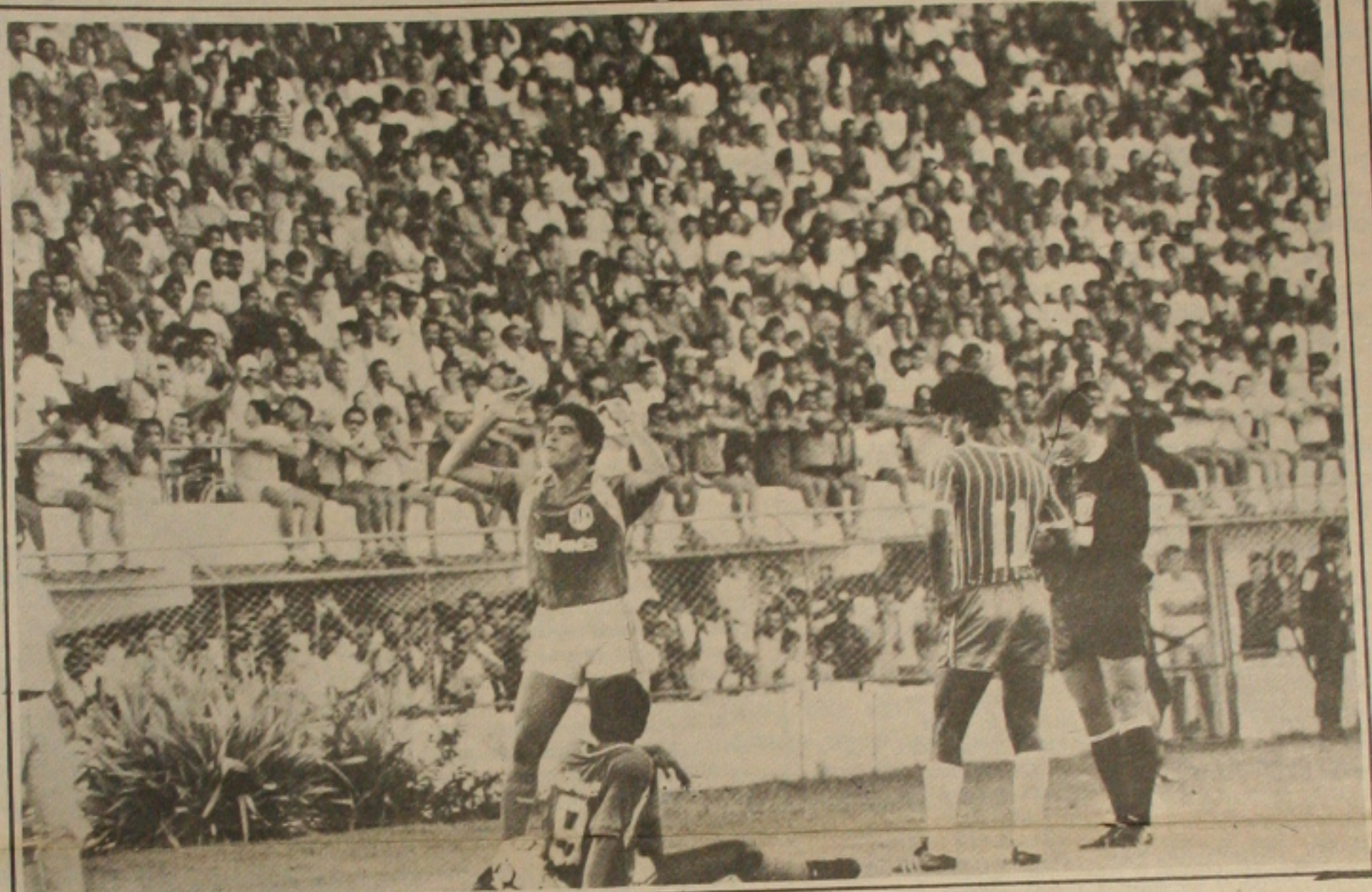
Itabaiana recebe a visita do Sergipe, no Presidente Médici.