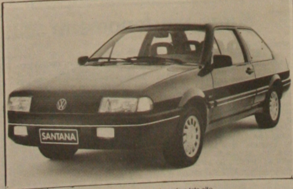
Na frente, o Santana mostra uma grande área envidraçada e teto alto

O Novo SANTANA já está chegando na Discar. Prepare-se para conhecer o que há de mais avancado em automóveis no País.