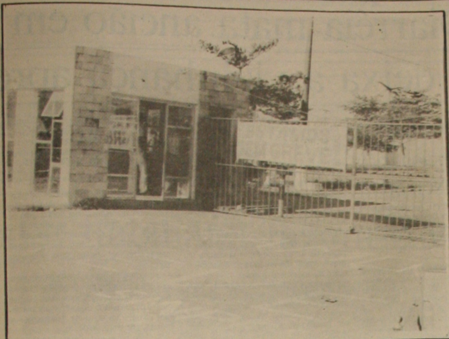
Os portuários sergipanos devem entrar em greve na quarta-feira se não houver uma definição salarial por parte da Codeba.