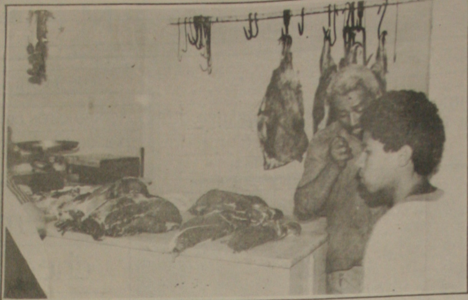
Os açougueiros queixam-se de que estão comprando o boi com aumento todas as semanas.