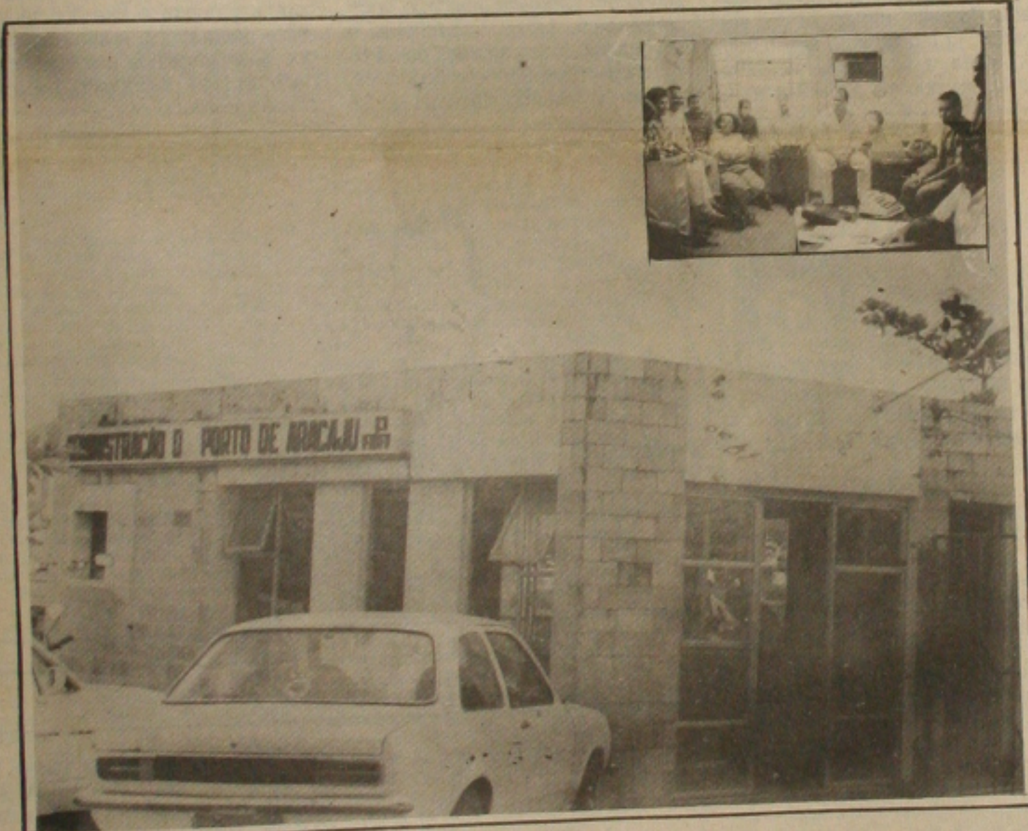
Os portuários estão programando uma nova greve para esta semana.