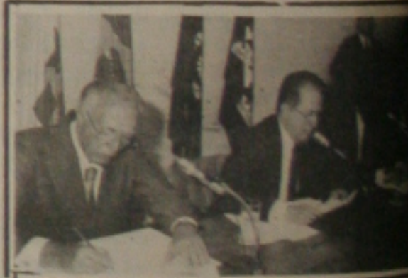
Albano Franco (centro) presidente da poderosa CNI.

Dois preocupações fundamentais estão na mesa dos diversos industriais sergipianos especialmente os seguintes: a falta de linhas de crédito para novos investimentos, tal de giro e, a mais crítica, a retração das vendas. Esses fatores, principalmente o segundo, tem deixado muito insatisfeito com as perspectivas futuras. Por conta disso, há necessidade de uma adequação no setor de produção para lidar ao problema da queda nas vendas. Melhor produtividade, seja uma saída, mas nem todos estão conseguindo por conta da falta de mão-de-obra especializada a capacidade produtiva.