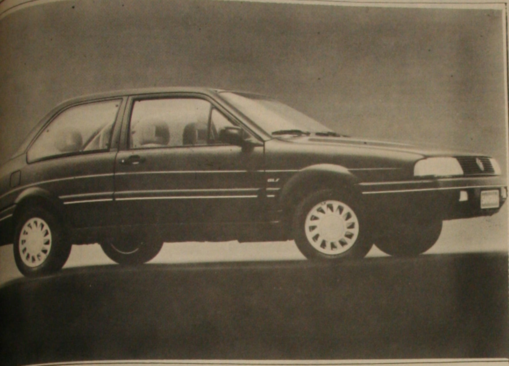
O estilo de influência aerodinâmica adotado hoje pelos principais fabricantes de automóveis em todo mundo.