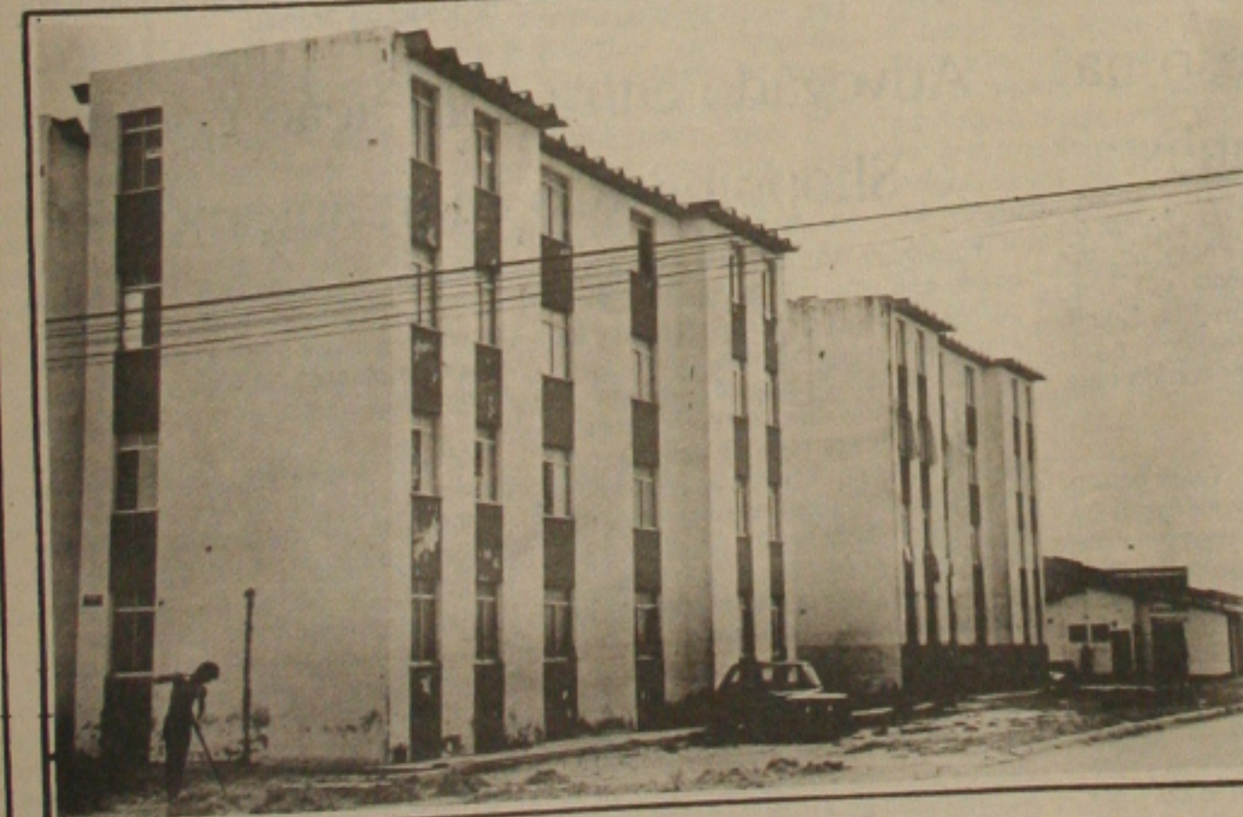
Os reajustes da casa própria chegam a 1000 por cento levando o mutuário ao desespero.

Segundo o advogado, as pessoas devem procurar os profissionais de direito já portando os contratos firmados com o agente financeiro, os carnês pagos anteriormente e, preferencialmente, o novo carnê de abril com o valor exorbitante da prestação. Isso, segundo ele, agilizará as primeiras providências judiciais e o trabalho dos profissionais contratados, aconselhando que as pessoas prejudicadas não deixem de procurar a justiça para "brigar" por seus direitos.