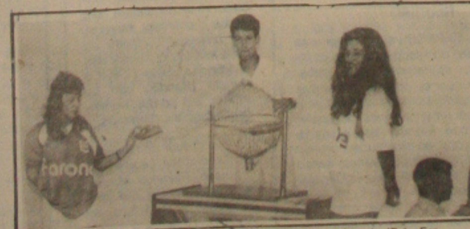
Sergipe e Confiança promovem super festival de prêmio dia 11 de maio.

Segundo o presidente Motinha, do Sergipe, o III Telefestival traz uma outra inovação. São participações do sorteio, as cartelas realmente vendidas. Essa decisão foi em atenção ao pedido dos concorrentes de