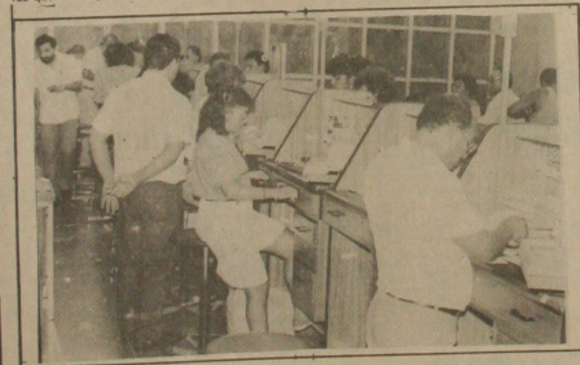
Bancários vão se reunir em assembleia.

Prosseguindo, o sindicalista informou caber aos bancários se mobilizar e mostrar aos banqueiros que a categoria não teme ser demitida, pois lutará para que suas reivindicações sejam acatadas, por não suportar conviver com a recessão, o arrocho salarial, a exemplo dos demais trabalhadores brasileiros.