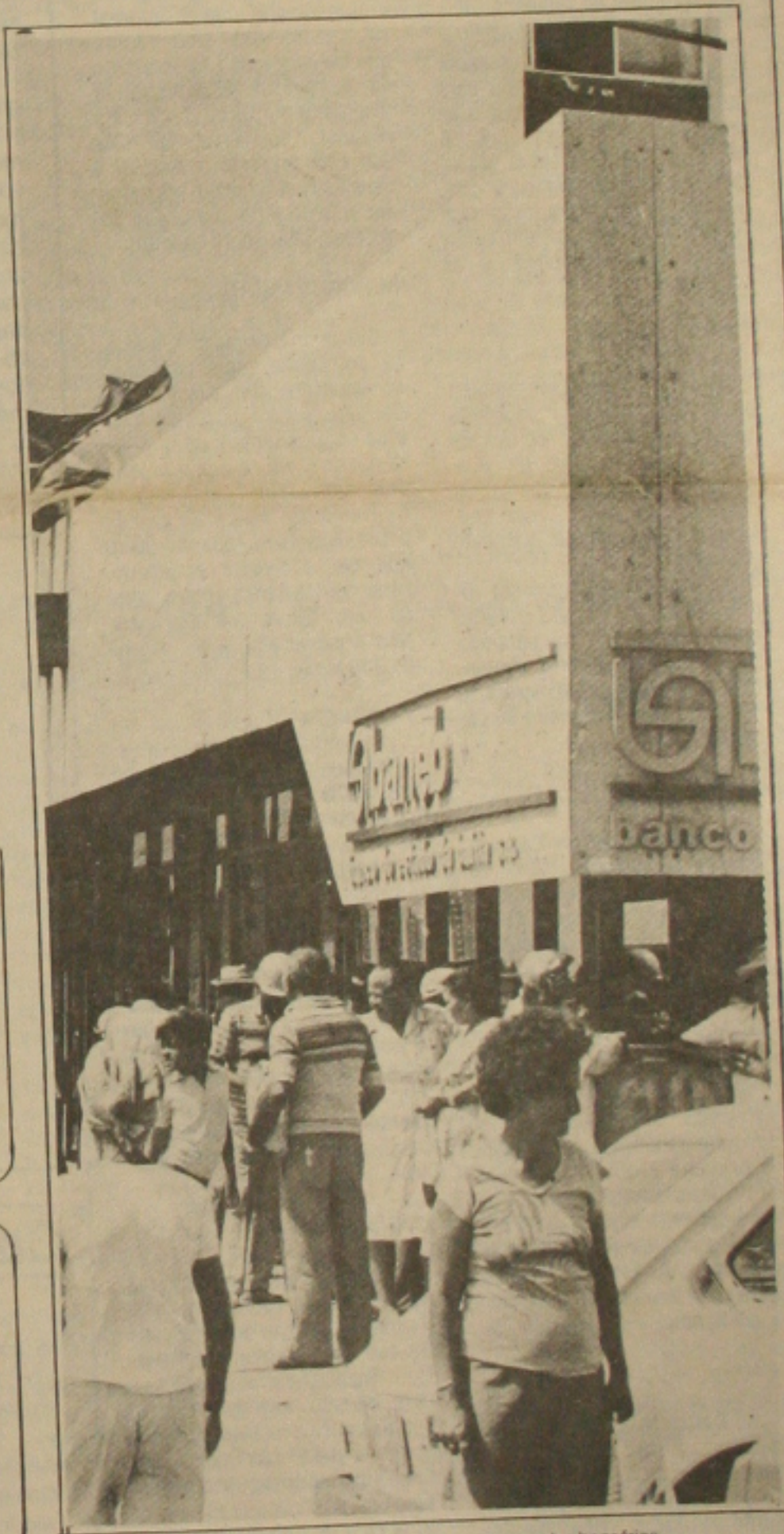
Os bancos estão ameaçados de fechar devido a nova greve dos bancários.

Os técnicos do Fundo Monetário Internacional (FMI), que chegaram ontem ao País, quiseram saber o que todo brasileiro se pergunta: os cruzados novos vão ser liberados já? Esse foi o assunto que chamou a atenção dos técnicos tão logo leram os primas.