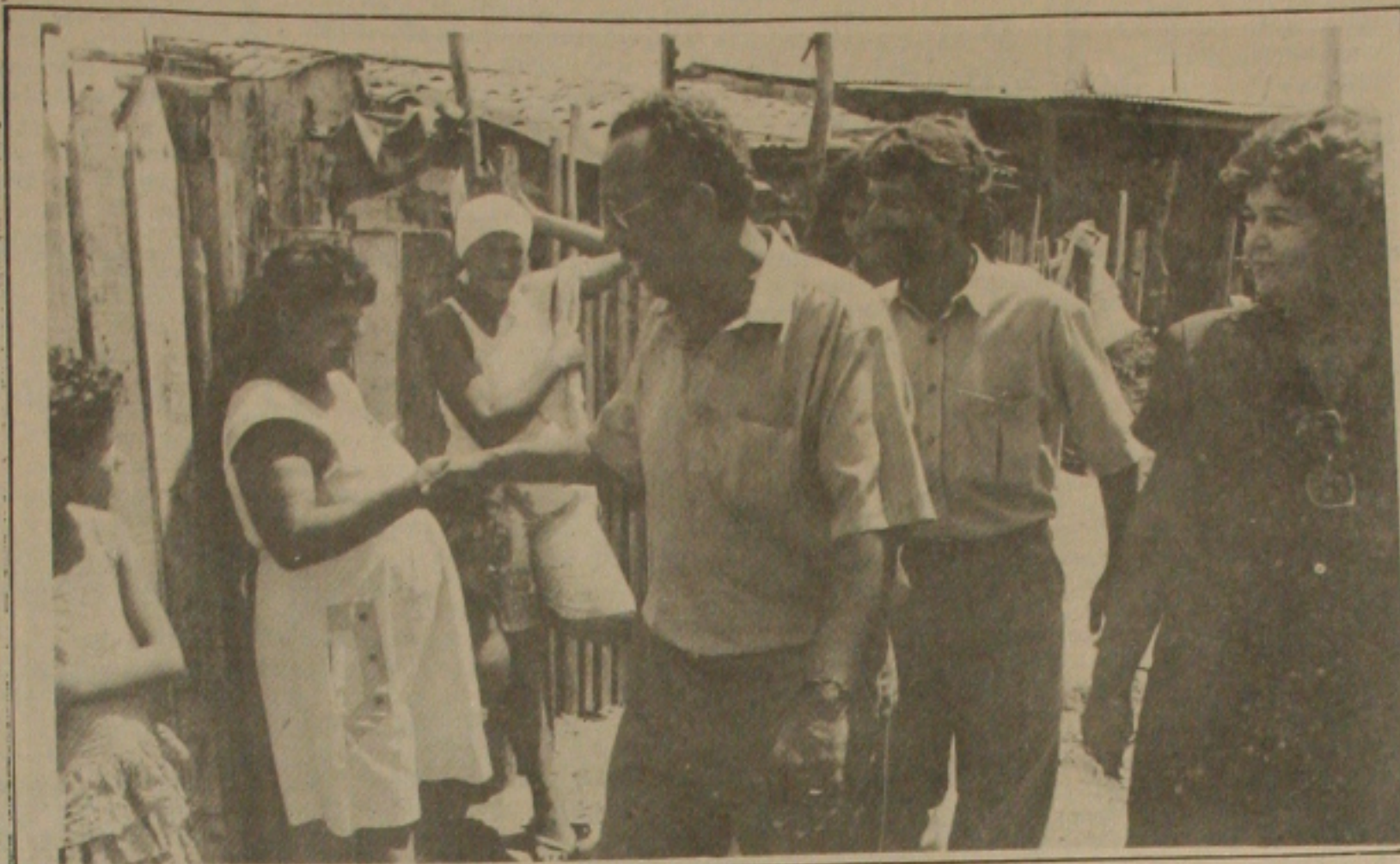
Governador do Estado visitando os moradores do perímetro urbano.

O governador João Alves Filho autorizou a Fundese - Fundação para o Desenvolvimento de Sergipe - a realização de estudos e projetos para a humanização de invasões no perímetro urbano de Aracaju. Os projetos em estudo pretendem humanizar favelas e outros aglomerados urbanos de famílias carentes, a partir de uma infra-estrutura básica, passando por trabalhos de pavimentação, drenagem, rede de esgotos e de águas. Também está em análise um conjunto de ações para atender a criança carente.