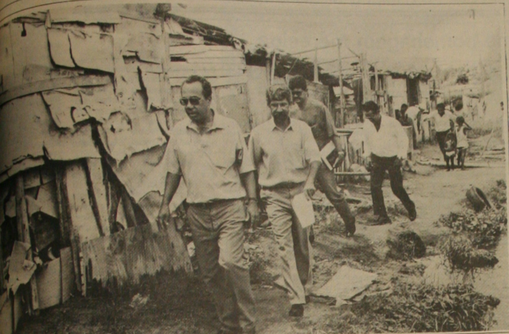
Governador João Alves visita invasões e favelas de Aracaju para anunciar obras de humanização.