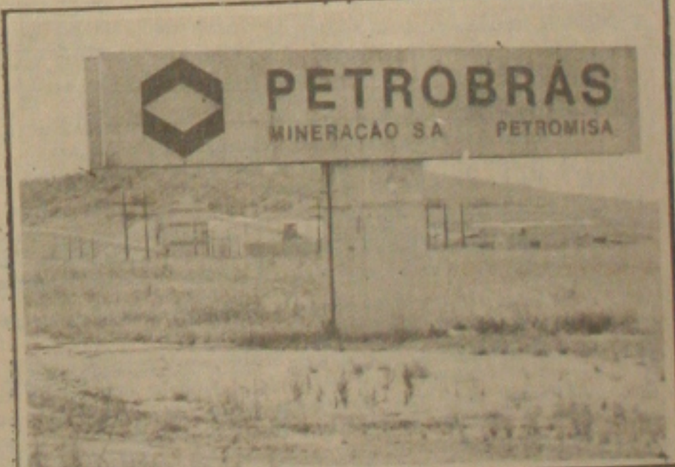
Os mineiros vão paralisar por alguns minutos todos os dias

A empresa foi programada para produzir 500 mil toneladas anualmente de cloreto de potássio e 1,5