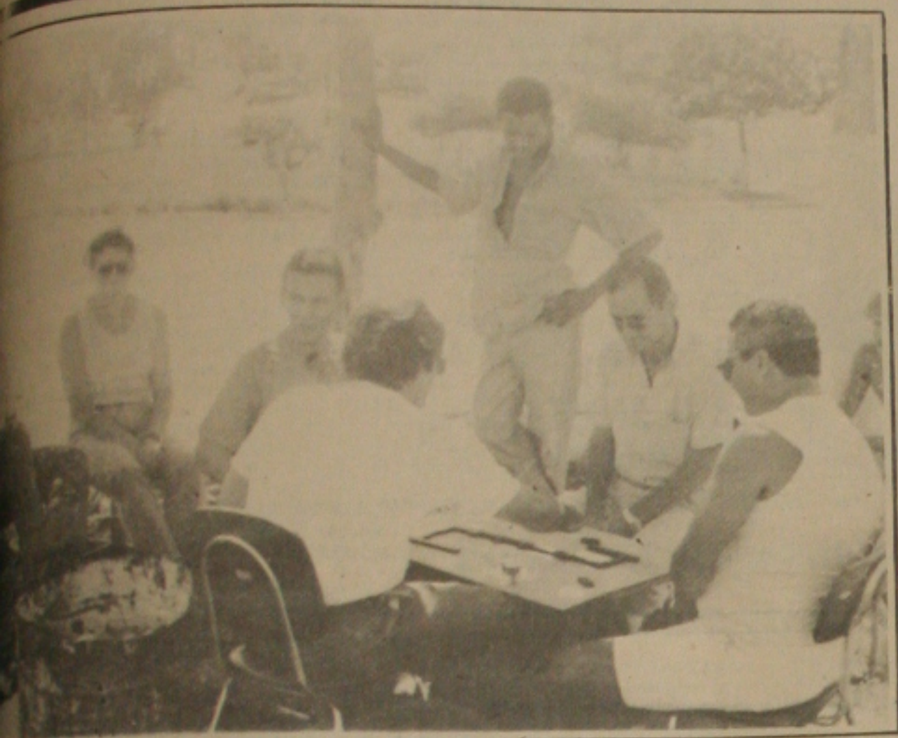
Bancários sergipanos decidiram entrar em greve por tempo indeterminado porque não houve avanço nas negociações.