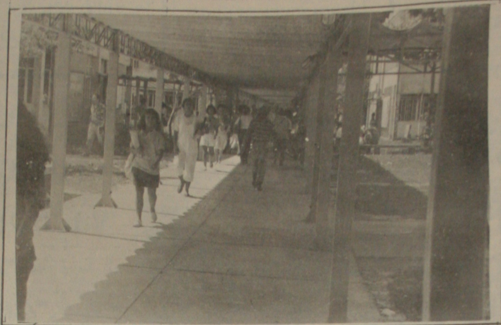
Os universitários terão que acompanhar prazos do calendário acadêmico na UFS

Já no dia 04 do mês de junho foi fixado o prazo final para entrega pelos diretores de Centros da oferta do segundo semestre letivo de 91 (Currículo Padrão) e no dia 21.06., término do prazo para requerer certificado e créditos de Monitoria. Para o mês de julho o Calendário Acadêmico prevê: de 01 a 03 - pré-matricula para