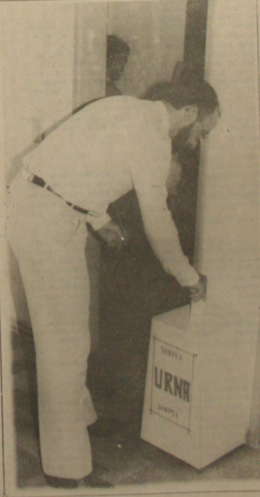
Só um agente federal quer Romeu Tuma

Se depender da vontade dos agentes federais de Sergipe, o delegado Romeu Tuma pode arrumar as gavetas e deixar o cargo de superintendente da Polícia Federal. O "xenite" de Collor tem aceitação de apenas um dos 81 agentes federais que participaram do plebiscito realizado na última quinta-feira, que colocou em julgamento a permanência ou não do atual comandante da Polícia Federal. Dos 116 agentes federais, incluídos os delegados lotados em Sergipe, participaram da votação 81 e apenas um votou favorável a permanência de Romeu Tuma, o que representa um índice de rejeição de 98,76% do atual superintendente da Polícia Federal. (Página - 3-B).