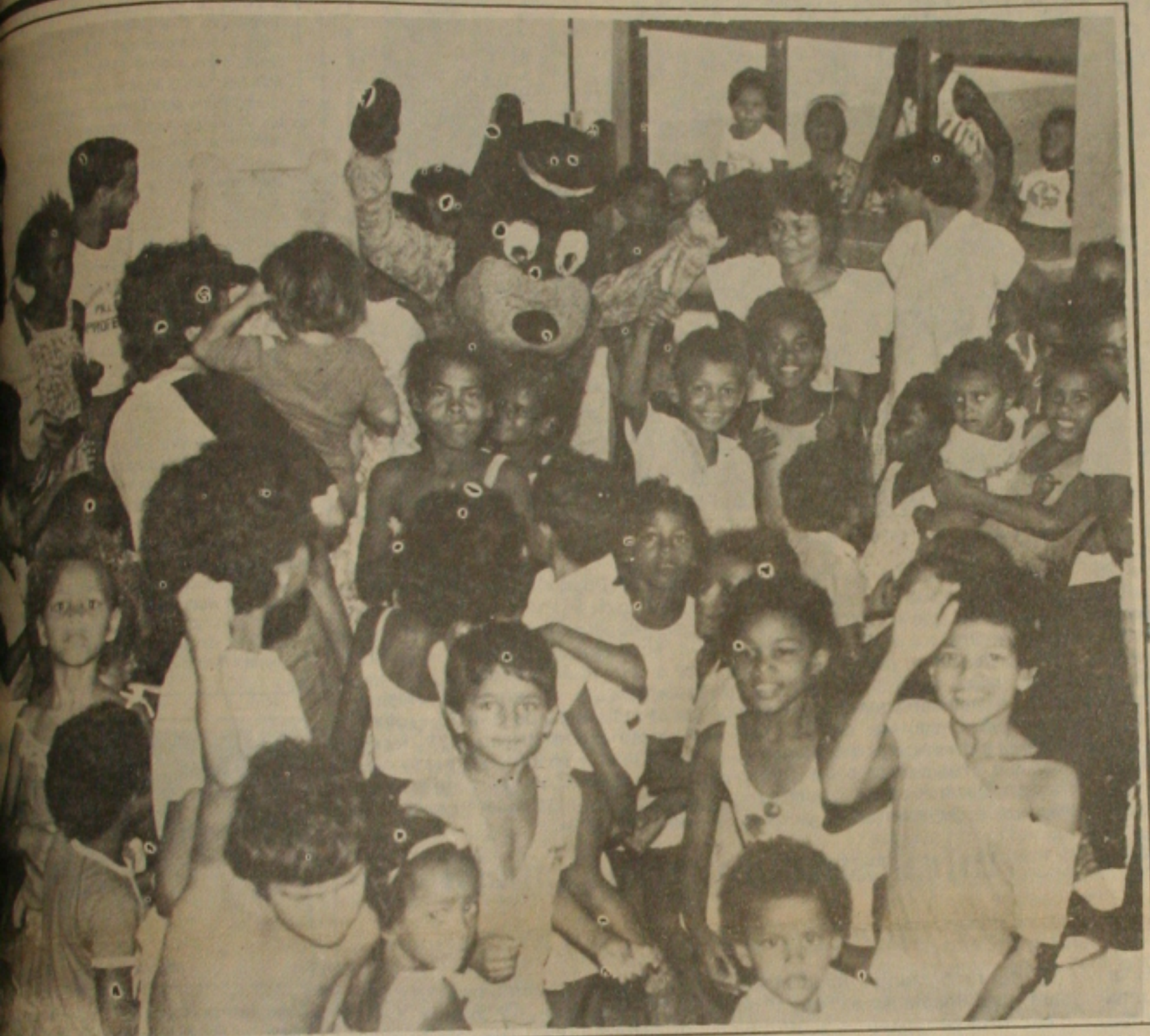
As crianças até cinco anos de idade serão vacinadas hoje em todo Estado para erradicar a poliomielite, tétano, difteria e sarampo (foto).

Para o prefeito, não adianta o município investir muito na remoção de pessoas para os hospitais de Aracaju se a cidade tem condições de prestar um serviço idêntico. "O atendimento imediato evita a morte", disse ele, acrescentando que o deslocamento para a capital pode contribuir para o óbito porque demora receber os primeiros socorros.