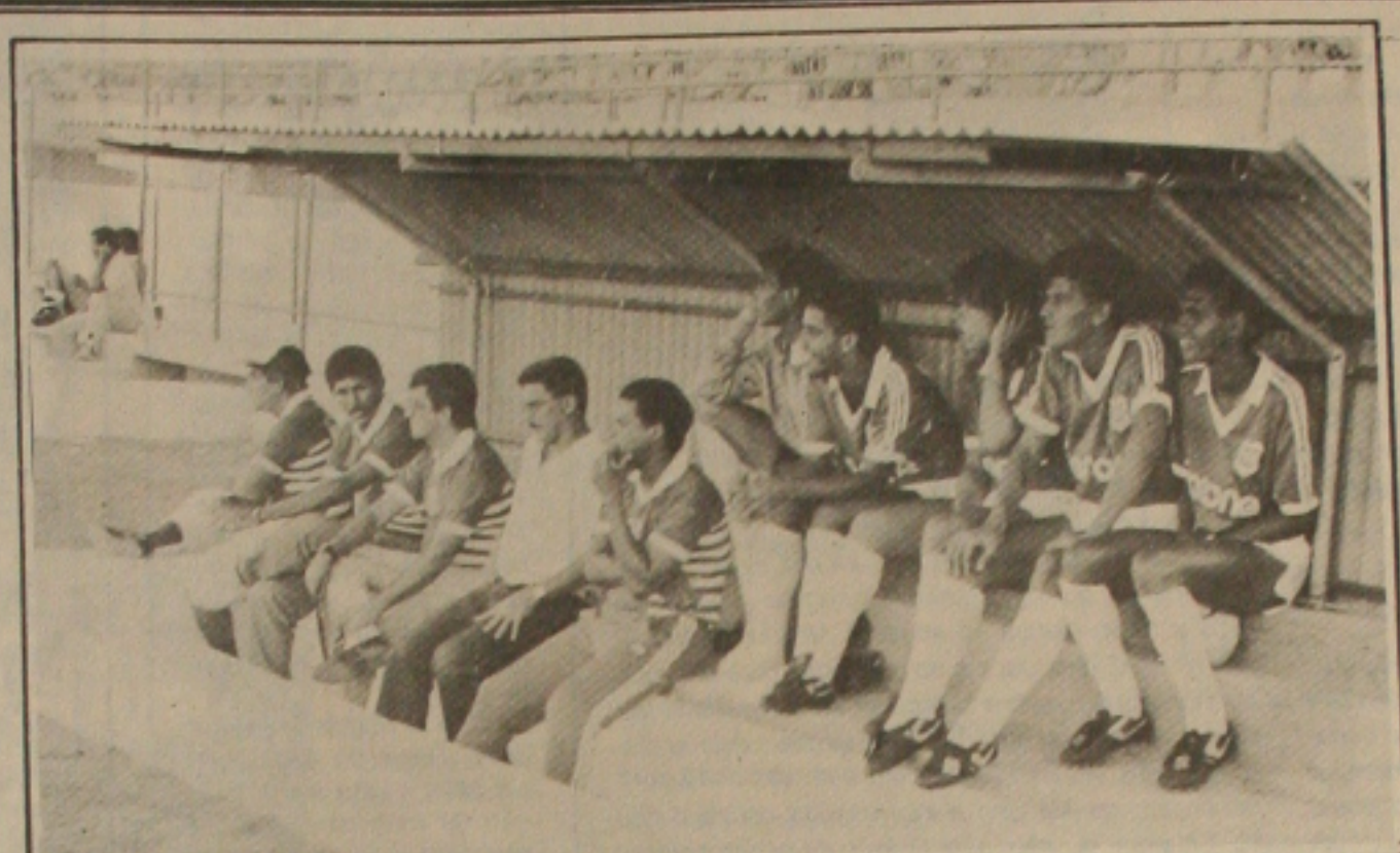
O time do Sergipe encara com seriedade o jogo contra o Estanciano.