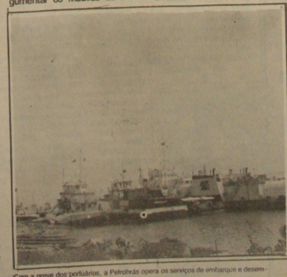
Com a greve dos portuários, a Petrobrás opera os serviços de embarque e desembarque