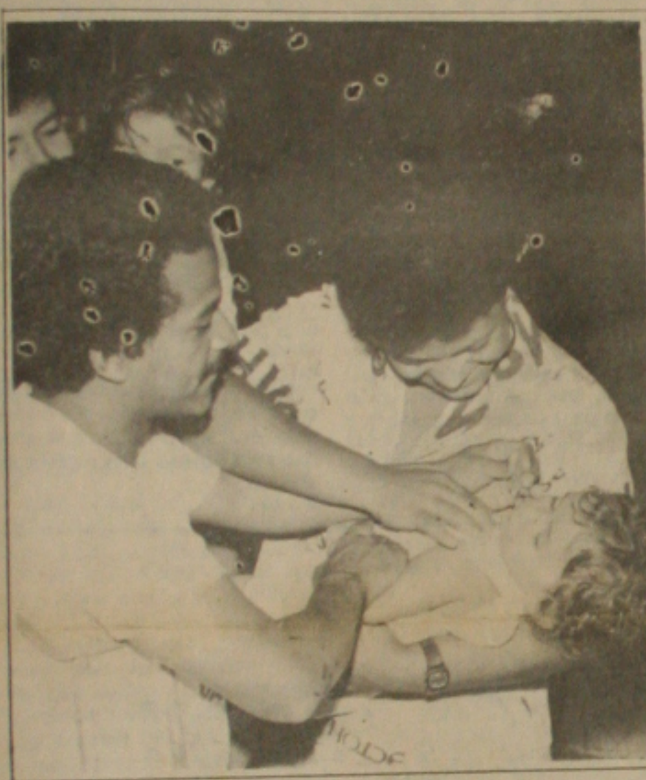
As crianças até cinco anos recebem nova dose contra a pólio.