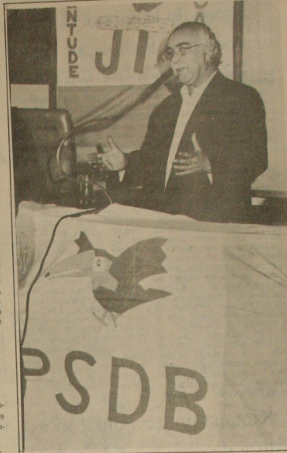
Paixão espera Jia de braços abertos.

Ele não afasta a hipótese, por exemplo, de haver uma coligação do PDT-PFL e outras siglas na sucessão municipal de Itabaiana, visto que naquele município a realidade política é outra.