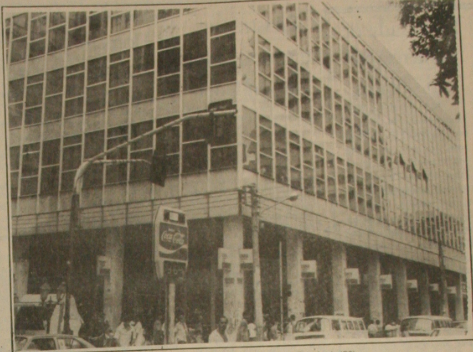
A Caixa Econômica Federal não define uma data para o refinanciamento da casa própria.