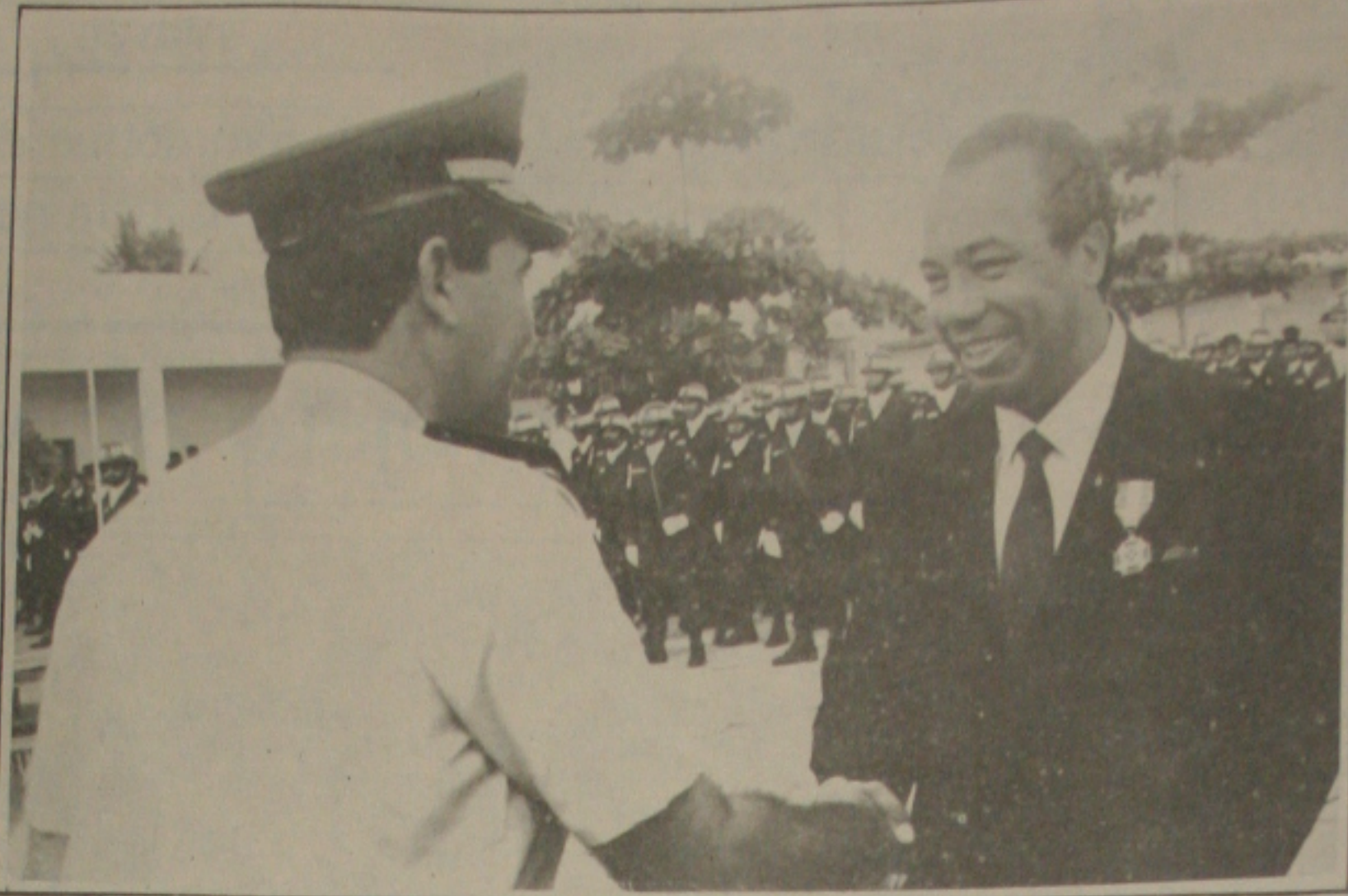
O governador João Alves Filho recebeu a medalha

- Esses setenta (70) novos ônibus explicou, farão parte de uma segunda etapa de ampliação da frota. Eles substituirão aqueles mais antigos usados pelas empresas.