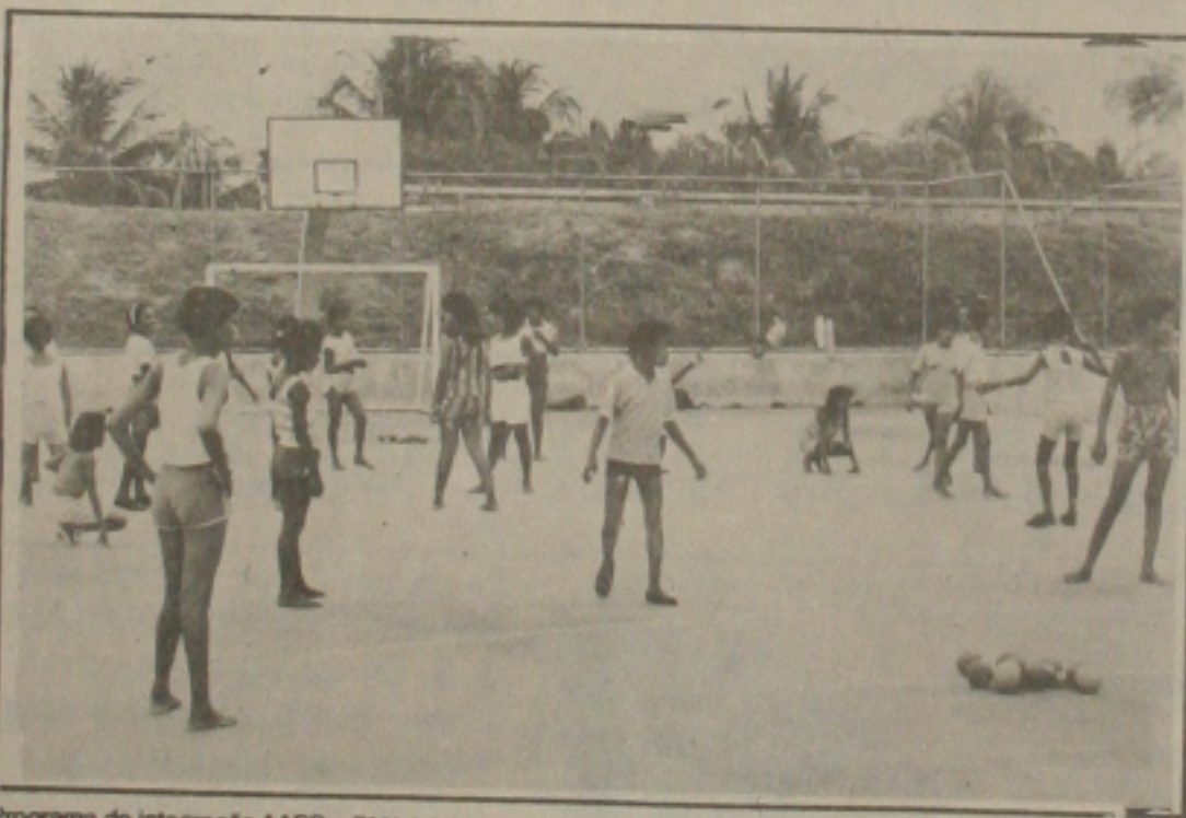
Programa de Integração AABB e PMA iniciando o handebol