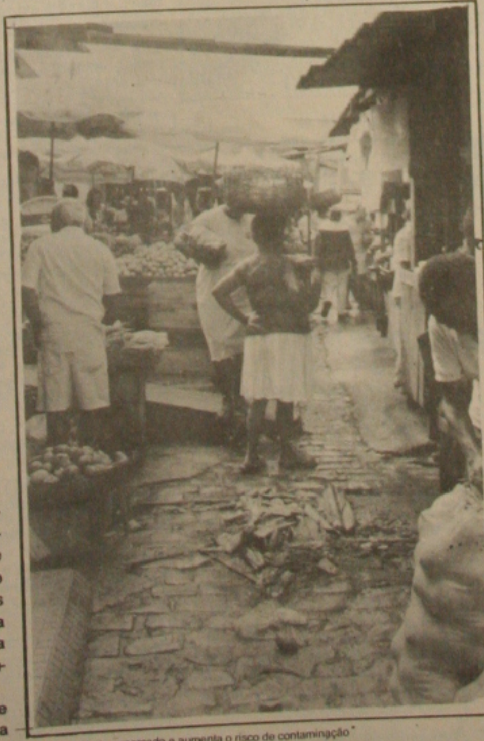
A sujeira invade o mercado e aumenta o risco de contaminação