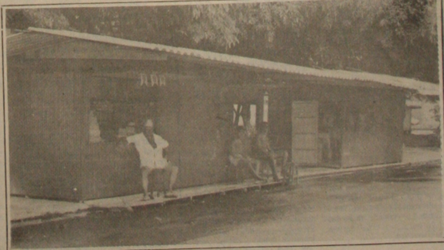
As barracas de fogos começam a ser instaladas na Praça Cruz Vermelha.

graduações dos militares visa, segundo militares do Estado-Maior das Forças Armadas (EMFA), a aumentar, em média 20 vezes, a diferença salarial entre a mais baixa graduação (soldado enganado e cabo) e o mais alto posto hierárquico (generais). Essa diferença hoje é de apenas nove vezes.