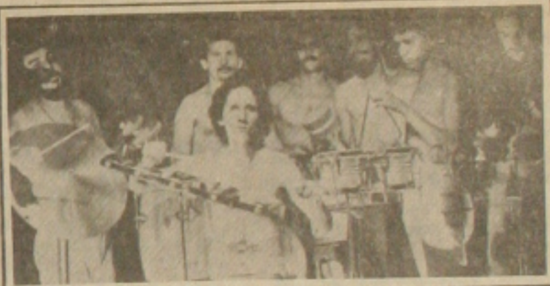
O Movimento Pró-música de Sergipe reuniu durante quase dois anos, composi- tores, cantores, instrumentistas e serviu como veículo de experimento para esse BOOM da Música Sergipana atual! Na época, ninguém havia gravado um LP no pessoal da terra. Logo depois, trilhou o disco VIAGEM CIGANA do Catafuzes com direção musical de Paulo Moura. Fica a foto para a lembrança no futuro

to com o consumidor. Como conseguir através de campanhas pedir do povo, cuidado com as instalações elétricas, fiscalização para evitar "gatos", se a própria empresa mantém com o consumidor, uma relação tão deteriorada. E os bares, padarias, hotéis, peixarias, frigoríficos, que são prejudicados quando se tem um colapso tão prolongado no sistema de distribuição de energia???? Quem paga o prejuízo??? O pobre do consumidor. "Bom dia, é da Manutenção..." Isso às 10 horas. "É que somente agora, o Plantão nos informou desse problema no Jardim Atlântico, na Coroa do Meio e já estamos inclusive com a ordem de serviço pronta.