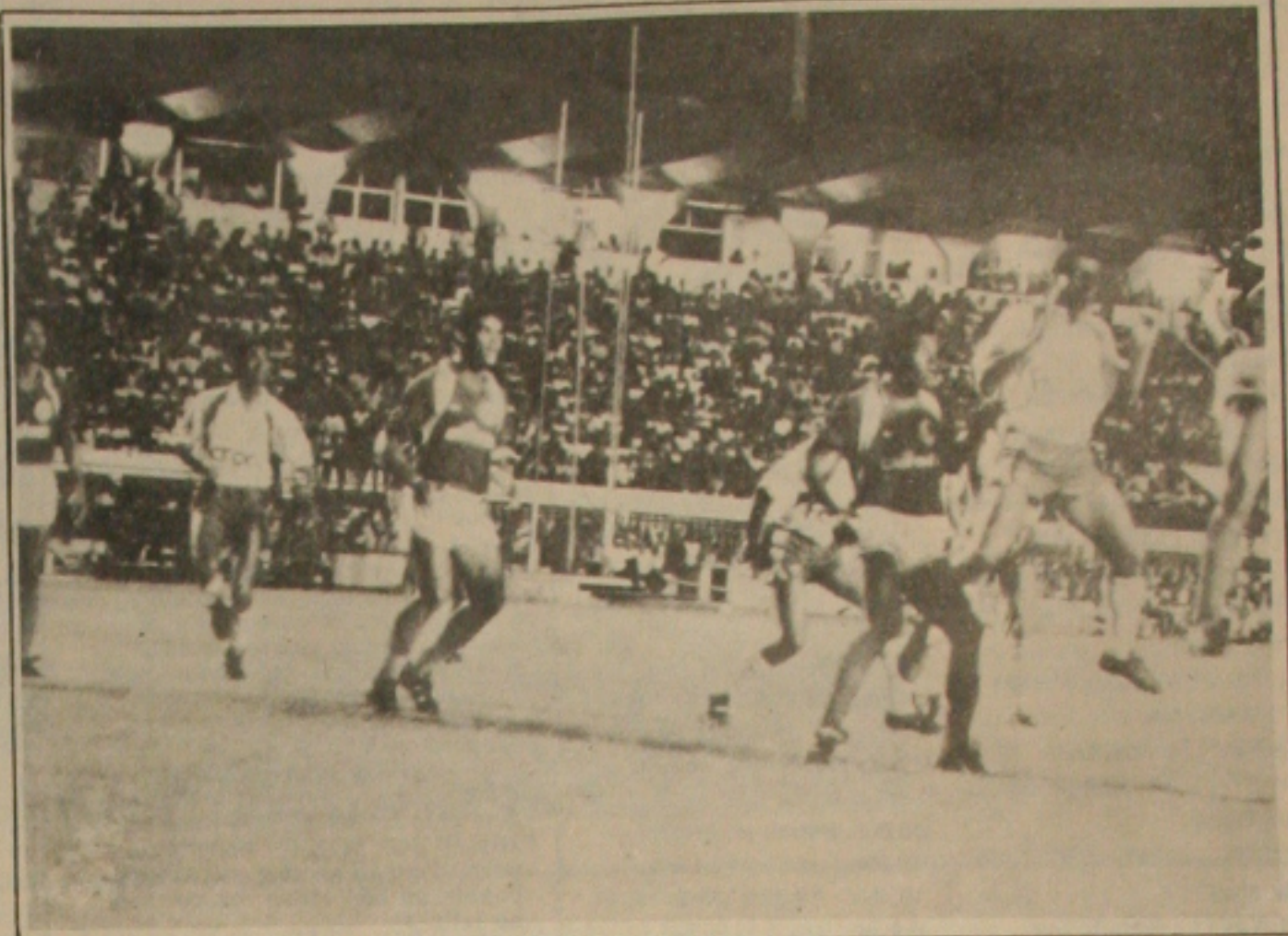
Sergipe e Confiança um jogo que promete muitas emoções.