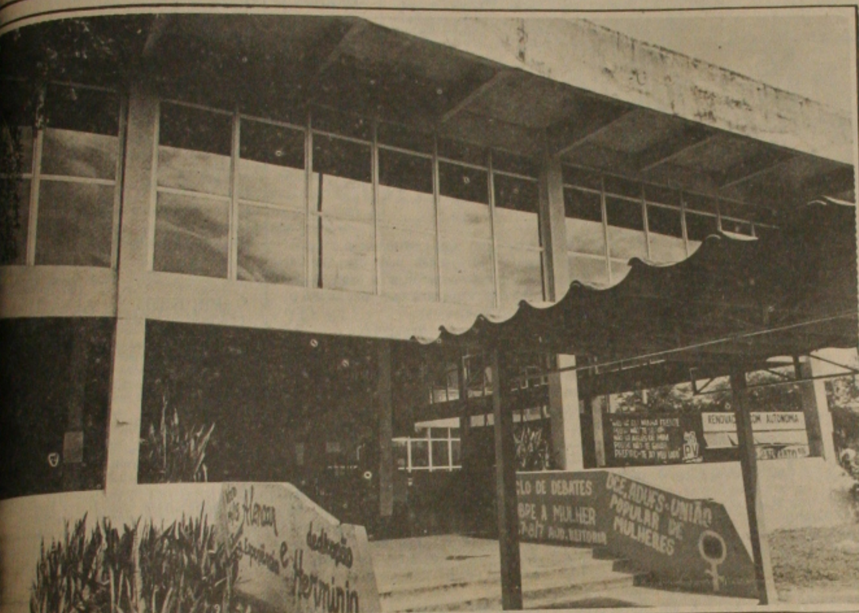
UFS mergulhada na pior crise de sua história. O Colégio de Aplicação também sofre com a crise enfrentada pela UFS.

Os problemas enfrentados atualmente na Universidade Federal de Sergipe são tantos que a própria comunidade universitária sente dificuldade em citá-los. As dificuldades já são notadas logo na sala de aula onde os quadros negros não oferecem condições, as carteiras estão sempre quebradas e quando chove não há como continuar a aula seja por causa do barulho da chuva que cai sobre o telhado de zinco ou mesmo pelas rachaduras que provocam as gotículas inundando o ambiente.