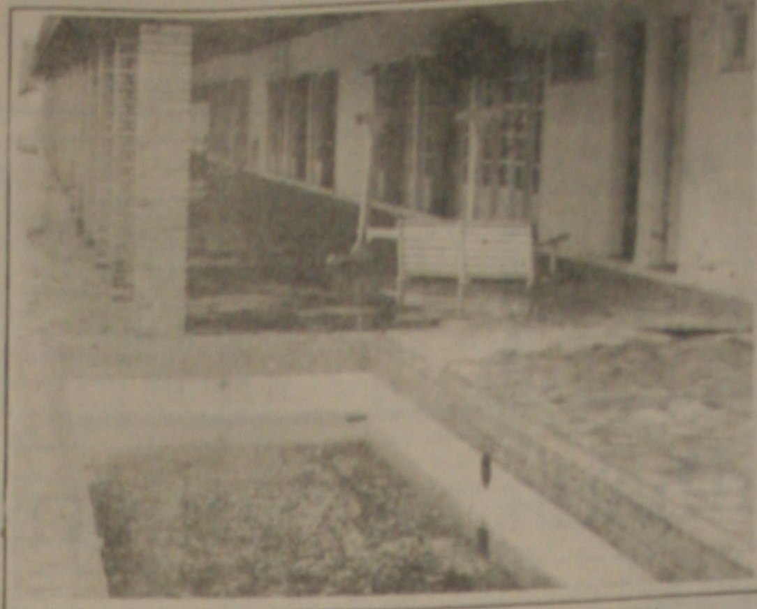
A piscina transformou-se num depósito de água contaminada.