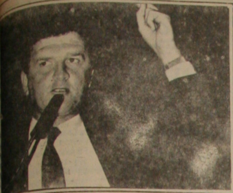
Magno denuncia que estão destruindo o Rio São Francisco

O vereador está propondo a formação de uma comissão de vereadores para analisar o projeto e dar a posição do poder legislativo, pois a questão é muito importante e o mais agravante é que o deputado Ismael Silva diz que não aceitará emendas ao seu projeto. Essa proposta pode até, se for aprovado, dar poderes a Governo do Estado, se assim o fizer, o que quer com os municípios, não é esse o caso, pois se o governador João Alves Filho administrar para ajudar e não só para os sergipanos. Por isso, temos que evitar que tal inconstitucionalidade, arbítrio, ato de força venha a ser aprovado na Assembleia. Mas tenho certeza de que os deputados irão primar pela democracia, não permitindo que a ditadura volte e inconstitucionalize os prefeitos biônicos, que foram combatidos por aqueles que queriam a liberdade e representavam os verdadeiros anseios do povo - concluiu Sérgio Bezerra.