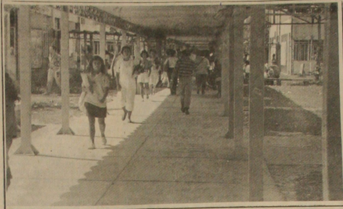
Ameaçada até de fechamento a UFS vive seus piores dias por falta de recursos.