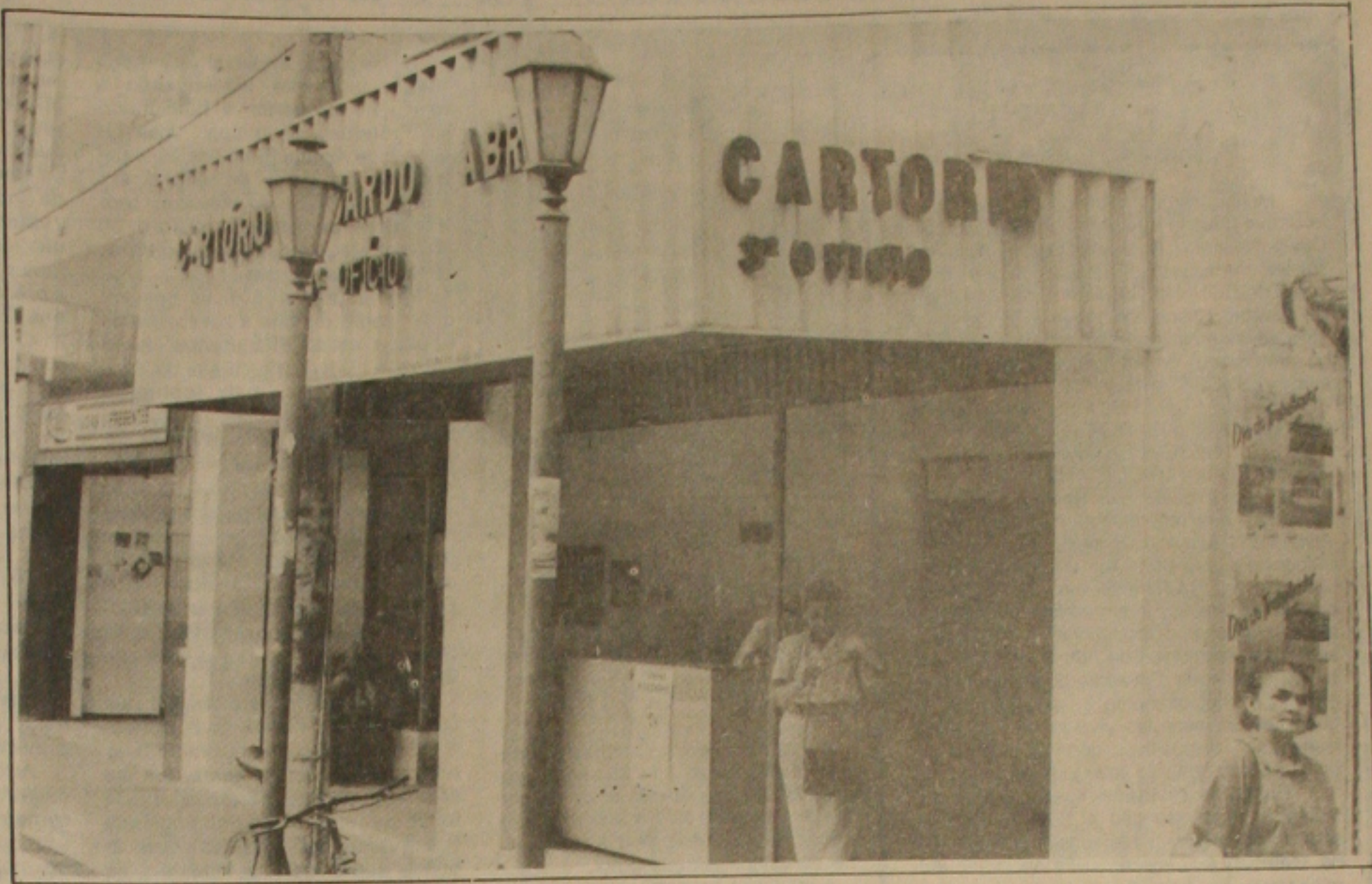
Os cartórios registram redução na emissão de títulos protestados pelo comércio aracajuano.

"Nesta época sempre há redução, é uma tendência natural do mercado e isso não quer dizer que as vendas cresceram ou reduziram. O protesto não é o termômetro do comércio", explicou o tabelião.