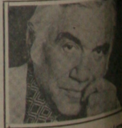
Galáctica-Batalha nas Estrelas, com Lorne Greene, é a atração deste Domingo no Cinema

Ficção científica. Uma conferência de paz do sistema estelar é sabotada diante da indecisão do presidente (Lew Ayres), traído por seu conselheiro (John Colicos), Balthar (John Colicos), os três são praticamente aniquilados. Sob apenas uma gigantesca nave de guerra Galáctica. A bordo da Galáctica, o comandante Adama (Lorne Greene) como pode organizar seu contingente contingente. E conclama a todos os brevíssimos que possam se unir a seus homens para lutar contra o inimigo. Forma-se, então, uma frota de 22 navios espaciais de todos os tipos, tripulados por gente como o Capitão Apollo (Richard Hatch), filho do Comandante Adama, o Tenente Starbuck (Dirk Benedict), exímio piloto de caças de guerra; além de um jovem com fama de quistador e do Tenente Boomer, Coronel Tigh (Terry Carter). Juntos, enfrentarão os elementos naturais e tentam que lutar contra seres extraterrestres.