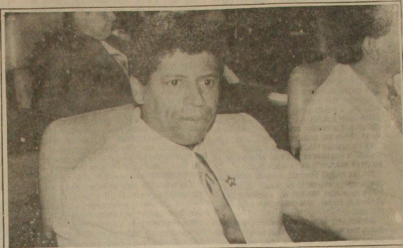
Ismael não conseguiu convencer vereadores que o prefeito biônico é bom para a população

A execrável figura do prefeito biônico, um instrumento de força do regime militar, que foi combatido pelos verdadeiros progressistas, que desejam a plena democracia através de um projeto apresentado por um dos representantes do Partido dos Trabalhadores na Assembleia Legislativa, deputado Ismael Silva, que propõe a divisão do Estado em regiões metropolitanas, acabando com a autonomia dos municípios, que passarão a ter um "prefeito" nomeado.