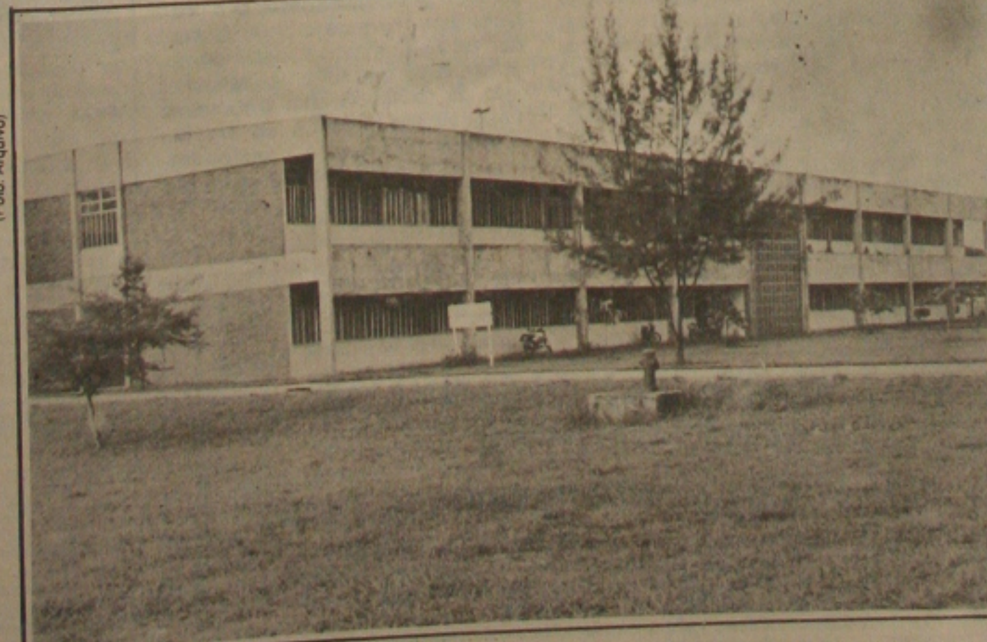
O Colégio de Aplicação também sofre com a crise enfrentada pela UFS.

conta com o apoio de toda sociedade sergipiana e no âmbito federal com o seu apoio e de toda bancada sergipiana, sensíveis ao problema e empenhada na sua solução, que passa por verbas a serem liberadas pelo Ministério da Educação, mas que esbarra no Ministério da Economia, no plano econômico e na cne que atravessa o País. Mas Gonçalves entende que o problema terá uma solução rápida, diante da sua gravidade, pois envolve o futuro de centenas de jovens que dependem daquela unidade de ensino superior para alcançarem seus nobres objetivos.