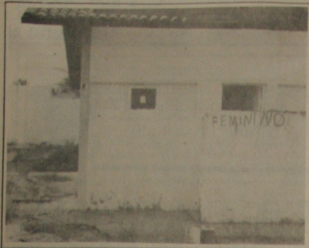
A rede de esgoto está danificada e põe em risco a vida de quem transita por ali.