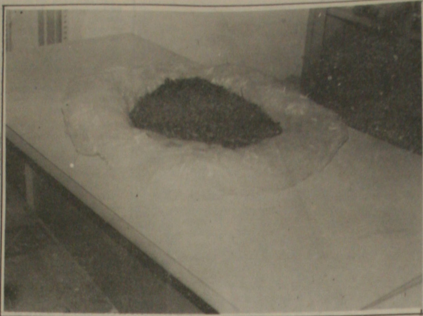
A maconha é vendida na porta das escolas da rede pública e privada em Aracaju.