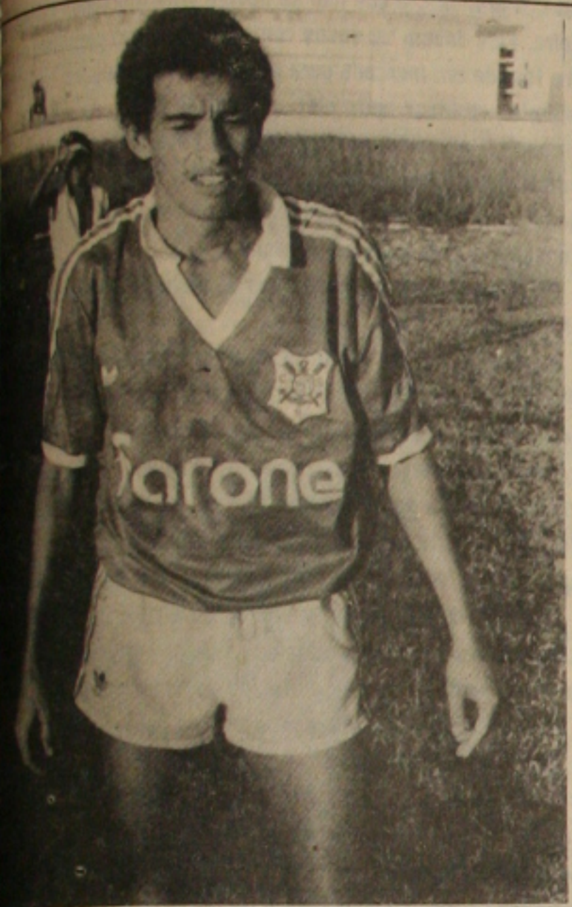
... não treinou, mas enfrenta o Estanciano hoje.

-Temos que ficar atentos. É só dar um exemplo: se após a rodada do dia 26, Lecce x Bari terminarem empatadas.