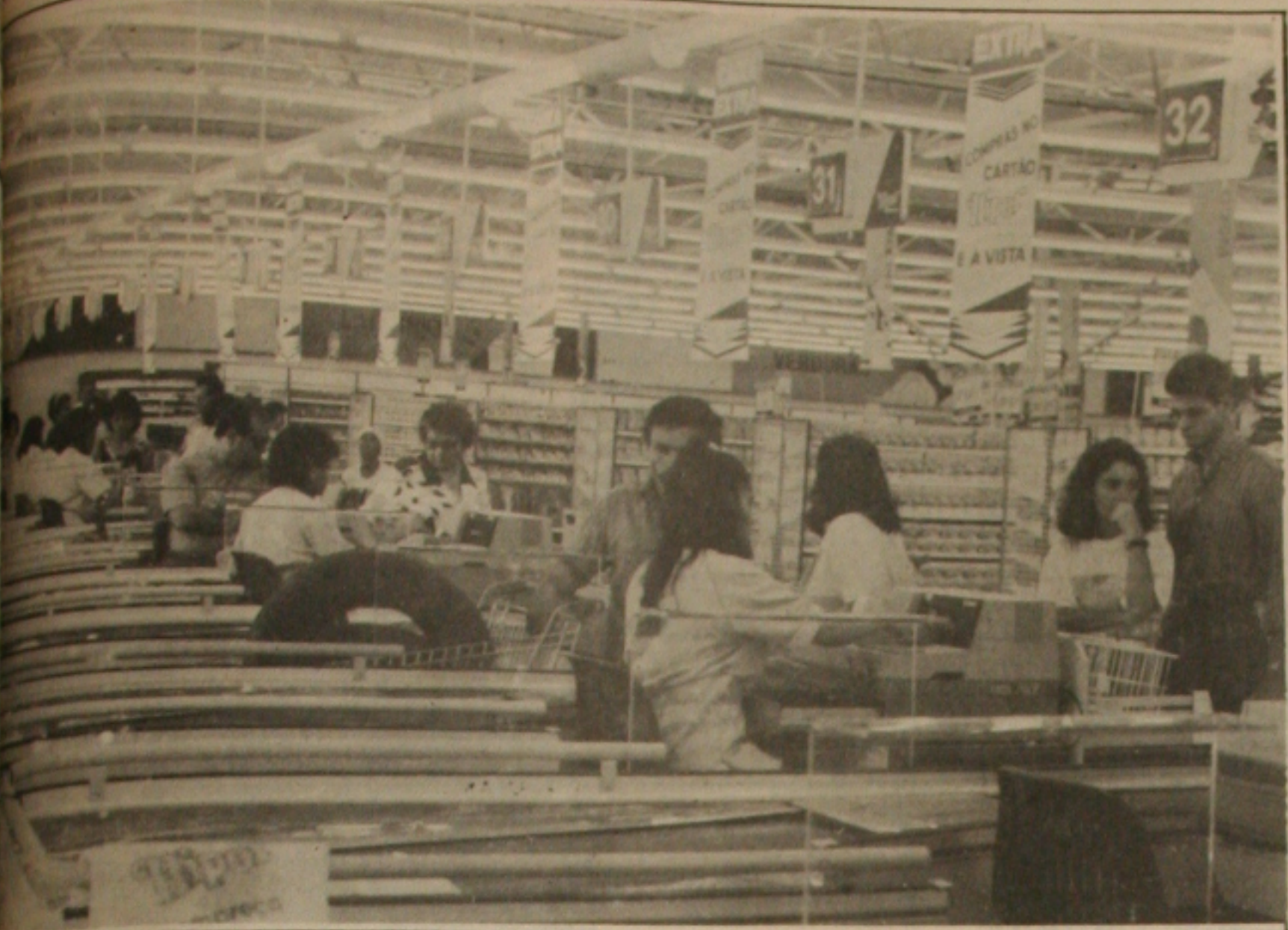
Outra vez na lista negra da Delegacia da Sunab, por majoração de preços.