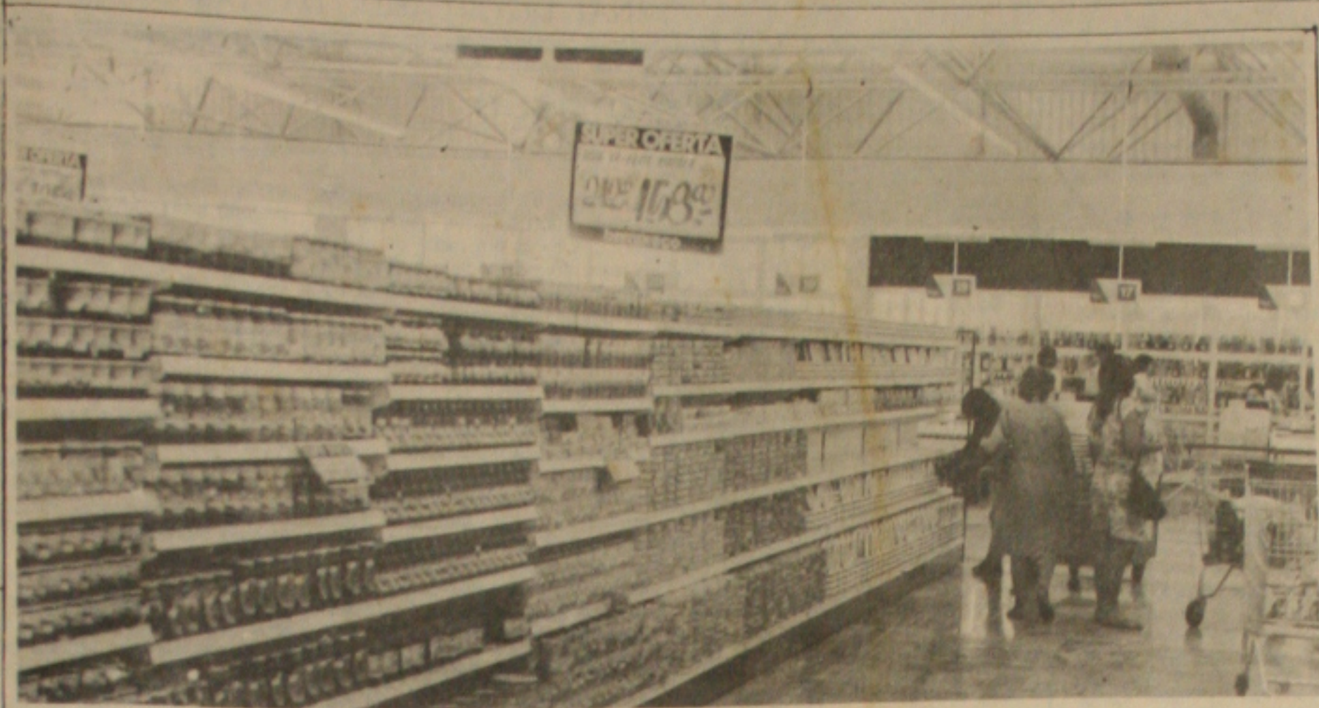
Os fiscais da Sunab foram aos supermercados para ver os reajustes dos preços.