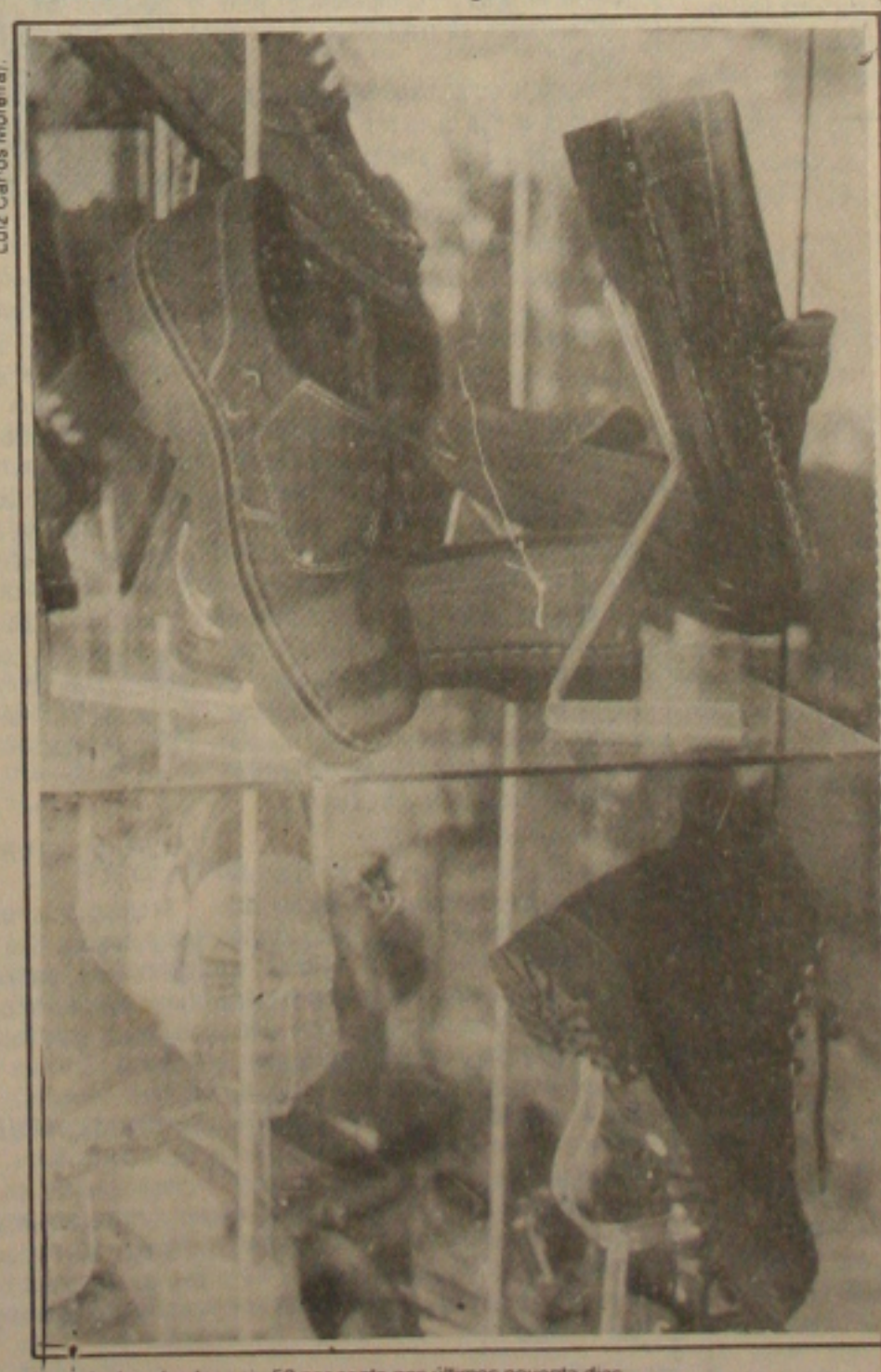
A venda de calçados caiu 50 por cento nos últimos noventa dias

O trabalho de prevenção das drogas vem sendo realizado desde o ano passado, todavia, está sendo intensificado agora em decorrência do apoio de dois patrocinadores (Ansef e PLAMED) que estão financiando a impressão de panfletos. Segundo o presidente da Ansef/SE, a finalidade desse trabalho é conscientizar as pessoas que não usam drogas e evitar que elas se tornem dependentes delas e quem já dependentes a deixar de usá-las.