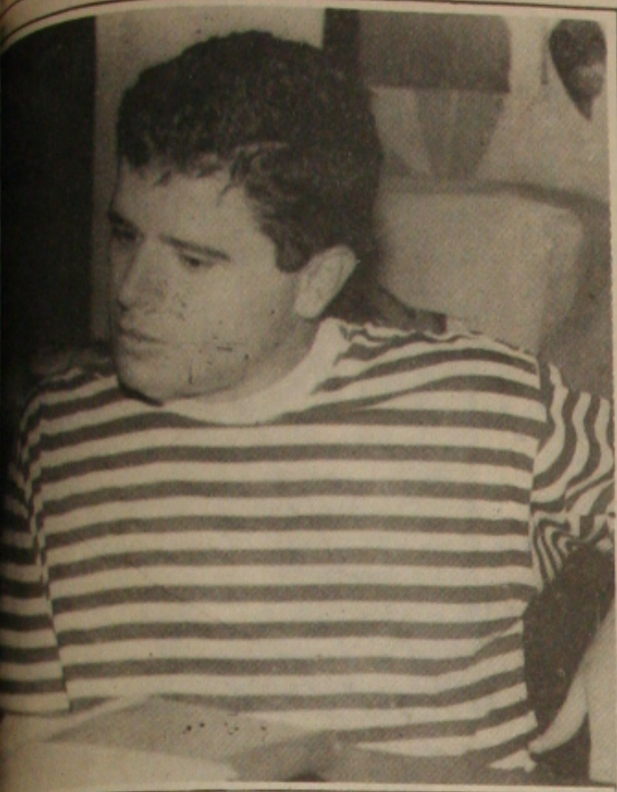
A mudança de ministro retarda as negociações com torrefadores.

Com a renúncia da ministra Zélia Cardoso de Mello, da Economia, não aconteceu a reunião que os torrefadores de café do País. A reunião para discutir a situação financeira da indústria de torrefação seria na semana passada. Agora eles aguardam a arumação do Ministério para voltar a pedir ajuda ao Governo Federal, com relação à uma revisão nos preços da matéria-prima: o café em grão.