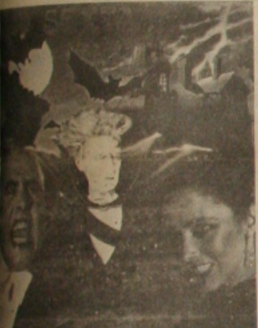
A COMÉDIA Nº 1 DOS FILMES DE HORROR

EXPRESSO DO HORROR Título Original: Horror Express Nacionalidade: Espanhola/Inglesa Ano de Produção: 1972 Direção: Gene Martin Elenco: Peter Cushing, Christopher Lee, Telly Savalas Um filme que tem seus fãs de dois mitos do cinema de horror, King e Lee, no papel de antropólogos riachos voltas com fóssil congelado durante a viagem. Ao voltar à vida, manifesta poderes sobrenaturais e dizima os passageiros do trem em um filme que tem seus fãs.