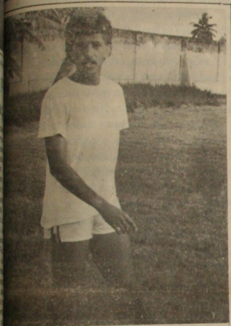
Atuar na seleção.

A partida parecia fácil. E era. O Sergipe porém que complicou o jogo contra o Estanciano e no final, sua torcida passou momentos difíceis. Mesmo assim, o time rubro venceu ontem à noite o Estanciano por 3x2, no Batistão, mantendo-se na liderança do quadrangular, ao lado do Confiança que venceu o Maruinense, em Maruim. Os gols do Sergipe foram marcados por Elenilson, Tuíca e Léniton. Celso Mendes, marcou os dois gols do Estanciano, ambos na segunda fase, quando o Estanciano apareceu para o jogo. A arbitragem de Simião Fagundes foi tranquila e não recebeu reparações das duas equipes. A renda do jogo foi muito boa, para uma quarta-feira à noite: Cr$ 1.130.150,00 para 2.257 pagantes.