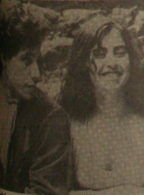
... e Fernanda Torres no filme de Walter Lima Jr.