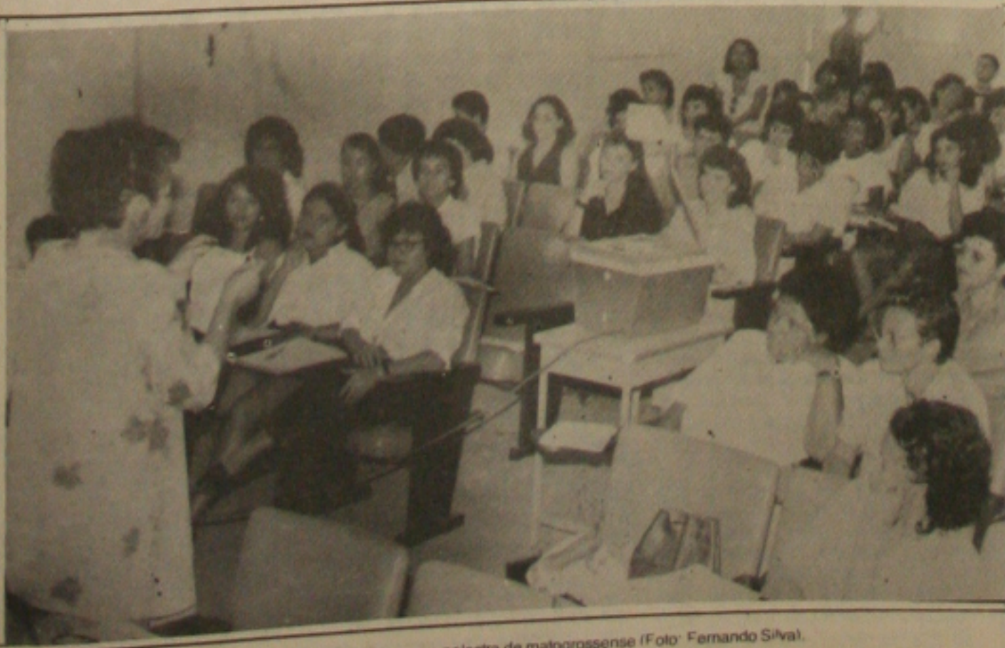
A I Semana do Assistente Social foi encerrada ontem com a palestra de matogrossense.

Os certificados para que participantes do evento como uma frequência superior a 80% serão entregues na sede do Conselho Regional de Assistentes Sociais em data a ser definida.