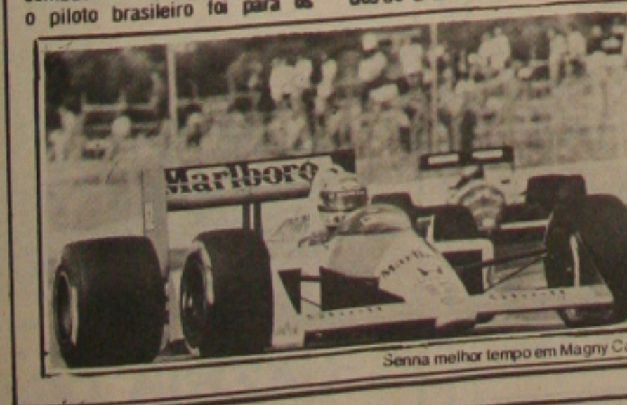
Senna melhor tempo em Magny Cours.

Senna aprovou o circuito de Magny Cours dizendo que tem uma curva de alta velocidade muito interessante e outra, de 180 graus, que vai exigir muita precisão nos treinos cronometrados do Grande Prêmio.