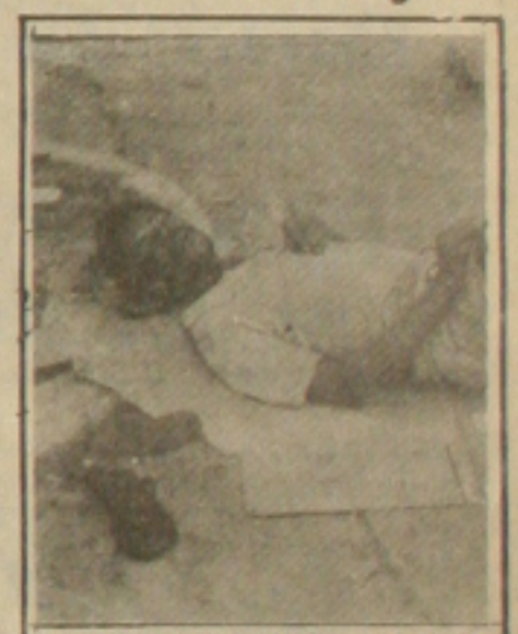
Os mendigos se entregam ao alcoolismo.