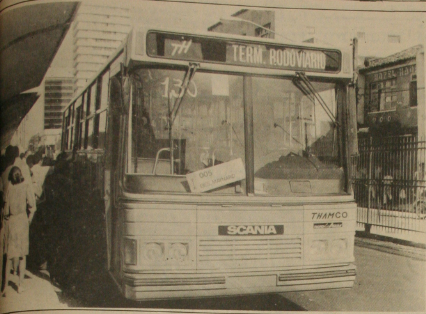
Os motoristas de ônibus vão aderir à greve geral durante os dois dias de greve nacional, conforme definição dos motoristas em assembleia geral (Foto: arquivo).

As lideranças sindicais do Estado estão confiantes no sucesso da greve geral convocada a nível nacional para os dias 22 e 23 de maio, em protesto contra a política recessiva imposta pelo Governo Federal. Em Sergipe, várias categorias que fizeram realizar assembleia para decidir a adesão ou não ao movimento, já optaram pela paralisação. Os motoristas de ônibus já decidiram pela adesão a greve.