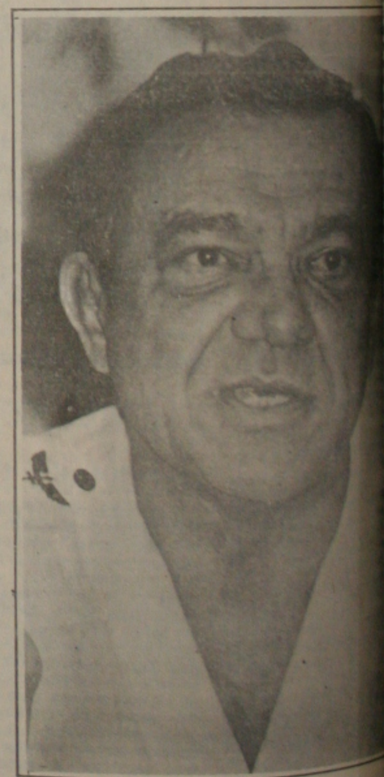
Brigadeiro Sócrates diz que militares não estão em crise.

Perante uma audiência silenciosa, ele descreveu as realizações do Exército, Marinha e Aeronáutica, incluindo os 150 aeroportos construídos pela Aeronáutica na Amazônia, em 33 anos, e o ITA (Instituto