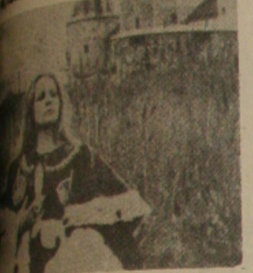
... de uma rainha