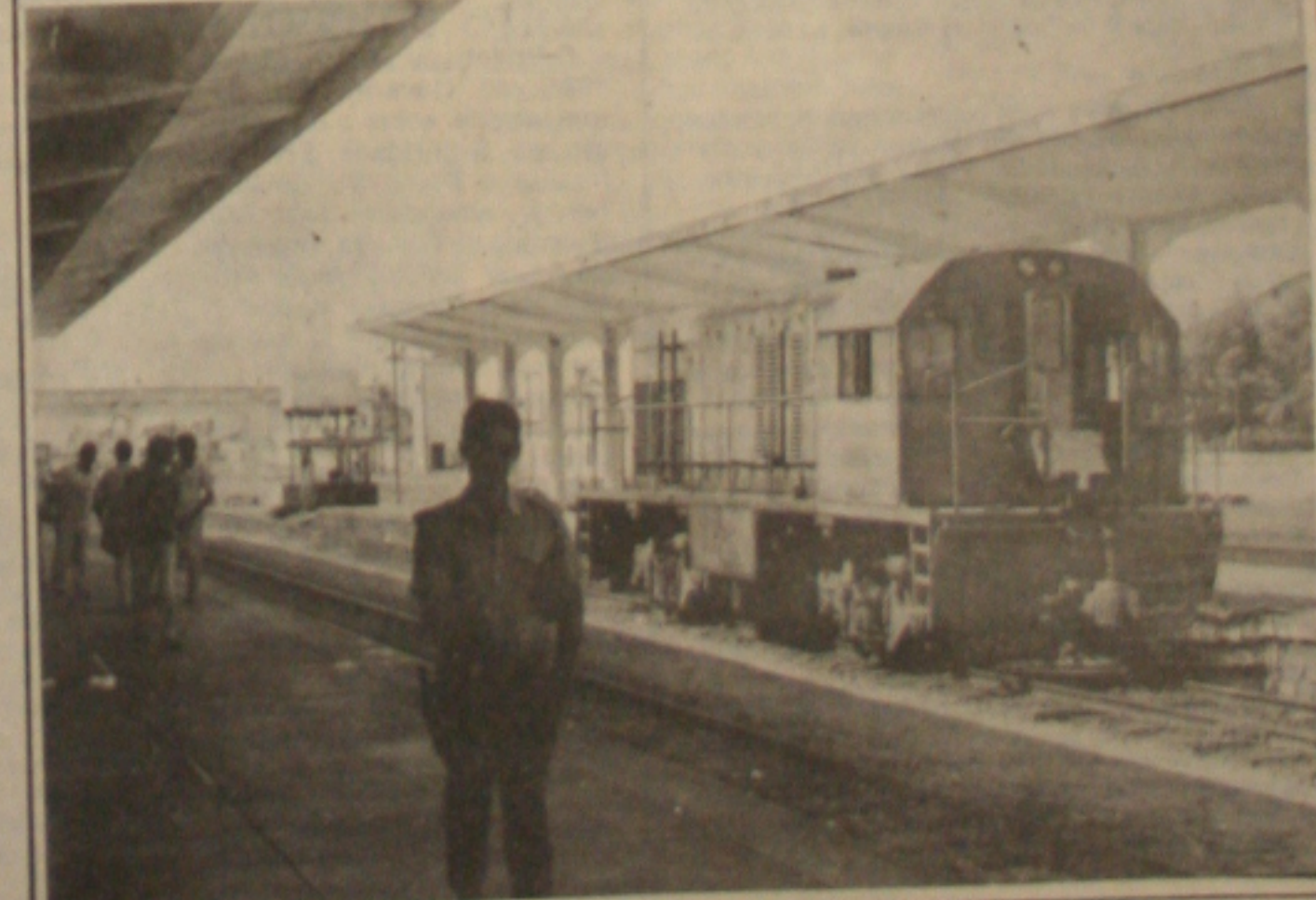
A greve dos ferroviários foi adiada para a próxima quarta-feira, decisão tomada em assembleia