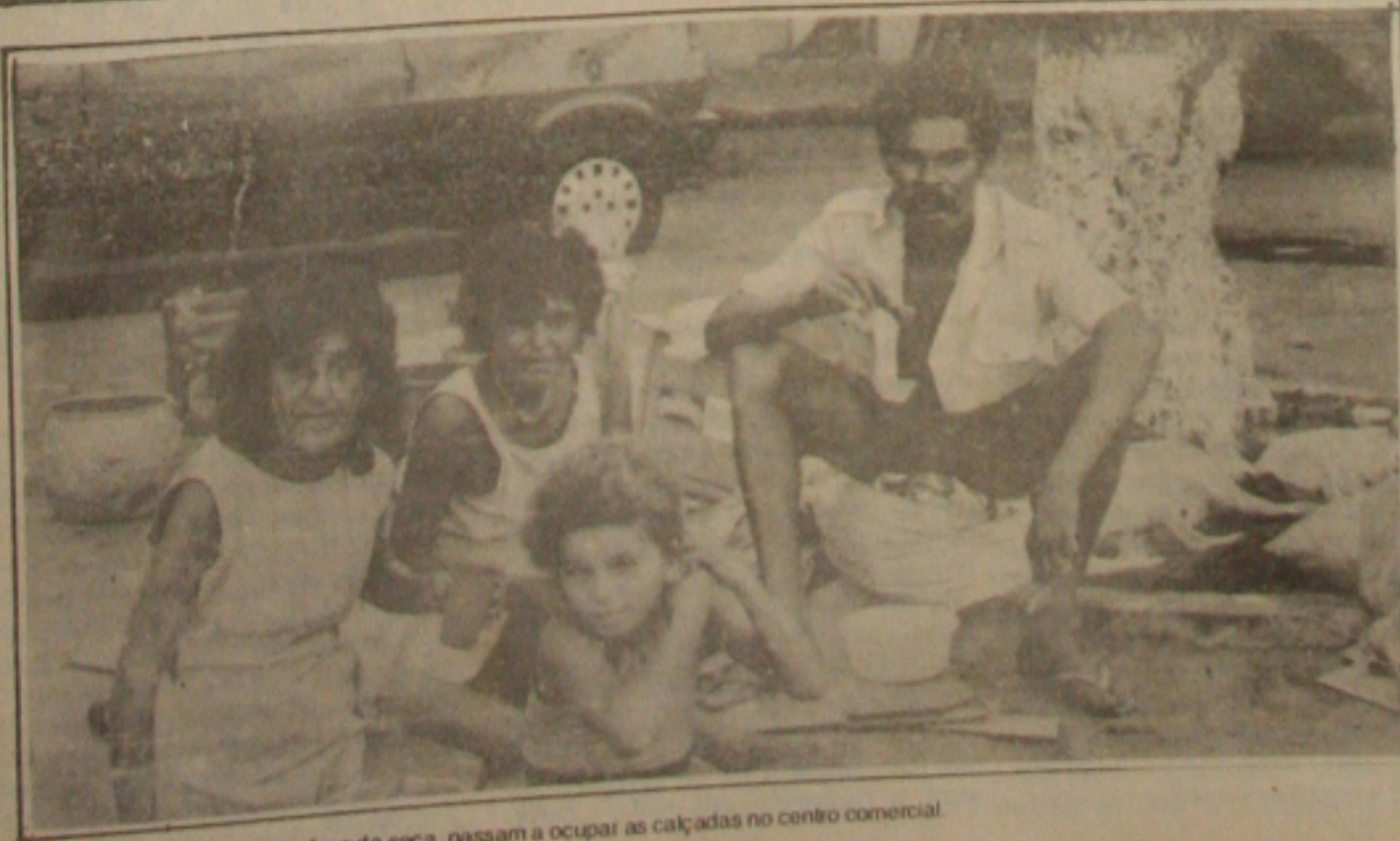
Famílias inteiras vindas da área da seca, passam a ocupar as calçadas no centro comercial.

Devido a longa estiagem no Nordeste e como reflexo da crise econômica que atravessa o País, com graves consequências sociais, aumenta a cada dia o número de pessoas que sem moradia e sem comida, se abrigam nas portas das casas comerciais do centro de Aracaju. São famílias inteiras que passam o dia mendigando a comida e a noite, sem a proteção das marquises das portas e dos prédios do centro da cidade. A maior aglomeração de mendicância ocorre ao longo da Avenida Dóres, nas proximidades do Mercado Central e na Estação Rodoviária. (Página 3B).