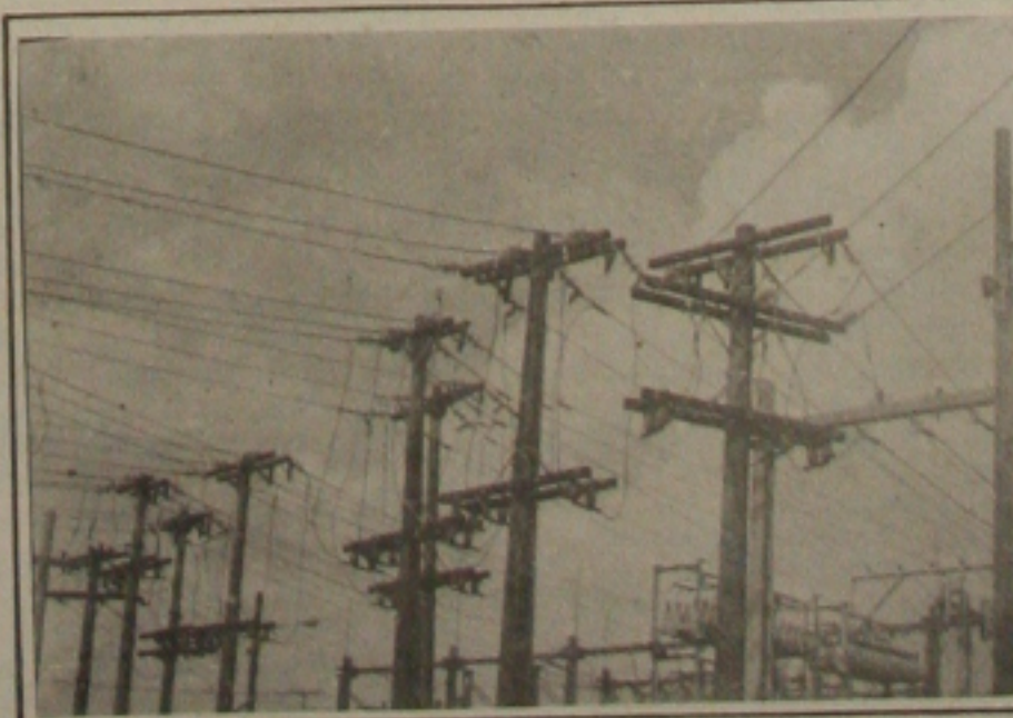
A chuva tem ajudado na limpeza da rede elétrica.