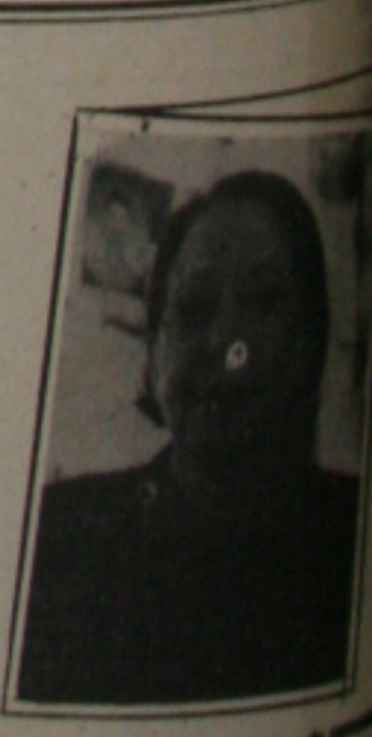
do para os diretores um bom dia acompanhado por um cartãozinho.

Uma audiência sentida foi a de Fernanda Montenegro, aplaudida todas as vezes em que apareceu na tela. Mas ela não deixou a ocasião em branco, mandan-