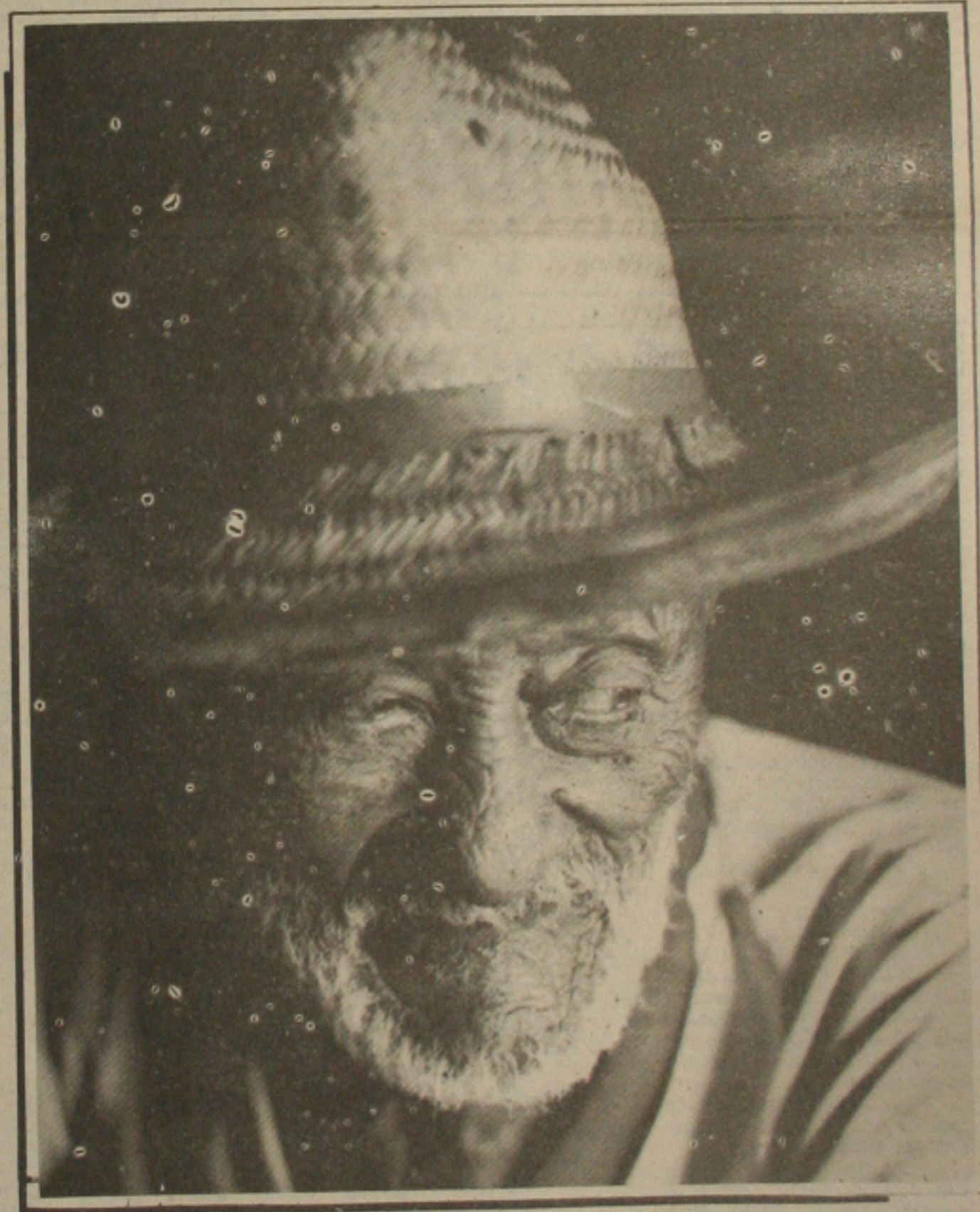
Um perfil sem nome, mas muito humano, de acordo com a poesia da vida. Quando a idade já não vive nos olhos, nem no corpo, mas a alma guarda cada instante, cada história, toda luta, toda dor, a vida aprende a sua lição mais completa. A da Felicidade num lugar entre o próximo e o distante, entre a terra e o céu. Um dia, os homens ainda poderão levar para as montanhas mais altas, aquele toque de nuvens e de cor.

Já é tempo dos órgãos e pessoas que fazem a cultura em Sergipe, arregaçarem as mangas e ensaiarem um procedimento mais profissional. De posse desse documento, os organismos se estruturariam e a parca verba destinada ao fazer cultura seria melhor aproveitada.