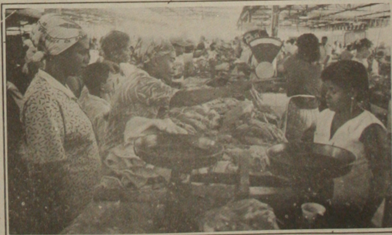
No Mercado Thales Ferraz há tempos que o congelamento deixou de existir.