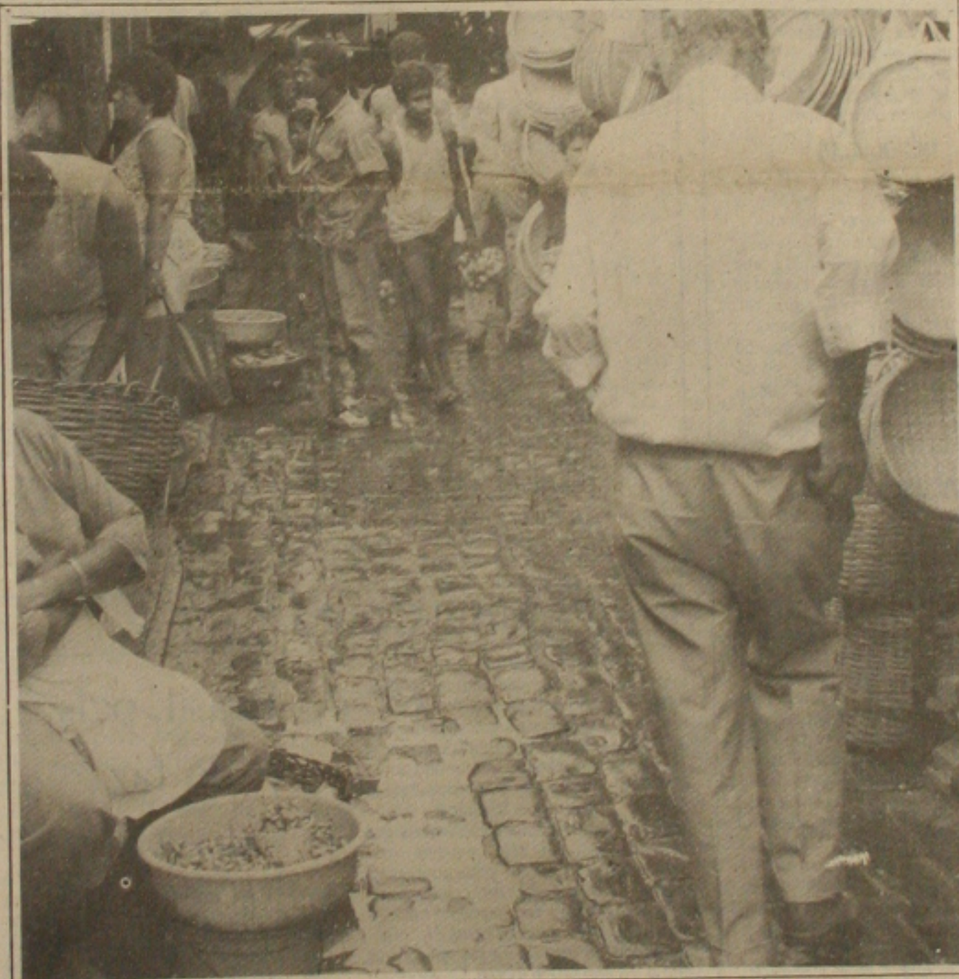
Sem limpeza, o mercado central ficou mais imundo devido a chuva.

Ele narra ainda as recentes violências praticadas no povoado Lagoa Redonda, em Pacatuba, quando posseiros foram agredidos física e moralmente por jagunços, que atingiram também religiosos do município. Sobre a seca ele lamenta o comércio e a indústria de exploração do povo pobre praticados por políticos inescrupulosos e aproveitadores da boa fé da população miserável, que se submete a todos os tipos de humilhação para receber uma cesta de alimento ou um pouco d'água, onde o único critério para distribuição é o favorecimento em troca do voto.