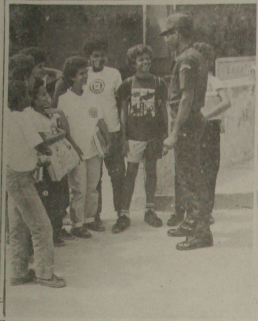
O soldado PM se entrosando com os alunos na porta do colégio.