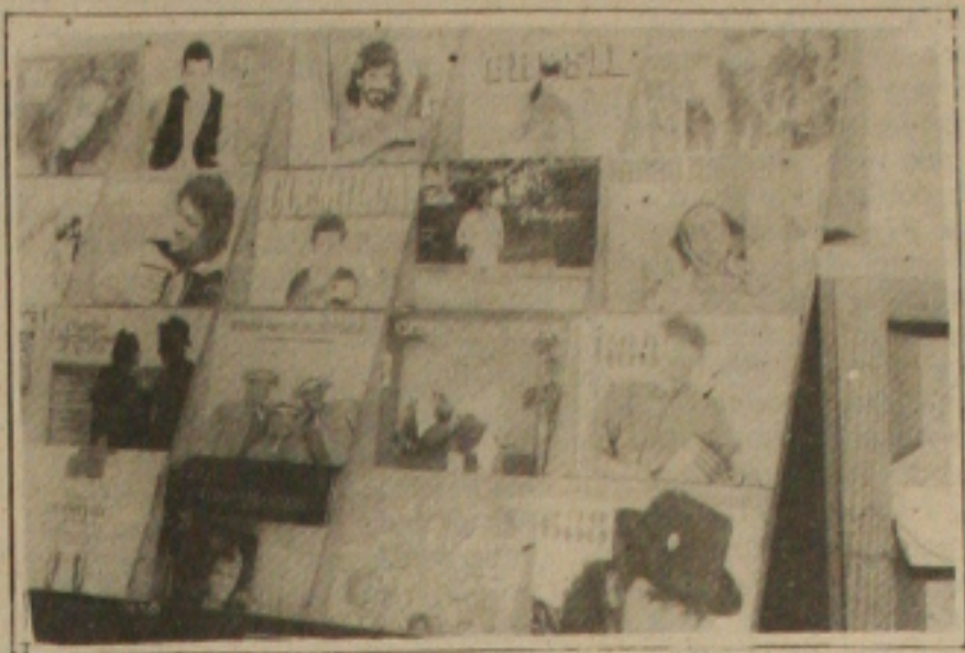
As lojas de discos preparam espaço só para os lançamentos de discos juninos.

Faltando pouco menos de um mês da grande data dos festejos juninos, o São João, comemorado no dia 24 de junho, a cidade já vive o clima das tradicionais festas nordestinas, que na realidade começam a partir do dia 1º do próximo mês. No comércio, as lojas iniciam decoração alusiva e as casas de discos já montam prateleiras e stands com os últimos lançamentos de músicas juninas. Mas até agora a animação só mesmo por conta das casas noturnas que realizam forrós antecipados com as presenças de expressivos artistas nacionais, com grande sucesso no Nordeste. As vendas de discos ainda são consideradas pelos comerciantes como tímidas, mas eles acreditam que a partir desta semana a tendência é de crescimento.