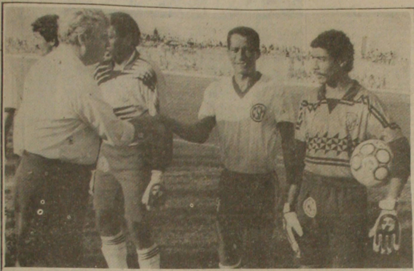
O Maruense está motivado para vencer a Seleção.