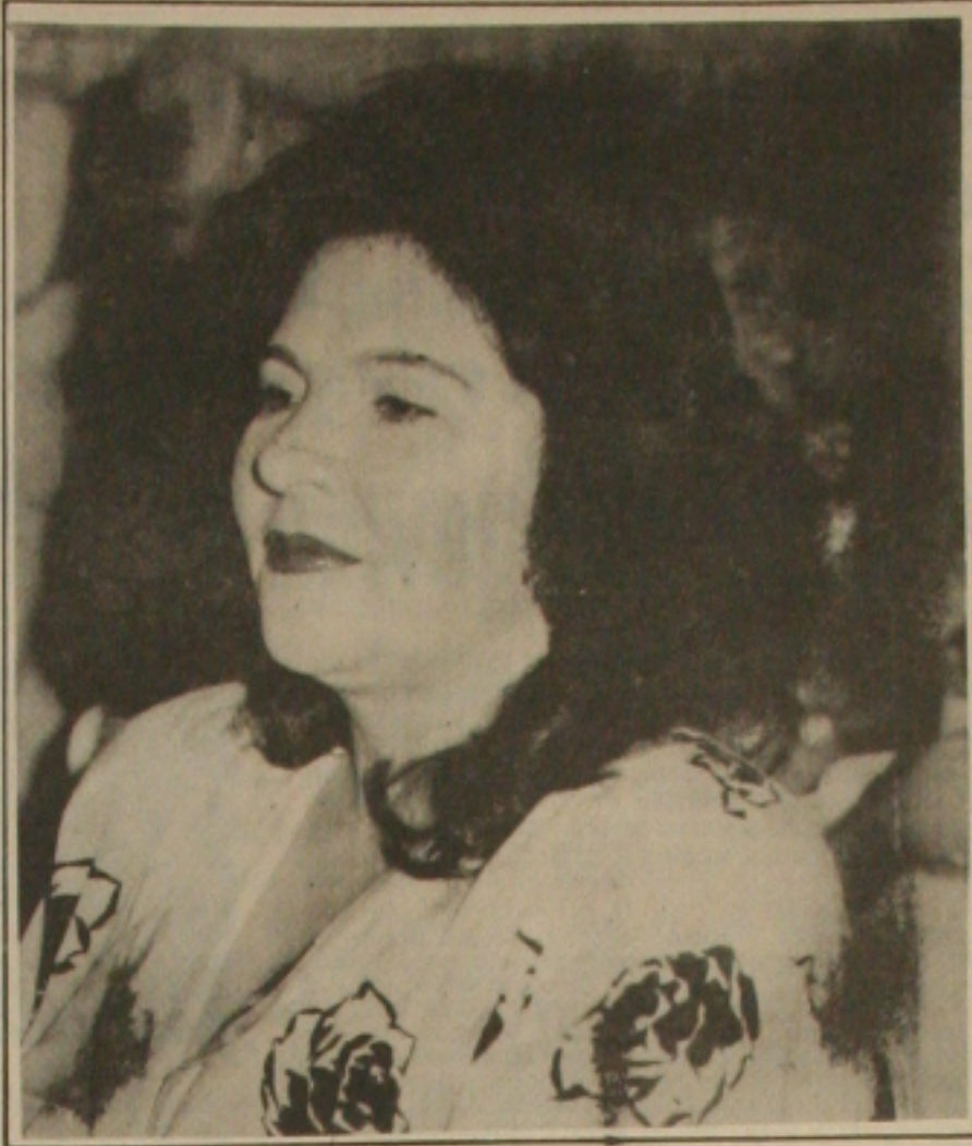
Um foco de luz de Socorro Pereira.

Assim como o parlamentar baiano, os políticos devem lançar-se contra a estúpida idéia de instituir a Pena de Morte no Brasil.