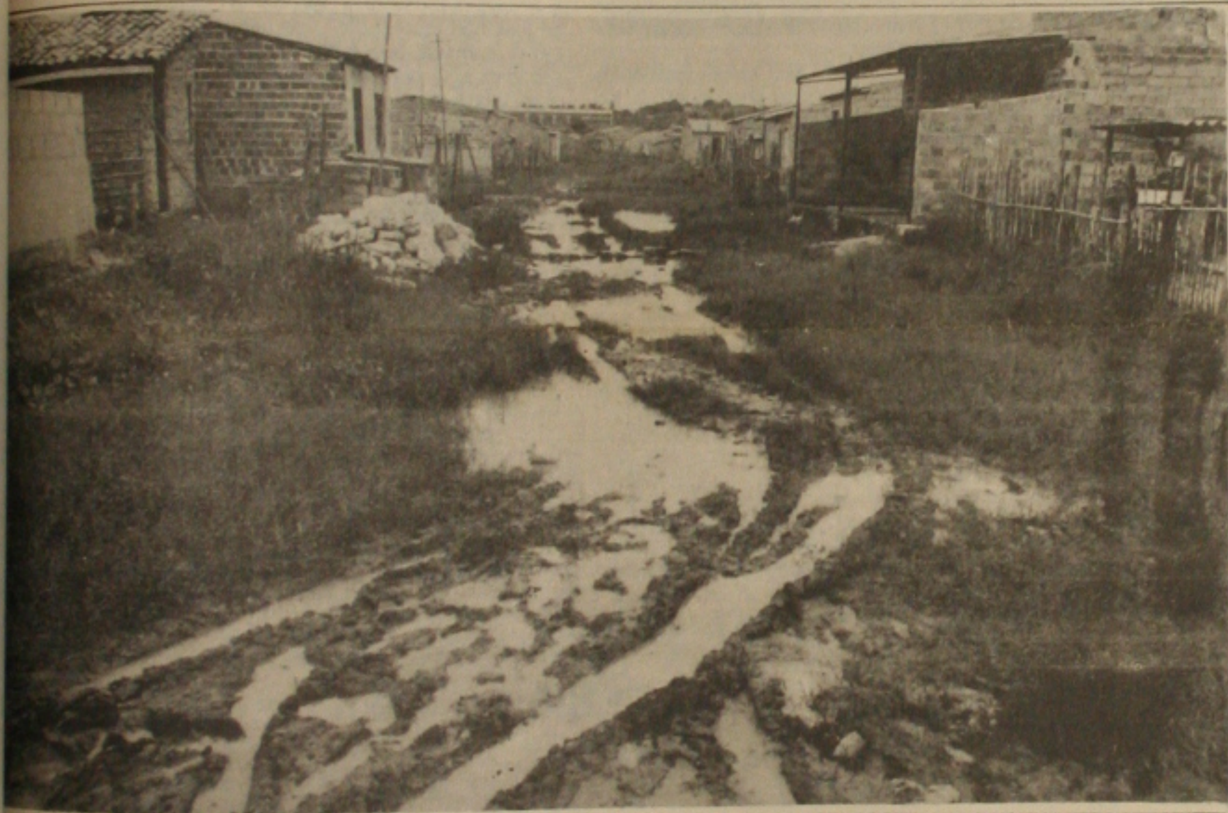
As águas da bacia das inundações e alagamentos deixam intransitáveis a maioria das ruas e a recuperação começa a partir de hoje.

O prefeito de Aracaju, Wellington Paixão, decretou ontem estado de emergência, em consequência das fortes chuvas que castigam há oito dias o município. Duas crianças foram internadas com meningite no hospital de isolamento de Riachuelo, a 62 quilômetros da capital. Outras cinco famílias estão sendo assistidas pela Secretaria Municipal de Saúde, com suspeita da doença.