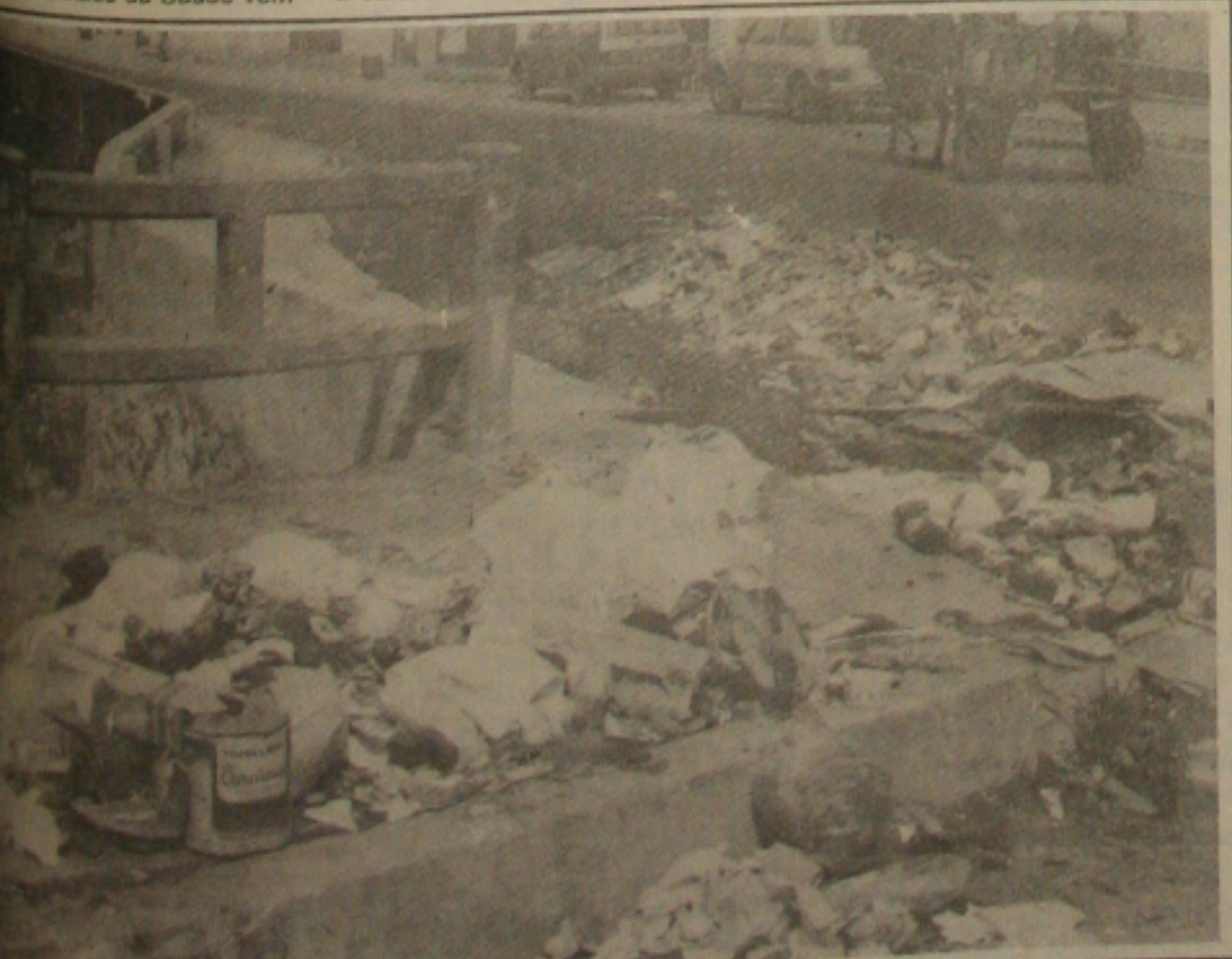
Al para a proliferação de ratos nos locais de grande movimento.

Nilo Almeida chamou a atenção da população alertando que nos próximos 15 dias o número de casos aumentará sensivelmente haja vista as inundações ocasionadas pelas chuvas. "É bom alertar que o rato possui a bactéria, mas não morre da doença enquanto que nos animais domésticos a bactéria causa a morte", ressalta.