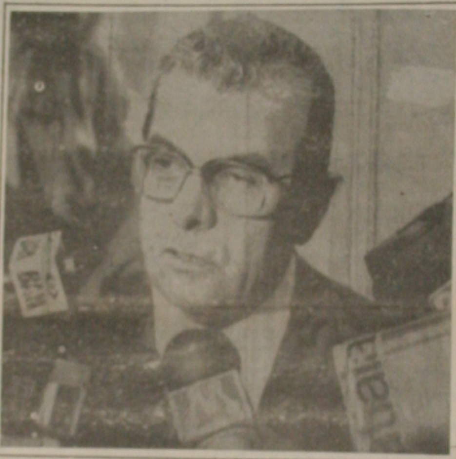
O ministro Jarbas Passarinho.

que serão apresentadas a Collor, Passarinho também pode incluir um projeto de lei complementar que regulamente o exercício de greve para os servi-