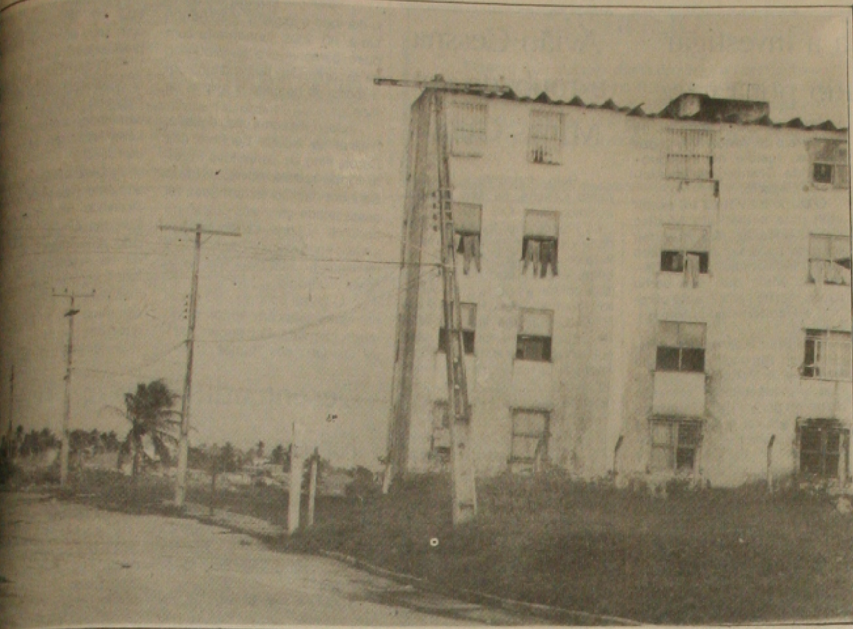
As interrupções no fornecimento de energia elétrica são constantes, servindo de reclamações dos usuários.