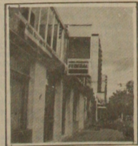
Caixa: financiamento a partir de setembro.

O superintendente da Caixa Econômica em Sergipe disse que particularmente, espera que no segundo semestre deste ano o Governo possa liberar crédito para novos financiamentos, e se isto acontecer pode ser que haja um reaquecimento no setor. Conforme ele, ainda hoje existem muitos imóveis com financiamento garantido, esperando apenas que os interessados possam preencher os pré-requisitos básicos exigidos pelo Sistema Financeiro da Habitação.