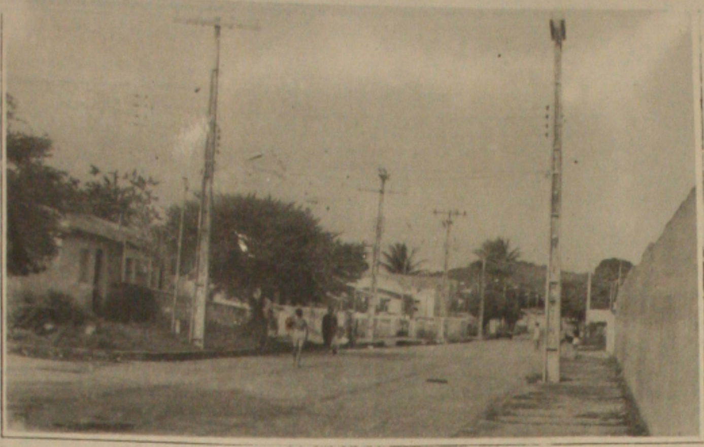
A antiga rede de energia elétrica da cidade não está resistindo a chuva e termina provocando frequentes cortes no fornecimento.

Os cortes no fornecimento de energia elétrica em Aracaju estão se tornando mais frequentes devido a chuva que agrava ainda mais os danos para as caducas redes elétricas. Foi o que revelou ontem o presidente da Energipe, João Pinheiro, ao lamentar o agravamento da situação e os constantes problemas para os consumidores. Pinheiro disse que as velhas redes, sem conservação, não estão resistindo à chuva, que provoca a queda de árvores. Com o aumento das árvores sendo desmatadas também sendo desmatada, outra causa do problema é o aumento das sub-estações que atendem a cidade. Só com a instalação de novas sub-estações o sistema será sanado. (Página -