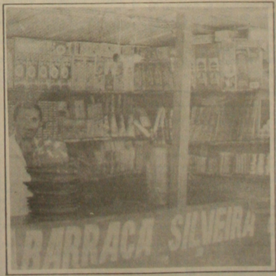
Os comerciantes esperam melhorar as vendas de fogos a partir do dia 15

Os comerciantes se sentem seguros ao comercializar fogos naquela Praça. Segundo declararam, diariamente o Corpo de Bombeiros está atento prestando assistência as 24 horas intensivamente.