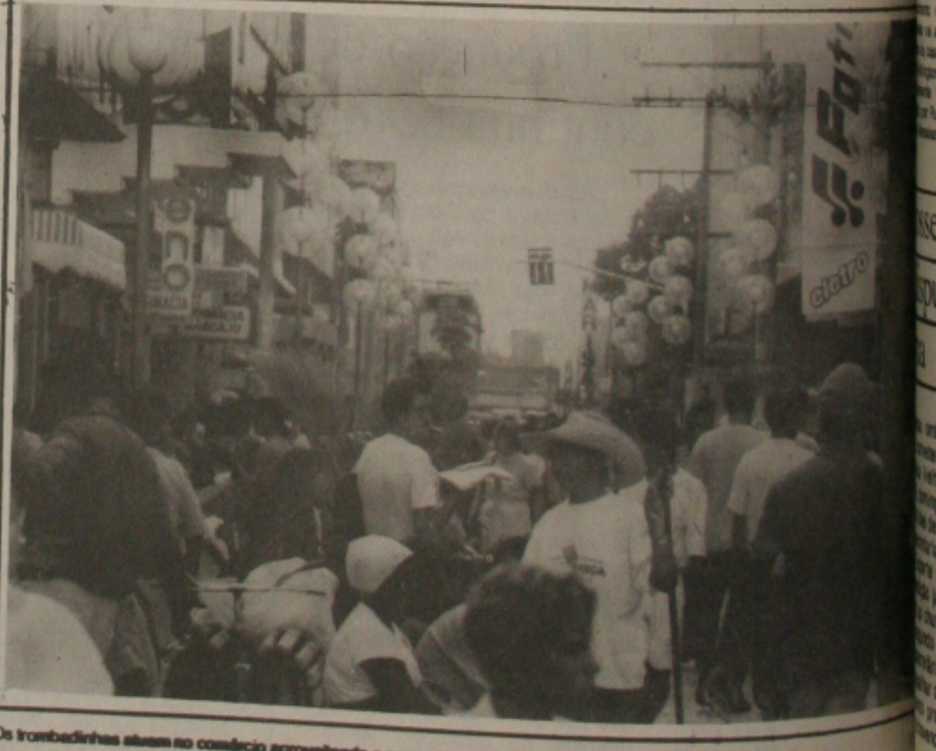
Os trombadinhas aliam no comércio aproveitando o movimento do calçadão.

Carlito Barbosa segundo informações, foi atingido pelo disparo de locala quando se dirigia para sua residência. A polícia acredita que o crime ocorreu por vingança, entretanto, vai apurar através de inquérito policial que será instaurado a partir da próxima segunda-feira.