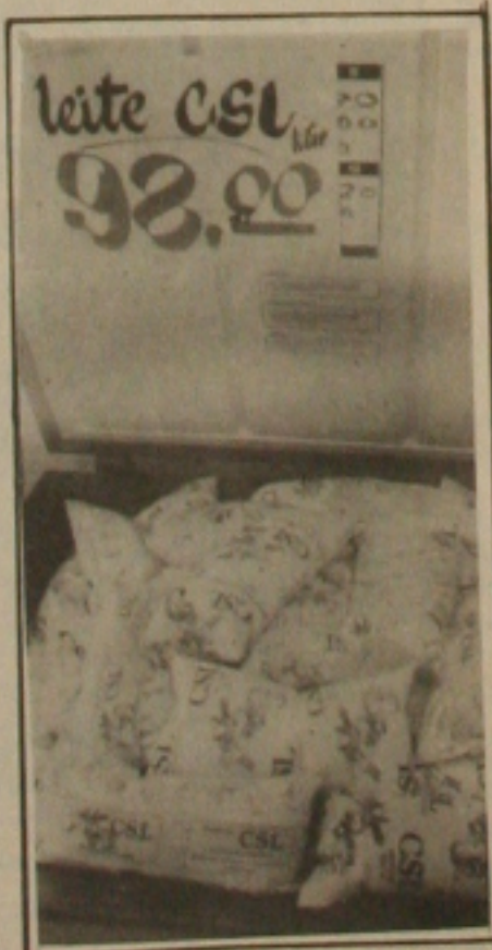
Produção de leite in natura está reduzida em 35 por cento.

Fez questão de ressaltar o diretor administrativo que, mesmo o pasto estando bom não contribuirá para o aumento da produção de leite, apenas para a retomada da produção normal que havia caído com a seca. Conforme revelou, só haverá o seu crescimento no dia em que o Governo Federal investir na agropecuária, dando apoio a investimentos, que consequentemente, incentivaria os criadores a melhorar o seu gado, comprando os de raça para cruzar com os outros, havendo, assim, uma maior demanda do produto. Declarou ainda que, no pe-