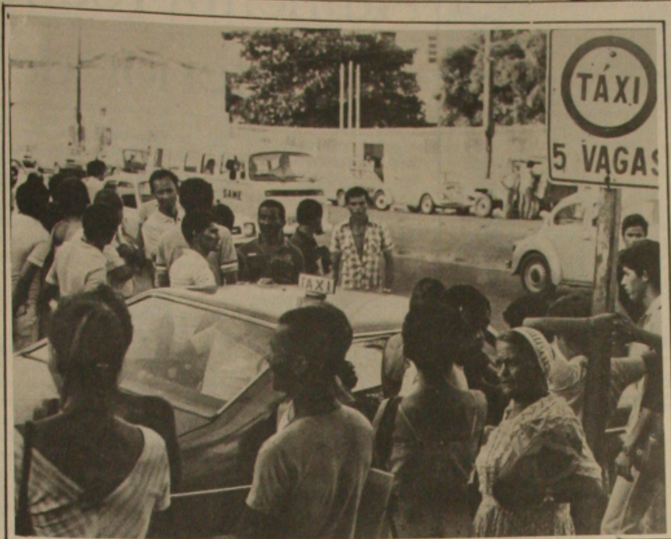
Taxistas reclamam do novo aumento no preço dos combustíveis.