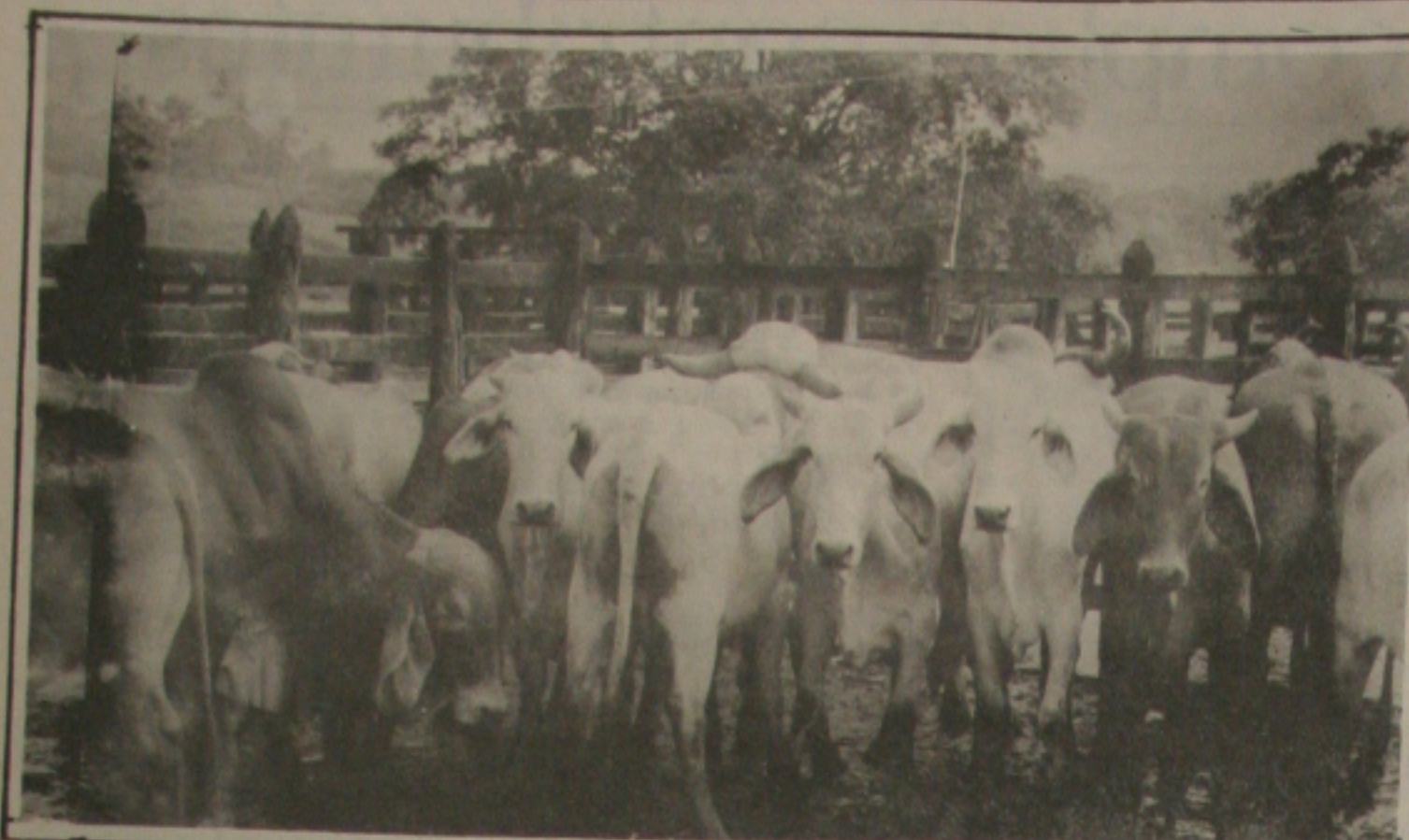
O gado ainda é alvo preferido das quadrilhas que agem impunemente no alto sertão sergipano.