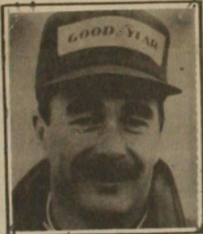
Nigel Mansell, melhor tempo nos treinos de ontem no Canadá.

Depois de uma inesperada quebra do motor de seu Marlboro McLaren Honda titular no treino da manhã, que o fez perder quase a metade do tempo oficial cronometrado, o brasileiro Ayrton Senna ficou com o terceiro melhor tempo do primeiro dia de treinos para o Grande Prêmio Canadá de Fórmula 1. O atual líder do Campeonato Mundial de Pilotos, fez tempo de 1min35s843 contra 1min35s065 do "Pole-Position" provisório, o inglês Nigel Mansell, da Williams Renault. Outro piloto rápido foi o francês Jean Alesi (Ferrari), que conseguiu a segunda marca, com 1min35s257. Logo atrás de Senna classificaram-se Roberto Moreno (Benetton), Alain Prost (Ferrari), Andréa De Césaris (Jordan) e Nelson Piquet (Benetton). Os treinos cronometrados foram realizados com pista molhada no Circuito Gilles Villeneuve.