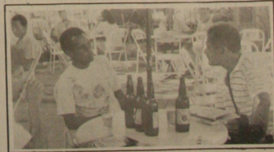
Os donos de bares têm que informar o tipo de serviço à Sunab.