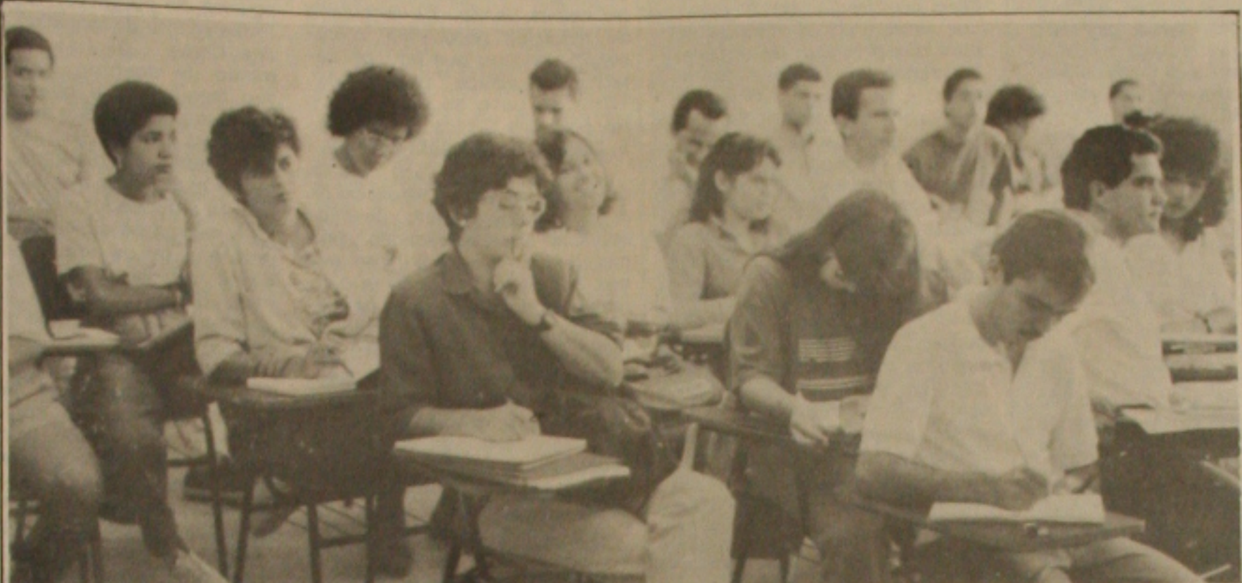
Sem dinheiro, a UFS tem mantido suas atividades acadêmicas em condições precárias.

Nada mudou na Universidade Federal de Sergipe a partir da anunciada liberação de 397 milhões de cruzeiros feita recentemente em visita ao Estado, pelo ministro da Educação, Carlos Chiarelli. Sob a emoção da recepção proporcionada pelas autoridades locais, o ministro Chiarelli em exaltado pronunciamento no Palácio Olympio Campos, prometeu os recursos que a Universidade precisa para sair da grave crise financeira em que está mergulhada. Mas tudo não passou do anúncio, segundo revelou ontem o reitor Clodoaldo de Alencar. Ele explicou que enquanto o ministro da Educação libera os recursos orçamentários, o Ministério da Economia não libera os recursos financeiros e assim a situação não se altera e a Universidade continua sem ter dinheiro para pagar os débitos que se acumulam, nem para adquirir os materiais mínimos que precisa para manter o funcionamento. O quadro se agrava com os pedidos de aposentadorias dos professores, que temem a mudança no tempo de serviço para aposentadoria e com isso, percam o direito que pela legislação atual está assegurado. (Pág 1-B)