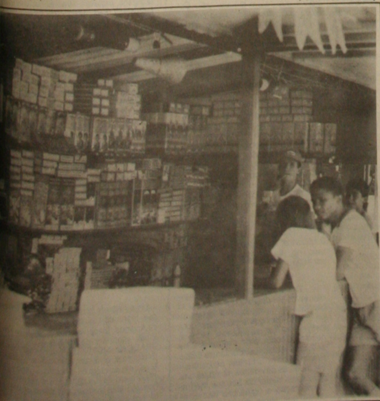
As vendas de fogos devem melhorar a partir dessa semana.