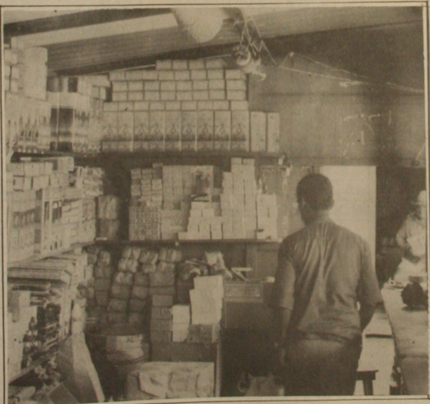
As barracas de jogos de artifícios já estão armadas, mas o movimento de vendas ainda é fraco.