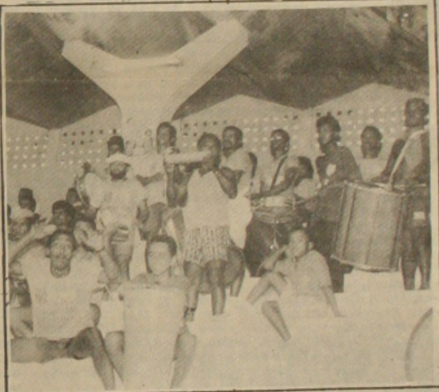
Torcida canaíinha promete prestigiar o Estanciano.