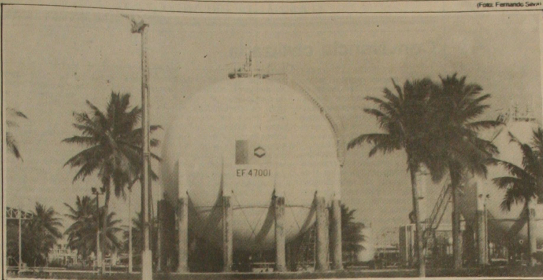
O Parque de Produção de Petróleo em Aracaju, está afastado do perigo de sofrer incêndio com possível queda de balões.