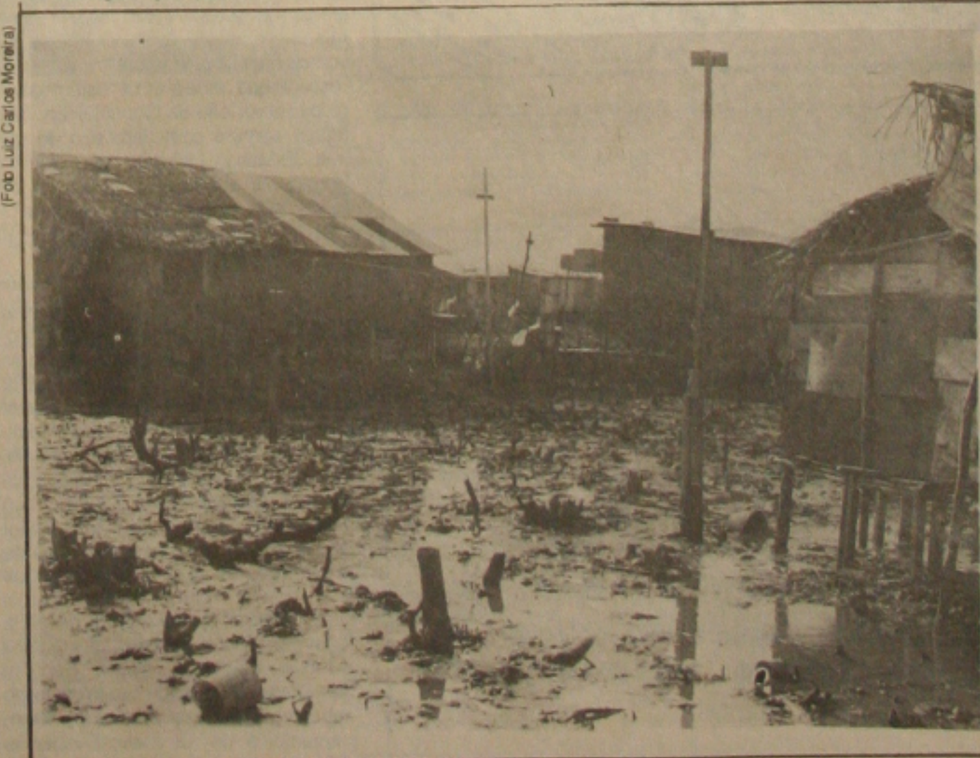
O manguezal continuará sendo devastado na área urbana de Aracaju por causa da expansão imobiliária.