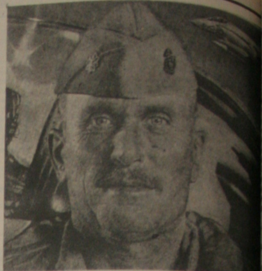
"O Grande Santini", de Lewis John Carlino