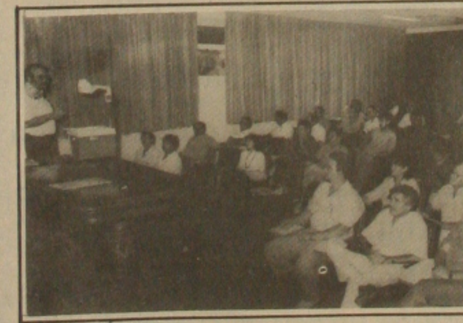
Seminário sobre Ovino Santa Inês, na Embrapa.