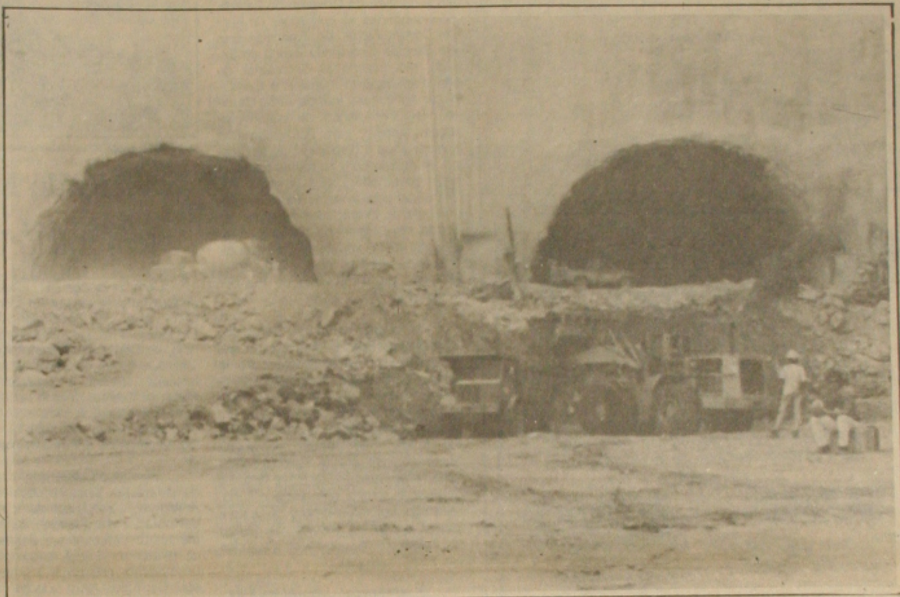
As obras de construção da Usina Hidrelétrica de Xingó estão adiantadas e na próxima semana ocorrerá o desvio do Rio São Francisco.

Para acionar o dispositivo de desvio do Rio São Francisco, na Hidrelétrica de Xingó, o presidente Fernando de Mello vem a Sergipe. As informações foram prestadas pelo chefe de Operação e Técnico da Obra, Franklin Alpagli, acrescentando que a obra marcante na construção da Hidrelétrica. Frankling disse que as obras estão em ritmo normal desde maio do ano passado, quando os trabalhos foram retomados. Os serviços preliminares para o desvio do rio foram concluídos. A água já está passando pelos túneis e as ensecadeiras estão em construção. Um relatório da presença do presidente da República deve ser detonado em uma cascata que protege os trabalhos quando a água deve correr em seu curso normal, à Juscelino Kubitschek. Desviado o rio que será o primeiro evento marcante da obra, se passará para a construção do trecho central da barragem, junto com toda a abertura e represamento da água e, consequentemente, a geração de energia. Com isto, cumpre-se o cronograma que está sendo seguido e a geração de energia dará em agosto de 1994, a sua primeira unidade geradora. Na sua primeira etapa, a Hidrelétrica de Xingó tem uma capacidade instalada de 3 milhões de KWH, com seis máquinas de 500 MHW cada uma.