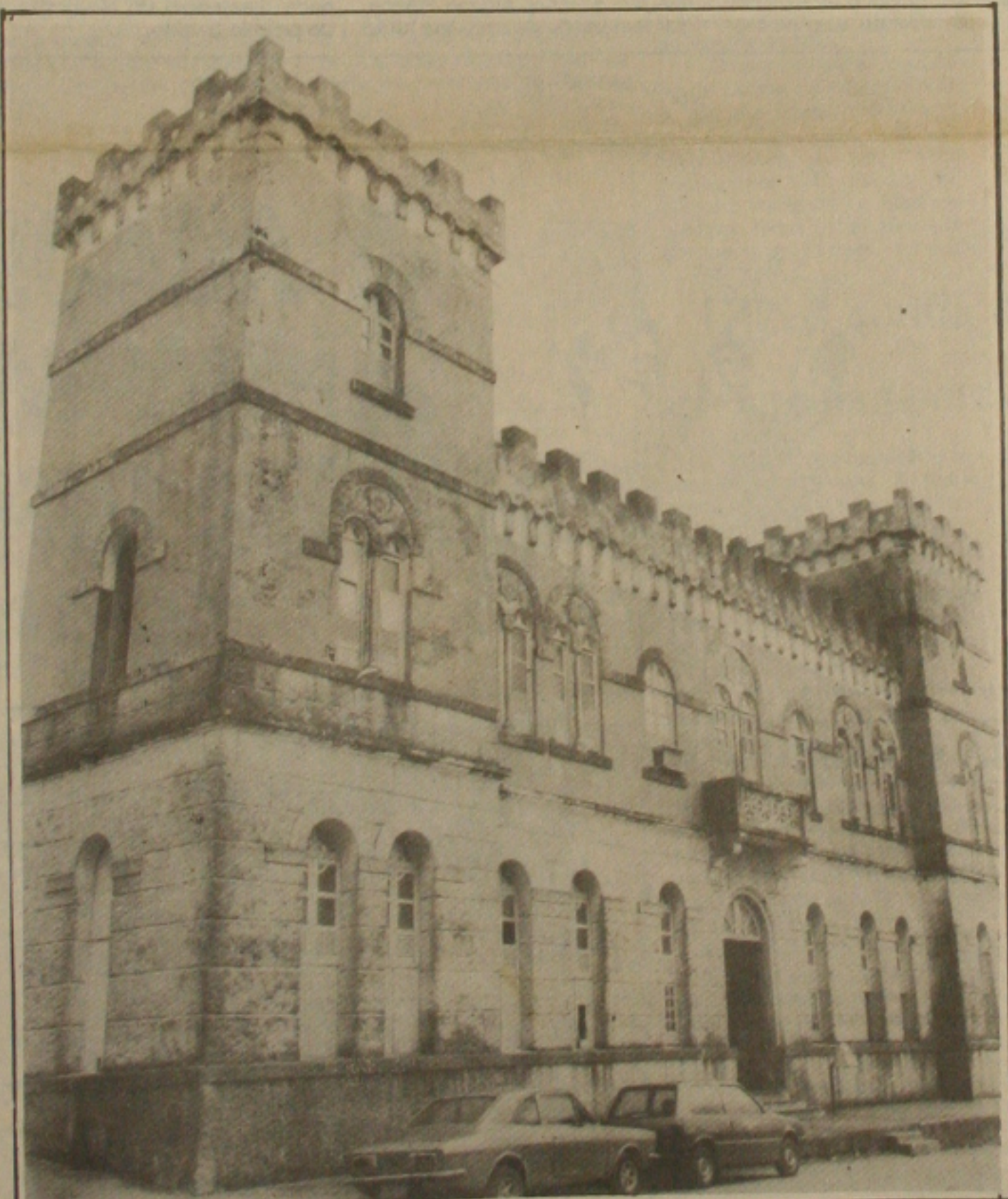
Os agentes penitenciários estão sendo detidos na Penitenciária por militares do presídio em Aracaju.

Documento encaminhado a redação da GAZETA DE SERGIPE, agentes penitenciários lotados no Comarcado Penal de Aracaju denunciam que estão sendo presos policiais militares, simplesmente porque não possuem nenhuma característica ou crachás que os identifiquem como agentes penitenciários e terem sido confundidos como detentos e sentenciados. Eles denunciam ainda que enquanto estão sendo presos esse tipo de constrangimento, os amigos do ex-secretário de Justiça, Jorge Fraga, desfilam, na frente de Lagarto com identidades de agentes penitenciários que foram devidamente distribuídas. (Pág. 1B).