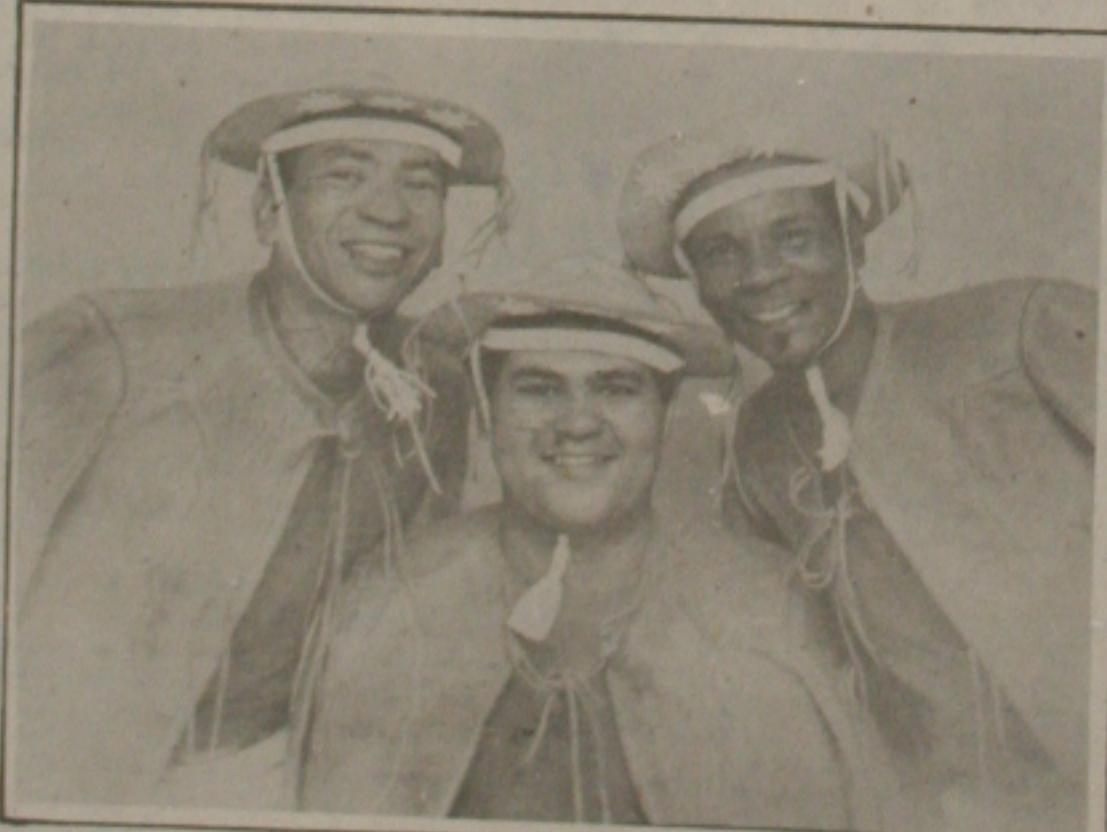
Este é o Trio Nordestino que está lançando o seu 28º Lp onde reúne vários sucessos do passado.