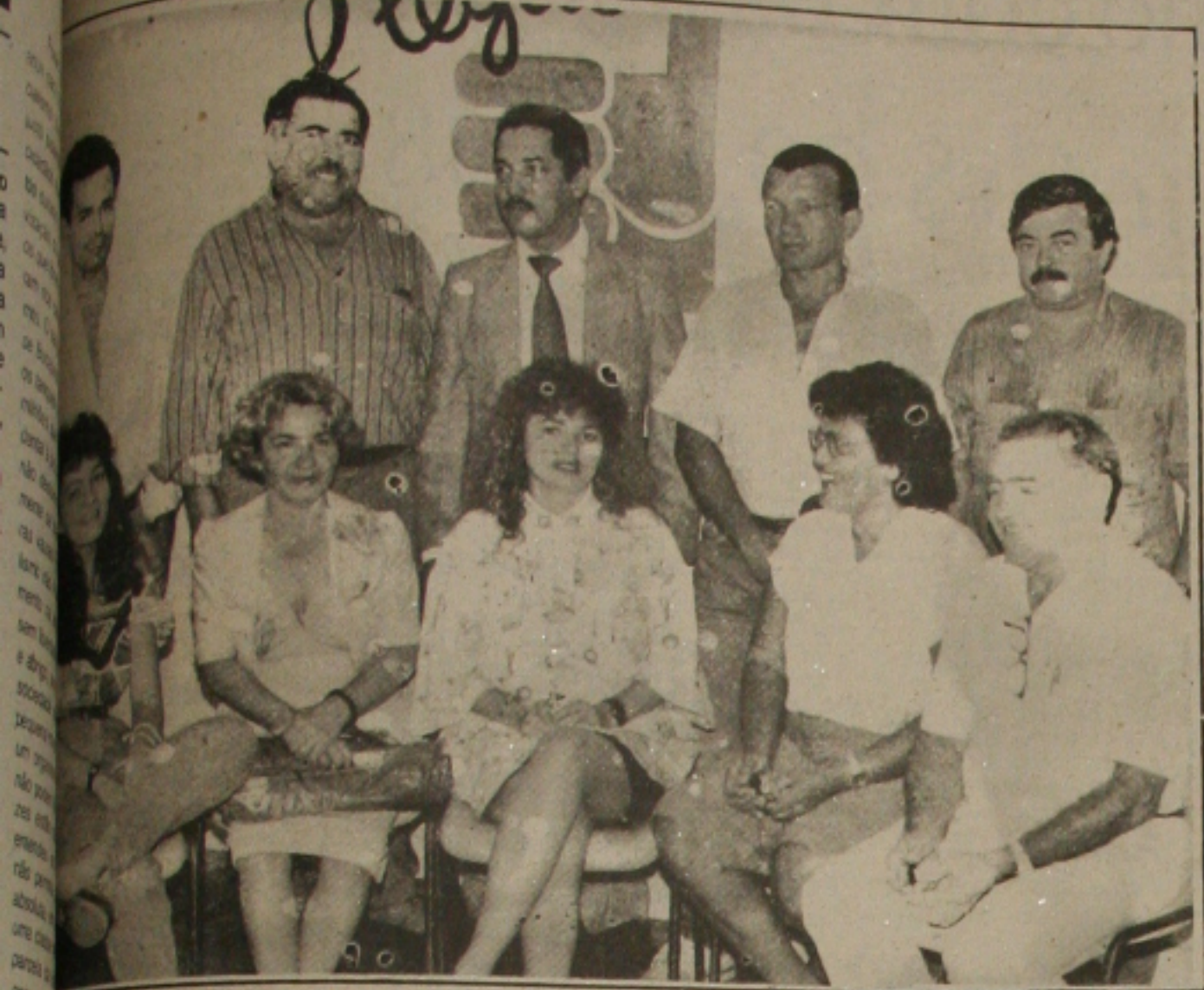
...delendem mudanças para tirar o País da crise.