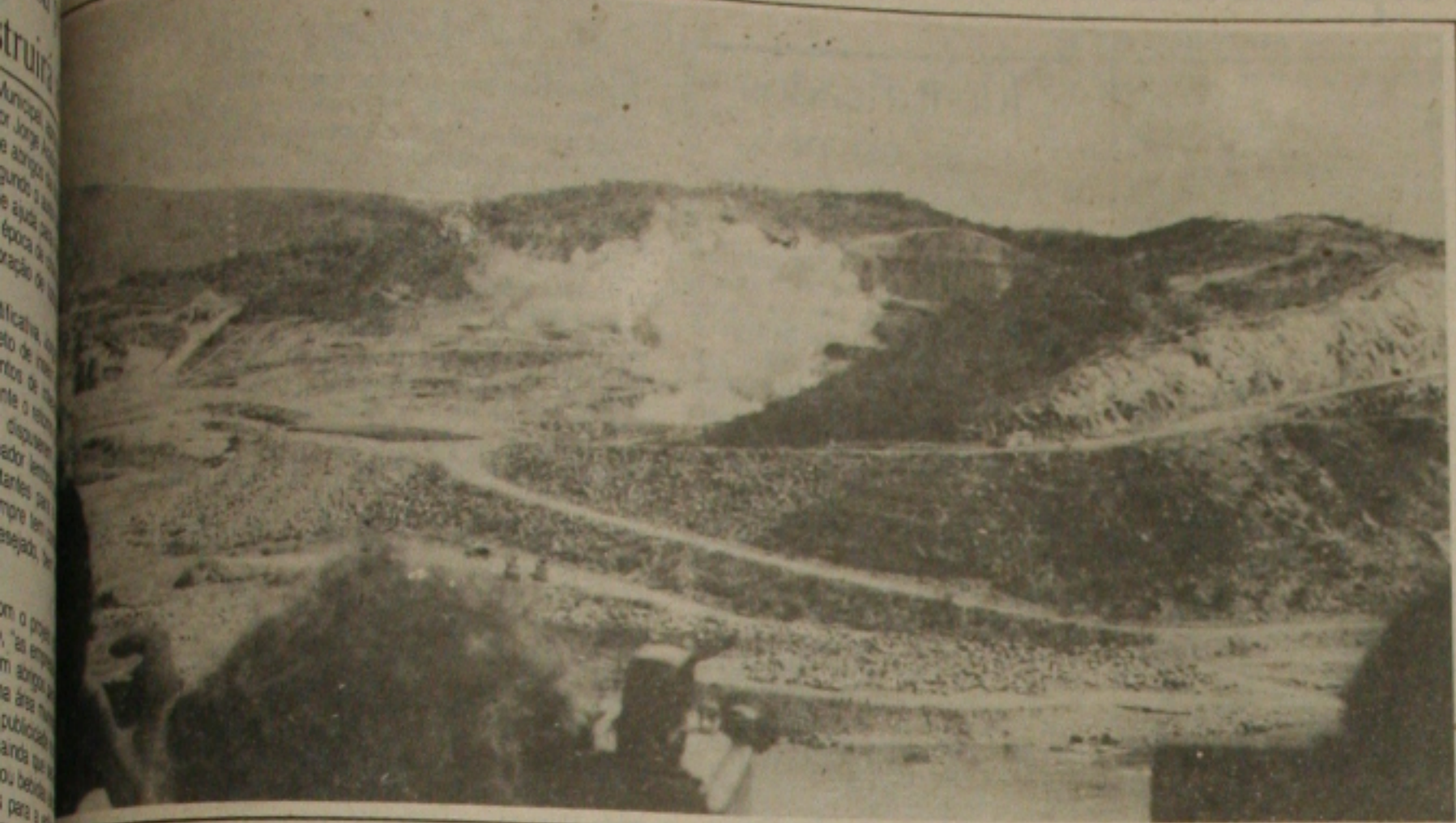
As ensecadeiras, como fez com as rochas em junho do ano passado.

Quando o presidente Fernando Collor de Mello acionar, amanhã, às 11:30 horas, um dispositivo colocado no Mirante II e detonar a ensecadeira construída na saída dos quatro túneis de desvio do Rio São Francisco, na divisa dos Estados de Sergipe e Alagoas, a Usina Hidrelétrica de Xingó se tornará irreversível, e não poderá mais sofrer qualquer alteração em seu cronograma.