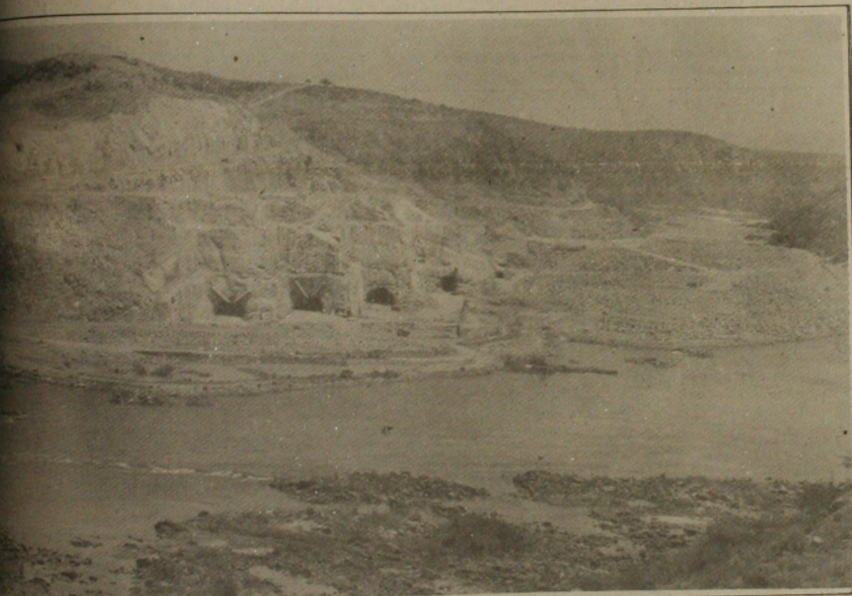
Para a barragem, a água do São Francisco vai correr a partir do desvio do leito, para formação da barragem.

Até esta segunda-feira, dia 16, os trabalhadores brasileiros deverão receber a diferença salarial estabelecida ontem por portaria do ministro da Economia, Marcílio Marques Moreira, que fixou em Cr$ 23.131,68, incluindo os abonos previstos pela Lei 8.178, o novo valor do salário mínimo nacional. Sendo assim, o trabalhador que recebeu em maio o salário de Cr$ 17 mil, deverá receber até o dia 15 domingo, sendo portanto transferido para segunda-feira, Cr$ 3.000,00 referente ao abono fixo e mais Cr$ 3.131,68 referente ao abono móvel cujo o valor fixado ontem pela portaria ministerial.