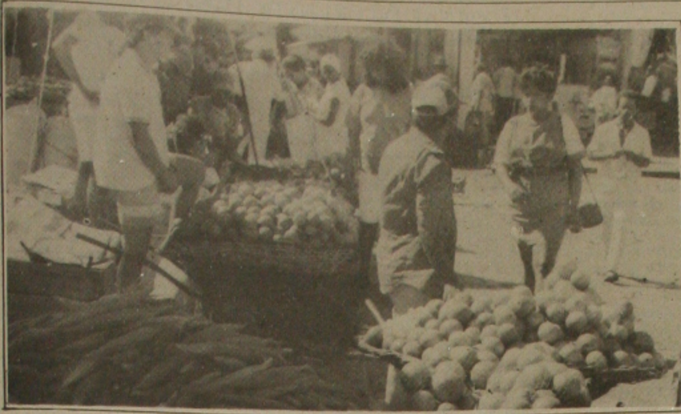
Os produtos típicos dos festejos juninos começam a ocupar espaços dos mercados e feiras livres.

Os produtos típicos dos festejos juninos começam a ocupar grandes espaços nos mercados municipais livres de Aracaju e a procura de clientes aumenta a cada semana que se aproxima do São João. Milho verde, amendoim, feijão, bife, símbolo do ciclo da colheita, podem ser encontrados em qualquer ponto da cidade. Em função dos problemas de safra causados pela seca que castigou o Nordeste até o início deste ano, o abastecimento interno está sendo abastecido por outros Estados, principalmente Pernambuco e Bahia. Os produtores não reclamam da situação, pois mesmo com os problemas de aquisição pela população, a produção é suficiente. (Página 18)