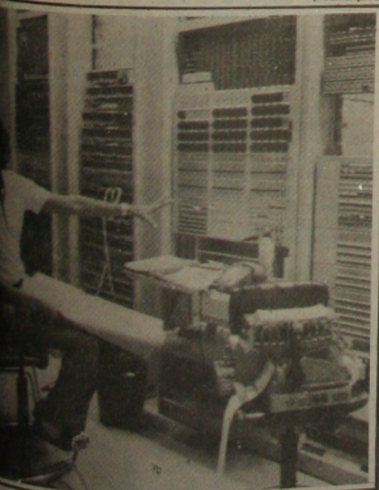
Uma central moderna como essa para servir melhor