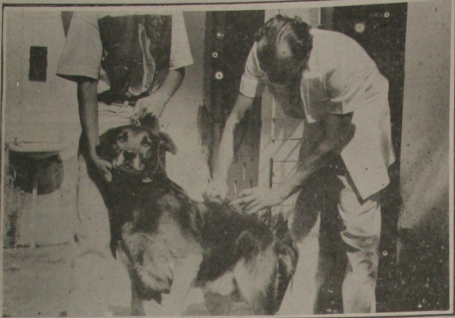
A Secretaria de Saúde encerra hoje, a campanha de vacinação anti-rábica em Aracaju.