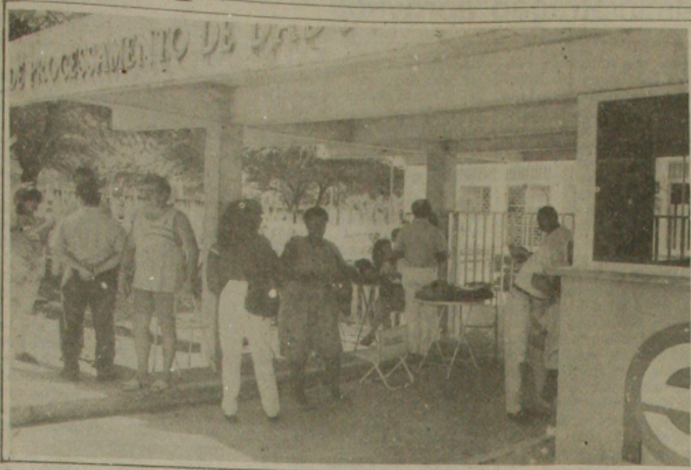
Os funcionários da Prodase continuam em greve e não acreditam em sua extinção.