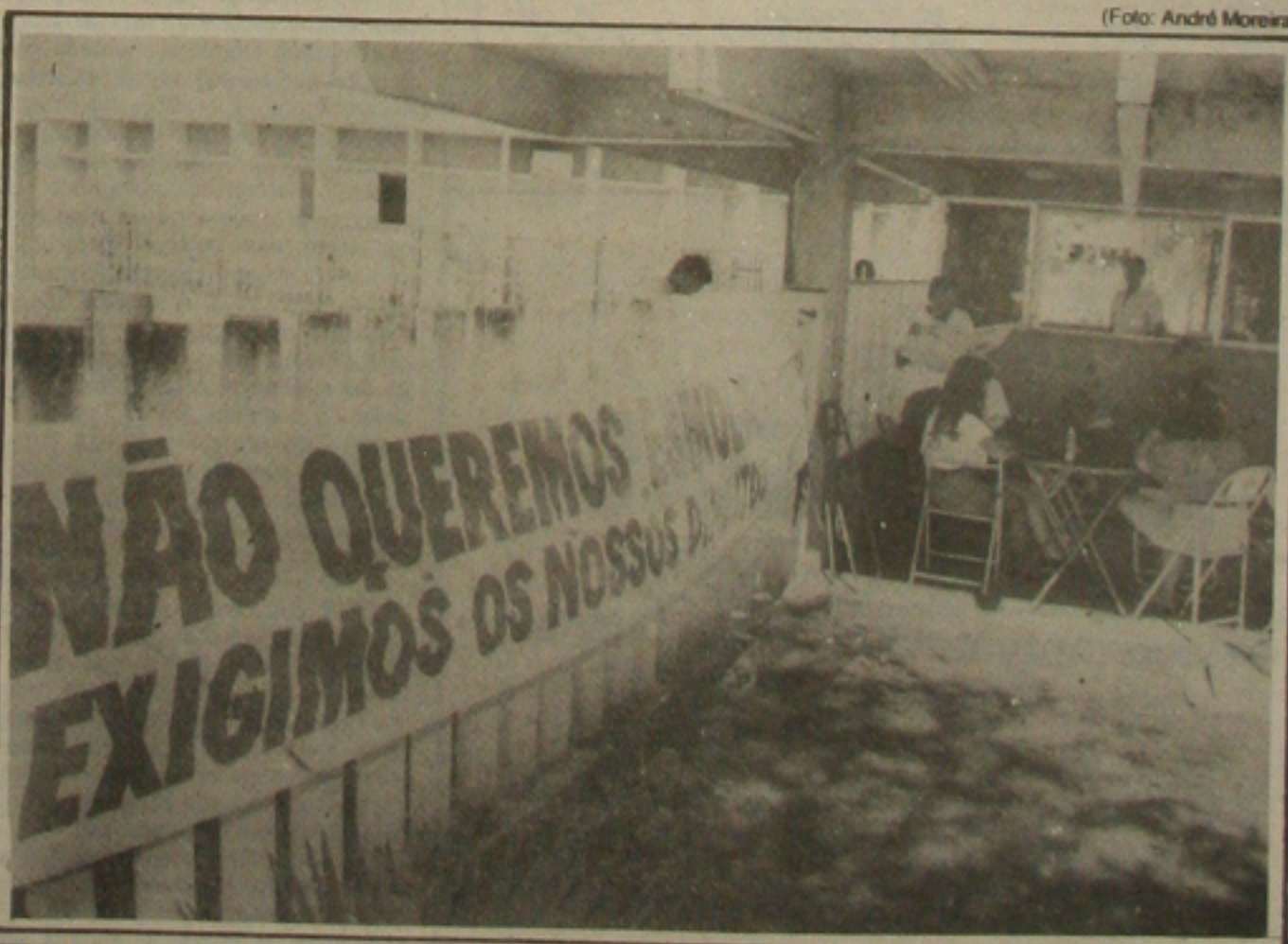
Os grevistas da Prodase não acreditam que o Governo do Estado concretize a promessa de privatizar a companhia.