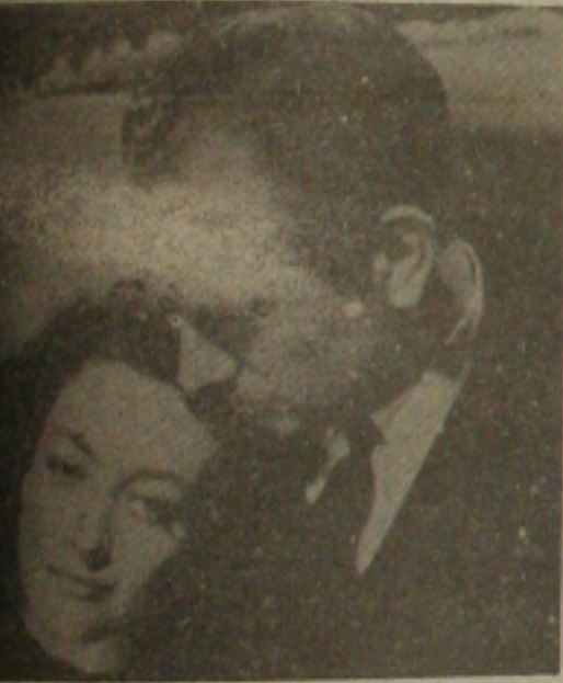
em Versão Original, mais um clássico do Um Rosto de Mulher, com Joan Crawford e Douglas.