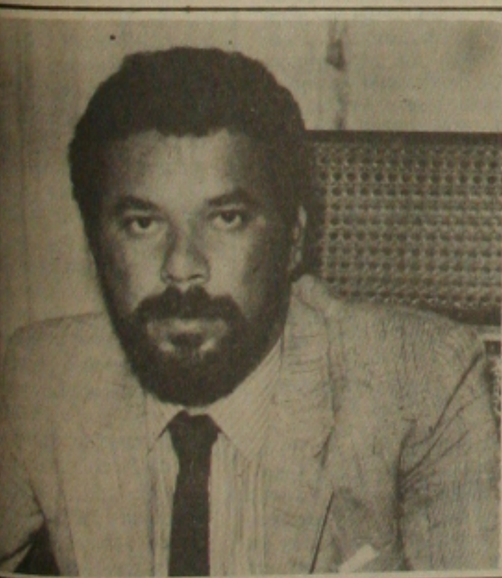
... que o PDT comandará a oposição em Sergipe.

Os do novo dirigente do Aracaju estão promovendo encontros com dirigentes sindicais, uma série de eventos, o partido esteja sempre pronto para defender as reivindicações com subsídios. Para melhor, irão visitar todos os diretórios, pois