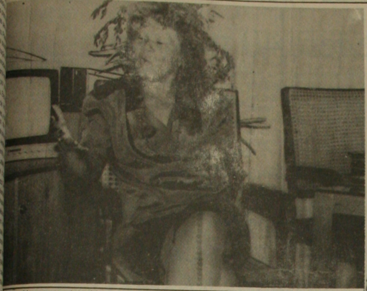
... problemas para manter arraial e garantir votos para 92.