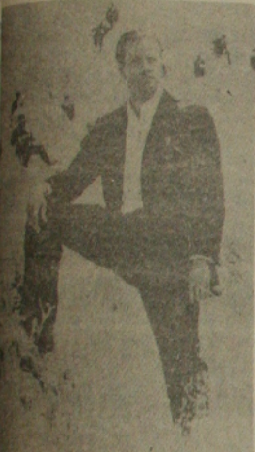
Christopher Lambert em 'O siciliano', na TV Globo

Vittore Giuliano (Lambert) é um jovem pobre que se torna fora-da-lei por acreditar que a única maneira de reparar as injustiças que cometidas contra o povo. Espécie de Robin Hood à moda fascista das décadas de 30 a 40, roubando para dar aos pobres, Giuliano torna-se alvo de uma caçada policial da história do país. Cor.