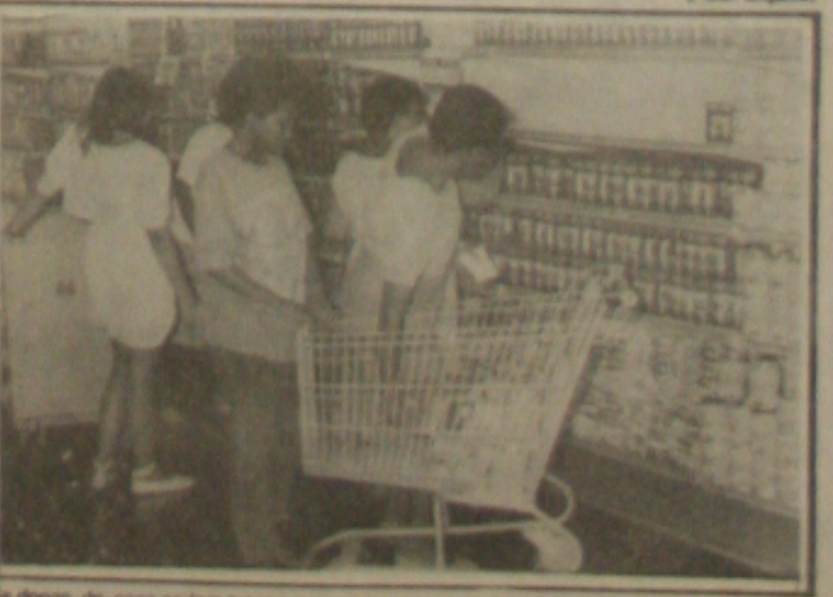
As donas-de-casa podem fazer suas compras na segunda-feira