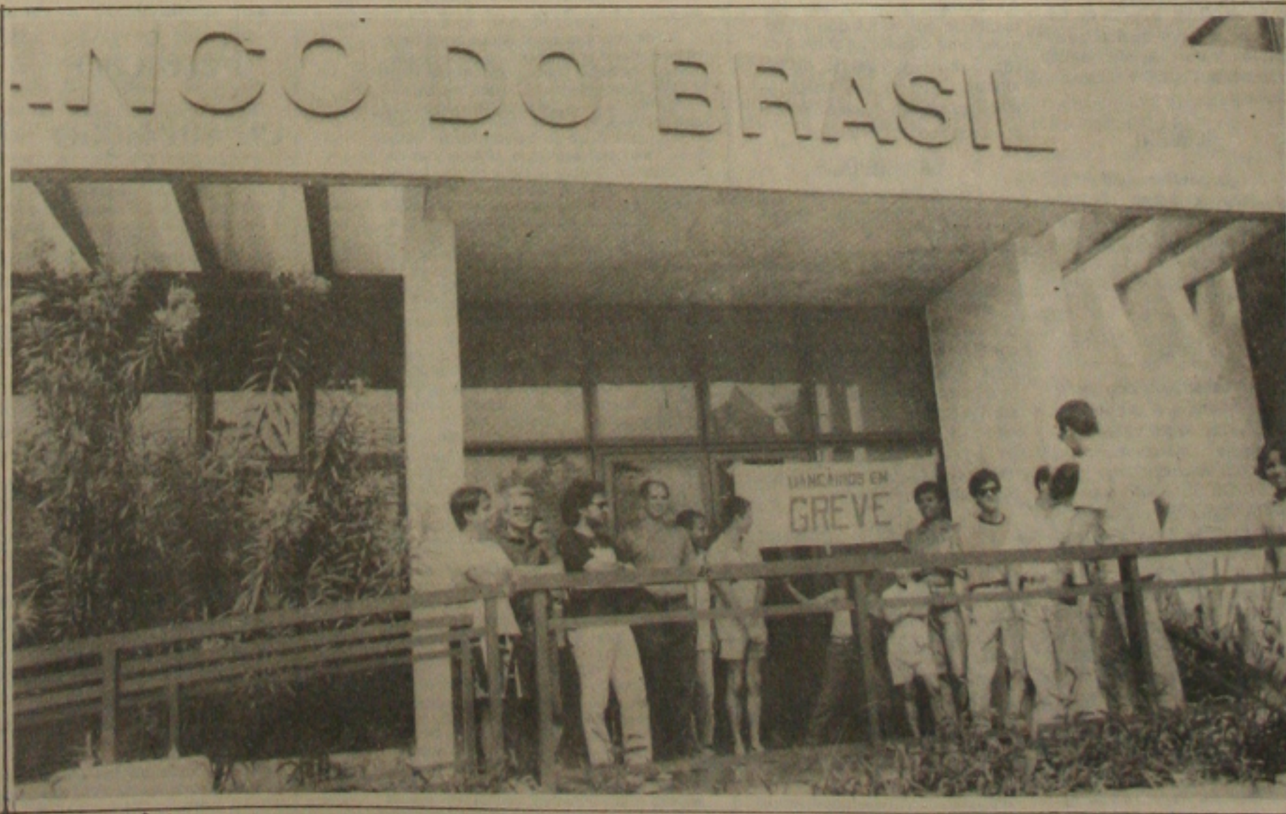
Funcionários do Banco do Brasil em greve, fazem movimento pacífico.