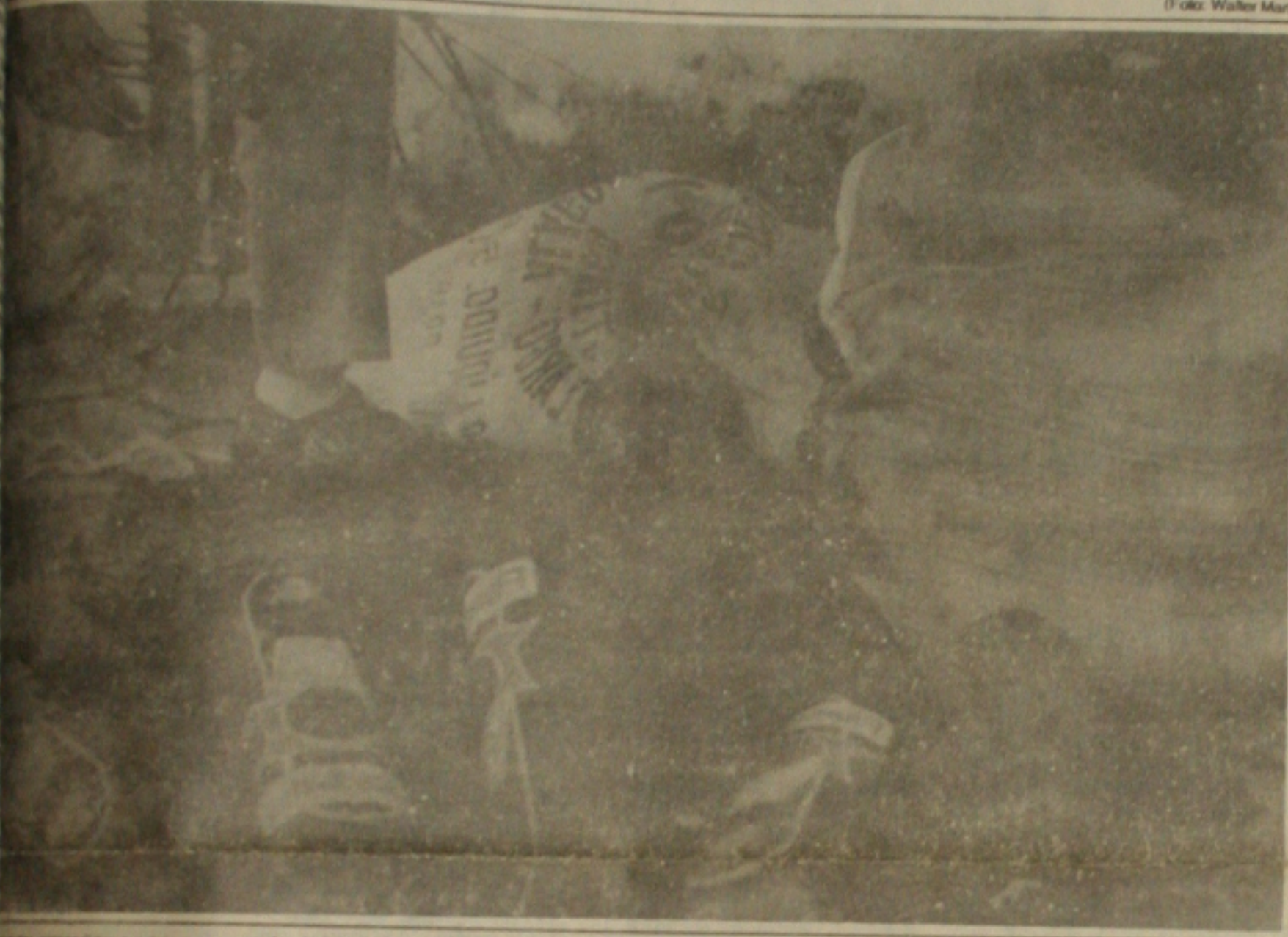
Alguns produtos apreendidos em dois supermercados de Aracaju foram inderados no Centro de Controle de Zoonoses, na Terra Dura

A AMB considera que o Ministério a desrespeitou e manipulou o valor do CH, ato que é de competência exclusiva da AMB, que é quem faz as tabelas de preços para todos os serviços médicos no País. Por este motivo a Associação vai realizar uma reunião para levar o caso à justiça.