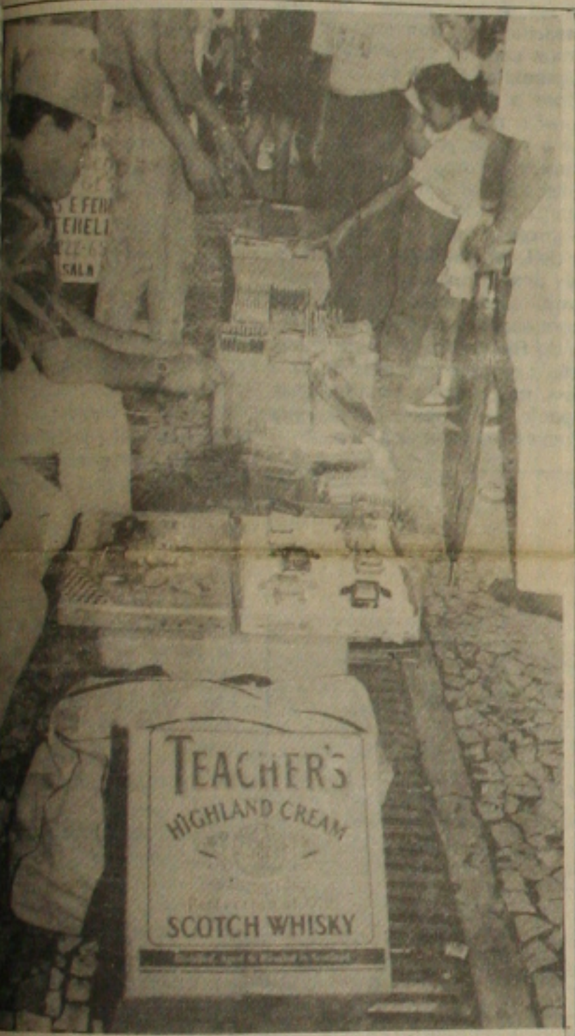
Apuração a venda de produtos importados lembra a Zona Franca de Manaus.