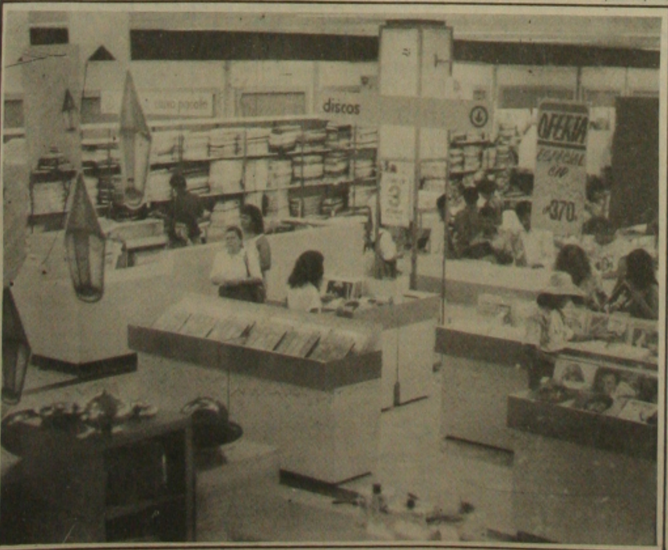
Mais uma vez, o comércio aracajuano funciona no próximo sábado, Dia de São Pedro