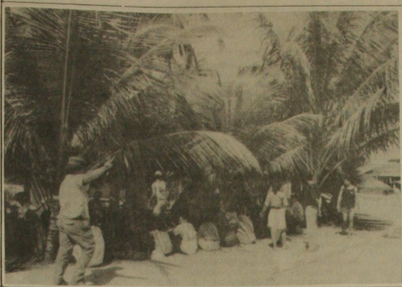
Os funcionários do Hotel Parque dos Coqueiros se concentram no pátio interno do hotel que funciona precariamente.