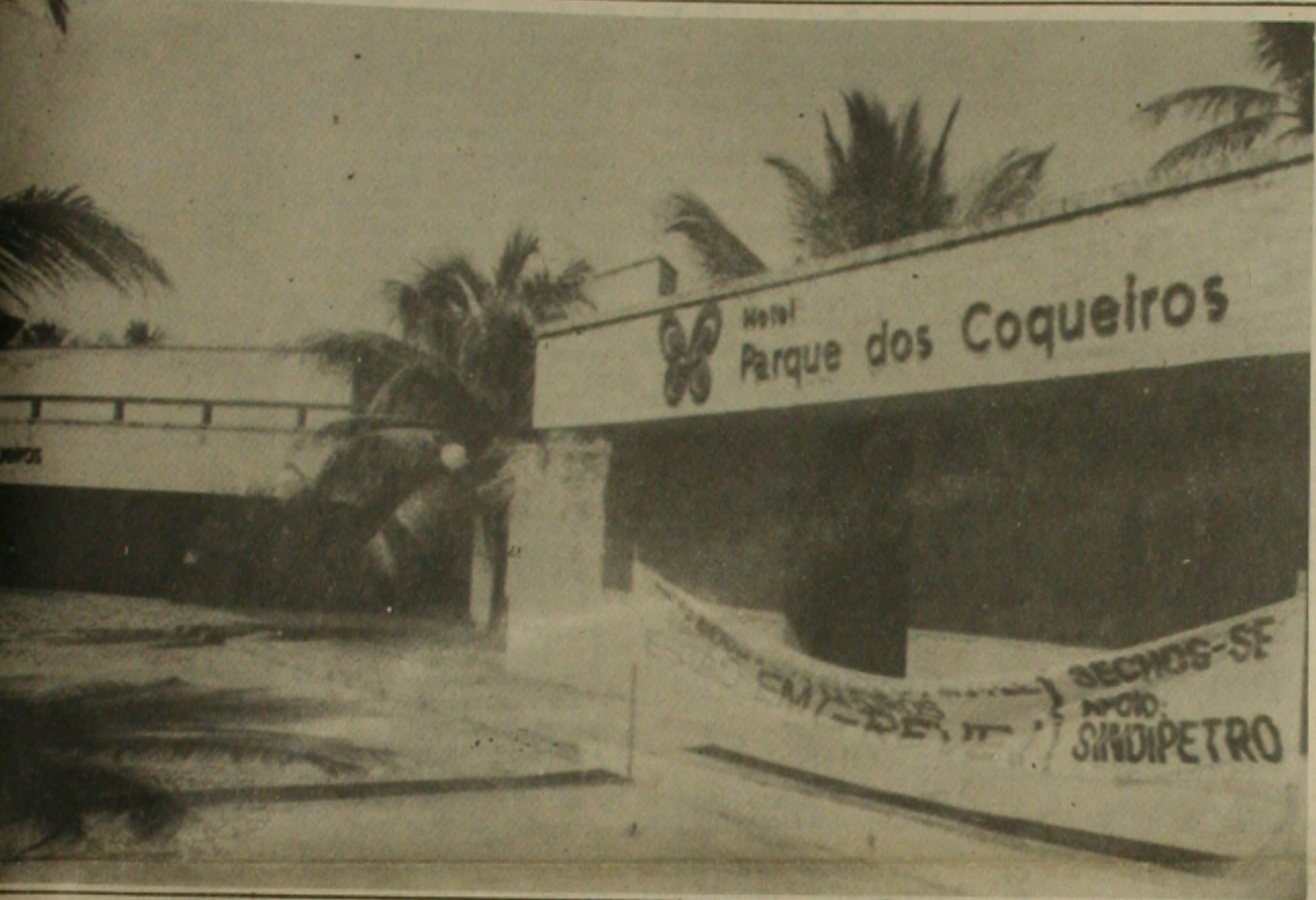
O hotel cinco estrelas de Sergipe, o Parque dos Coqueiros amanheceu ontem, com uma faixa na entrada principal anunciando a greve dos funcionários que reivindicam melhores salários e trabalho.

As atividades no Hotel Parque dos Coqueiros estão parcialmente paralisadas desde ontem em consequência da greve dos funcionários que lutam por melhorias de salário e de trabalho. Até mesmo a Consolidação das Leis do Trabalho é desrespeitada pela direção do hotel e a defasagem salarial, segundo avaliação do comando de greve, é de 213,39 por cento.