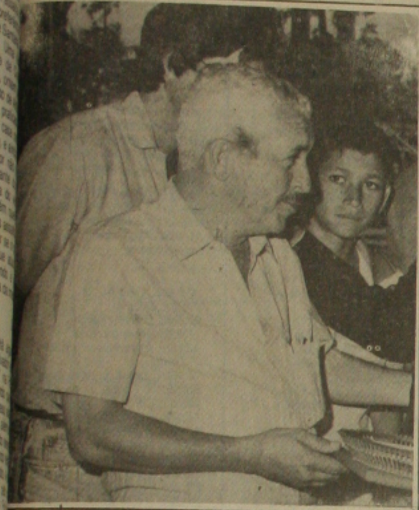
... está motivado nas contratações.

O técnico argentino considera o trabalho de renovação que comanda em sua equipe satisfatório. E não é para menos. Amanhã, quando estiver entrando no gramado do Pinheiro para enfrentar o Brasil, Basile estará defendendo uma invencibilidade de seis jogos a frente da Argentina. Até agora o time venceu a Hungria (1 a 0) e os Estados Unidos (1 a 0), e empatou com o México (0 a 0), Brasil (3 a 3), União Soviética (1 a 1), e Inglaterra (2 a 2).