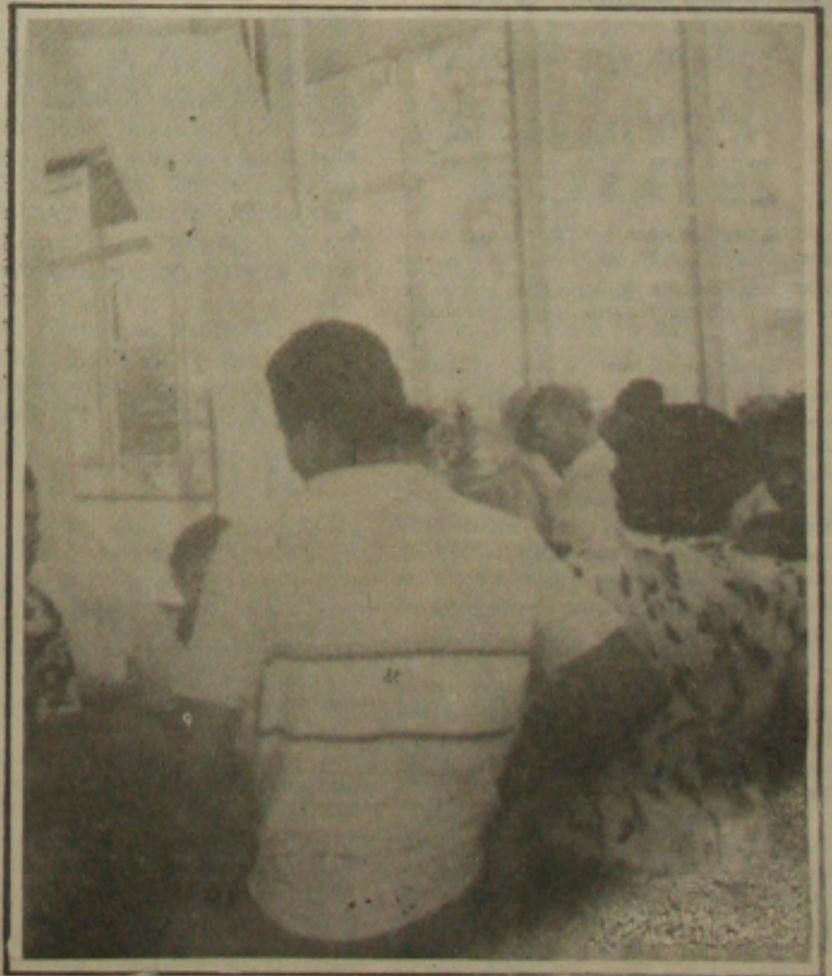
Os previdenciários protestam contra a política salarial do Governo