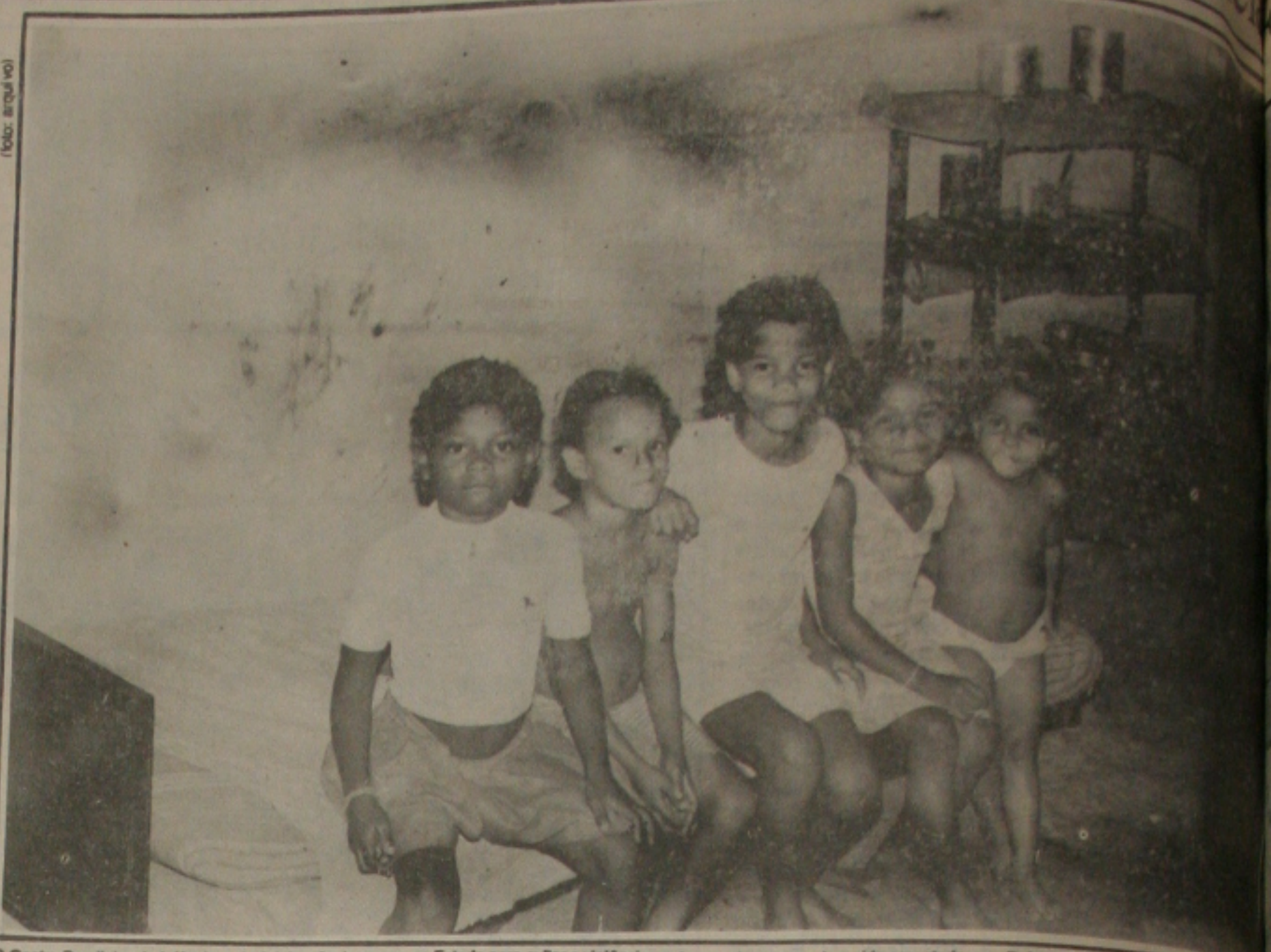
O Centro Brasileiro da Infância e da Adolescência se une ao Estado para evitar a violência contra as crianças que tem sido assustadora no País.

A Superintendência do CBIA já está de posse dos exemplares do Plano Nacional de Combate à Violência, que serão distribuídos nas reuniões. O Plano servirá de base para as discussões.