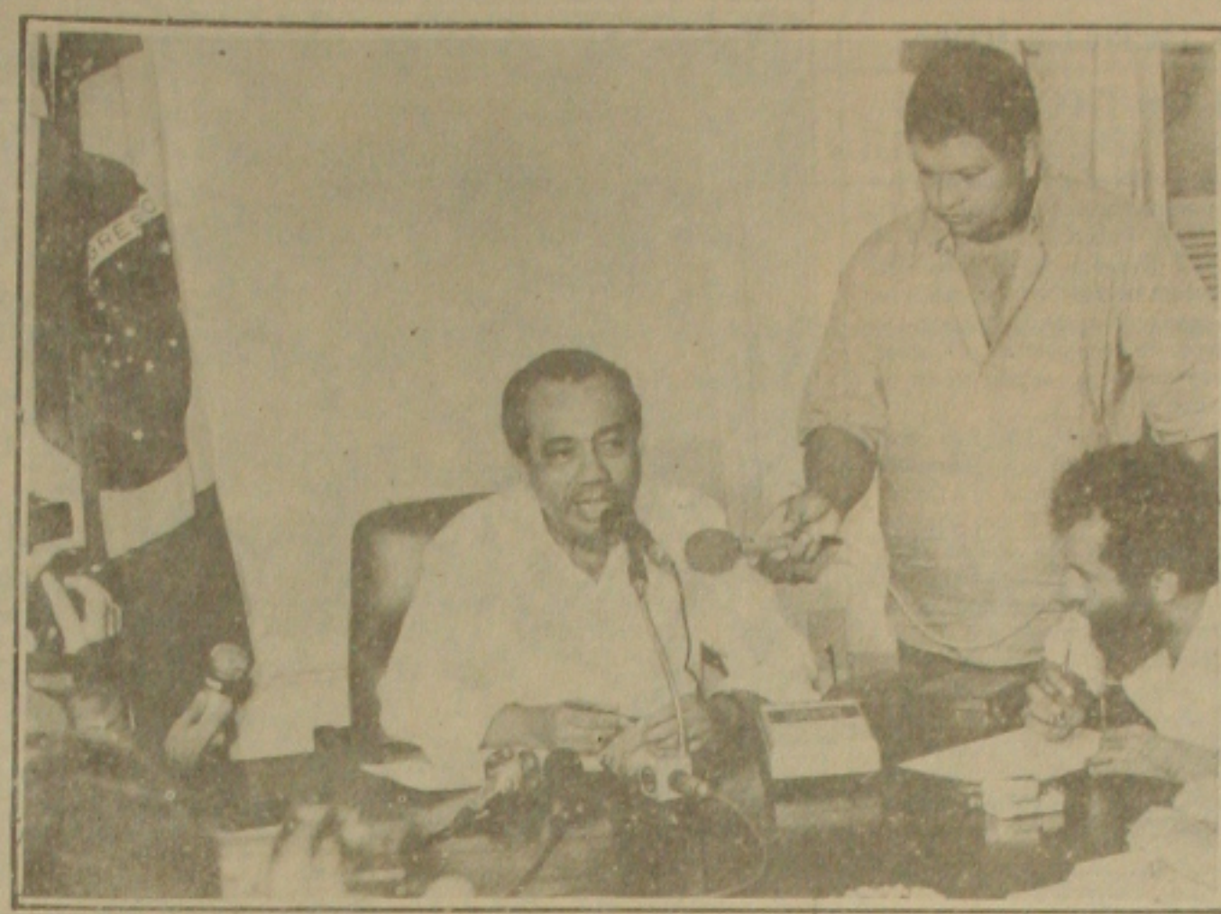
As dificuldades financeiras do Estado impedem o governador (ao centro) conceder ou até pensar em um novo aumento para o funcionalismo público.

Temos uma preocupação, salientou o governador, com as dificuldades gigantescas, inclusive com carências sociais enormes, pois temos os problemas dos favelados de Ara-