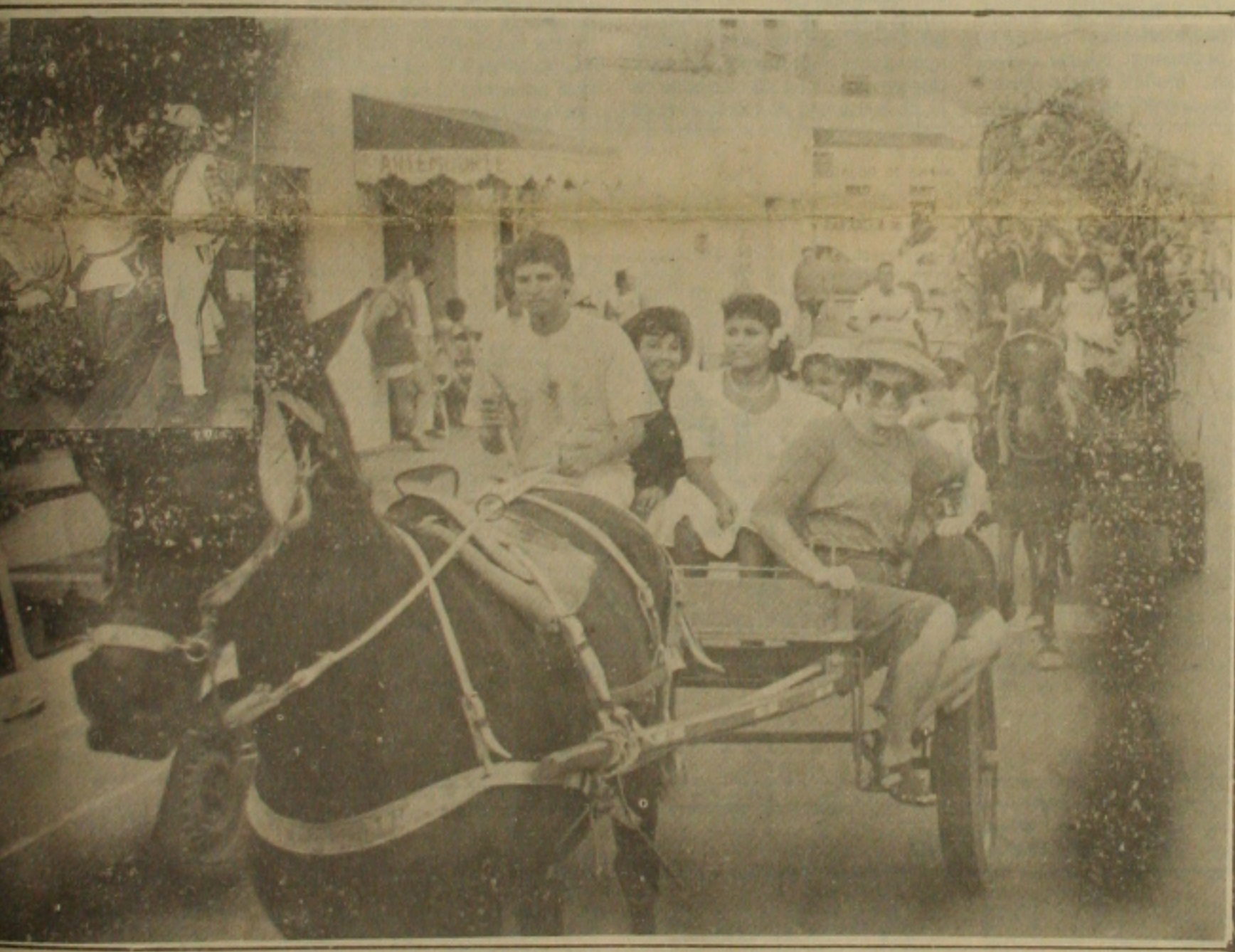
A realização ontem em quase todos arraiais espalhados pela capital e no interior do Estado, do casamento caipira, uma das principais atrações dos eventos dos festejos juninos, praticamente marcou o encerramento do ciclo festivo do Nordeste iniciado desde o dia primeiro de junho. Em Aracaju o mais tradicional casamento matuto aconteceu no arraial instalado na Rua São João, que por muitos anos foi o principal foco da cidade onde se concentram os festejos juninos. Com seu cortejo por carroças tipicamente ornamentadas, conduzindo os noivos, o padre, os amigos e familiares do casal, teve como ponto de partida a Rua São João e percorreu as principais ruas do Bairro Santo Antônio e algumas artérias do centro da cidade, retornando para o arraial da Rua São João, onde a cerimônia de casamento foi celebrada e depois foi só forró em comemoração ao matrimônio.