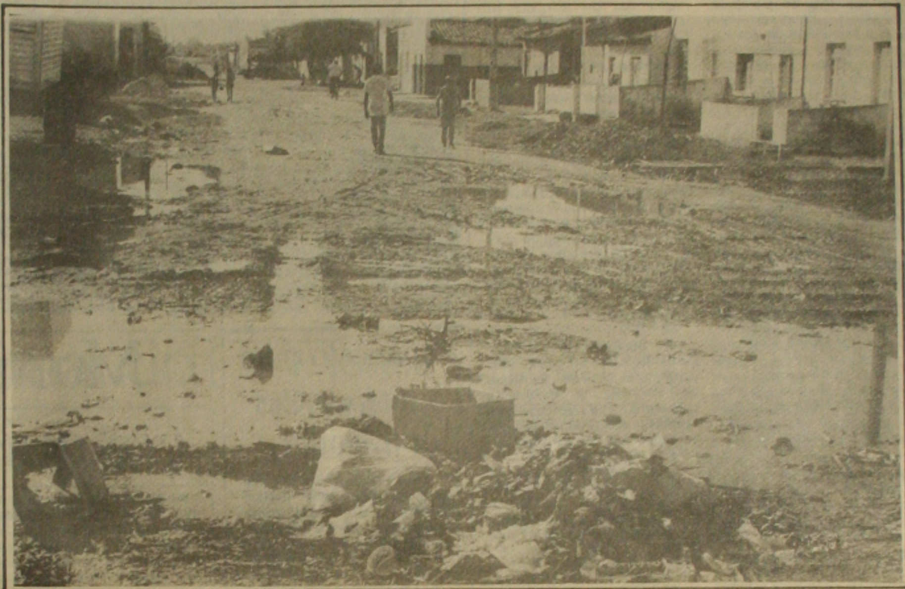
Ruas alagadas e o acúmulo de lixo contribuem para o surgimento de ratos e conseqüentemente transmitem a doença para o homem

Este ano já foram registrados casos na Coroa do Meio, Invasão São Carlos, no Município de Nossa Senhora do Socorro, Bairro América, José Conrado Araújo, no Santos Dumont, Novo Paraíso, na Barra dos Coqueiros, no Siqueira Campos, no Japãozinho, em Laranjeiras, no São Conrado, Malhador, no Getúlio Vargas, 18 do Forte, Veneza, Terra Dura, Nova Veneza, Soledade e Lamarão. Destes o campeão de casos é o Bairro Japãozinho onde somente este ano foram registrados cinco casos.